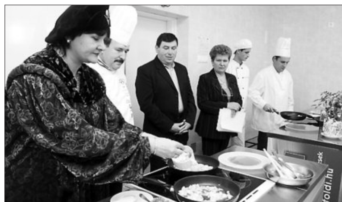
Látványkonyhát adtak át a Zwack-tagiskolában