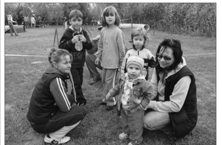
Nyugdíjas- és családi napot tartottak a Csaba-tónál