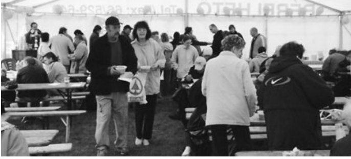
Sokan érdeklődtek a „Lencsenap” programjairól

Békéscsaba Megyei Jogú Város Polgármesteri Hivatala a köztisztviselők jogállásáról szóló 1992. évi XXIII. törvény 10. § (1) bekezdése alapján