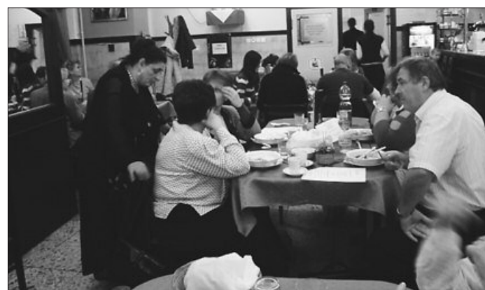
Cigány gasztronómiai nap volt a FEK-ben

Csabai Mérleg ingyenes városi lap, Békéscsaba. Felelős szerkesztő: Fehér József. Nyomdai előkészítés: Várhegyiné Szántó Anikó, Várhegyi János. Felelős kiadó: Békéscsaba Vagyonkezelő Zrt., Kozma János cégvezető. Szerkesztőség: 5600 Békéscsaba, Szabadság tér 11-17. l/28. Telefon: 66/523-855. Megjelenik kéthetente 28 000 példányban. E-mail: csabai.merleg@bekescsaba.hu. Hirdetésszervezés: Bayer Bt. Terjesztésért felel: Bartók István, telefon: 70/317-8206.