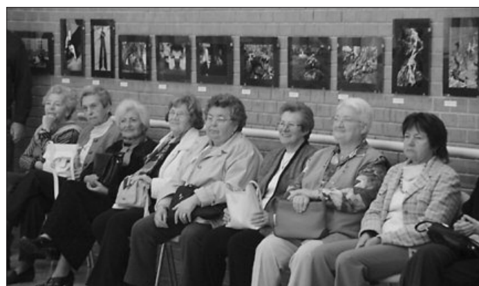
Az Aradi Fotóklub alkotásaiból összeállított kiállítást tekinthetünk meg a Lencsési Községi Házban

A Belvárosi Iskoláért Alapítvány kuratóriuma