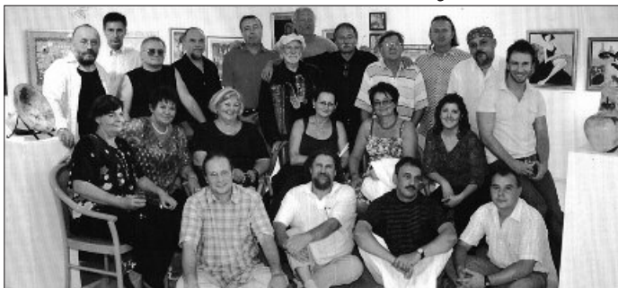
A Csuta művésztársaság a Jankayban tartotta zárókiállítását