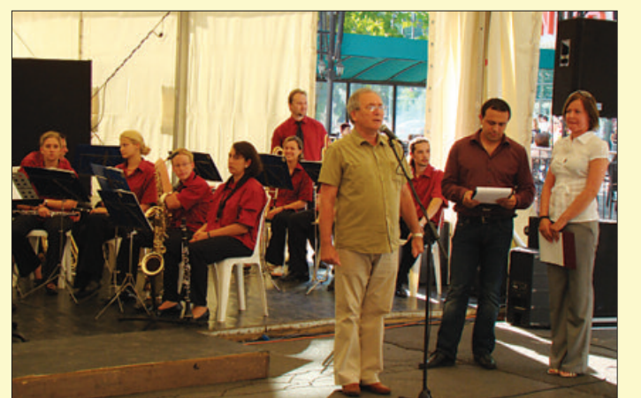
A NEMZETKÖZI FÜVŐSZENKARI TALÁLKOZÓRÓL SZÓLÓ CIKKÜNKET A 3. OLDALON OLVASHATJÁK