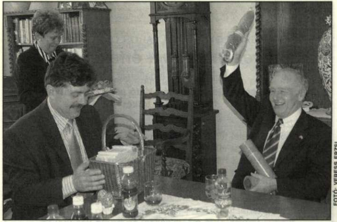
Csabai kolbászt kapott az amerikai nagykövet