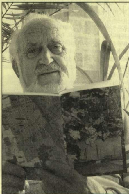
A szerző és a könyve

„Egy öreg jaminainak” nevezi magát a könyv előszavában, aki azzal kezdte a „regényírást”, hogy 79 éves korában számítógépet kapott a fiától, megtanulta kezelni, írogatott vele ezt-azt, elszórakoztatta a modern masina. Közben a kertbarátok egyesületében többször elbeszélgettek Jamina régmúltjáról, az ősookról, akik az 1800-as évek elején „szülőfalut” csináltak Jaminából, innen a „vinice” elnevezés, ami még most is elő-előjön. Egyszer aztán azt mondta neki valaki: „Miért nem