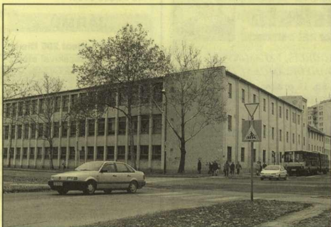
A Kötöttáru-gyár épületében évek óta csend honol

A sokszorososan kitüntetett gyárnak a nyolcvanas évek vége felé nehézségei jelentkeztek, a megrendelések csökkentek. A kötöttáru-gyár 1992-ben megszűnt, az üzem a privatizáció révén magánkézbe került. A BCB Egyesült Textilipari Rt. 600, majd 400 főt foglalkoztató cége nem tudott túljutni a nehézségeken, közel egymilliárd forintos tartozást halmozott fel. A cég ellen 2000. október 12-én felszámolási eljárás indult, alkalmazottai botrányos körülmények között az utcára kerültek. Csaba jó hírű, jelentős textiliparának majd százéves története dicstelen véget ért.