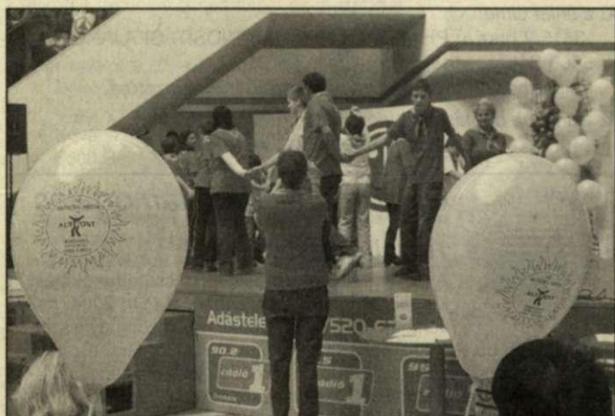
A Csaba Centerben október 29-én tartották az autizmus napját