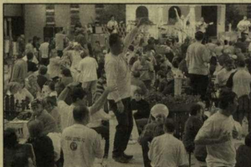
Vasárnap délutáni „csendélet”