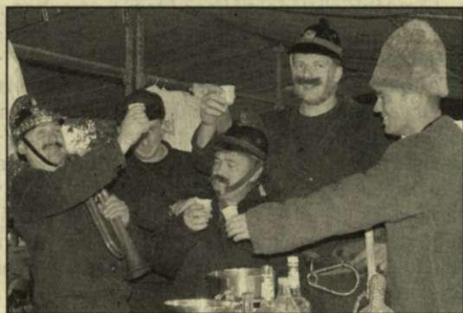
Szomjoltás a tűzoltás után