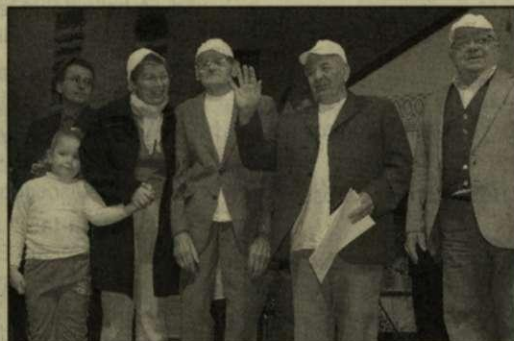
Az Életfa nyugdíjasház győztes csapata