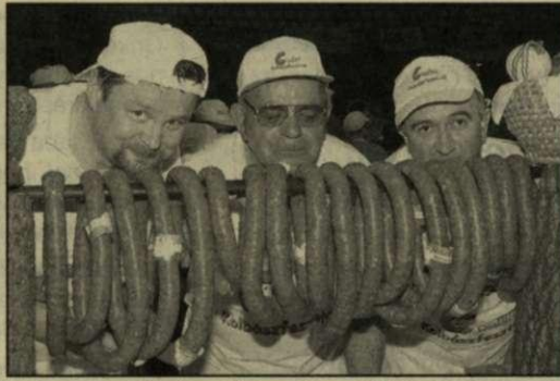
Isteni a színe, az íze, az illata...