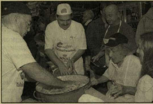
Faludy szerint itt öröm árad az emberekből