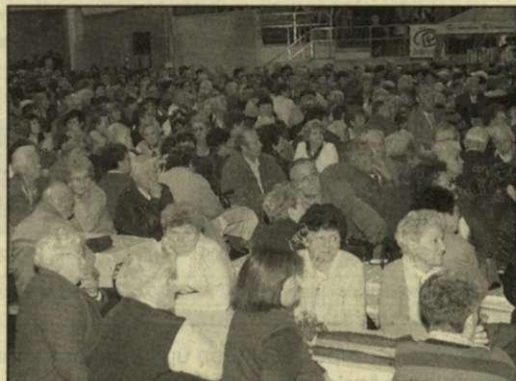
Idősek világnapja a sportcsarnokban