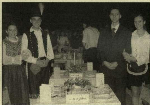
A múlt és a jelen a terítési versenyen