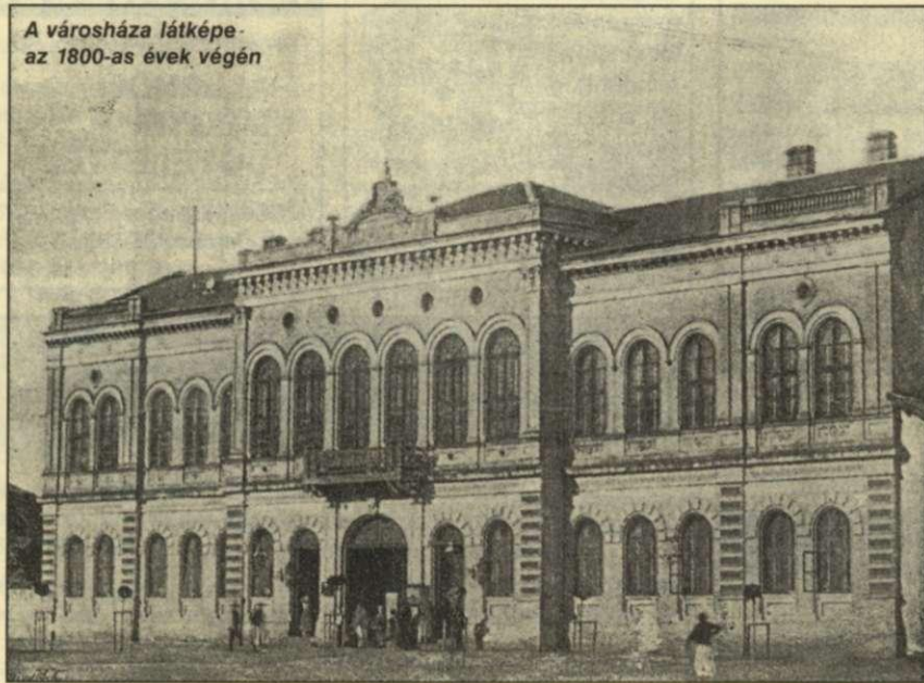
A városháza látképe az 1800-as évek végén

Az akkori időkben majdnem csak gazdákból állott a képviselő-testület. Közgyűlés előtt rendszeresen a