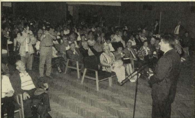
Pap János polgármester köszönti a szolnokiakat