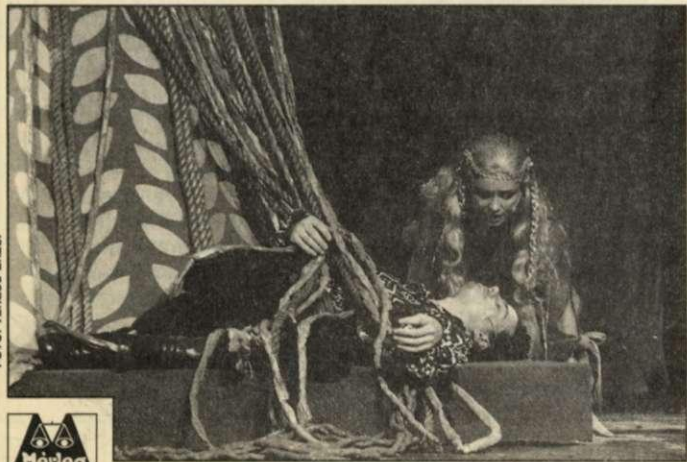
A varázsfá alatt Csongor és Tünde