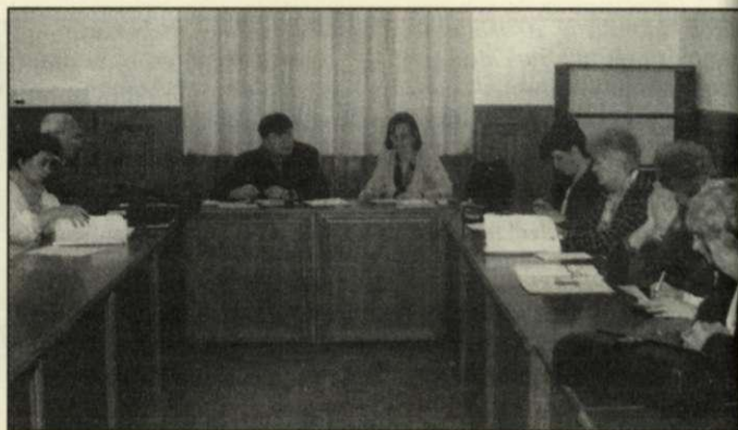
Zasadnutie békéšcabianskej slovenskej menšinovej samosprávy

Po úvodných slovách predsedu začala sa práca podľa schválených rokovacích bodov. Azda najdôležitejším bodom rokovania bolo prevzatie Slovenského oblastného domu. Slovenská menšinová samospráva od 1. januára 2001 prevzala od zastupiteľského zboru Békéšskej župy do svojho vlastníctva dom, ktorý má plniť v prvom rade muzeálne úlohy. Poslanci schválili stanovy inštitúcie a jej nový názov Čbiansky slovenský oblastný dom – Békéscsaba Szlovák Tájház. Rozhodli o otváracíj dobe, cene vstupného a zostavili zoznam publikácií, ktoré budú predávať v oblastnom dome. V pláne samosprávy je aj návrh o rekonštrukcii tejto kultúrnej pamiatky. Emblém oblastného domu projektoval gra-