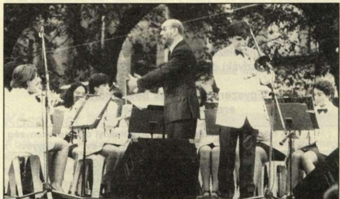
A Zenit gálája

át. A versenyen harmadik helyezést ért el a Verbandsjugendblasorchester des Blasmusikverbandes Schwarzwald-Baar (Németország), második lett a Kiskunfélegyházi Koncert-fúvószenekar, az első helyet pedig a Körös-parti Junior Fúvósok szerezték meg. A Zeniten belül zajlott labdarúgókupán az olaszok lettek a legjobbak, a második a Körös-parti Junior Fúvósok, a harmadik a szervezők csapata lett. (M. E.)