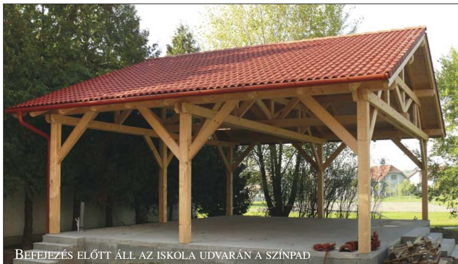
BEFEJEZÉS ELŐTT ÁLL AZ ISKOLA UDVARÁN A SZÍNPAD

A már említett cégek Sós-kútra településével várhatóan új munkahelyek jöhetnek létre, tehát néhány hónapon belül itt helyben nem a munkanélküliséggel, hanem a szükséges munkaerő biztosításával adódhatnak gondjaink. Az is lehet, hogy éppen a jelenlegi újság hasábjain kell a cégeknek állás-hirdetést közreadniuk. Aki tehát helyben szeretne dolgozni, az nagy valószínűséggel megtalálja majd a munkahelyét az ipari parkban. Mások viszont, azt fogják észre venni, hogy a fejlesztések miatt gyakoribbá válik az autóbussz közlekedés. A cégeknek ugyanis a megnövekedett munkaerőt valahogy ide kell szállítani, azonban a gyakoribb