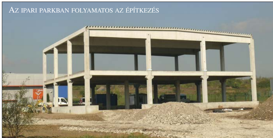
AZ IPARI PARKBAN FOLYAMATOS AZ ÉPÍTKEZÉS

– Az ipari park fejlesztését, a település fejlődését az itt élők a munkahelyek bővülése mellett a mindennapokban is tapasztalni akarják. Az önkormányzatnak milyen tervei vannak a település megújulására?