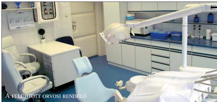
A FELÚJÍTOTT ORVOSI RENDELŐ