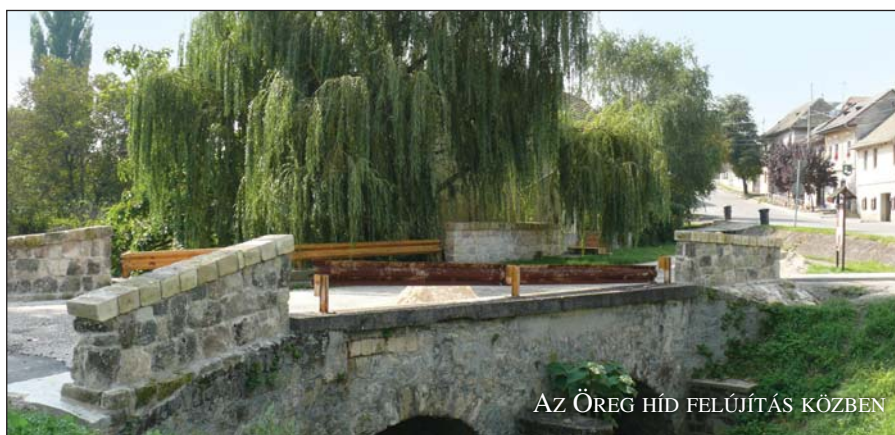
AZ ÖREG HÍD FELÚJÍTÁS KÖZBEN