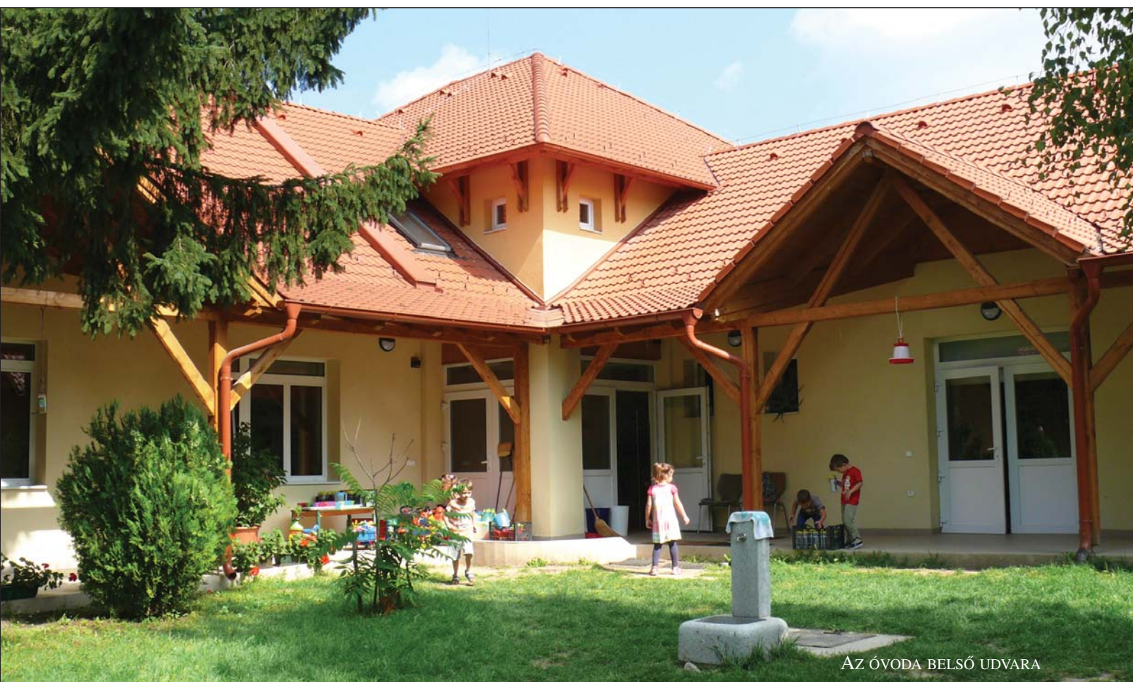
AZ ÓVODA BELSŐ UDVARA

A támogatási adatoknál is olvasható, Sóskút 83 százalékos intenzitás finanszírozásra jogosult (ezt próbáljuk még a következő hetekben a kivitelezői szerződés aláírása után növelni, előbb nem lehetséges!), ennek megfelelően a hiányzó 17 százalékban az önrészt – melynek összege 85-90 millió forint – elő kell teremteni. Ennek több forrása lehet: hitel felvétele (engedélyeztetni kell), lakossági befizetés, vagy az önkormányzat a település költségvetéséből fizeti be. Képviselőtestületünk bízva a többlet-támogatás megszerzésében úgy döntött, hogy nem a lakosságtól kéri ezt az összeget, hanem azt a bizonyos „szíjat” össze-