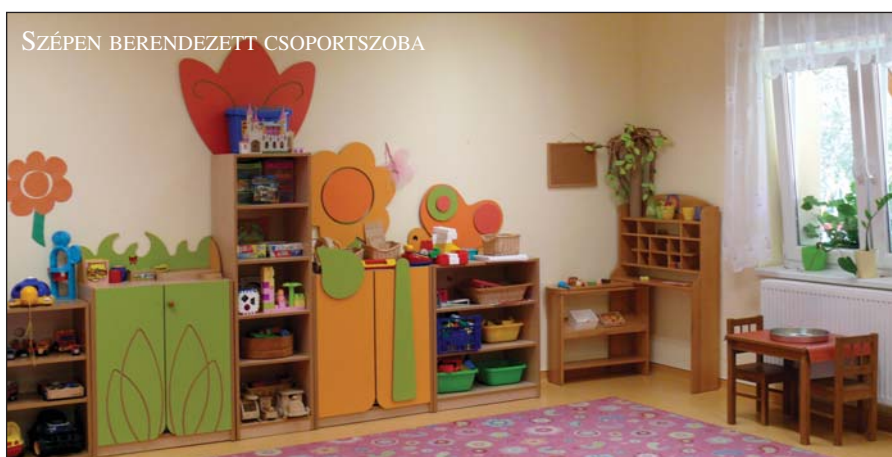
SZÉPEN BERENDEZETT CSOPORTSZOBA

A támogatási adatoknál is olvasható, Sóskút 83 százalékos intenzitás finanszírozásra jogosult (ezt próbáljuk még a következő hetekben a kivitelezői szerződés aláírása után növelni, előbb nem lehetséges!), ennek megfelelően a hiányzó 17 százalékban az önrészt – melynek összege 85-90 millió forint – elő kell teremteni. Ennek több forrása lehet: hitel felvétele (engedélyeztetni kell), lakossági befizetés, vagy az önkormányzat a település költségvetéséből fizeti be. Képviselőtestületünk bízva a többlet-támogatás megszerzésében úgy döntött, hogy nem a lakosságtól kéri ezt az összeget, hanem azt a bizonyos „szíjat” össze-