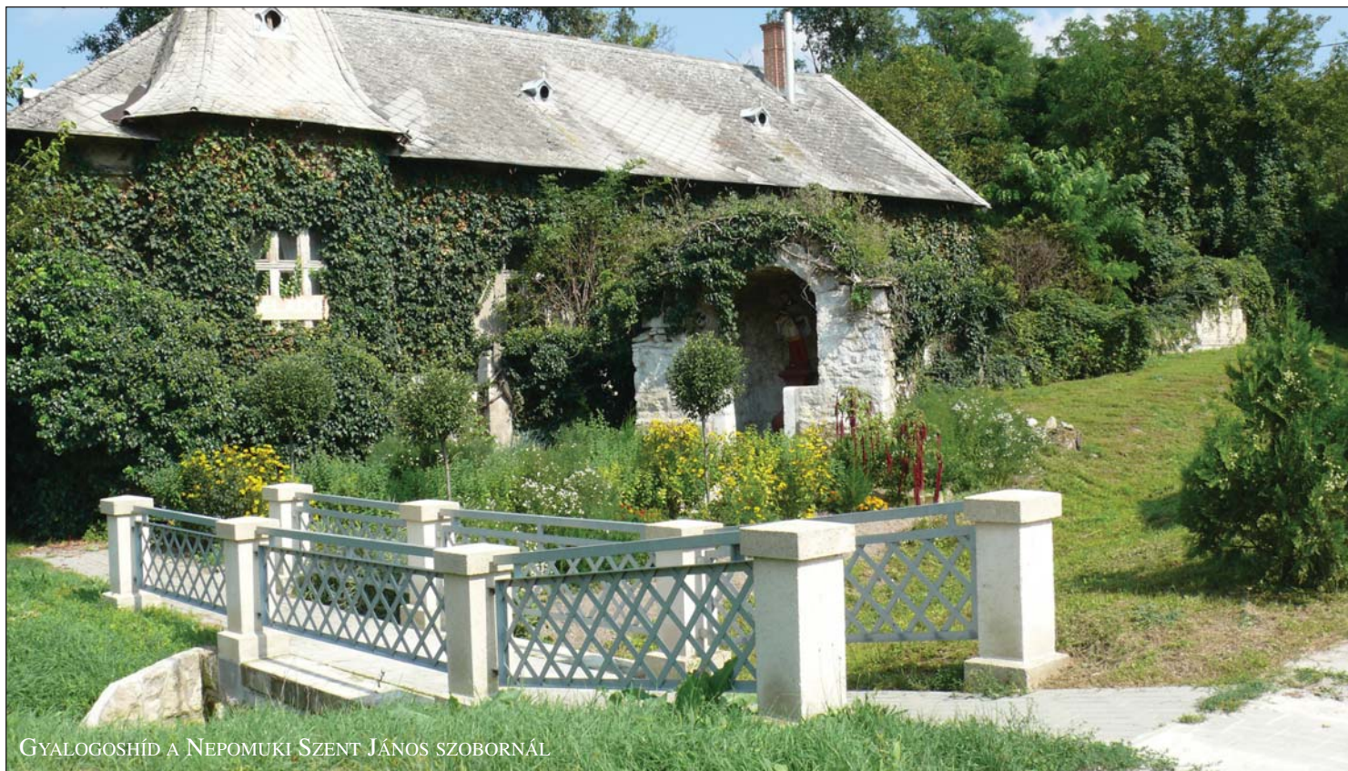
GYALOGOSHÍD A NEPOMUKI SZENT JÁNOS SZOBORNÁL

megköszönni, mivel a teljes felújítás a rendelésekkel együtt folyt.