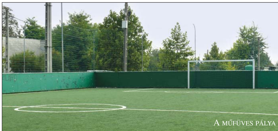
A MŰFÜVES PÁLYA

Az elmúlt időszakban a település fejlesztéséből elmaradtak a nagyobb beruházások, és a kisebb munkák száma is kevesebb lett. Tudjuk, hiszen a lakossággal beszélgetve ez mindig felvetődik. Ennek főbb indokai: az utak és járdák építésének esetében a csatorna beruházáskor még nem tudható, hogy hol lesznek a csővezetékek lefektetve,