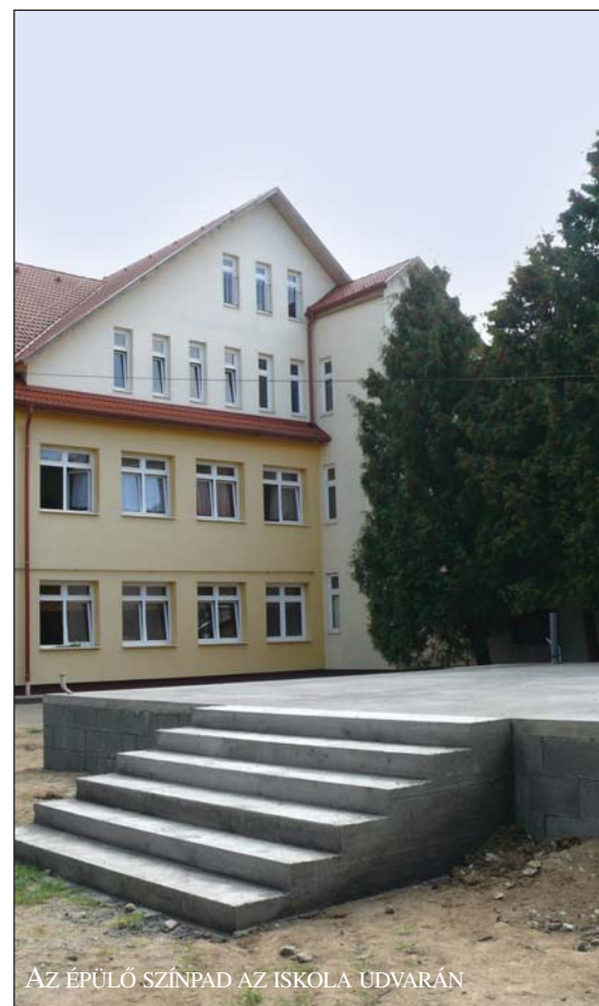
AZ ÉPÜLŐ SZÍNPAD AZ ISKOLA UDVARÁN