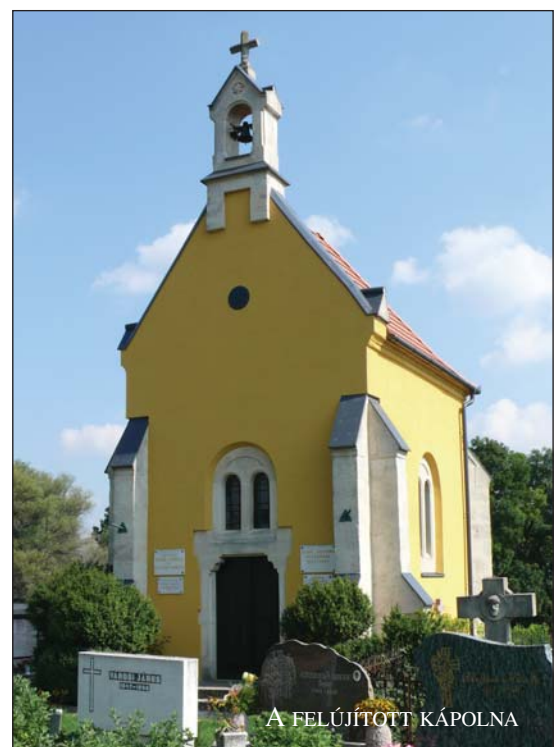
A FELÚJÍTOTT KÁPOLNA

Az iskola még teljesen fel nem újított szárnyában végeztük el a tető eresz deszkázatának leszedését, időtálló fémburkolatra cserélve. A tornacsarnok