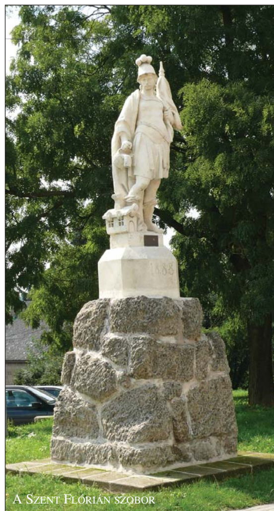
A SZENT FLÓRIÁN SZOBOR

Utolsónak hagytam a legfontosabbat: Sóskút Község életének legnagyobb beruházása folyamatban van! Gondolom, ha ezt így írom le, akkor már min-