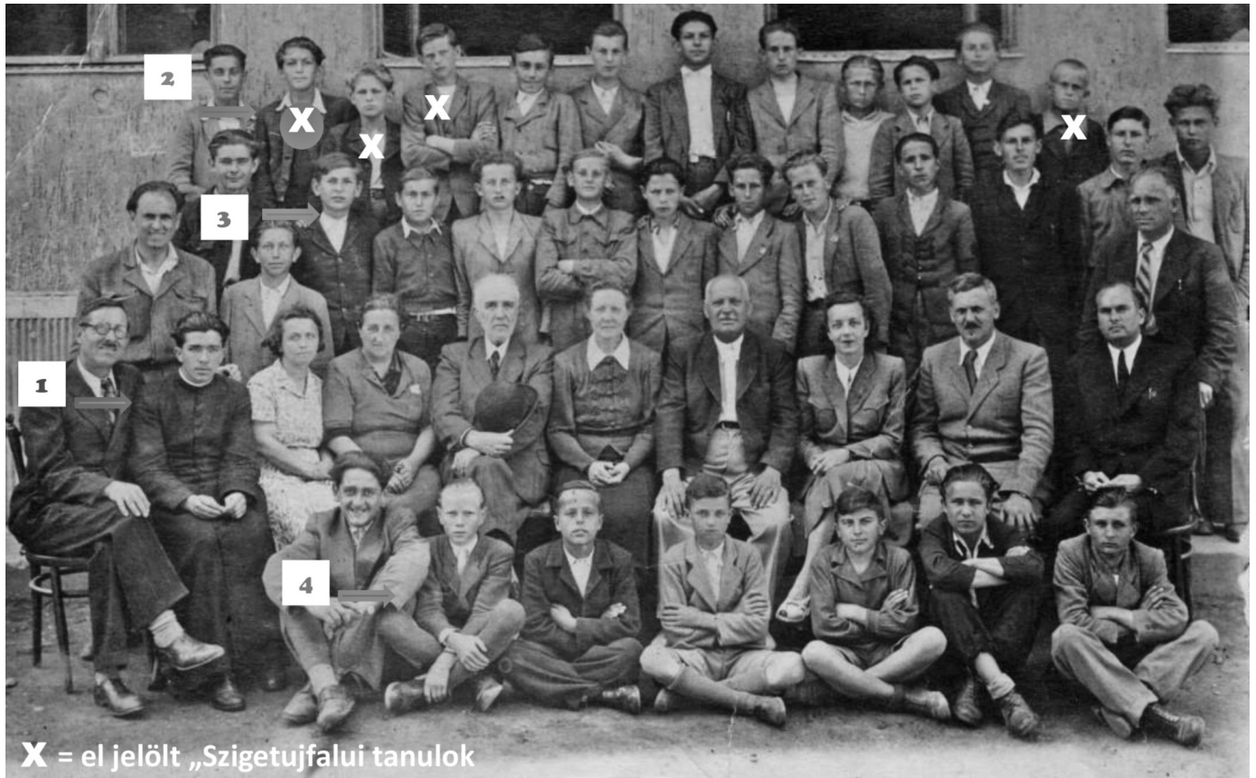
X = el jelölt „Szigetujfalui tanulok