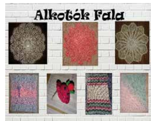
Negrea Éva alkotásai