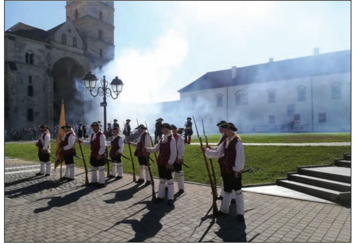
Gyulafehérvár – őrségváltás