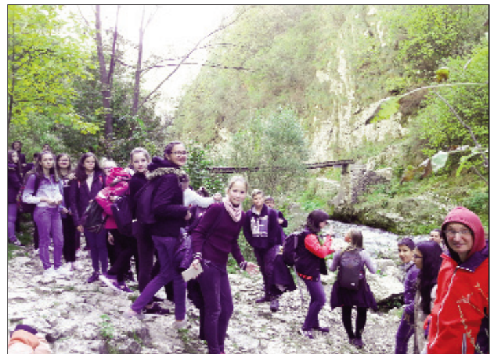
Túra a Tordai-hasadéokban