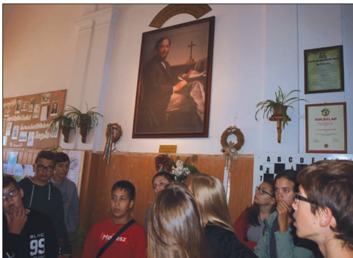
Szacsvy Imre Általános Iskola Nagyvárad

Reggel nyolckor, miután kidörzsöltük szemünkből az álmat, sietve indultunk tovább. Napunk sűrű programjaink közt szerepelt „Kincses Kolozsvár” megcsodálása, ahol mindenki buzgón fotózta a Mátyás-szobrot, érdeklődve tekintettük meg Bocskai István szülőházát, és szemléltük a város építészeti remekeit. Megnéztük a néhai fejedelemség egyik fővárosának egyetemét és egyéb fontos intézményeit is. A Tordai-hasadéokban egy érdekes túrát tettünk, ami nagyon fárasztó volt, de a látvány kárpótolt mindenkit. A hasadék keletkezésének legendáját is megismertük. Ezt követően lementünk a Tordai Sóbányába, ahol rengeteg lépcsőt kellett megtennünk ahhoz, hogy lejussunk. Mondjuk azért a látványért, ami ott fogadott minket, azt gondoltuk egyöntetűen: megérte! Torockón megcsodáltuk a Néprajzi Múzeumot, ami felettébb érde-