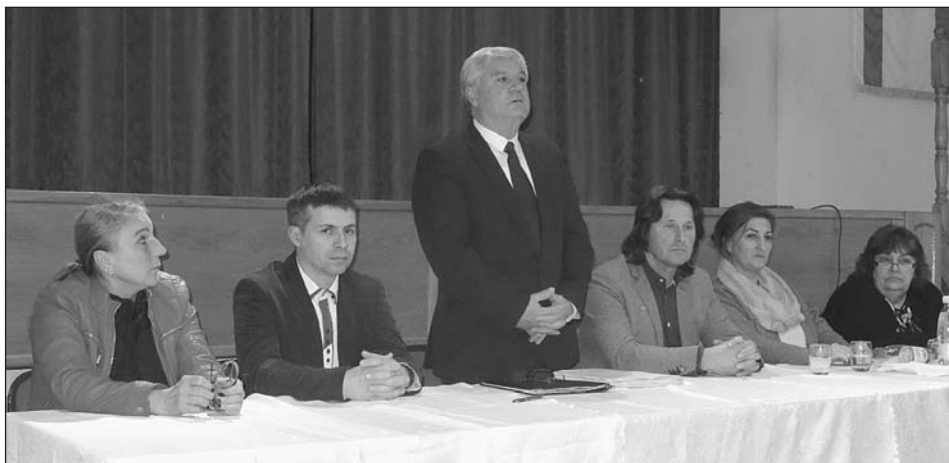
Ezek a meg nem valósult tervek.

2017-ben, azonban több sikeres beruházást is sikerült végrehajtanunk.