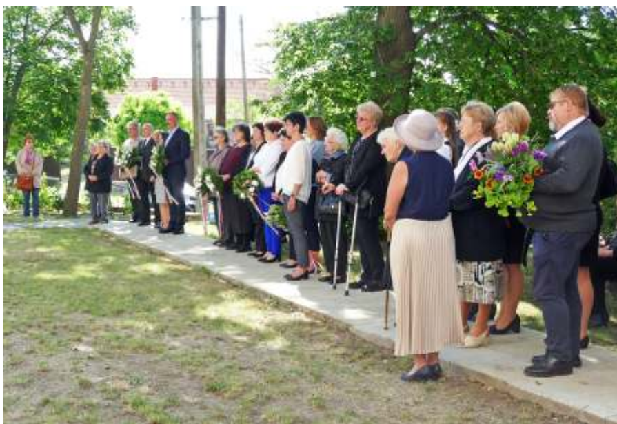
Koszorúzás a templomkerben