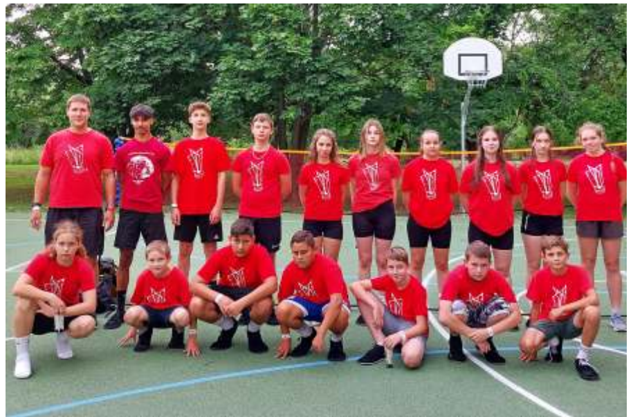
A 17 fős újszászi delegáció