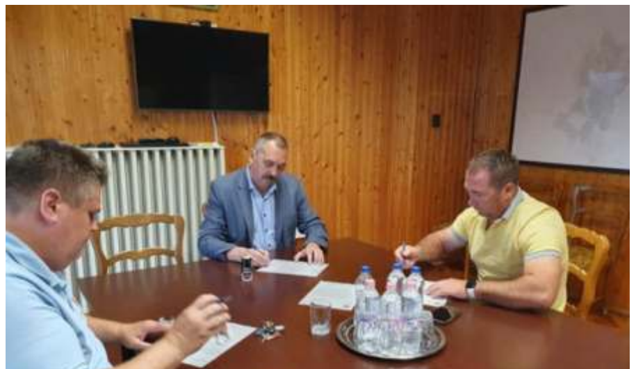
A három Zagyva-menti település, Szászberek Újszász és Zagyvarékas nevében közös levélben kérvényezték a légi védekezés engedélyezését

ezen a helyzeten a földi gyérítés önmagában már biztosan nem tud segíteni, hiszen közútról a lakott belterület jelentős része nem elérhető az így kiszórt vegyszerrel.