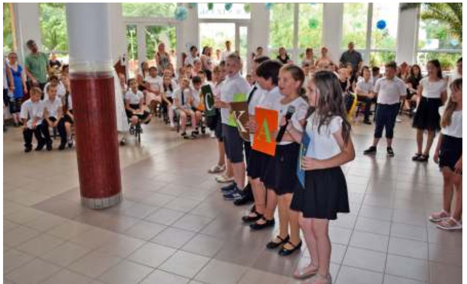
A 3. évfolyam tanévzáró műsora