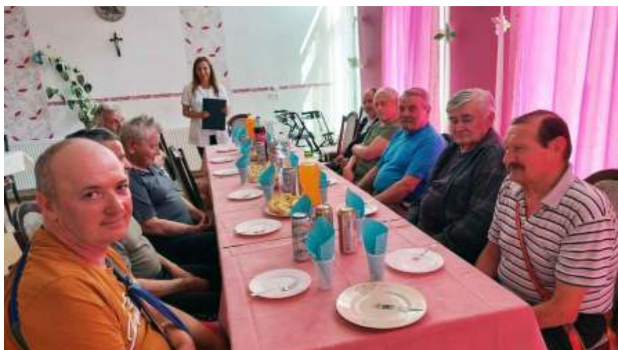
Apák napja a II. osztályon