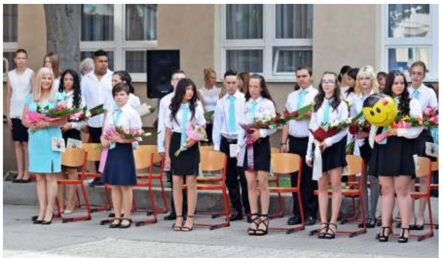
A 8.a osztály