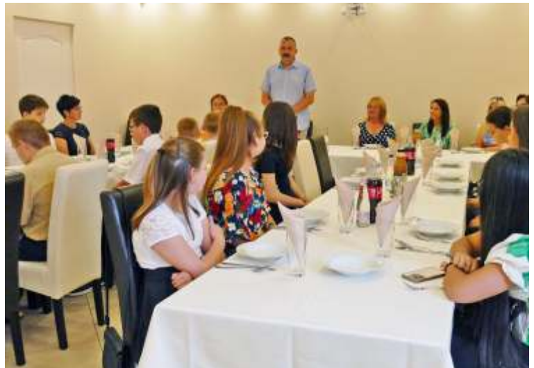
A jó tanuló általános iskolások ebédjén