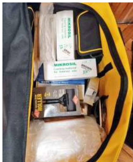
Mit rejt a helyszínelő táskák

A vasutas szakmai foglalkozásokon folyt a terepasztal építése, a rövidfilm készítése és egyéb tevékenységek. Idén tisztításokat javításokat végeztünk, tovább építettük, szepítettük a terepet, tovább