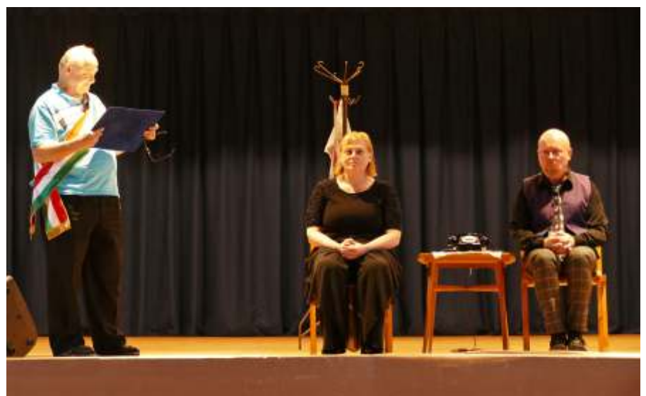
Többeknek lehetősége volt személyesen is részt venni az interaktív műsorban