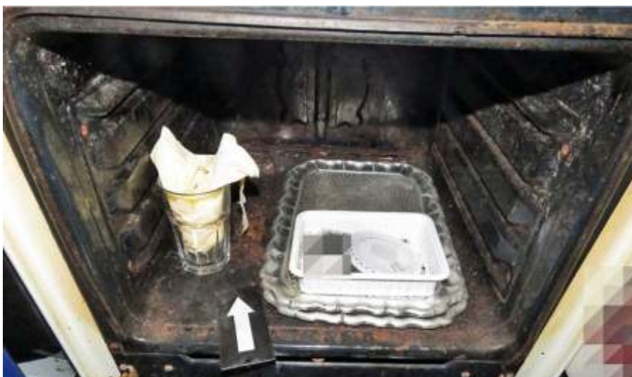
Az elkövető tudomást szerzett róla, hogy a vendéglő tulajdonosa több százezer forintot tárol az egyik sütőben