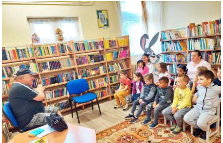
Sanyi bácsi mesél