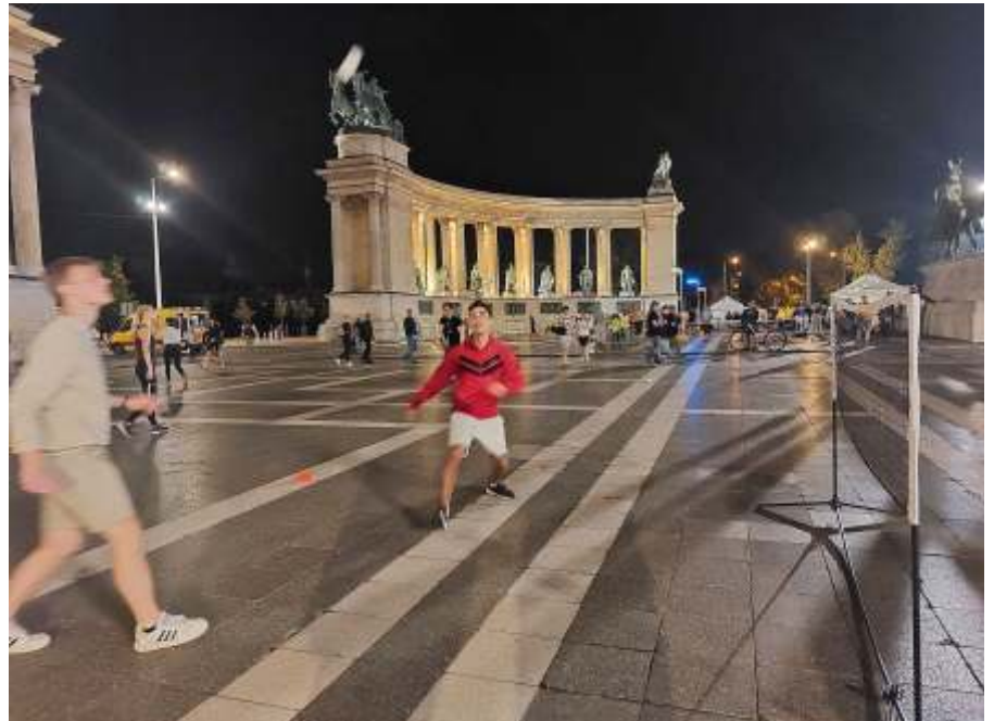
A Hősök Terén szállt a láb toll-labda