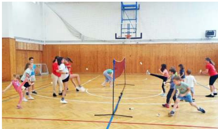
Izgalmas labda csata