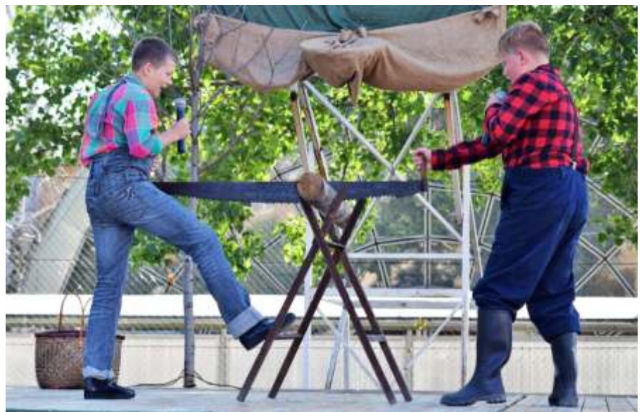
A 6. a jelenete