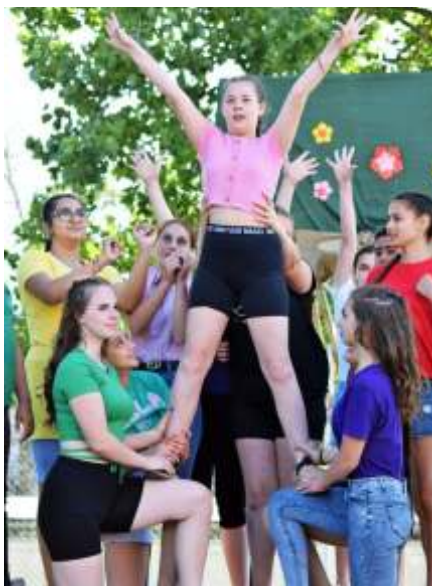
A Diákszínpad produkciója