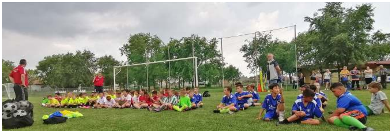
Mérkőzések utáni pihenő