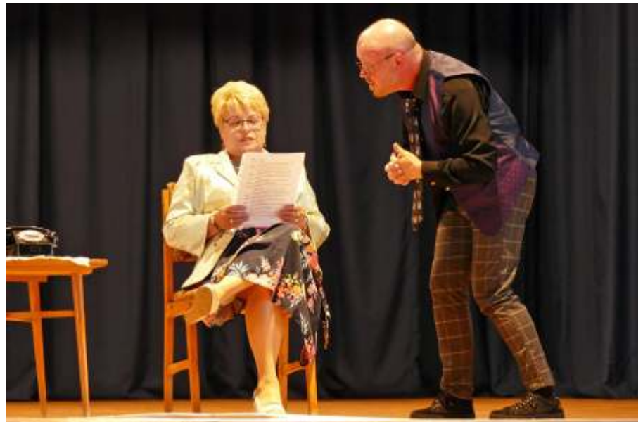
„Nevetéssel, zenével gyógyítjuk az emberek lelkét...”

Új Néplapban megjelenő szavazási szelvényen május 23-tól van lehetőség szavazni. Augusztus 1. 10 órától pedig a szoljon.hu/primadij oldalon is folytatódik a szavazás. A papír szelvényeket 2023.08.29. keddig gyűjtjük a Városi Könyvtárban (Damjanich út 2.). Az összegyűjtött szelvényeket a könyvtár bejutatja Szolnokra.