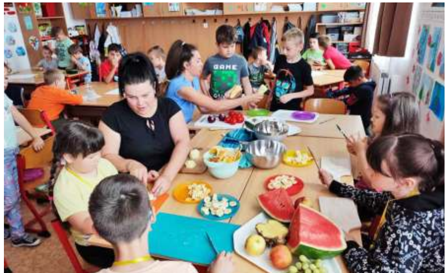
Salátakészítés a szülők közreműködésével