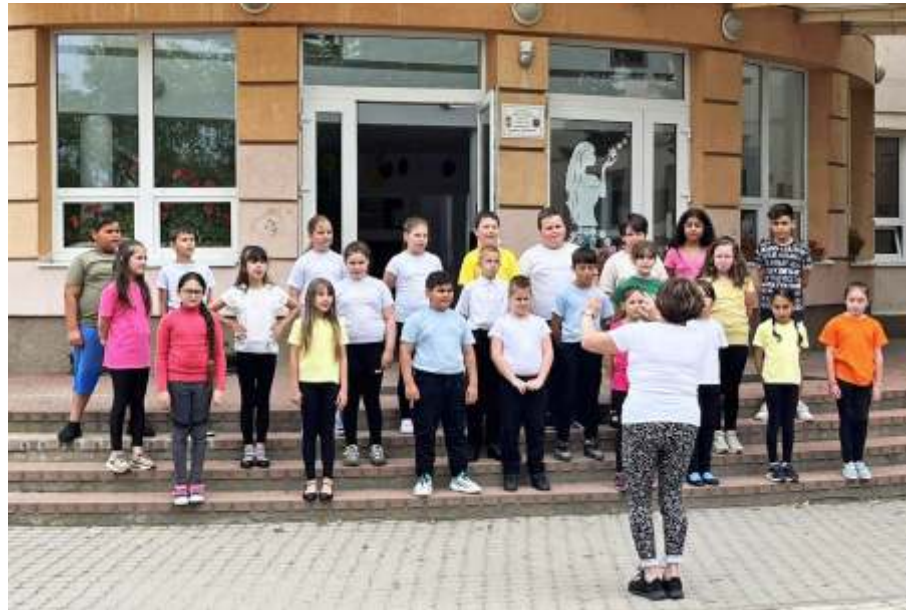
A harmadikosok dalaival indult a gyermeknap rendezvény

A gyermeknap programot 10:00 óra-kor vidám, dalos összeállítással a harmadikos kisdíjak nyitották meg, majd kicsik és nagyok egy fergeteges zumbával melegíthettek be. A délelőtti további részében – a vállalkozó szellemű szülők közreműködésével – zöldség-, és gyümölcsalátákat készíthettünk (a felsősök a Művelődési Házban, az alsósok az iskolában), melyhez a szükséges hozzávalókat az Újszászi 4H Egyesület biztosította. A Művelődési Házban az egészséges táplálkozásról szóló előadás is várta a nagyokat, akik aztán kahoot feladatokkal, és