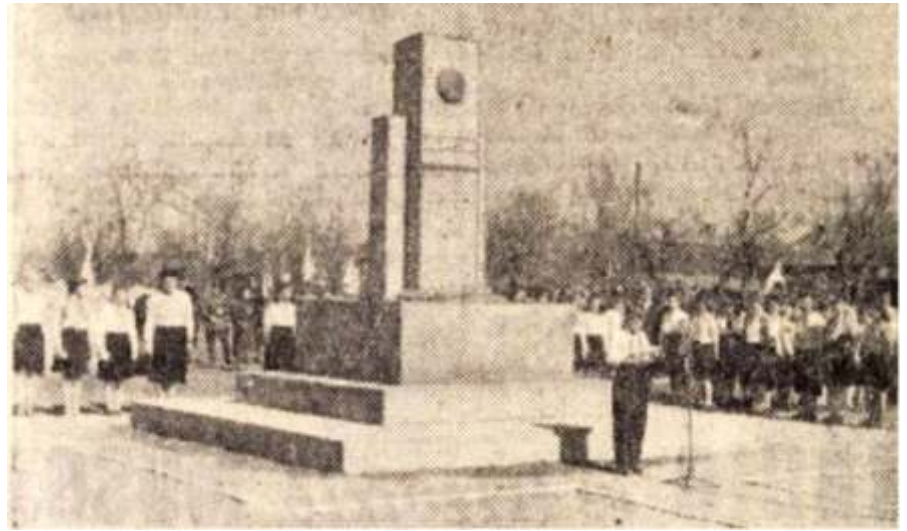
1959: Az emlékmű avatása

És valóban, e nap emlékezetes volt az újszásziaknak, mert két évvel ezelőtt, 1959. március 21-én, amikor felavatták az 1919-es újszászi fogolytábor emlékművét, a Partizánszövetség Agárdi Ferenc et küldte le ünnepi szónoknak. Ott voltam ezen a szép tavaszi délelőttön Újszászon - együtt tettük le a magyar partizánok ko-