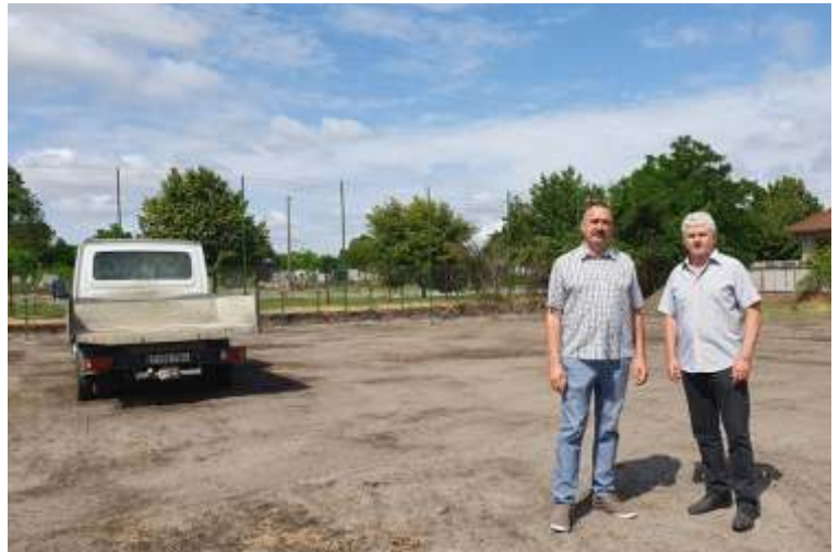
20x40 méteres játékkerületű műfüves focipálya épül városunkban

Hálás szívvel köszönjük munkájukat, hiszen az év minden napján ők vigyázzák életünket, egészségünket.