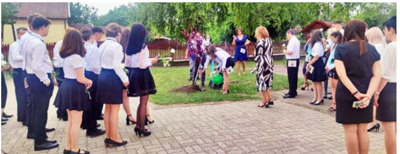
Ballagó nyolcadikosaink fát ültetnek

Munkánkat a szülők nagyban segítették, támogató együttműködésüket egész évben élvezhettük. Nagyon jóleső és fontos segítség volt a gyerekek kísérése egy-egy versenyre, az osztály, vagy az iskolaudvar rendezésében való részvétel, a jelmezek készítésében nyújtott segítség, projektnapjainkon való aktív részvétel és még sok más alkalom, amikor az együttműködésre számíthattunk. Szeretném megköszönni a Szülői Munkaközösség egész tanéven át nyújtott munkáját, a Vörösmarty Tanulmányi és Sportalapítvány támogatását. Ugyancsak köszönöm Polgármester Úr, az Önkormányzat, a civil szervezetek cégek/vállalkozók támogatását, hiszen ezáltal a tanulónak nyújtott programjainkat te-