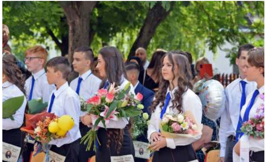
A 8.b osztály

Márk 8 éven át töretlen szorgalommal végezte feladatait. Kimagasló tanulmányi eredményét mi sem bizonyítja jobban, mint hogy a középiskolai felvételin, valamint a 2022/23-as tanév kompetenciamérésein évfolyamelső lett. Szerény, szimpatikus egyéniségevel üde színfoltja volt az osztályközösségnek. Mindig kiszámítható, megbízható diákként élte