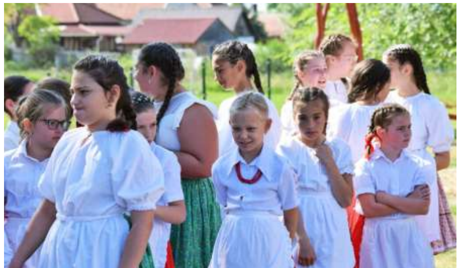
A Tallinnka néptáncosai