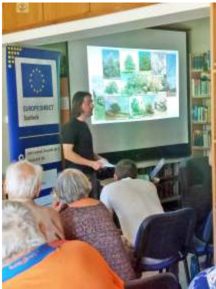
Pillanatkép az előadásból