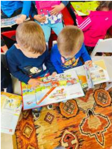
Nézzük csak!