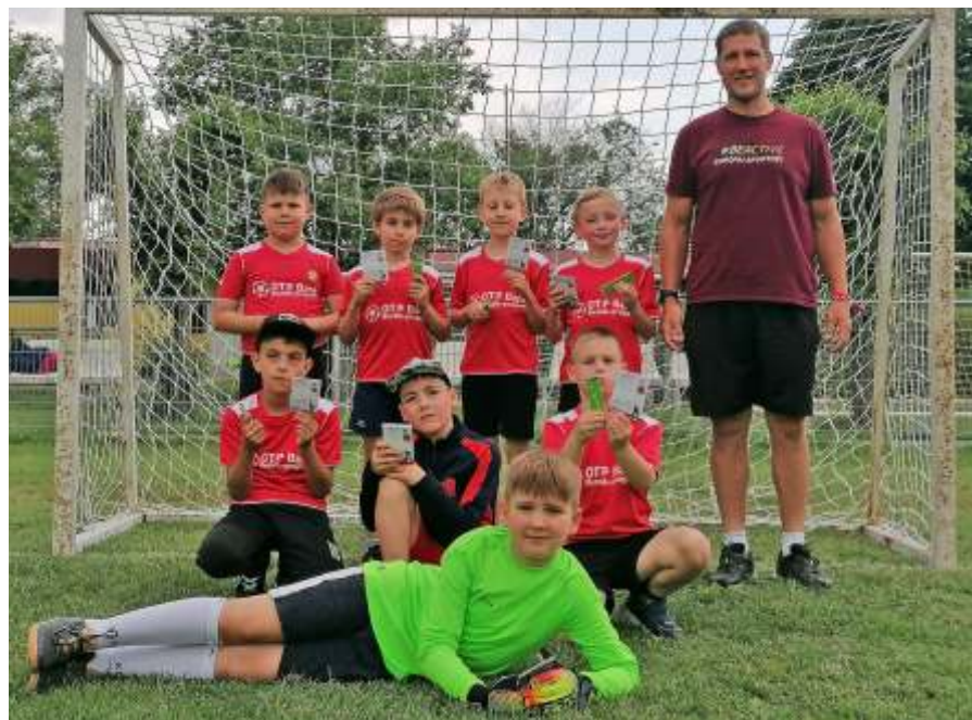
I. korcsoportos újszászi csapat