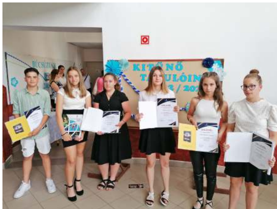
Az újszászi Vörösmarty Mihály Általános Iskola Magyarország Jó tanulója, jó sportolója címet elnyert diákjai