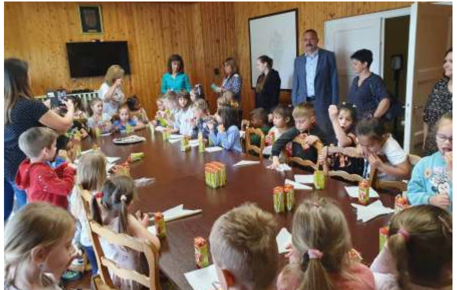
Évek óta hagyomány a ballagó óvodások fogadása a Városházán (Fotó: Facebook)

A jelentős méretű pangó vízfelületek és a légi kémiai védekezés tiltása miatt