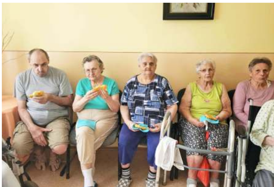
Lángosozás a III. osztályon