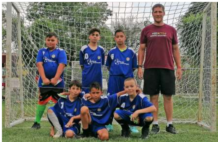
II. korcsoportos újszászi csapat