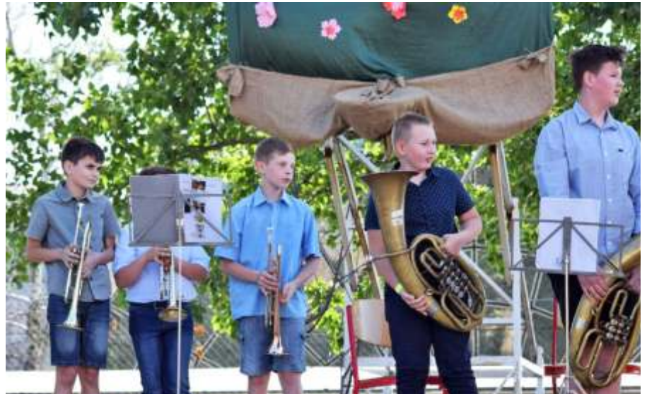
A Bartók Béla Zeneiskola tanítványai

Míg a gyerekek és tanáraik a jó hangulatról gondoskodtak, addig a vállalkozó kedvű szülők pedig arról, hogy senki ne maradjon éhen és szomjan. A büfét a szülői munkaközösség lelkes csapata üzemeltette, ahol a kerti partyk védjegyéül szolgáló finom palacsinta volt a legnagyobb sztár. A közel 2000 palacsinta, – mely a büfében gazdára talált – szintén a