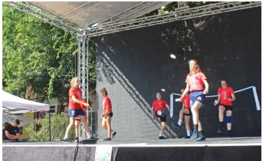
Bemutató a Civil Kavalkádon