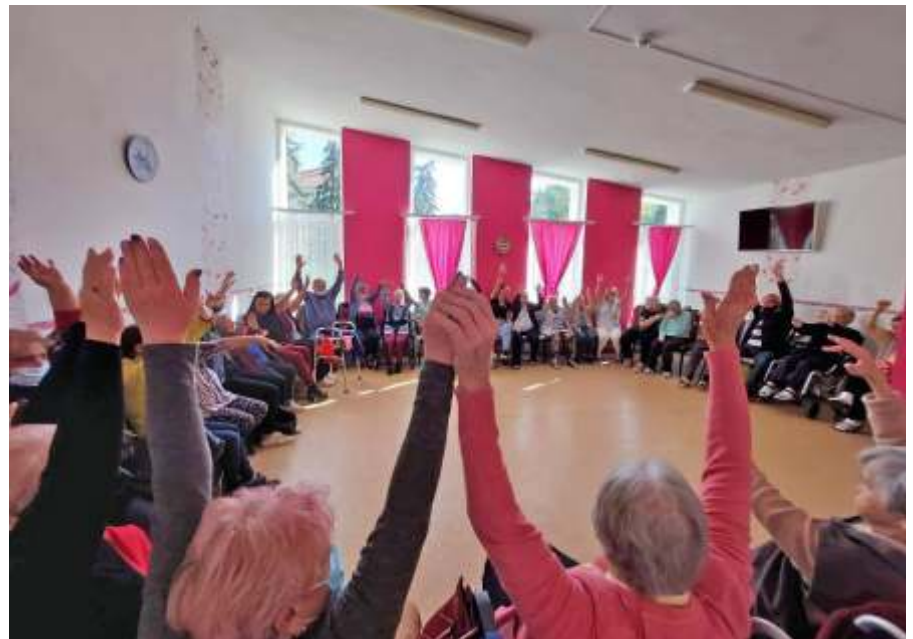
Családi napon, torna közben

A hangsúly a természetességen, foglalkozás témáját tekintve a memóriacsizoláson volt. Fontosnak tartottuk, hogy a családtagok olyan szituációban is lássák a bentlakó szerettüket, melyben régen nem volt alkalmuk, pedig ez fontos része a mindennapjaiknak. Egy komplex foglalkozás keretén belül valósult ez meg. Torna, memóriagyakorlatok majd játékok, mely az időseink egyik kedvence a szőlőlánc volt. Ahogyan eddig, most is mindenki nagyon ügyes, figyelmes és aktív volt, annak ellenére, hogy eleinte egy kis izgalom mindannyiunkba befurakodott. Nevetéssel, felszabadulva, „terheinket” lerakva teltek az órák.