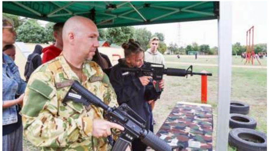
Airsoft lövészet