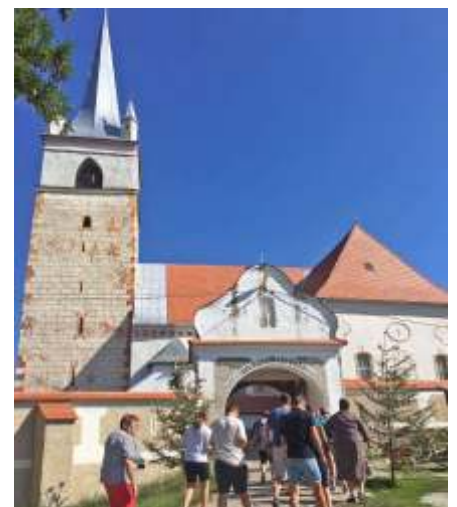
Csíkrákos és Göröcsfalva közös temploma