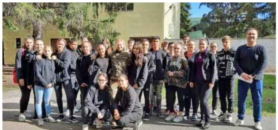
Ez év májusa után ismét az MH 86. Helikopter Bázison jártunk, csak most iskolánk új, kilencedikes tanulóival. Óriási élmény volt. Nagyon szépen köszönjük a lehetőséget