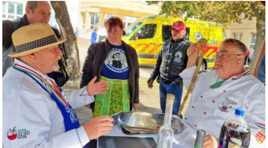
Lecsófőző motorosok a zsűri előtt

Különdíjat kapott még: a Boszorkánykonyha, az Íjászok, az Alföldi Motorosok, a Léna Family és a Gömbi család csapata.