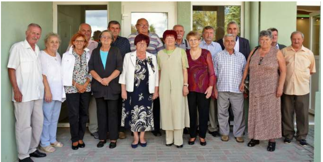
„... Ha az ember az marad, ami volt: Nemes, küzdő, szabadlelkű diák.”

A toborzó központ a Jász-Nagykun-Szolnok Megyei Rendőr- főkapitánysággal, a Jász-Nagykun-Szolnok Megyei Büntetés-Végrehajtási Intézzel és a Jász-Nagykun-Szolnok Megyei Katasztrófavédelmi Igazgatósággal együttműködve valósította meg a szerdai progra-