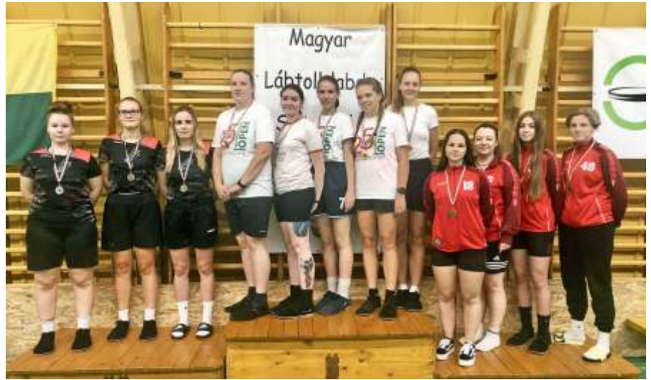
A női csapatversenyt Újszász nyerte