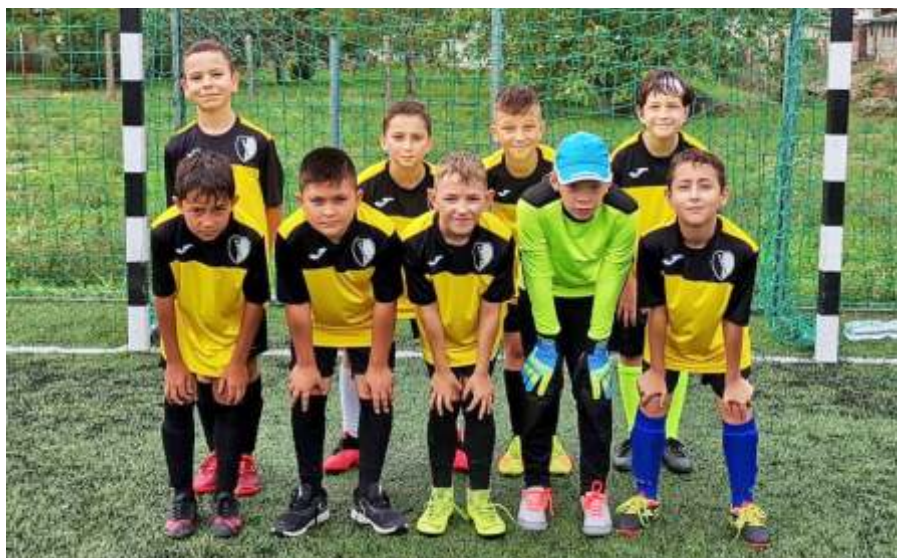
Az U11-es csapat a műfüves tornán