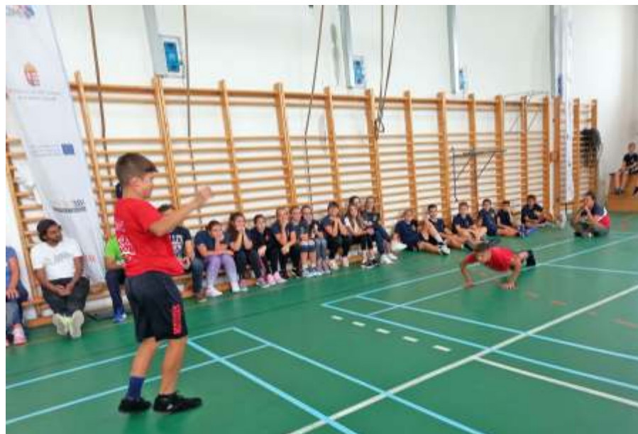
Bemutató Ráckeven fekvőtámaszsal

Az Újszász Kupán, az év legnehezebb lábtoll-labda versenyén két nap alatt, hét versenyszámban, 24 órát lábtoll-labdázott a 86 résztvevő. A júliusi Hungarian Open visszavágójának is tekinthető tornán a júliusi győztesek visszaverték a támadásokat, és megőrizték első helyüket. A házigazda Újszászi VVSE versenyzői kiemelkedően szerepeltek. Hat számot megnyertek és még két ezüst és hat bronzérmet is begyűjtöttek. Nagy bánatukra a „királykategóriában”, a férfi csapatversenyben ismét a Nagykanizsa ZSE végzett az első helyen.