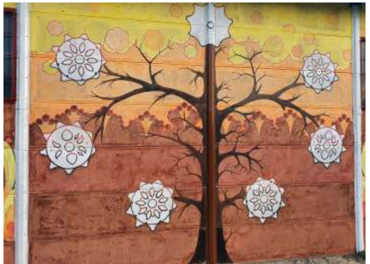
Mezépült a régi raktár épület