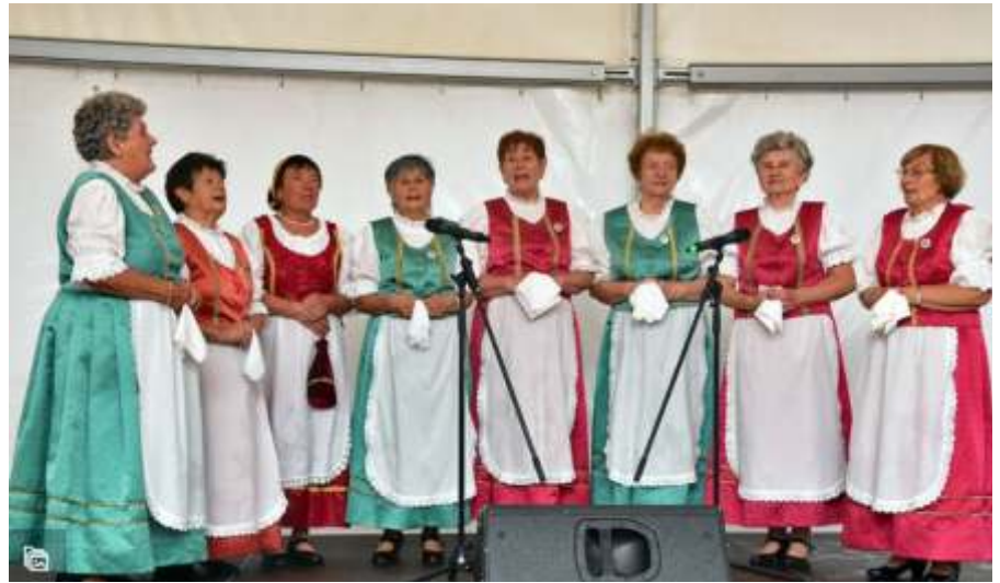
A Százasorszép Népdalkör