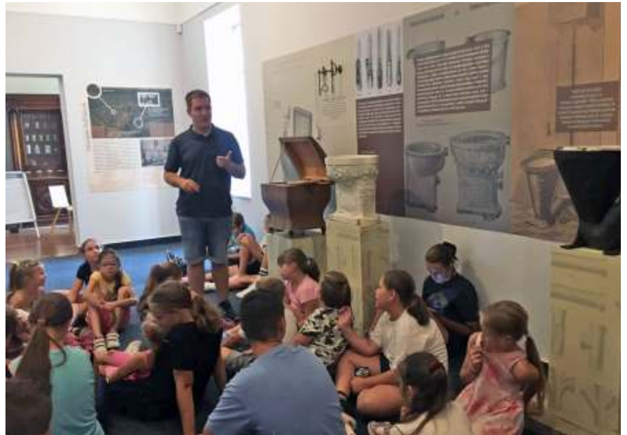
Szegeden a Fekete házban

Szerdán ismét itthon táboroztunk. Délelőtt a rendőrség bűnmegelőzési és közlekedésbiztonsági napot tartott nálunk. A sok hasznos információt nem lehet elégszer hallani, és csak összejött egy kis biciklis ügyességi pálya is. Mindenki kapott egy játékos oktatófüzetet, de a legnépszerűbb ismét a részeg szemüveg volt. Az ebédet ismét az étteremben fogyasztottuk el, majd a polgármester meghívásának eleget téve, fagyiztunk egyet. Köszönet érte. Délutánra a tollasozás és az óriás buborékok fújása maradt. A tábort az egészséges életmód jegyében szerveztük, a résztvevők minden nap kétszer gyümölcsöt kaptak, tízórára joghurt italt. Az úti csomagok összeállításakor is próbáltuk megtalálni a helyes egyensúlyt a finom és egészséges nassolnivalók arányában.