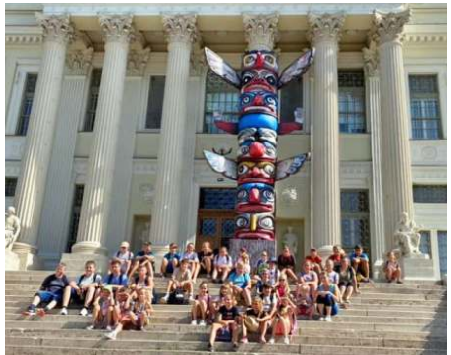
A Móra Múzeum lépcsőjén

A tábor utolsó napja nagyon hosszúra, de annál tartalmasabbra sikerült. Ismét busszal indultunk kirándulni, ezúttal Szegedre. A Móra Ferenc Múzeum kiállításait néztük meg. Először a legendás vadnyugati Cowboyok és indiánok életébe nyerhettünk betekintést ruháik, használati tárgyaik segítségével. Színes, érdekes bemutató, ahol még a spagetti westernek hőseire is gondoltak. A múzeum állandó, de mindig megújuló természettudományi terméi is izgalmasak voltak, de az emeleten található Móra rengeteg, egy mesebeli terem, mindenkit elvarázsol. A múzeum épületének tetején lévő kilátóból Szeged különleges perspektívából látható. A kanális, kloáka, klozet kiállítás egy külön épületben található, ahol egy muzeológus tartott érdekes tárlatvezetést, mely bemutatta a csatornázás és a véccék, mosdók fejlődését, a római Cloaca Maximától egészen napjainkig. Ezek után (tényleg) jó étvágygal fogyasztottuk el az ebédünket az egyik legjobb belváro-