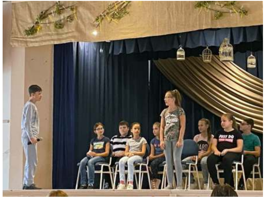
... a bemutatóig