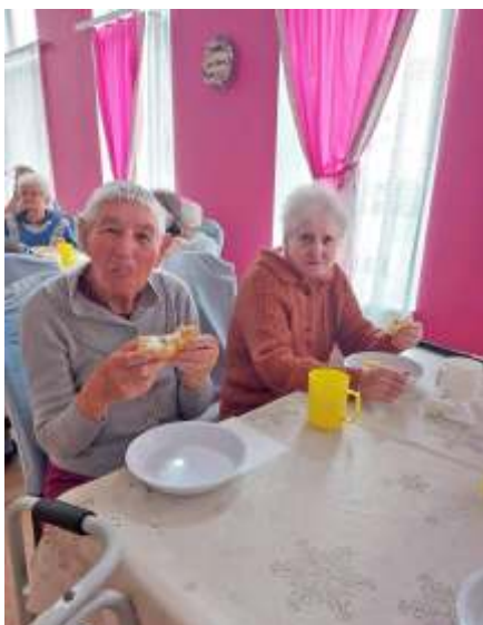
Szeretjük a finomat

Szeptember 21-én az Alzheimer világnapja alkalmából családi napot tartottunk a III-as osztály lakóinak és hozzátartozóinak.