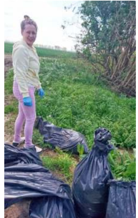
Zsákokba gyűjtött szemét

Továbbra is sok kommunális szemetet dobnak el, de gyakran fordult elő, hogy olyan zöld hulladékokat zsákolnak be, és helyeztek el a határban , illetve a fent nevezett utak szélén, melyek megfelelő elhelyezéssel a természetben lebomlottak volna. Ezért is próbálom felhívni a figyelmet, hogy a fű, széna, egyéb faágak szerves hulladék, tehát elhelyezhetjük a kertünk végében. Az összegyűjtött levél és egyéb zöldhulladék, lomb, amely a jelenlegi időjárásnak megfelelően hamarosan megszorodik, kezdetben nagy helyet foglal el, de megfelelő odafigyeléssel, forgatással, stb. néhány hét alatt összeesik, elrohad, s később felhasználható levéltrágyának például. Saját dolgunkat is megkönnyítjük, illetve pénztárcánkat is kímélhetjük, ha odafigyelünk ezek tárolására, komposztálására, vagy akár szárítására. Így akár már a következő évben jól hasznosítható trágyát kaphatunk. Úgy gondolom, kis odafigyeléssel sokat tehe-