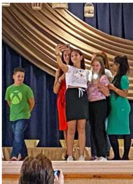
Önálló alkotás a színpadon