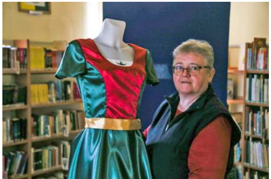
Az egyik ruhavisélet Újszász zászlójának a színeiben pompázott