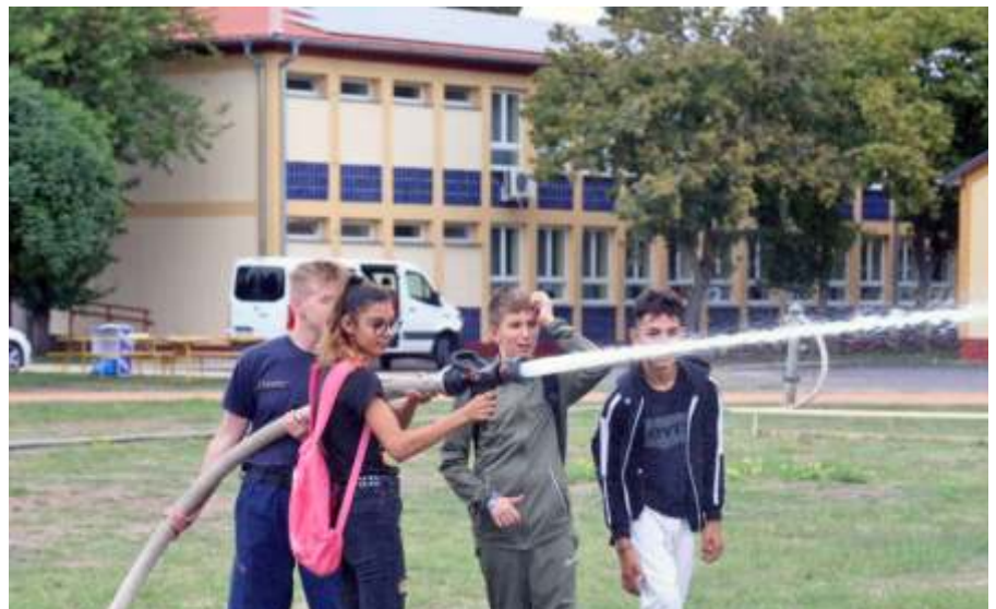
Ifjú tűzoltók