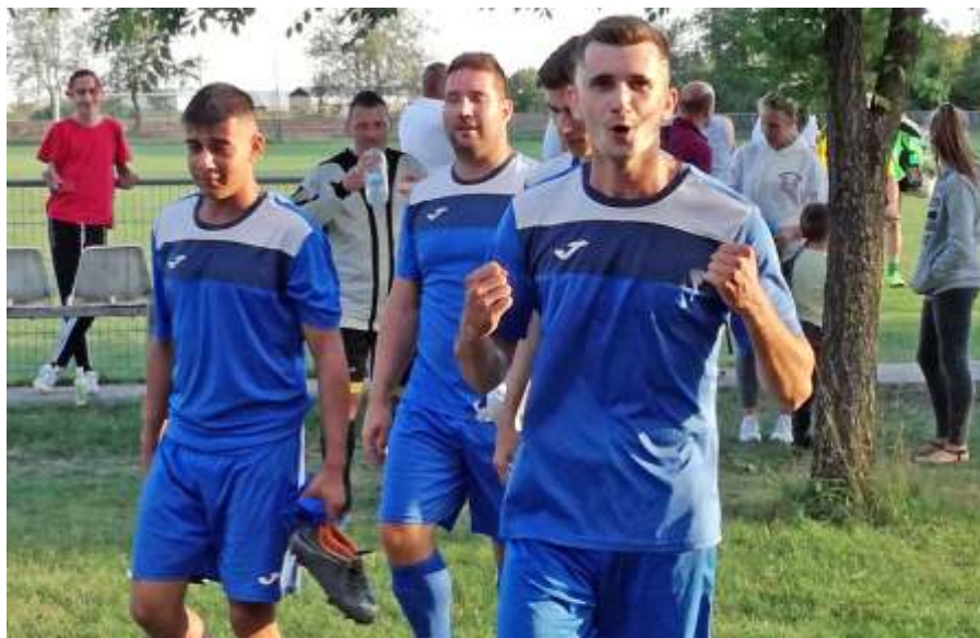
Az Újszász – Bánhalma győztes mérkőzés után

és szép gólokat szerezve gyűjtötte be a három bajnoki pontot.