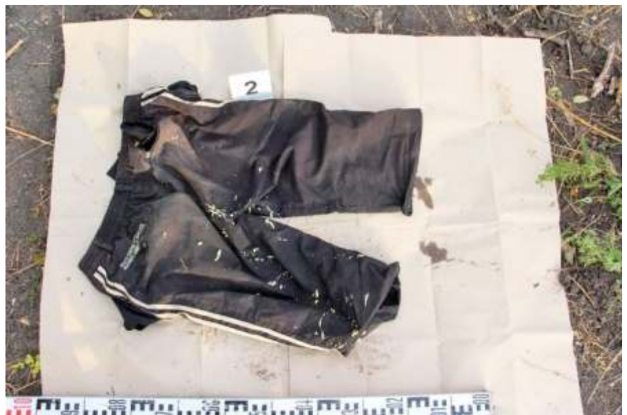
Az férfi világoskék színű, Nike feliratú pólót, továbbá fekete színű – mindkét oldalon 2 fehér csíkkal ellátott – térdnadrágot viselt.