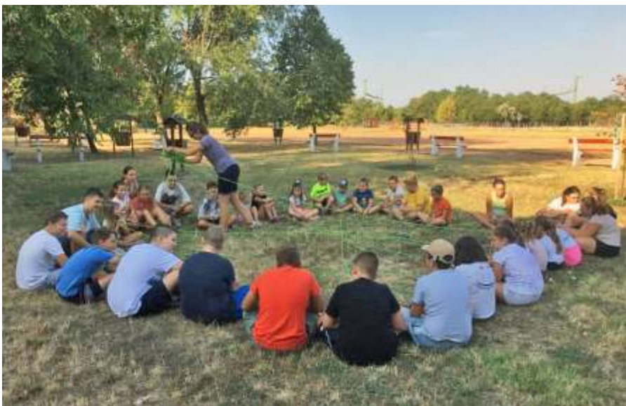
Közös játék a középiskolában

eges Józseftől származik. Mi a róla elnevezett teremben egy buborék-shown vetünk részt, majd kipróbáltuk a száznál is több interaktív tudományos játékot. Az élmények és programok közben talán észre sem vették a gyerekek, hogy mennyit tanultak a délelőtti folyamán. Budán egy étteremben fogyasztottuk el az ebédünket. Mire végeztünk, olyan történet, amit itthon már rég nem láttunk. Leszakadt az ég, hömpölygött a víz a hegyoldalon, így a délutáni programot újraterveztük. Hazafelé indultunk, de a pesti oldalon már hét ágra sütött a nap, így megálltunk a régi repülőket bemutató Aeroparkban, mely a repülőtér szomszédságában, közvetlen a légifolyosó alatt található. Kaptunk tárlatvezetőket, akik minden pilótafülkébe beengedték a gyerekeket, és érdekes történeteket meséltek a gépekről, miközben percenként szálltak le felettünk a különböző légitársaságok repülőgépei.