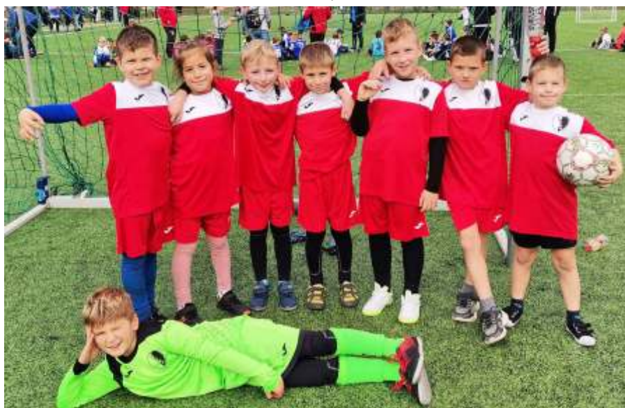
Jászberény U7-9 Bozsik fesztivál