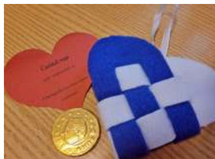
A legnagyobb kincsemet adom.. Ajándék a lakóktól hozzátartozóinknak

Vendégeink és lakóink véleménye szerint egy igazán családias, humoros és mindenekelőtt hasznos délelőttöt töltöttünk el együtt. Szeretnénk, ha több ilyen közös program megvalósulna a jövőben, gazdagítva nemcsak az időseink, de a szeretteik lelkét, életét is.