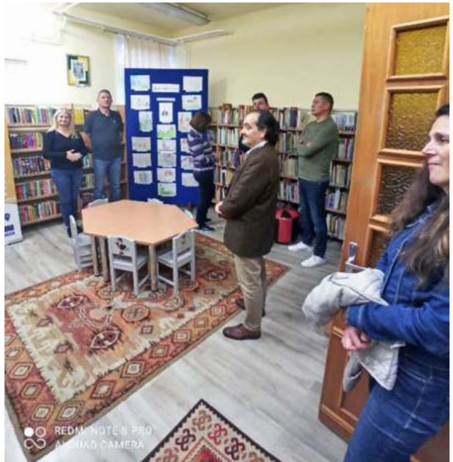
Testvérvárosok delegációi a kiállításon