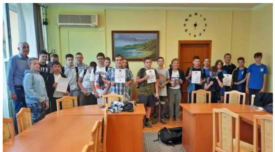
A közlekedési vetélkedő résztvevői az eredményhirdetésen

Az első helyet az Uborka egység szerezte meg, ők bluetooth hangszórókat kaptak, a második helyezett a TBP csapat, ők bluetooth fülhallgatókat vehettek át, és végül, de nem utolsósorban a harmadik helyezést a Térképészek csapata érte el, ők vezetékes fülhallgatókat boldog tulajdonosai lettek.