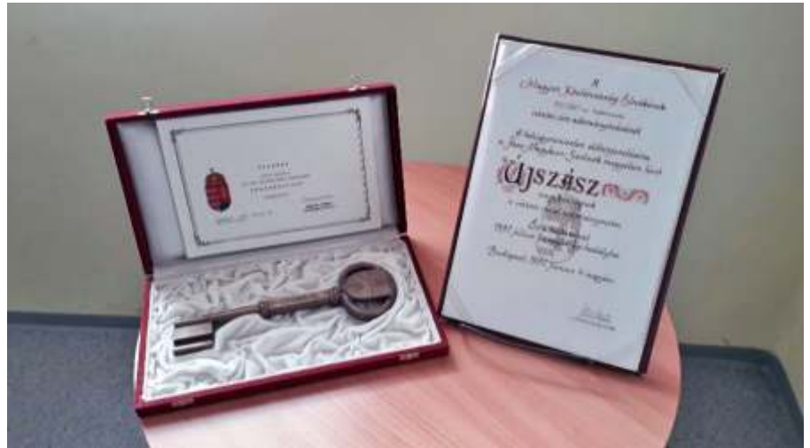
A város kulcsa és az adományozólevél

http://www.zounuk.hu/ujaszaz/hu/v arosunk-jelkepei.