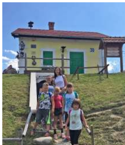
A vasúti őrháznál

A hazaindulás napján tartalmas reggeli után szálltunk fel a buszra. Farkaslakán megkoszorúztuk Tamási Áron sírját, és a szülőházát is megnézhettük. A rengeteg kézműves termék között mindenki talált emlékező valót, amivel meglepette szeretteit vagy saját magát. A Királyhágón a nagyszerű kilátásban még hazafelé is