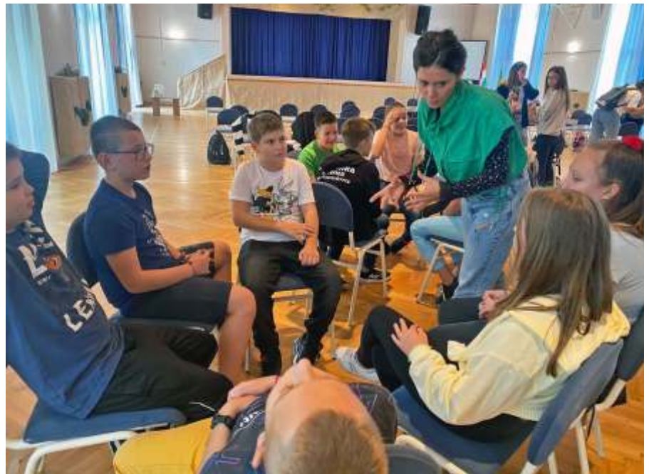
Az első ötlettől ...

A résztvevők öt csapatban szimultán játszottak, ismerkedtek, dolgoztak a színházi jeleneteken, és egymást, vagyis a többi csapatot inspirálták. Bizonyos pon-