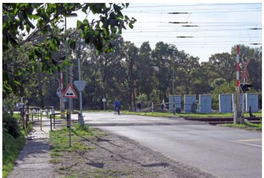
A megújult vasúti átjáró

– Ezeken a ruhákon a város zászlajának a színei jelennek meg, és szintén a jellegzetes zöld színnel készítette az alkotó a ruhákra a különleges hímzést. Természetesen minden alkotás különleges valamire, legtöbbször a város jellegzetes helyszíneit örökítették meg, vagy egy emlékeze-