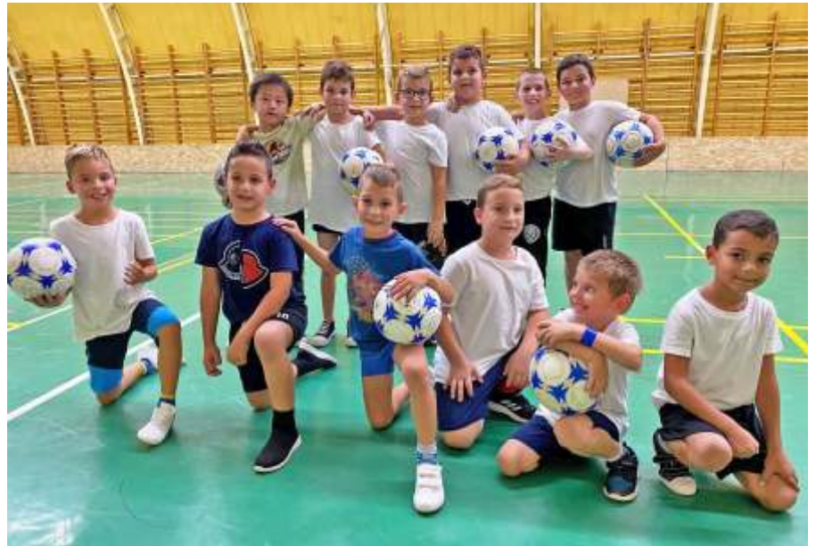
A legkisebb focisták edzésén

Szeptember 4-én Budapesten, a Pus-kás Aréna Nyugati Parkjában rendezte legnépszerűbb, ingyenes, szabadtéri rendezvényét, a Családi Mozgásfesztivált a Magyar Szabadidősport Szövetség. A 23. alkalommal megrendezett fesztiválon 100+ sportágot lehetett kipróbálni. A lábtoll-labdát három pályán rúghatták az ér-