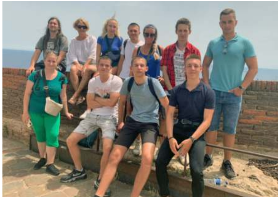
A Montjuïc erődben

so múzeumban, a Montjuïc kastélyban. Szinte napi programnak számított, hogy lementünk a tengerpartra, s a tengerben fürödtünk, vagy éppen napoztunk. Érdekes volt, hogy nem mindig lehetett fürdeni, ugyanis a nagy hullámok felkavarták a tenger vizét, ezáltal sok volt a baktérium, ami fertőzéshez vezethet. Gyakran volt kint a fürdést tiltó piros zászló.