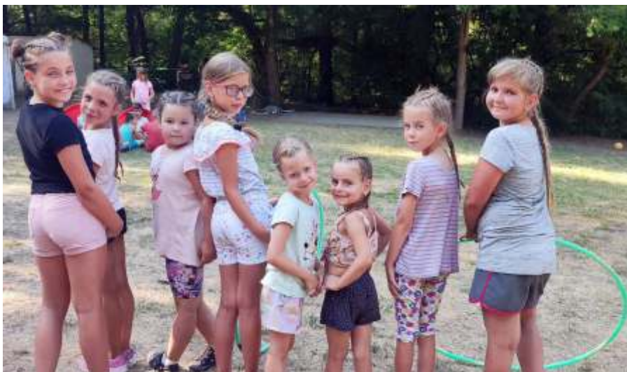
A legkisebb táborozók

air-soft lövészet, kézműves foglalkozások, többek közt decoupage, gyöngyfüzés, vászontáska és bögrefestés, kavicsfestés és kavicskép készítés vártak minden táborozót. Izgalomban sem volt hiány. GPS-ek segítségével nyomokat kerestünk az erdőben. A Terápiás angyalok 4 lábán, avagy Miért, hogyan legyünk felelős gazdika? címmel interaktív előadás is ismerkedhettek és barátkozhattak a gyermekek a terápiás kutyákkal. A Tallinka Gyermeknéptánc Egyesület közreműködésével az 1. tábor résztvevői a néptánc alaplépéseivel ismerkedtek, illetve népi gyermekjátékokat tanultak, míg a 2. tábor lakói Nagy Rajmund kántor által vezetett zenei foglalkozásokon vehettek részt. Több éve vendége a táboroknak az „En is vagyok” Egyesület, akik közreműködésével egy érzékenyítő programban találták magukat a gyermekek. Mindezek mellett sportversenyeken, akadályversenyeken, vicces ügyességi versenyeken is részt vehettek a táborozók. Tanultunk is egy kicsit, például a fogápolás fontosságáról, vagy a logikát fejlesztő társasjátékokkal játszottunk, óriás buborékok fújtunk az egyik délután. Esténként pedig a spontán szerveződött csoportok karaoke „partykat” szerveztek. Készült a táborokban lángos, kürtöskalács, lecsó és palacsinta is, mind - mind a gyermekek kedvére.