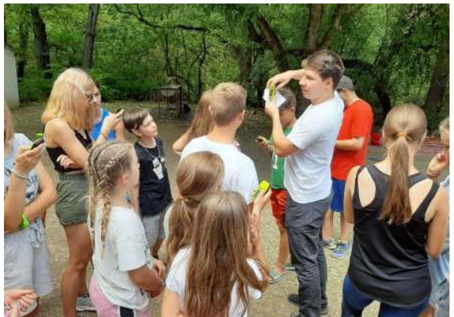
GPS-es nyomkeresés