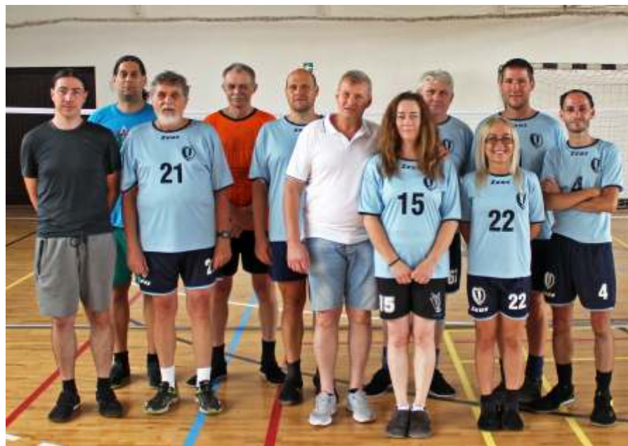
Az Újszászi VVSE szenior lábtoll-labdázói

A második napon az egyénizők és a vegyes párosozók mérköztek. A férfiak-