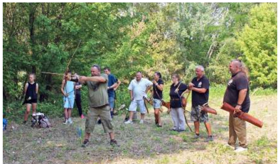
A csapattársak szurkolása segíti a jó célzást

Réggel a versenyre érkezőket az edésház előtt felállított sátorban az ilyenkor elhagyhatatlan zsíros kenyér fogadta, mely biztos alapot adott a több mint 4 órán át tartó versengéshez. A reggelivel egy időben kezdetét vette a regisztráció, illetve a bemelegítés, gyakorlás. 10:30-kor a szervező csapat felkérésére Dobozi Róbert polgármester köszöntötte a vendégeket. Ezután a technikai eligazítás, majd a csapatbeosztás következett. A húsz csapatot az adott célhoz kijelölt célór kísért, majd felügyeletük mellett 11 órakor történtek az első lövések. A forgószínpadszerű viadalon célról célra haladva gyűjtötték a pontokat az íjászok, miközben bejárták Újszász egyik legcsodálatosabb helyét. Az utolsó csapat 15:30 körül ért vissza a célok leküzdése után. Ekkorra már várta őket a friss babgulyás, amely pótolta a napközben elvesztett energiát. A szervezőknek ekkor következett a legnehezebb munka: a két meghirdetett új kategóriában (tradicionális és vadászreflex) öt korcsoportban (mini, gyerek, ifi, felnőtt, veterán) kellett rangsorolni külön a női és férfi indulókat. Azért, hogy a versenyzők az összesítés alatt is jól érezzék magukat, ezzel egy idő-