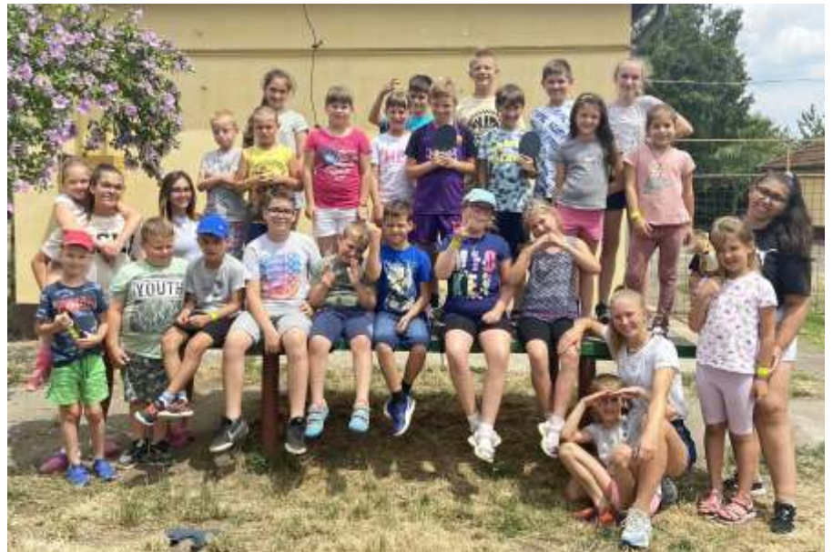
A KÖSSZI tábor résztvevői