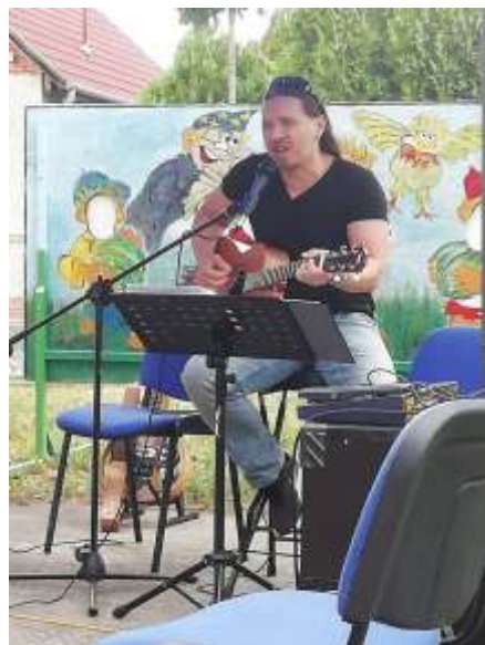
Három óra hosszat tartott a gitározás