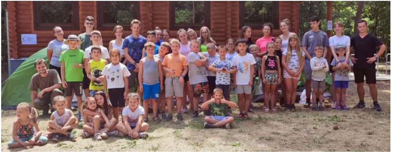
Csapatkép az 1. táborról