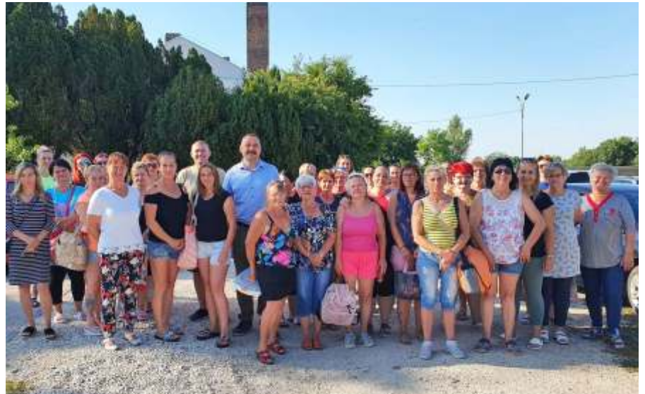
A Zagyvaparti Idősek Otthona dolgozóinak kirándulásán

A szociális ágazatban dolgozók elismerése ezzel még nem ért véget városunkban! Augusztus 27-én ismét megrendezzük a Megbecsülés Napját, azaz a szociális ágazatban dolgozók családi ünnepét, ahol ismét (de nem elégszer) alkalmunk lesz kifejezni tiszteletünket és megbecsülésünket az egyik legjobban terhelt, de