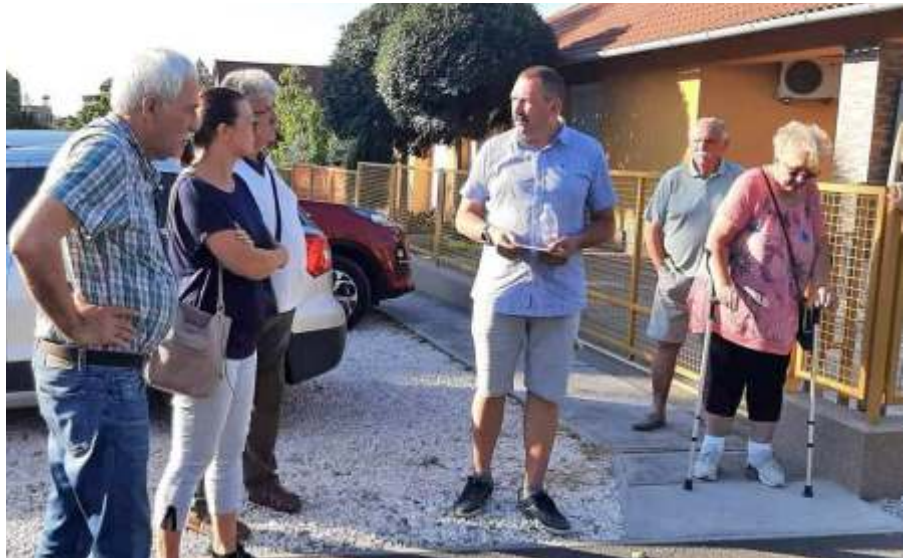
A „Sétáló testületin”

A Zagyva-Ökopark beruházásnak köszönhetően idén is a megépült rönkházban pihenhettek csöppségeink, a projekt keretében beszerzett padok és asztalok