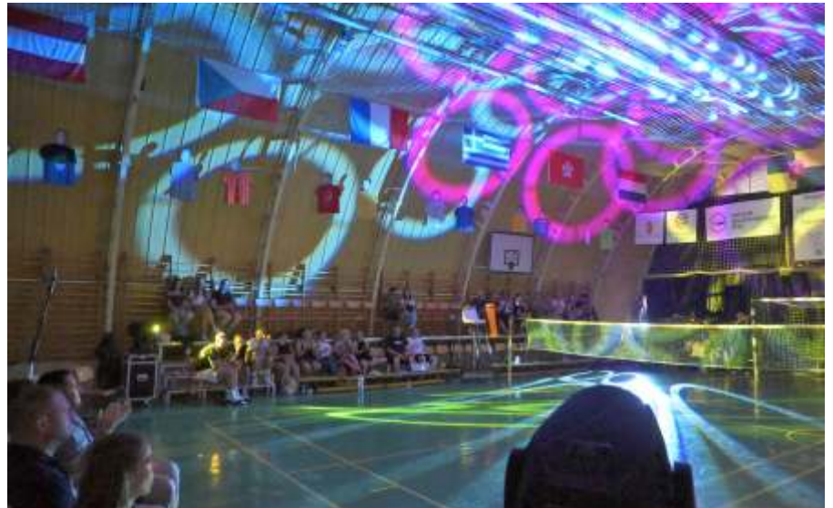
A döntők résztvevői különleges fényjátékra vonultak be