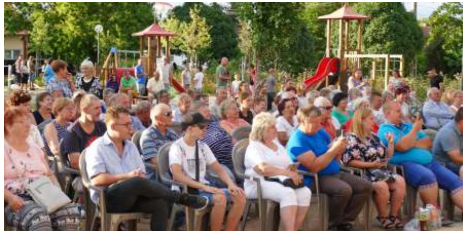
Jól szórakozott a szép számú közönség