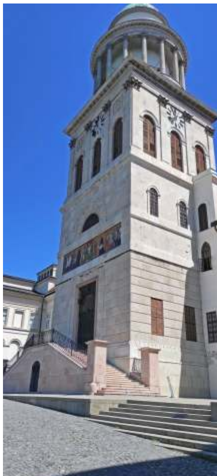
Pannonhalmi Apátság torony

Legismertebb pannonhalmi gyógynövény a levendula, melyet több, mint 5 ha ültetvényen termesztnek. A leszüretelt levendulából olajat, levendulavizet állítanak elő az apátság saját lepárló üzemében, de más bencés monostorok vagy termelők gyógynövényeiből is készítenek illóolajat,