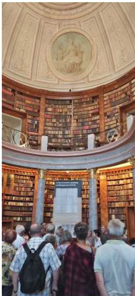
A pannonhalmi könyvtárban

nek nyilvánította, 2004 decemberében Magyar Örökség díjban részesült.