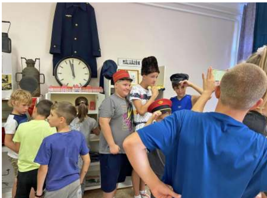
Táborozók vasutas sapkában