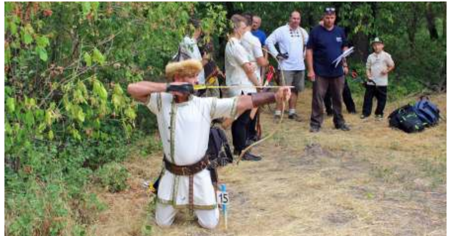
Célzás térdelő helyzetben