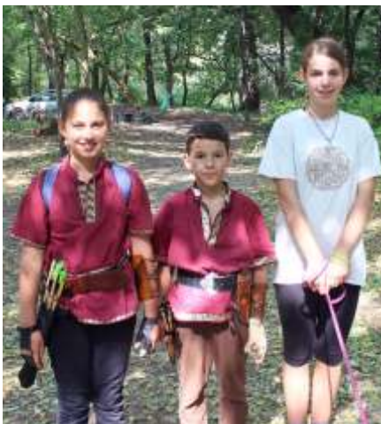
Sok fiatal íjász is volt a résztvevők között