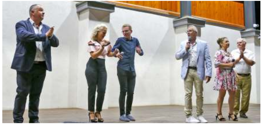
Zenés Nyári Est

Az Újszászi Híradó című helyi lapban régóta publikál, cikkeiben jó néhány olyan helyi lakost mutatott már be, akik valamely régi szakma művelői voltak, de a település történései mellett sem megy el szó nélkül. Emellett tavaly megjelent önéletrajzi könyve, mely helytörténeti és korrajz is egyben. A kétrészes kiadvány első, Adott szó kötelez című része – mint megfogalmazta – életéről, munkásságáról és megpróbáltatásairól szól. A könyv másik felében pedig volt férje, Krassói Tibor története elevenedik meg. Az olvasó így teljes képet kap kettejük különös házasságáról,