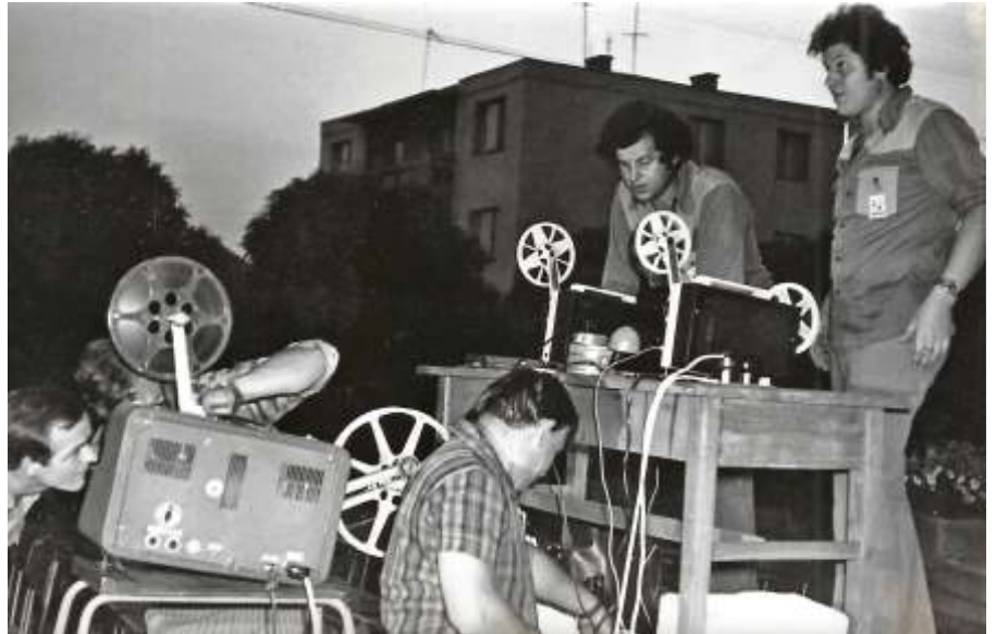
Archív kép az újszászi filmklub vetítéséről. Jobbra a Zérczi testvérek

Tagja volt a Magyar Újságírók Országos Szövetségének. Munkáit tematikus filmfesztiválokon rendre helyezésekkel jutalmazták, elnyerte a Szolnok-Tallin Filmfesztivál fesztiváldíját, valamint a MTV Nívódíjat is. Ahogy a Televíziós Mű-