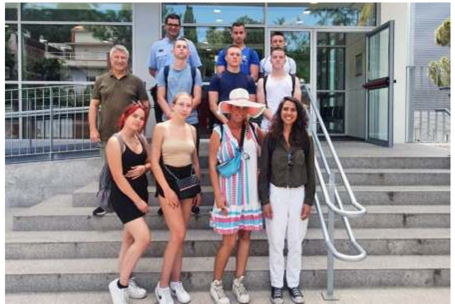
Tibidabo rendőrsége előtt

Végül sikerült megértetni magunkat, néha csak neheze. Egyik este egy buszsofőről kértünk segítséget, de ő csak katalán nyelven tudott. Ahhoz képest nagyjából értettük, hogy mit mondott, mivel egyik tanárunk, aki velünk volt, tudott franciául – ami hasonló a katalán nyelvhez - és ez által tudtuk, mit mond.