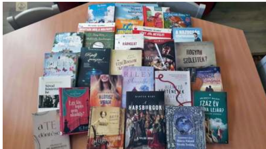
Júliusban is sok érdekes olvasnivalót vásároltunk, vettünk állományba