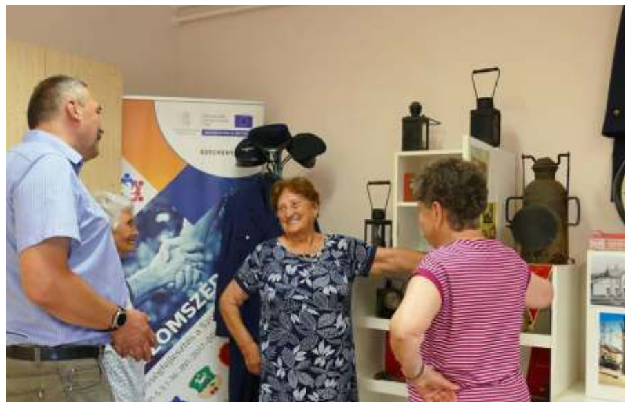
Kiállítás vasutas tárgyakkól