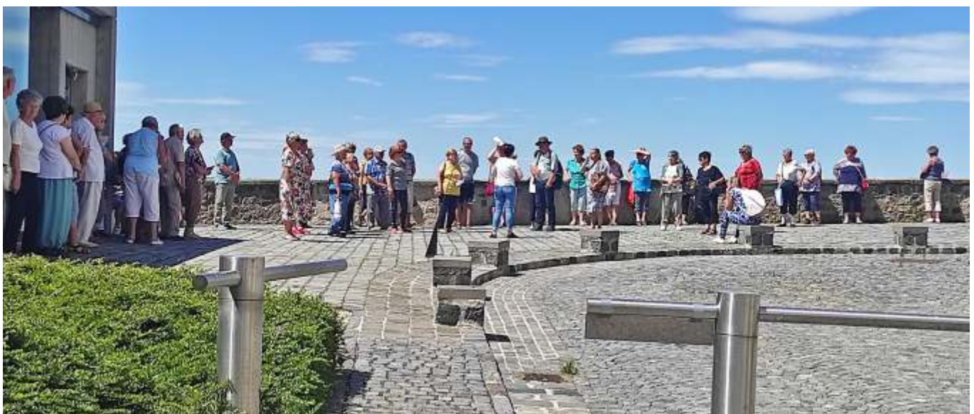
A pannonhalmi kilátóterason

Az elsőként megalapított bencés monostor építését Magyarországon Géza fejedelem kezdte meg 996 körül. Védőszentjéül Szt. Mártont választották. Részletesen megismerhették a bencés szerzetesek ősi otthonának és munkásságának történetét. Az Unesco 1996-ban a Világörökség részé-