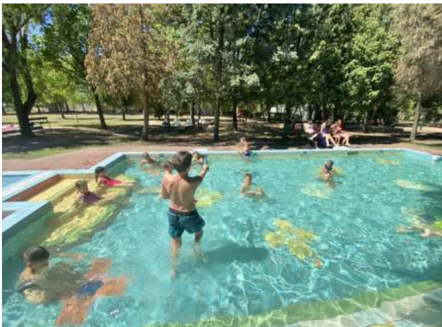
A jászboldogházi strandon