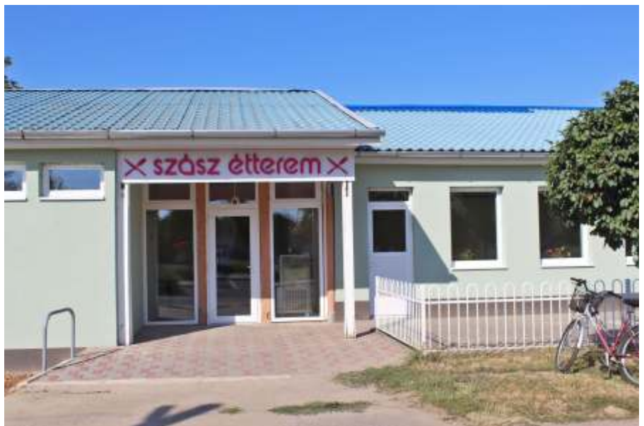
Az új Szász étterem