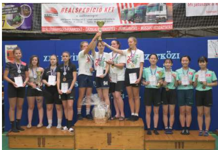
Női csapat: 2. Pusztaszer PISZE SE-Újszászi VVSE, 1. Újszászi VVSE, 3. Hongkong