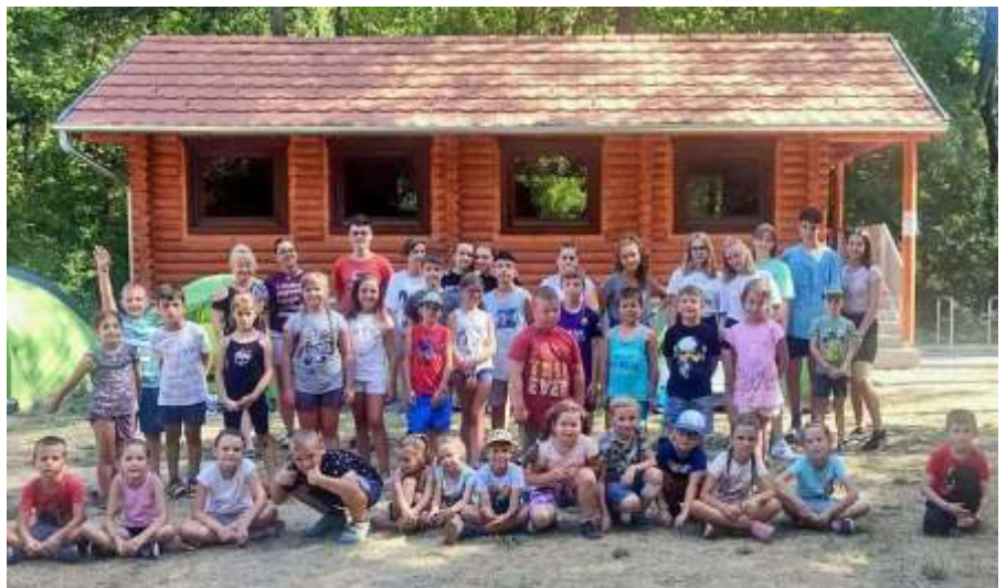
A Gyere tábor résztvevői