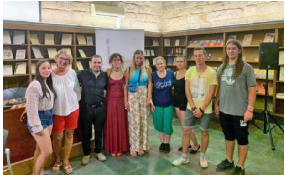
Catalunya legnagyobb könyvtárában a gitárest művészeivel

Megnéztük Catalunya fontosabb tereit, látnivalóit, jártunk a Museu de la Ciència i de la Tècnica de Catalunya nevezetű közlekedési múzeumban, a Jardí del Museu nevezetű tengerészeti múzeumban, a Picas-