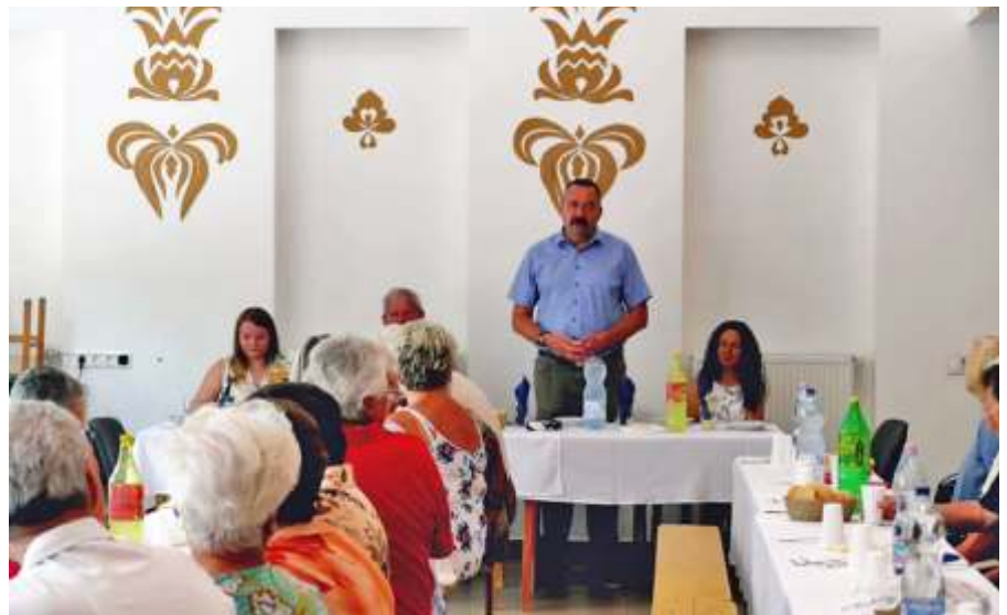
Az Újszászi Vasutas Egyesület Vasutasnapján