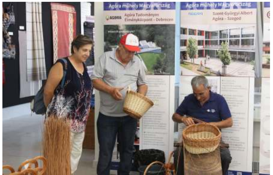
Kosárfonást is bemutatnak, oktatnak a Nemzeti Művelődési Intézetben