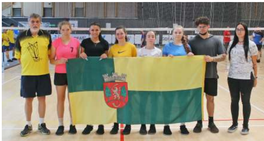
Újszásziak a French Openen