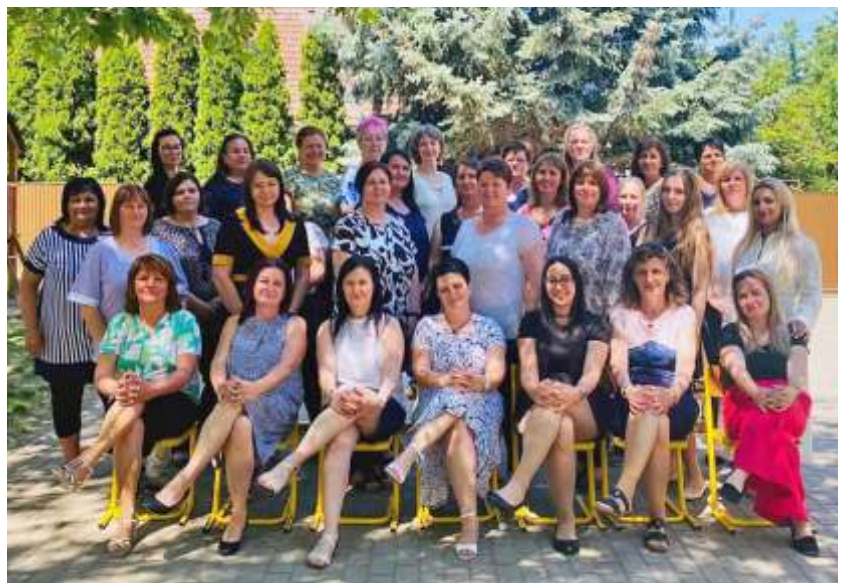
Pedagógusnap az óvodában