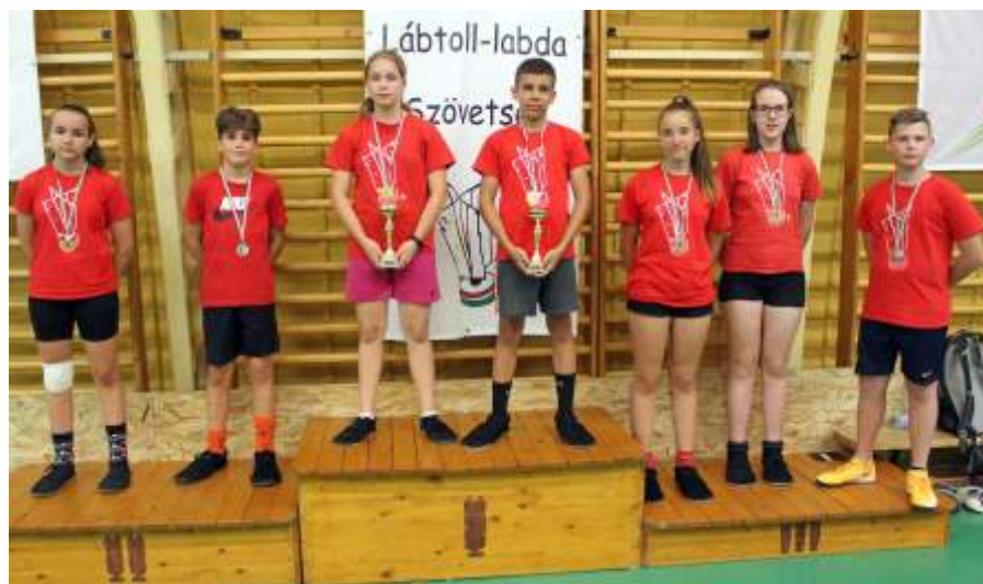
A gyermek vegyes párosban csak újszásziak álltak a dobogón