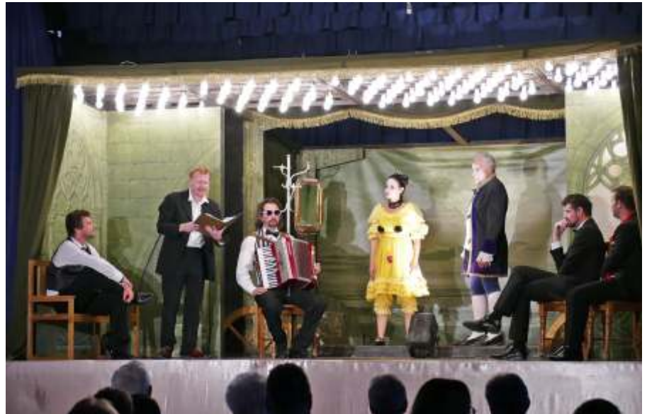
Sokszereplős jelenet a Játék a kastélyban előadásból