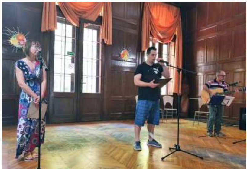
Zenés Nyári Színház a Szent Márton Görögkatolikus Szolgáltató Központban