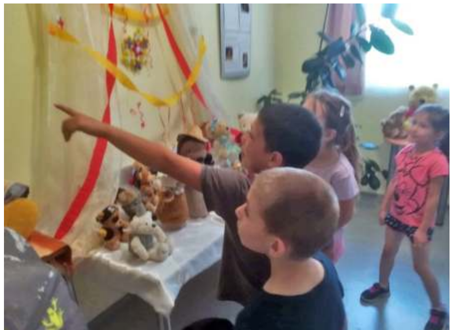
Az 1.a látogatása a Mackó világban

9-én vette át a megyei könyvtárban, Szolnokon. Erről olvashattunk a szoljon.hu oldalon: