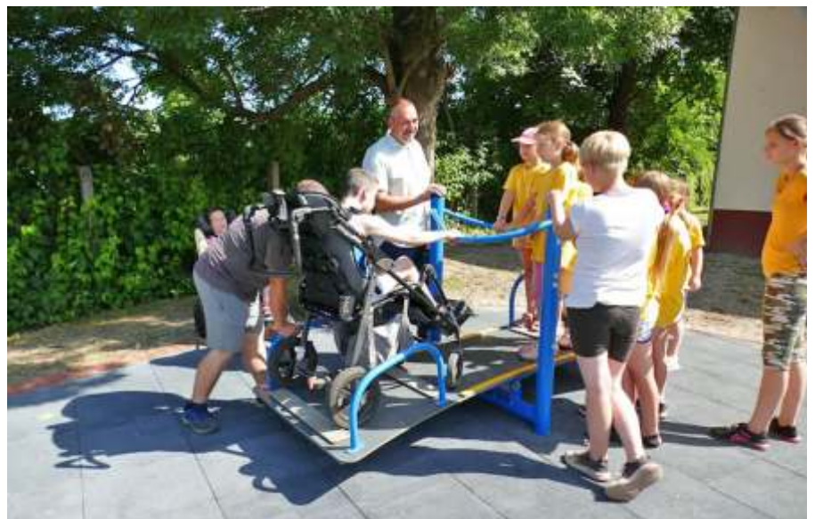
A gyerekek birtokba vették az akadálymentes játszóparkot