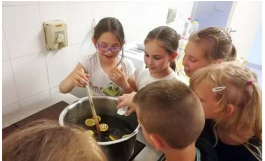
Bodzaszörp készült a másodikosok ÖKO-szakkörén

A 6.b-ek Eger várát és városát vették egy napra birtokba, ahonnan élményekkel telve értek haza. Az 5.b, 7.b és 8.a osz-