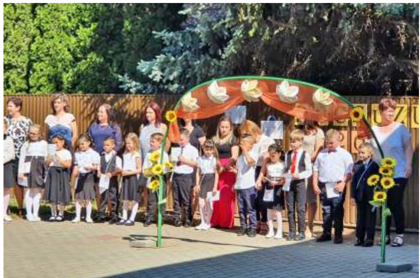
Ballagás a Bajcsy úti óvodában