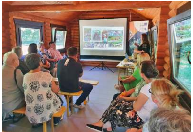
Települési találkozó

Művelődési Házunk tartalmas programokkal, jó rendezvényekkel várja a nyarat. Kérem, figyeljék az intézmény híradásait!