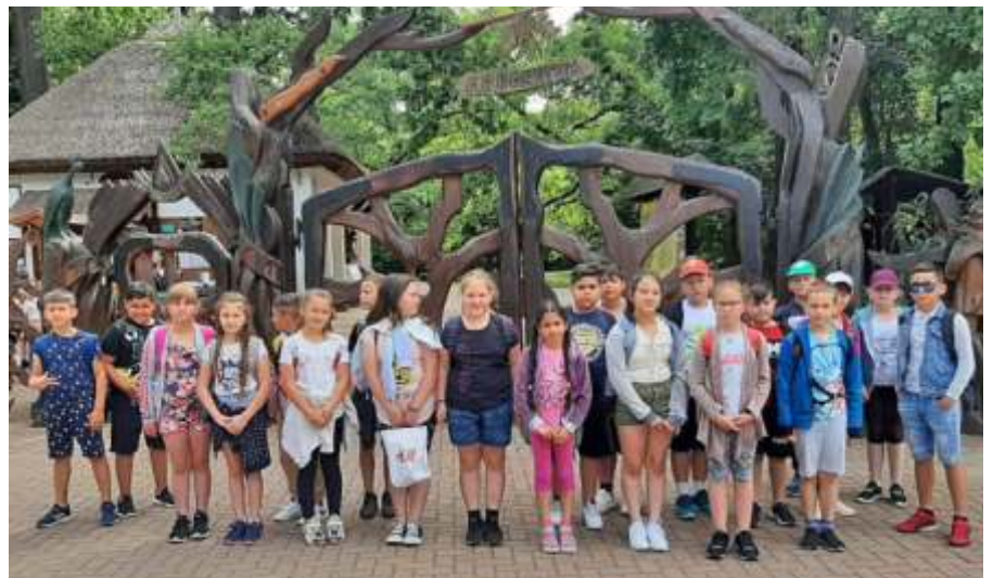
Szarvason a 3.b