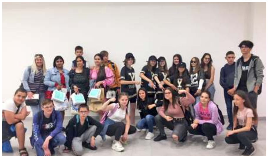
Kirándul a 7.a