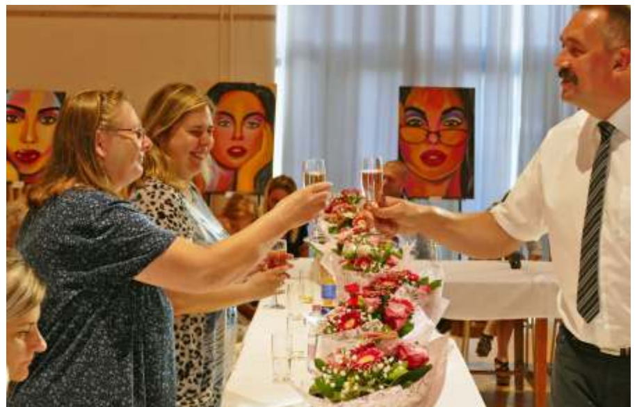
Ünnepi koccintás