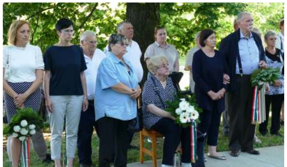
Koszorúzó a Nemzeti Összetartozás Napján