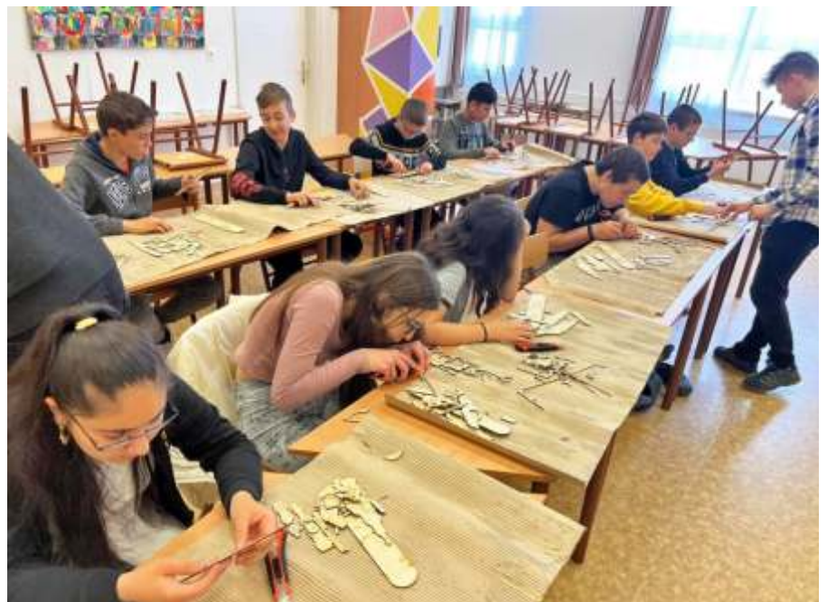
Készülnek a repülőgépmakettek a rendhagyó technika órán

Május elején 7. osztályos tanulóink rendhagyó technika órákon vettek részt, ahol az ügyes kezűek a Szolnoki Szakképzési Centrum munkatársainak irányításait követve készíthettek egy-egy repülő makettet, amelyet aztán haza is vihettek. A gyerekek egy másik csoportja a mikroszkóp használatát sajátította el, így egy különleges mikrovilágba nyerhetett bepillantást. A vállalkozó szelleműek