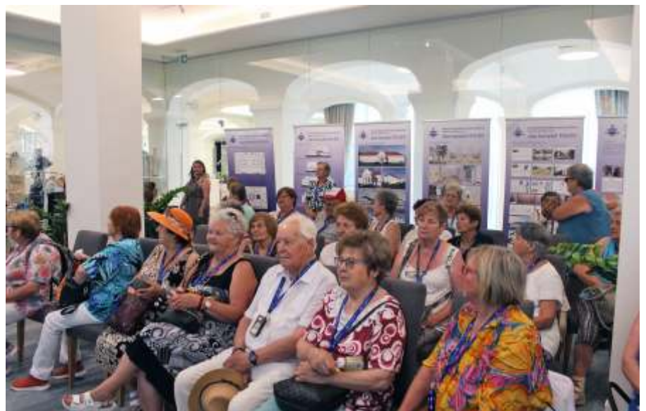
Az újszászi csoport a Beke Pál teremben