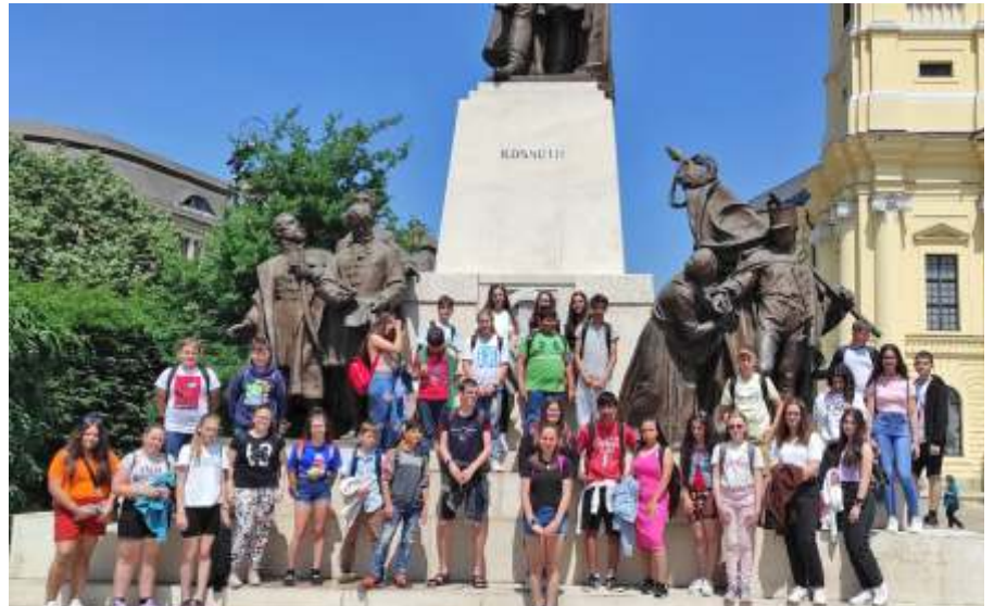
Debrecenben a 6.a és a 8.b