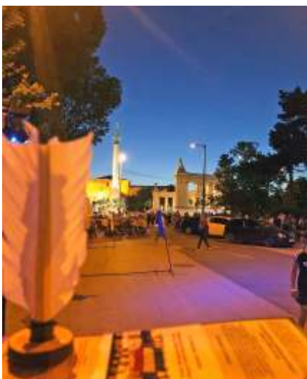
Megvilágított lábtoll-labda, háttérben a Hősök tere

A női csapat két mérkőzést nyert: Újszász – Marseille Paris 5-0, – Plumfoot Bag 5-0, és három mérkőzést veszett 5-0-ra Vietnam 1, Haspe 1 és a Stracciatella ellen.