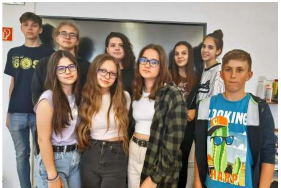
ECDL bizonyítványt szereztek