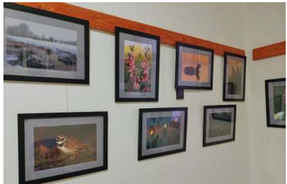
Látványos természetfotók

Sokan nem tudják ezt városunkban.