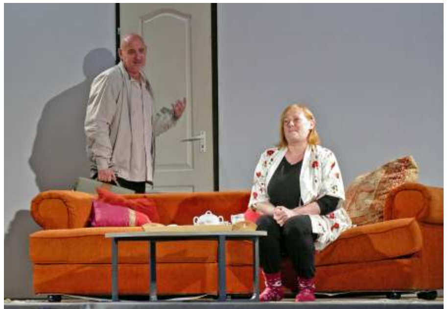
Részlet A boldogság, avagy élet 50 fölött előadásból

azonban másnap minden megváltozott. A közös reggeli elfogyasztása után, mikor Alexandre már éppen indult volna a Kéleti pályaudvarra, az ajtót kulcsra zárva találta.