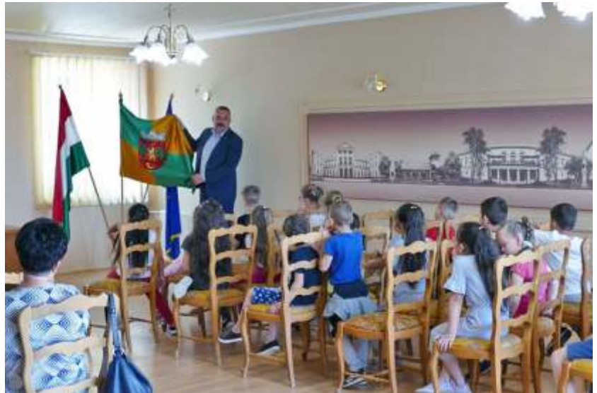
Ballagó óvodások látogatása a polgármesteri hivatalban

Összefogásunk eredményeként az intézmény új padokat és asztalokat vásárolt, a vállalkozó napernyőket telepített, míg önkormányzatunk karbantartó csoportja korlát gyártásával és telepítésével tette komfortosabbá a megközelítést.