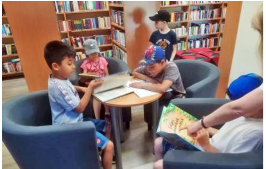
Fiatal olvasók