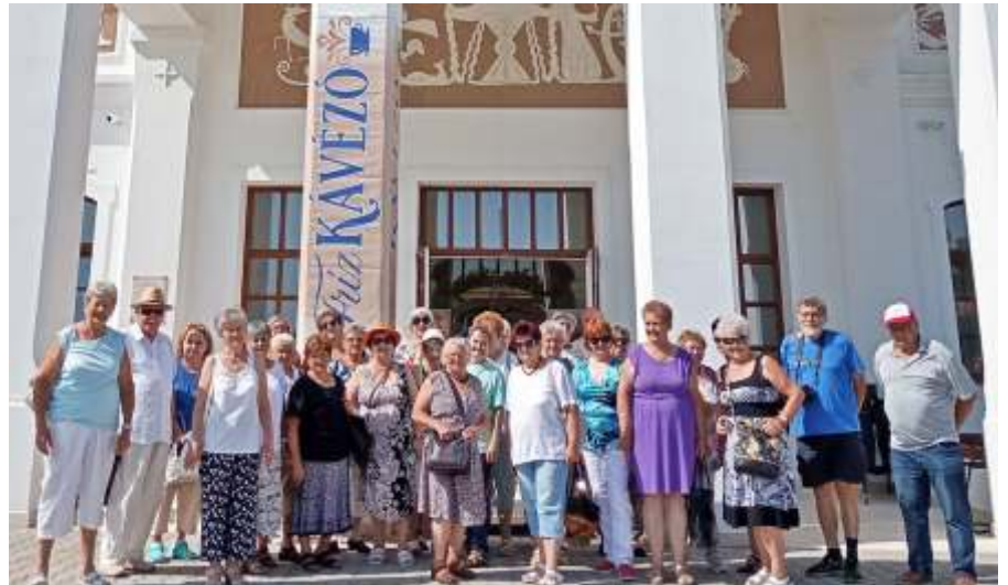
Az újszászi csoport a Nemzeti Művelődési Intézet előtt