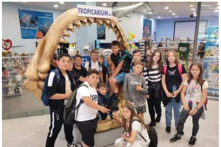
Az 5.a a Tropicariumban (Rajka Attila)