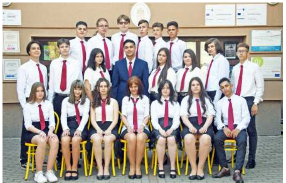
A 8.a

magában a vonulásban a véges végtelenség és a majdani megérkezés reménye.