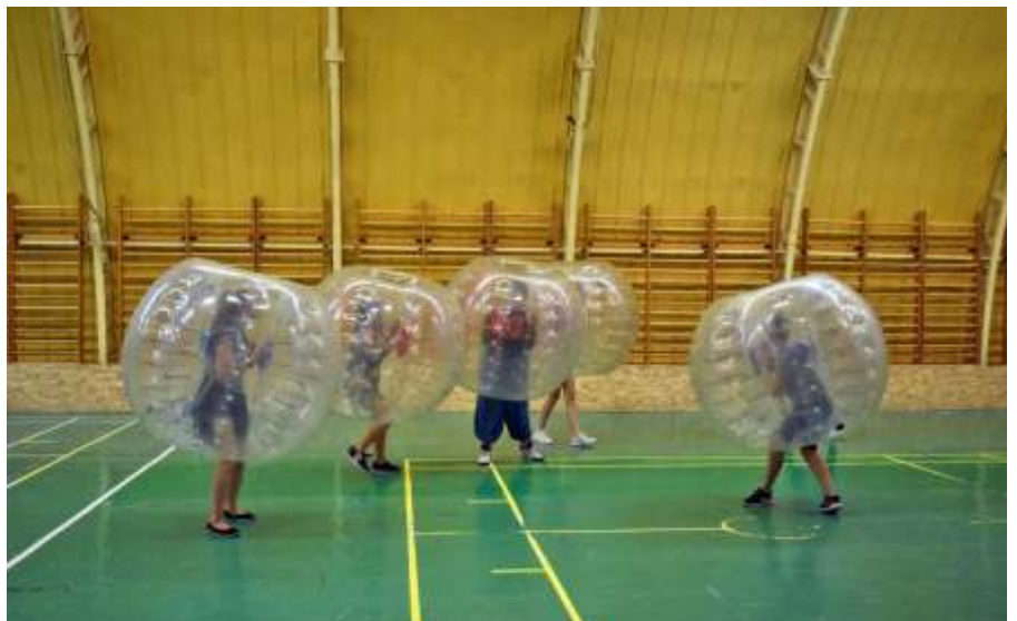
Jó buli a buborékfoci