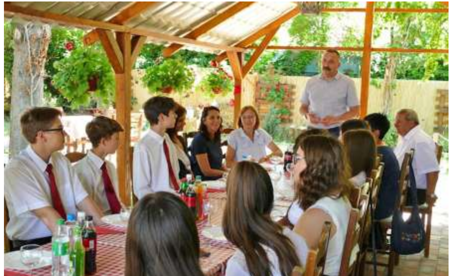
Ebéd a jó tanuló, jó sportoló nyolcadikosokkal

Amennyiben újszászi lakosként gyermekük táborozása anyagi okokból hiúsulna meg, kérem, keressenek bizalommal. Minden esetben megpróbálunk megoldást találni a problémára!