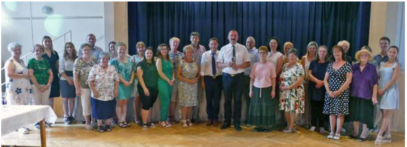
A Semmelweis-nap résztvevői