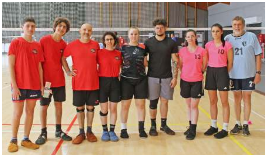
Győzelem az olaszok ellen