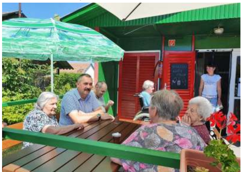
Beszélgetés a Zagyvartéri Idősek Otthona felújított kisboltjának teraszán