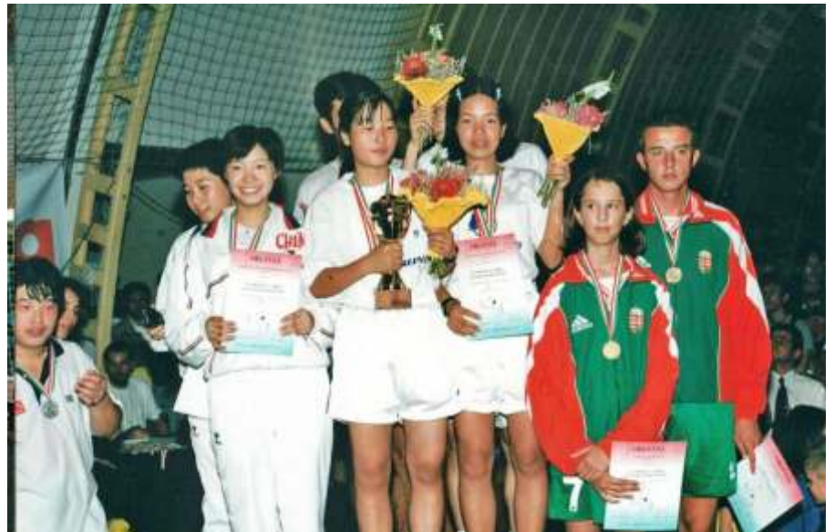
Újszászi bronzérmes a vegyes párosban