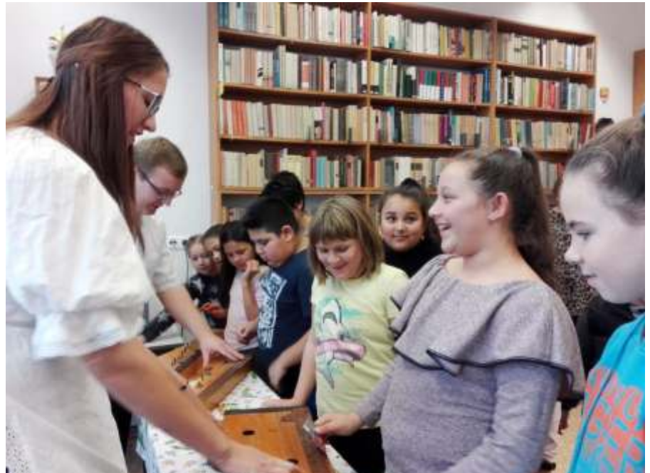
A citera népszerűsítése a helyi általános iskolában