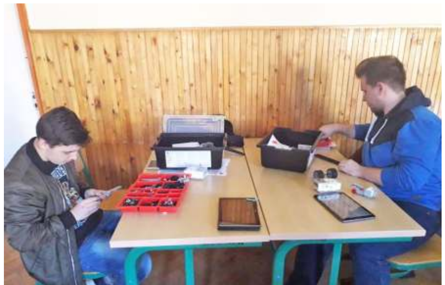
Lego robot szakkörön

dupla lábtoló gép átdolgozza, erősíti az izmokat. Használják tanulóink a kombinált sétáló és oldalsó láblengetőt. Az eszköz átmozgatja az izomcsoportokat, fejleszti a mozgáskoordinációt, segíti a tüdő és szív egészséges működését. Ezek a gépek hozzájárulnak a napi testedzés feltételrendszerének javításához, és a szabadidő hasznos eltöltéséhez.