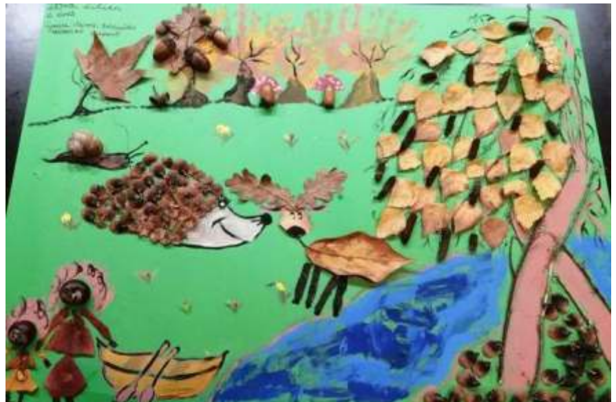
Erdői történet