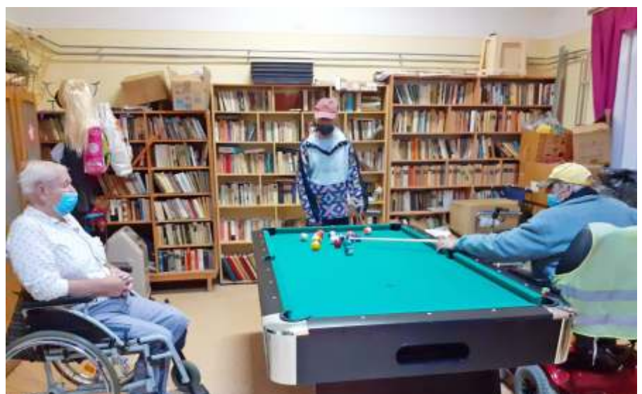
Népszerű a lakók körében az új biliárdasztal

Április 10-én indította az Idősekért Alapítvány a „Kedves Péntek” programot azzal a céllal, hogy a Covid-19 járvány ideje alatt a dolgozók felé fordulva egy kis