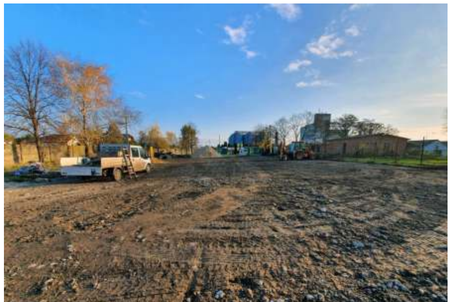
Készül a kamionparkoló (Fotó: Facebook)

belső kamionparkolót létesít. Annak elkészüléséig a Sas út csatlakozásánál található, kamionokat várakozásra kényszerítő jelzőlámpát az útsatlakozástól távolabb helyezi, és a tartós várakozásra kényszerített teherautókat a vasútállomás melletti rakodóterületre irányította át.