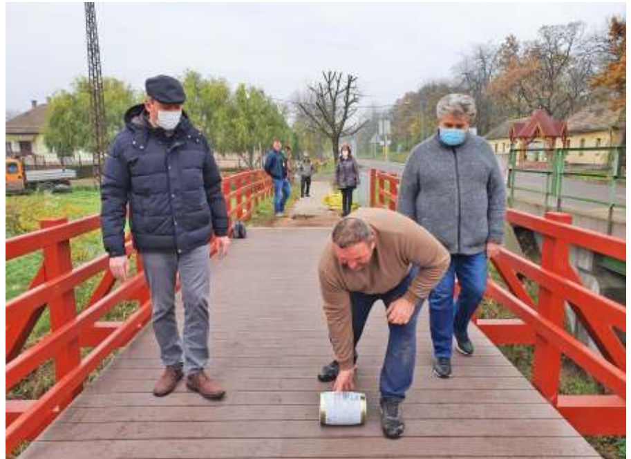
Hídavatás