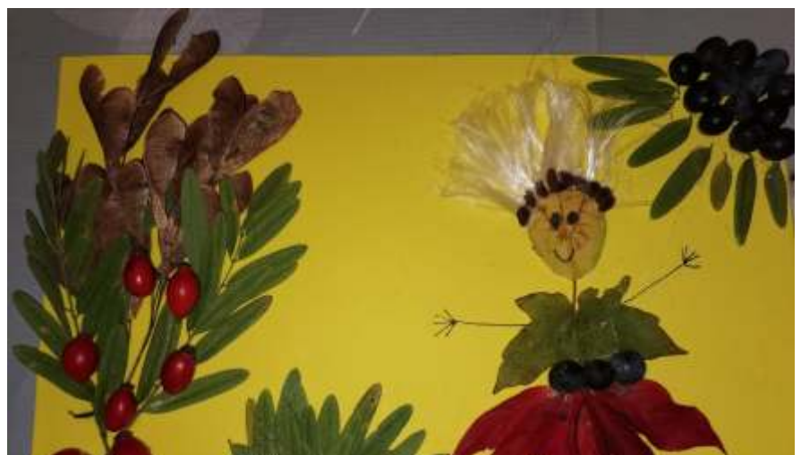
Erdői tündér