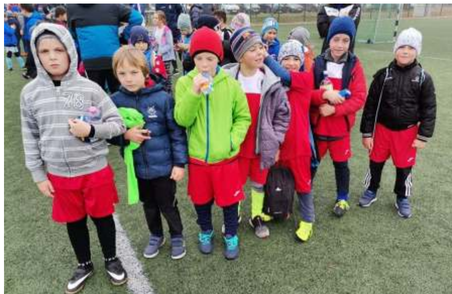
Az újszászi U9-es csapat

A három utolsó fordulót már nem sikerült lejátszani – Mezőtúr, Jászfényszaru, Fegyvernek –, pedig jó lett volna a gólkülönbségünket is kihozni pozitívrá. Verebes