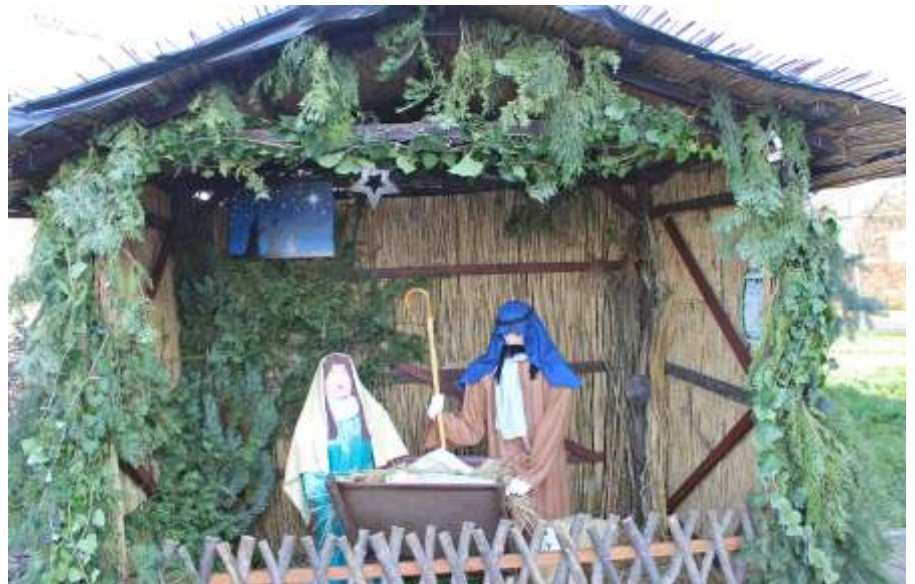
Betlehem a Fő téren

Novemberben ismét csatlakoztam az Idősekért Alapítvány által életre hívott