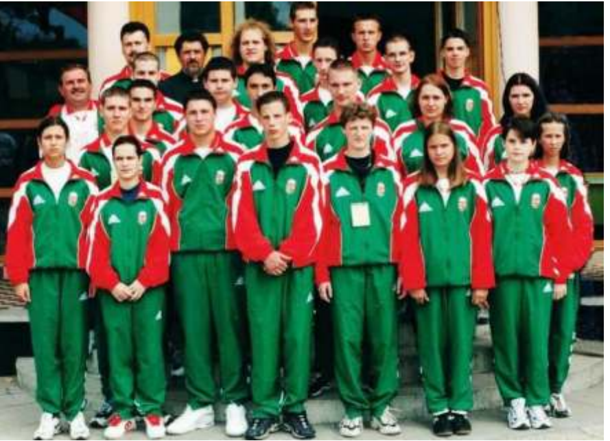
A magyar láb-toll-labda válogatottban 16 újszászi játszott

„Üres a Tornacsarnok. A Szász Vendégházba is visszatért a törzsközönség. A kollégiumban már egy táncszobor résztvevői gyülekeznek. Elmentek a mosolygós vietnamiak, a kíváncsi tajvaniak, a kimértnek látszó, de amúgy barátságos finnek. Mindenki elutazott. Mi maradt itt nekünk? A Tornacsarnok izzó hangulatának, a dörgő vastapsnak, a káprázatos játéknak az emléke. Az elutazók köszönete, elismerése, a láb-toll-labdázás népszerűsödése, Újszász ismertségének növekedése, a kábeltv-hálózat kiépítésének megkezdése. Bizonyítékok arra, hogy egy kisváros is tud nagy dolgokat csinálni, ha sokan összefognak. Ez az összefogás kellene a hétköznapiakon is. Egy kis sportág 1. világbajnokságát rendeztük. Nagyvárosban sok pénzből talán még nagyobb, csillogóbbat lehetett volna rendezni. Itt mindenki a szívét adta a versenyhez. Köszönet érte mindenkinek, a helyi és a vidéki támogatóknak, az újszászi önkormányzatnak, a Szász Vendégháznak, a középiskolának, valamennyi rendezőnek és segítőnek és nem utolsósorban a lelkes nézőknek, akik igazi világbajnoki hangulatot teremtettek. Lehet, hogy soha többet nem lesz Újszászon világbajnokság, mert kínó bennünket a sportág, de ne feledjék – mint ahogy a világ összes láb-toll-labdázója is tudni fogja –, hogy a láb-toll-labdázás 1. világbajnokságát 2000. július 15-től július 20-ig Magyarországon, Újszászon rendezték.”