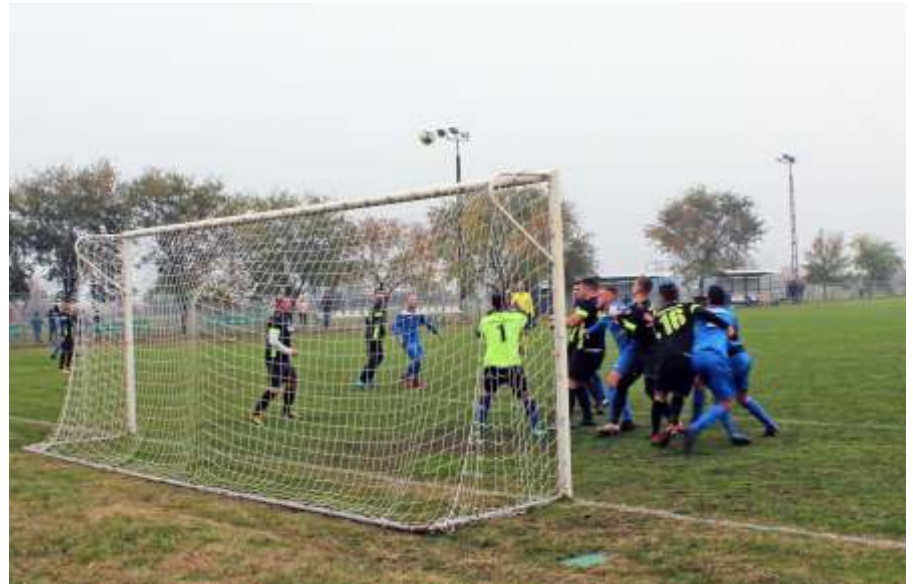
Támadás Jánoshida ellen