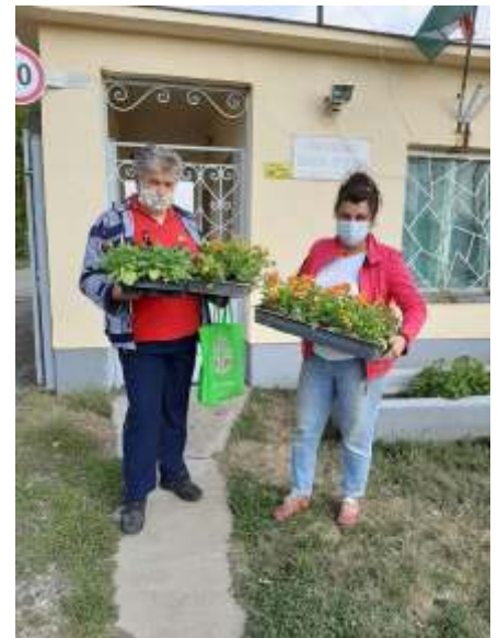
Virágpalántákkal érkeztek a képviselők

A hűvös időjárás miatt a közkedvelt szabadtéri programok egy része beszo-