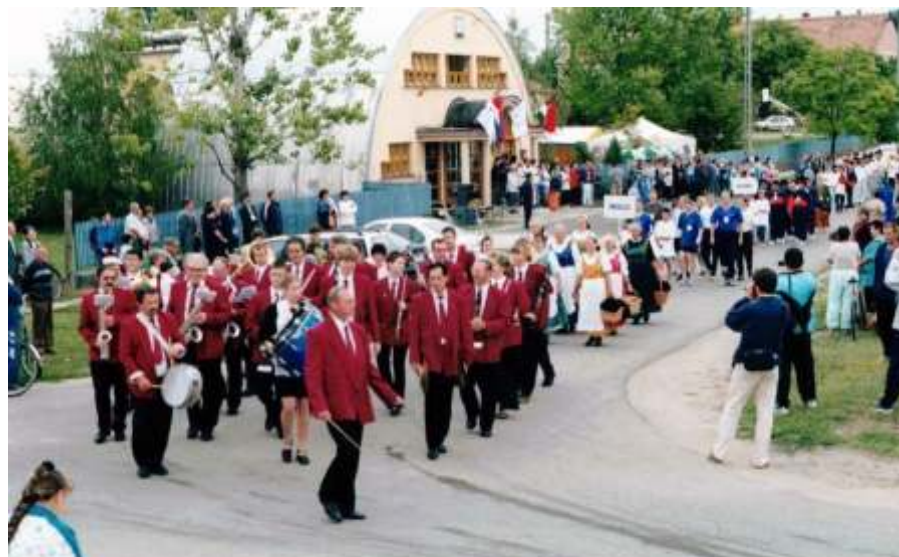
Zenés felvonulással kezdődött az első lábtoll-labda világbajnokság

Az ISF elnöksége felkérte Magyarországot az első világbajnokság megrendezésére. Magyarország a 6500 lakosú Újszászon rendezte meg a világeseményt. Újszásznak a Hungarian Openek rendezésében már voltak nemzetközi tapasztalatai, már akkor is sokan lábtoll-labdáztak Újszászon, és a népes