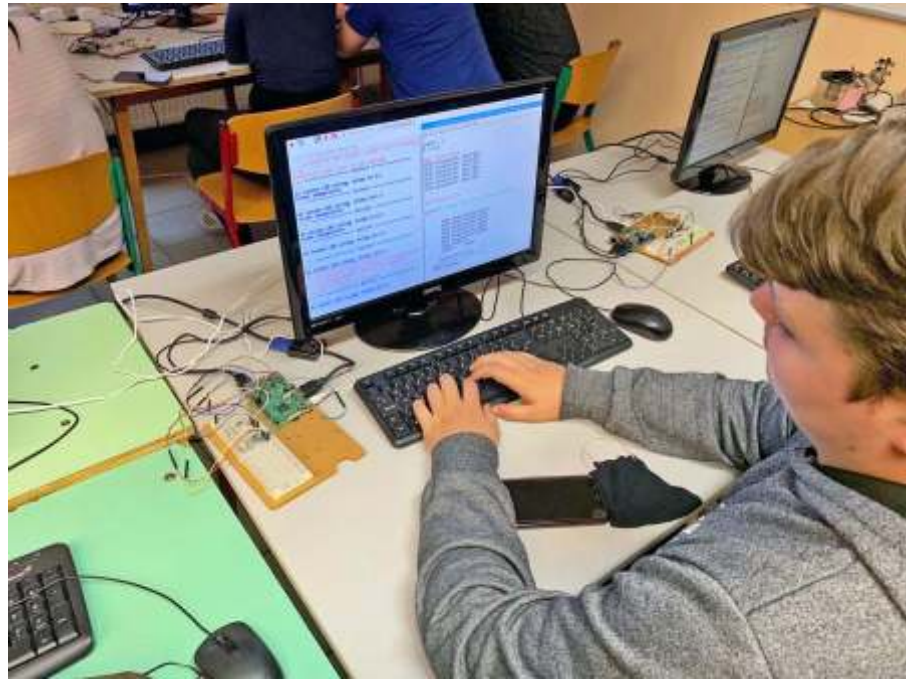
Programozás a Raspberry laborban

Tanulóink jól felszerelt Raspberry laborban tanulhatják meg az eszköz használatát, programozását, és megvalósíthatják saját ötleteiket. Mindeközben ismerkednek az elektronika, vezérléstechnika alapjaival, a python programozási nyelvvel, a programozás munkamódszereivel, a tesztelés, hibakeresés gyakorlati lépéseivel.