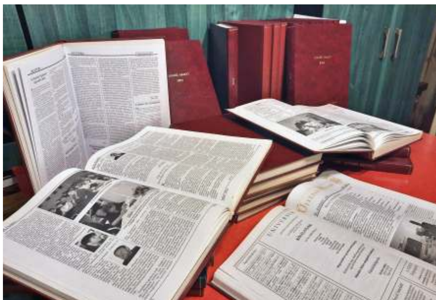
Újszász 30 éve harminc kötetben

Felelős szerkesztő: Fehér Judit ♦ Olvasószerkesztő: Fehérmé Szekeres Zsuzsanna ♦ Tördelőszerkesztő: Kovács Nándor ♦ Szöveg bevitel: Kovács Márton ♦ Állandó tudósítók, munkatársak: Fehér János (sport), Szurmai Tibor (sport), Varga László (sakk) ♦ Nyomja: 750 példányban ReproStúdió –Szolnok. ♦ Nytsz: B/PHF/505/SZO/90 ♦ Levél cím: 5052 Újszász, Könyvtár Damjanich út 2. WEB: www.ujaszaz.hu Email: ujaszazhirado@gmail.com , Facebook: www.facebook.com/ujaszazvarosonkormanyzata