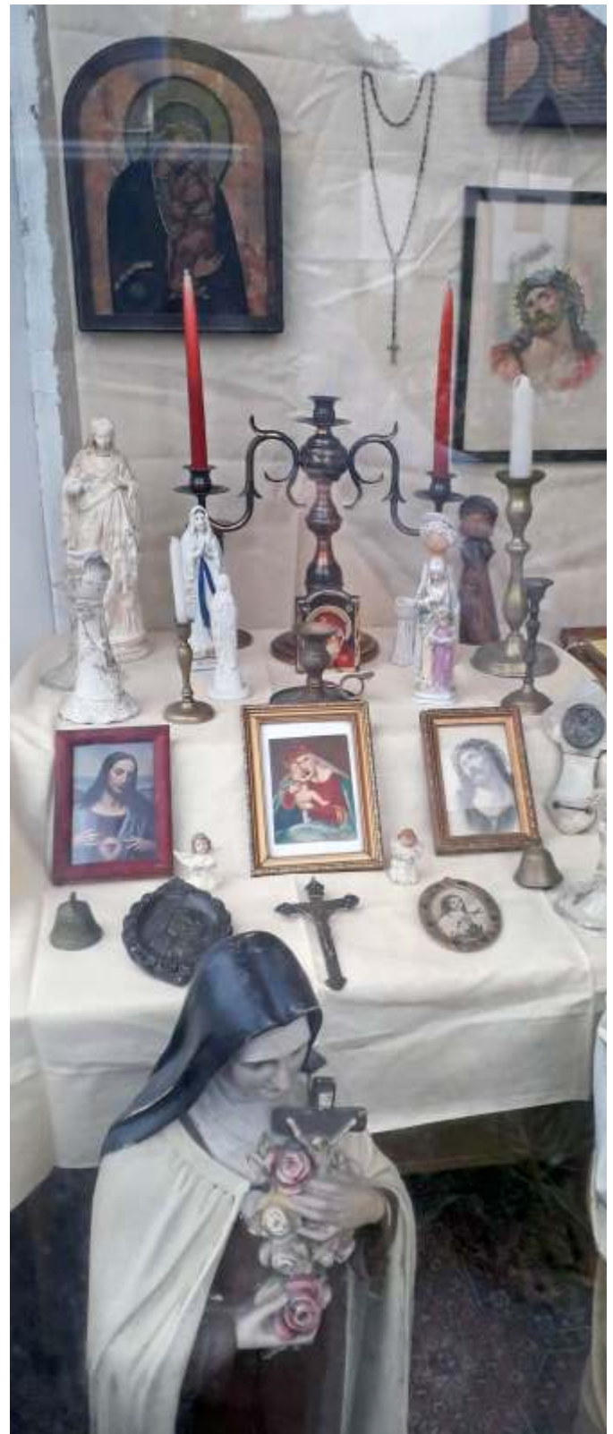
Hitéleti tárgyait

A kölcsönzési határidő a korábban és az újonnan kölcsönzött dokumentumok esetén automatikusan meghosszabbodik a veszélyhelyzet megszűnéséig. Ez idő alatt és ezt követően 30 napig késedelmi díjat nem számíttunk fel.