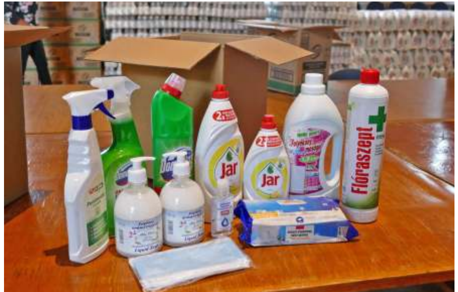
Közel 2000 db tisztítószer csomagot kaptak a rászoruló családok