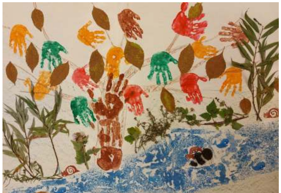
Levelek és tenyerek