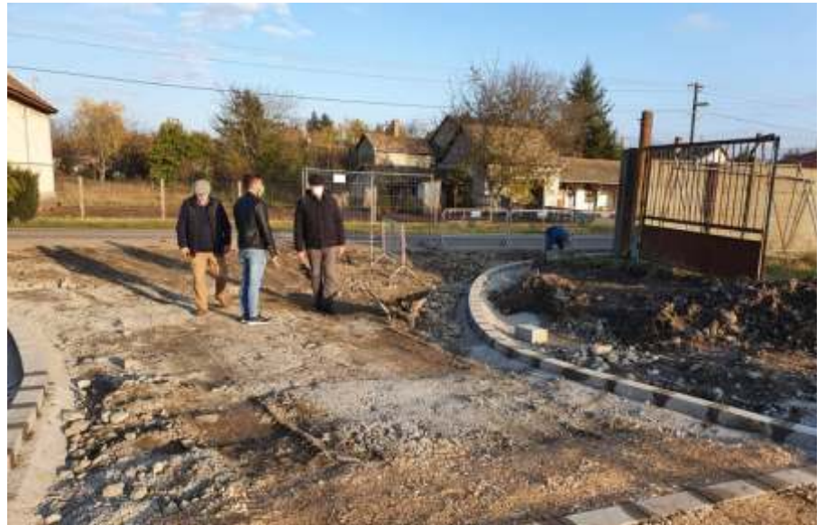
Terepszemle a Zrínyi úton

Ezzel egyidőben várakozni, illetve teherautóval megállni tilos táblákat helyeztünk ki a Zrínyi út Jász úttól Béke körülig terjedő (sűrűn lakott) szakaszán. A Bonafarm vállalta, hogy saját területén