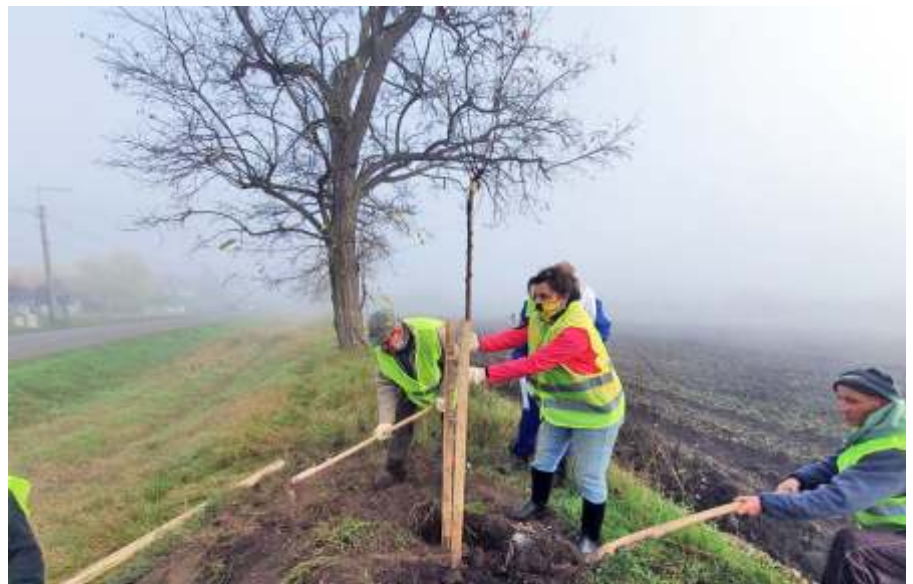
Faültetés