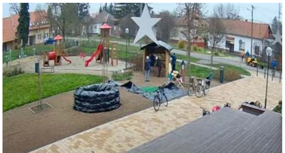
A Fő téren zajló események online is láthatóak