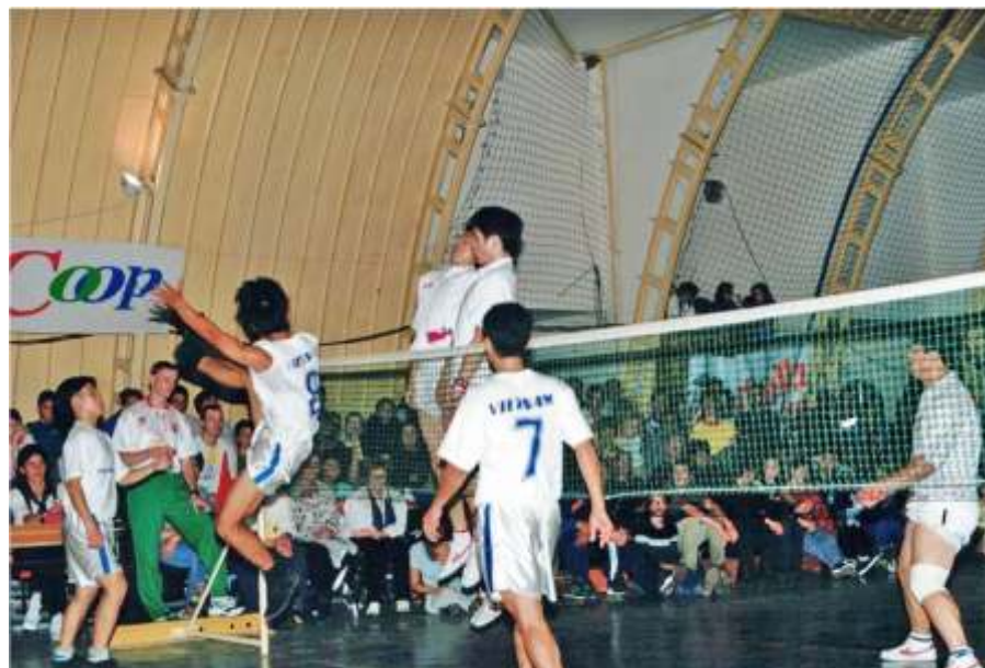
Vietnam - Kína férfi csapatdöntő

rendezőgárda is szívügyének tekintette a sikeres rendezést.