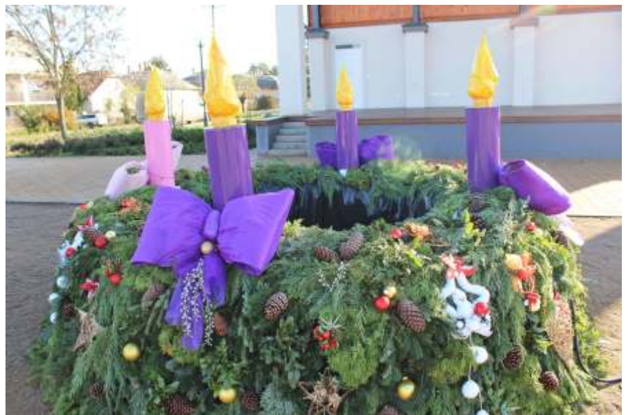
Az adventi koszorú