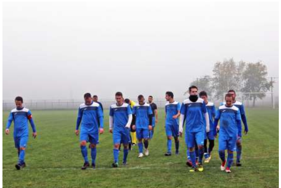
Győzelem az utolsó mérkőzésen