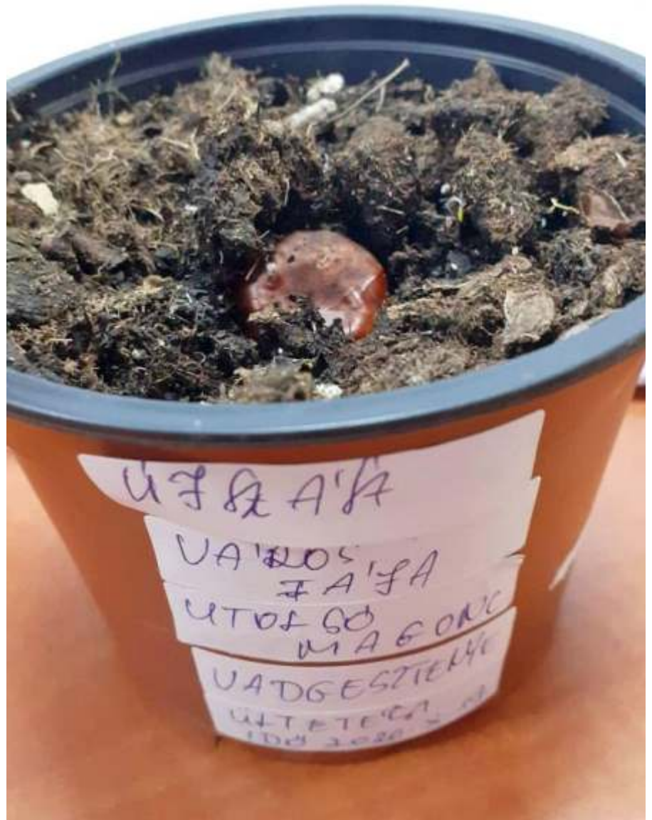
Az utolsó magonc

Ősszel szomorú látvány fogadta értékmentő kis csapatunkat. A Vörösmarty-fa idén szokatlanul korán elvesztette teljes lombozatát. A fölé nőtt környező fák levelei szinte színesedni sem kezdtek még, de ő már kopáran, betegen és megtörten várja az elkerülhetetlenül közeledő őszt. Legalább egy órát kutattunk ikertörzsei alatt, levelenként vizsgálva át minden egyes négyzetmétert, bokrot, mélyedést. Kutatásunknak végül (mint a történelem során már annyiszor) a női kéz szerencséje hozott eredményt. A hatalmas fatörzsek alatt egyetlen apró gesztenye lapult megbújva a lehullott levelek jótékony takarásában. Az elmúlás útjára lépett Vörösmarty-fa talán utolsó gyermekét sikerült megtalálnunk.