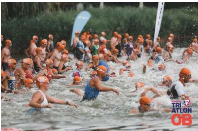
Az úszás rajtja Tatán