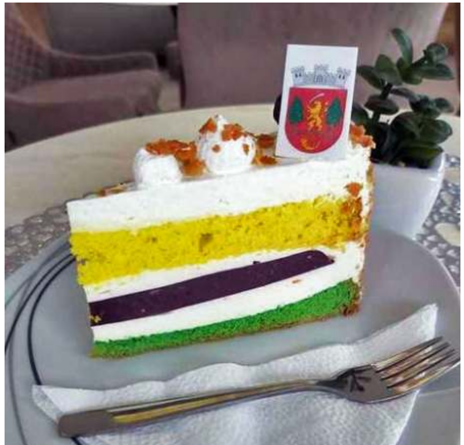
Egy szelet Újszász tortájából

– Ennek ellenére örömmel vállaltam a feladatot, ami elsőre igazi kihívásnak tűnt, de végül könnyen jöttek az ötletek,