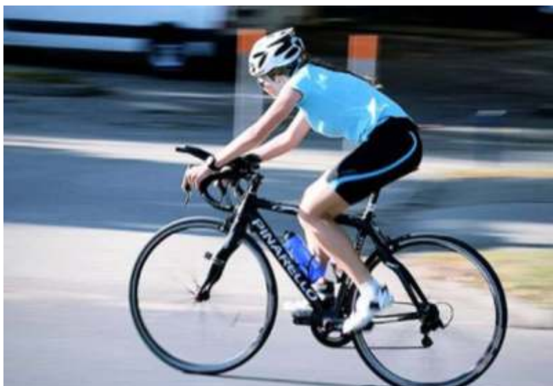
Ajkán, a Rövidtávú Duatlon Országos Bajnokságon