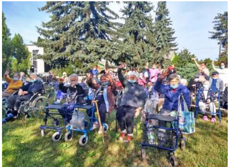
Az Idősek Világnapján

Október 1-jén nem ért véget az idősek- ről való megemlékezés, hiszen október egyben az idősek hónapja is. Ennek je-