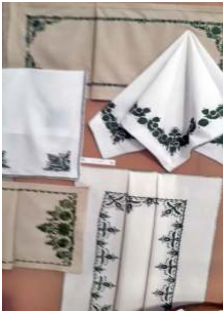
Jászhímzéssel készült terítők a kiállításon