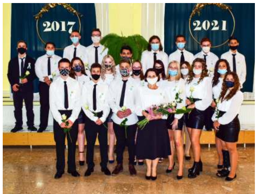
12. D