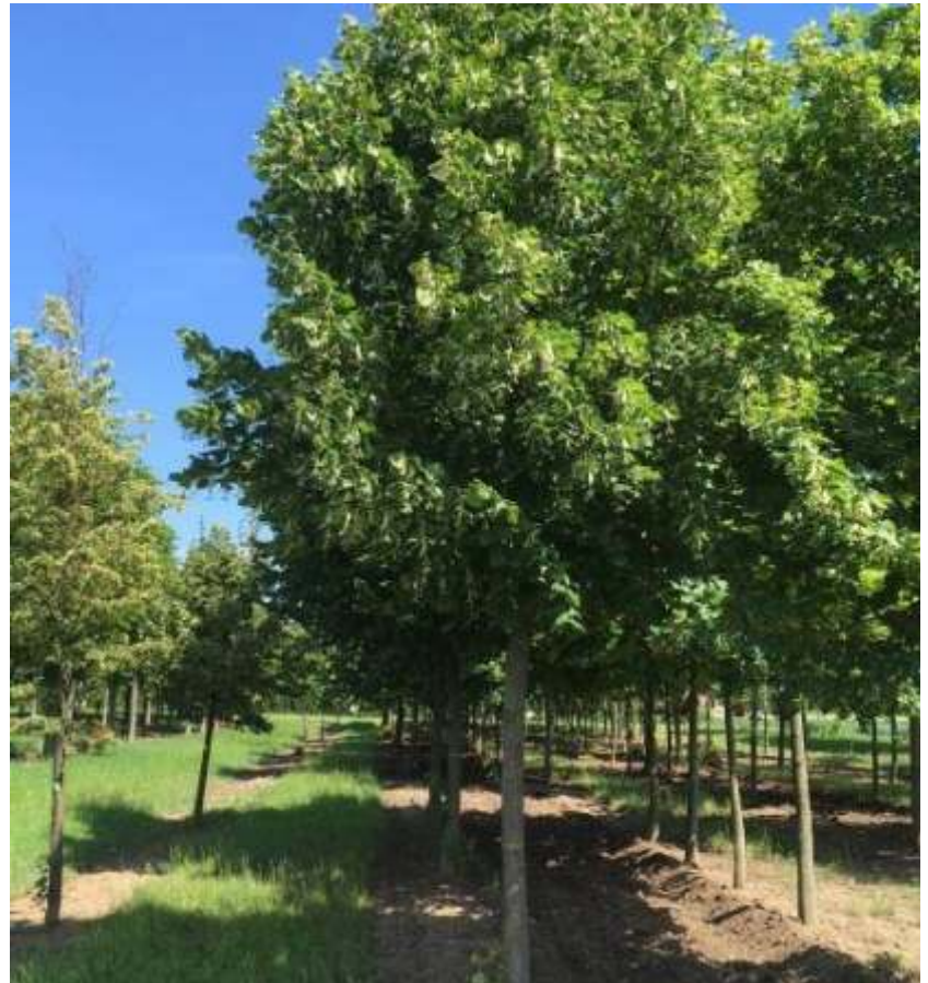
Negyvenen ültethetnek amerikai hársfát

Minden nyertesnek örömteli fagondozást kívánunk. A remélhetőleg szépen növekvő fácskákkal persze mindannyian nyerni fogunk. Hiszen az általuk tisztított jó levegő, a hús árnyék mindannyiunknak hasznára válik.