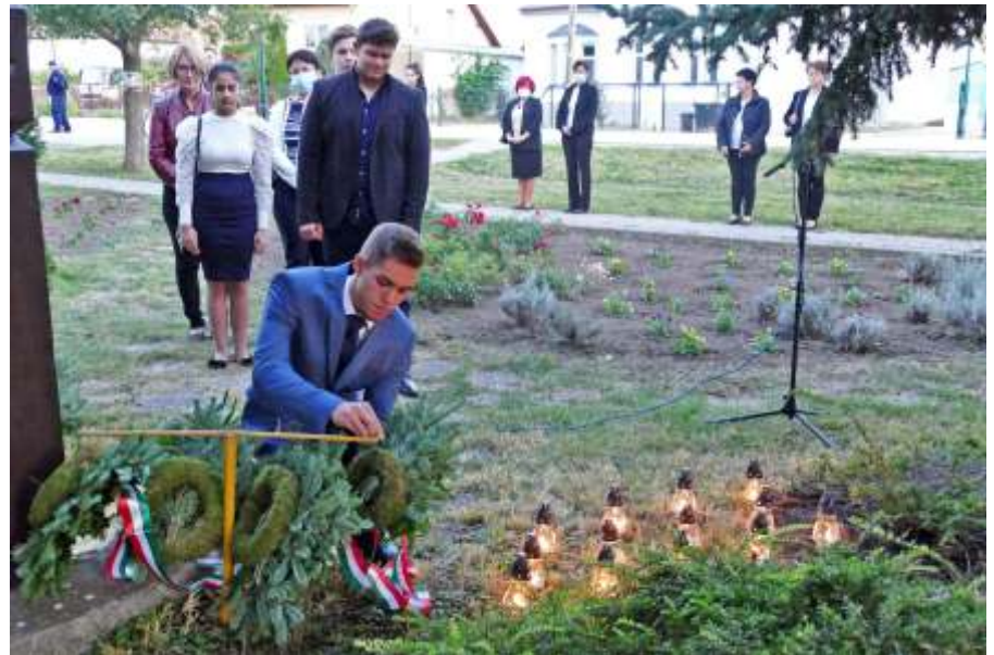
A középiskola koszorúzója