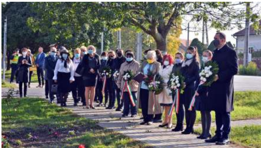
Az október 23-i ünnepségen

2020. november 03-án Magyarország miniszterelnöke veszélyhelyzetet hirdetett.