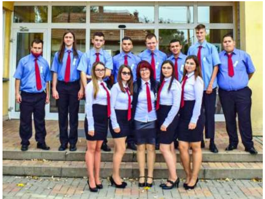
12. C