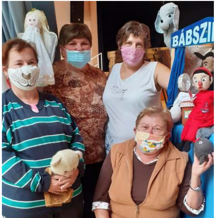
A Szamóca Bábcsoport tárlatrendezés közben