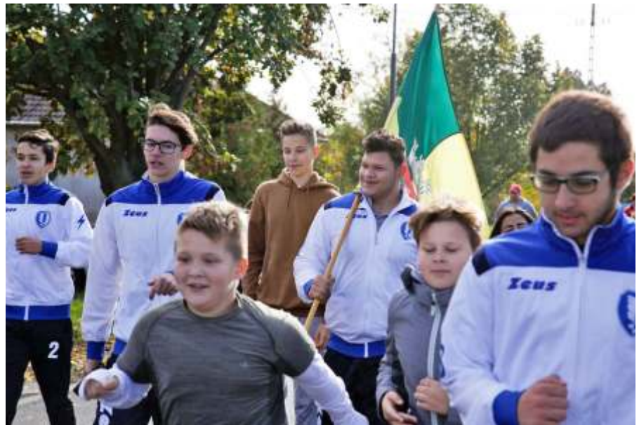
Futással avattak

S akkor megállunk és csodálkozunk, tátott szájjal báméskodunk, csodáljuk azt a rejtelmes rendet a sok út szövevényében,