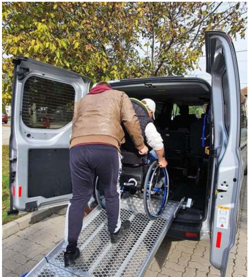
Az akadálymentes mikrobusz

Czakó Nóra nora.czako@mediaworks.hu szoljon.hu 2020.10.30.