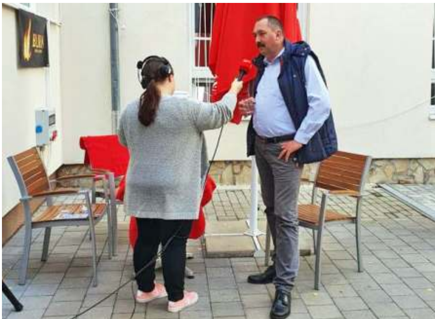
Nyilatkozat a Kossuth Rádióknak

Az adás hanganyaga elérhető a mediaklikk.hu weboldalon, és hamarosan elérhető lesz a Városi Művelődési Ház youtube csatornáján is.