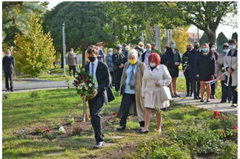
Az általános iskola koszorúzó

És elmegy sok ember előtte: A Katona, ki szíven döfte, A Farizeus, ki eladta, Aki háromszor megtagadta. Vele mártott kezét a tálba, Harminc ezüstpénzért kínálta S amíg gyalázta, verte, szidta: Testét ette és véréit itta – Most áll és bámul a sok ember, De szólni Hozzá senki nem mer.