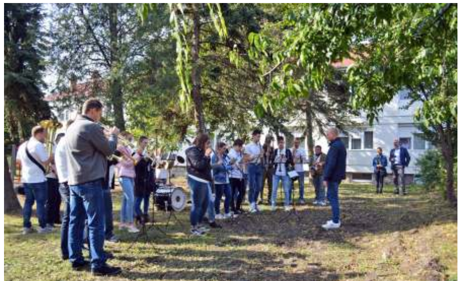
Koncert az Idősek Világnapján a Zagyvaparti Idősek Otthona kertjében