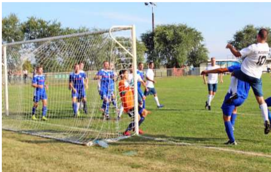
Újszász – Jászárokszállás 0-0

A 9. forduló szabadnapja után azt a Tószeget láttuk vendégül, aki ellen mindig kiélezett csatákat vívunk. Az összecsapás külön pikantériája, hogy ellenfelünknel több, korábban Újszászon is megfordult játékos (Nagyistván Ádám, Szabó Attila, Pongrácz Martin, Héja Dávid és Viola Kálmán edző) szerepelt. A várt nagy küzdelmet hozta a mérkőzés, amelyen korán, már a 4. percben hátrányba kerültünk. Ezután mezőnyben egyenrangú ellenfe-