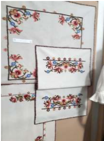
Kunhímzéssel készült terítők a kiállításon