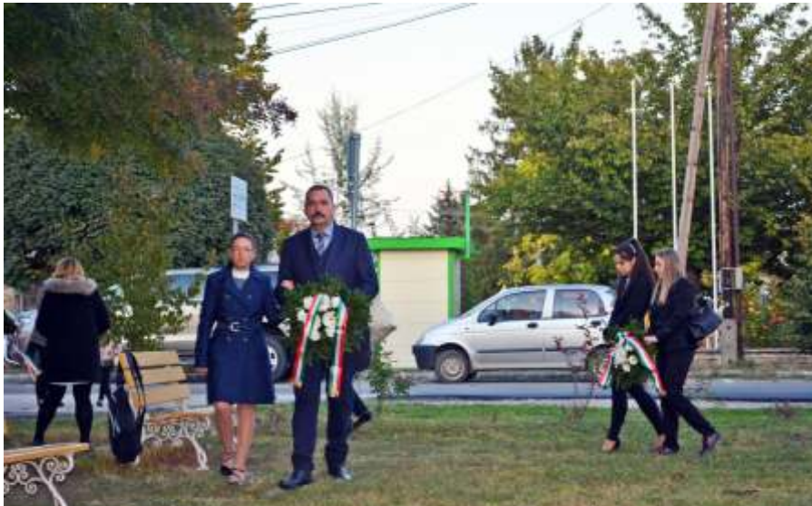
Koszorúzás október 6-án