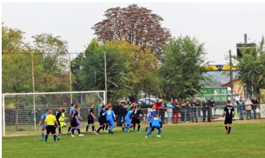
Az egyenlítő gól előtti szöglet Tószeg ellen