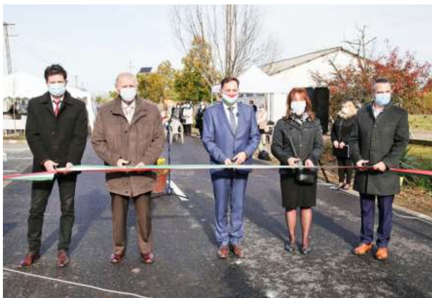
Felavatták a felújított József Attila utat