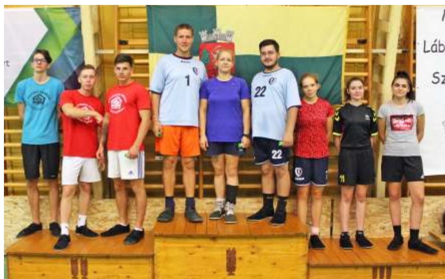
A #BEACTIVE Kupa legjobb csapatai