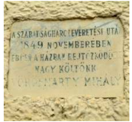
A megkopott emléktábla

„A fejgörcsök embere azt az utolsó tizenkét órát arra használta fel, hogy elővette százhusz legfőbb vádlott perét, ítéletet hozatott benne. Az ítélet mindnek