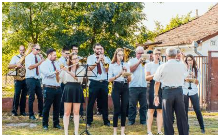
Az Alföldi Olajbányász Fúvószenekar