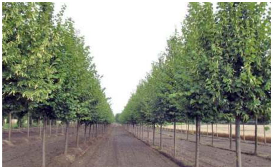
Az őszi fásítási programban 100 db fát ültetnek az újszászi utcákra és közterekre