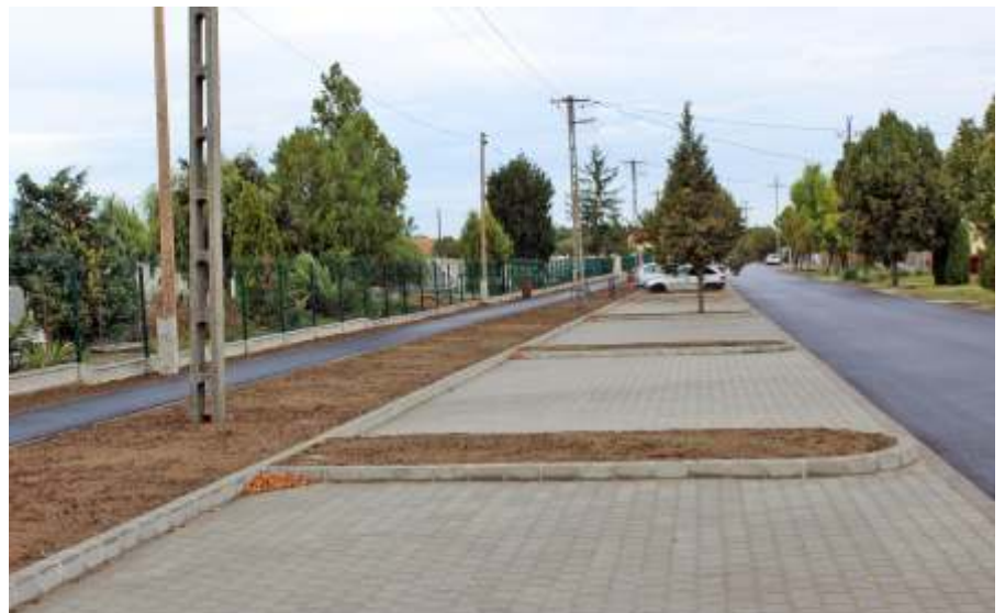
Új kerítés, új járda, új parkoló és széles út