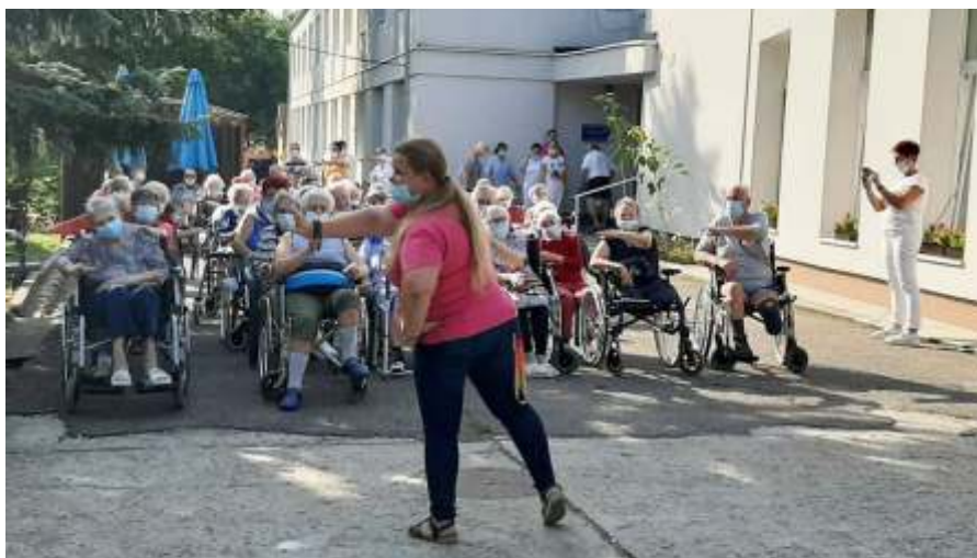
A „Táncoljunk együtt a demenciával élőkért!” programon