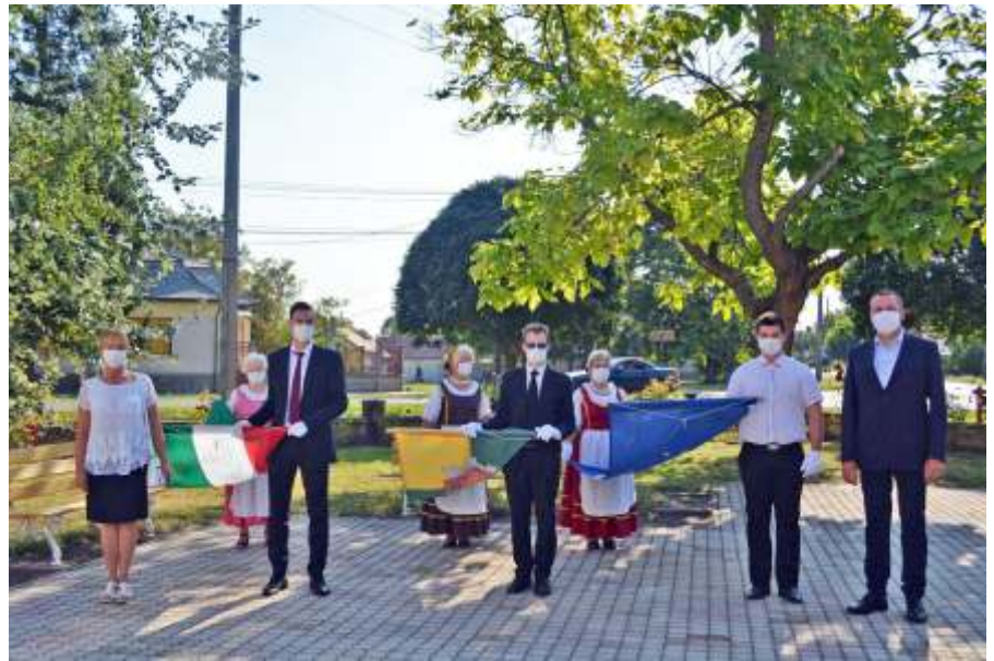
Zászlófelvonók a Város Napján

Szeptember eleje sajnos a napi esetszámok drasztikus emelkedését hozta magával. A szeptember 3-án ülésező újszászi operatív csoport egyetértésével ezért szeptember hónapban önkormányzatunk nehéz szívvel, de valamennyi nyilvános rendezvény lemondása mellett