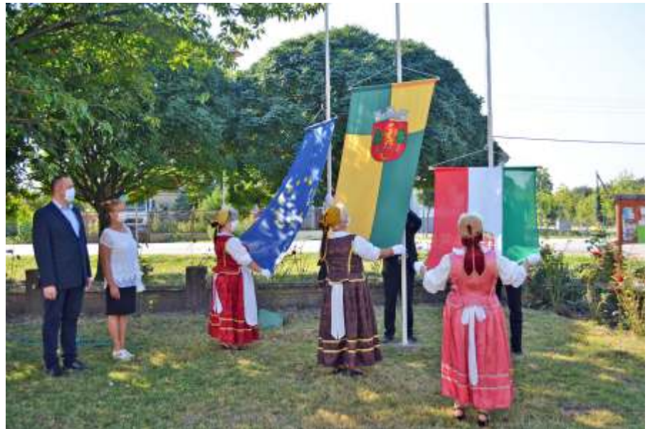
Zászlófelvonással kezdődött a Város Napja (Juhász András Nándorné)

A Városi Művelődési Ház és Könyvtár online programokkal készült a jeles napra. Minden korosztály számára próbáltunk programokkal kedveskedni. A gyermekeknek rajzpályázatot hirdettünk, ami nem várt népszerűségnek örvendett. Szinte minden elsős gyermek lerajzolta kedvenc újszászi épületét, kedvenc újszászi helyszínét, kedvenc emlékét, amit a városban élt ált. Nagy sikert aratott még a Városi Könyvtár munkatársai által megszerkesztett VárosKvíz is, az újszászi puzzle-t is sokan kirakták, de a virtuális főzőversenyre is érkeztek be képek.