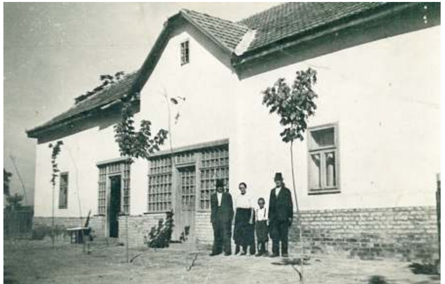
Az újszásziak a volt gazdatiszti házat Vörösmarty háznak nevezik

dolog mellett akkor egy szódásüveg is összetört.