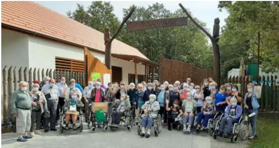
Kirándulás a szolnoki vadsparkba