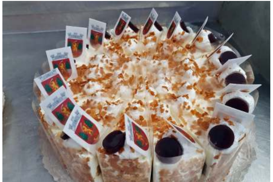
Újszász Város tortája

Szűk körben megtartott ünnepélyes zászlófelvonás, művelődési ház online vetélkedői, 24 minikoncert. Úgy érzem, Újszász Város Napját a nem várt kihívások és korlátozások mellett is méltó módon sikerült megünnepelnünk. Köszönöm a Városi Művelődési Ház, a Városi Könyvtár és az Újszász Városi Önkor-