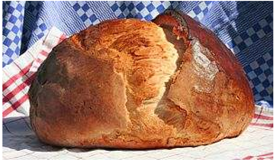
3 kilogrammos kemencében sült magyar kenyér

Ezt a mindennapi kenyeret még a háború után is sokáig otthon sütöttük. Örülök, hogy sokszor nekem jutott ez a feladat. Ha a naptárban nem volt piros betűs ünnep, egy kicsit mégis ünnepnek számított a kenyérsütés napja, mert csak komolyan, felkészülten lehetett elvégezni. Rendszerint pénteken sütöttünk egy hétre való az egész családnak. A munka azonban már előtte való nap elkezdődött a liszt kimérésével, vajlingba szitálásával, majd a kovász beáztatásával, ami a kenyér pékhez való beje-