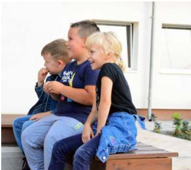
A kicsik is jól szórakoztak

A tombolahúzás közben már javában folyt a művelődési ház egyik klubtermében az elkészült ételek zsűrizése. A Szomszéd-kvízben a Vasutas-SOKK , a házisütemény-versenyben Apó Ferencné , a sertéspörkölt kategóriában pedig Újszász Csapata nyerte el az első helyezettnek járó kupát.