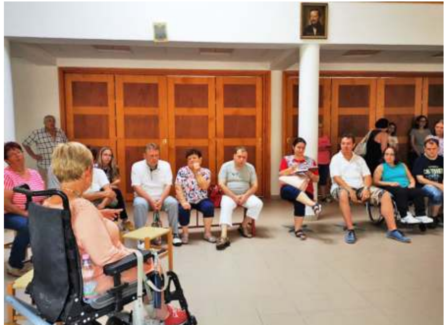
A fotókiállítás megnyitóján