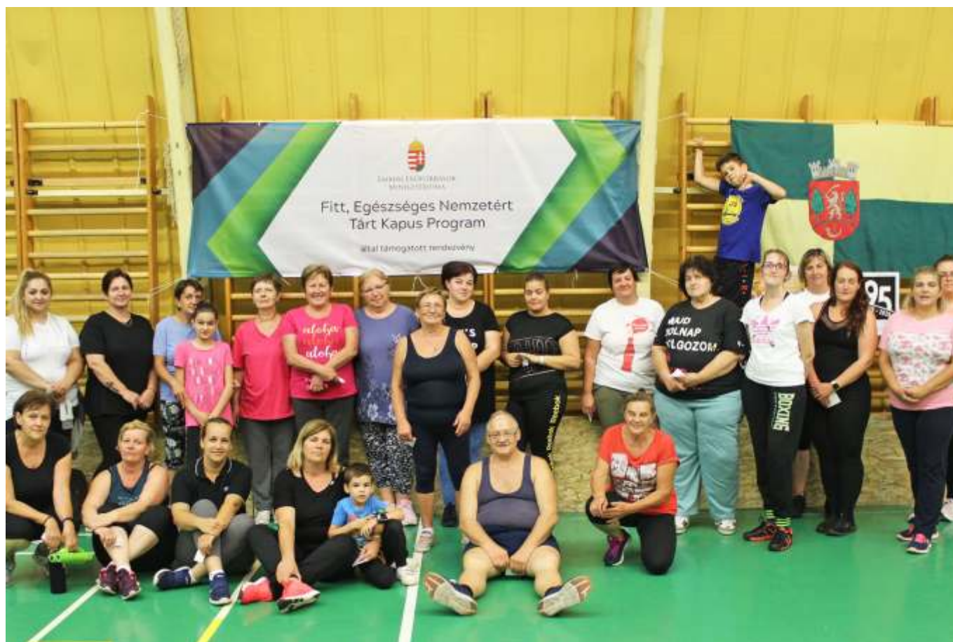
A duci torna résztvevői