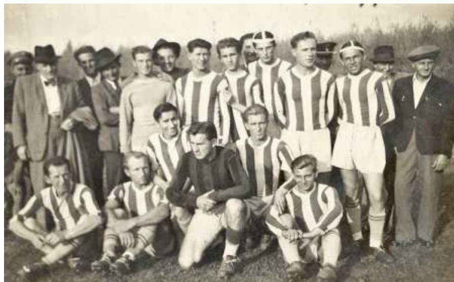
Az Újszászi Lokomotív 1951-ben