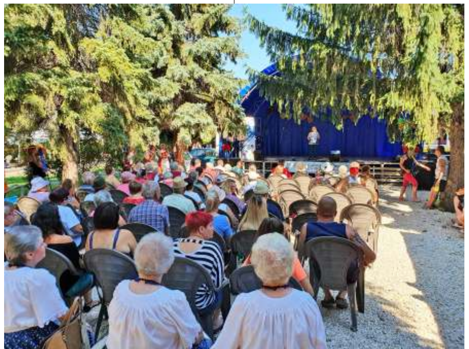
A Szomszédünnepen