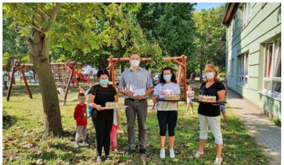
Az óvodások is megkóstolhatták a tortát