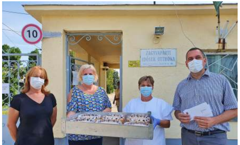
A Zagyvaparti Idősek Otthona lakói is kaptak a tortából