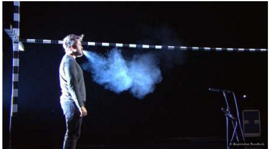
Ilyen távolságra jutnak el belőlünk a szervezetünkől származó miniatűr cseppcsekék.

A felmérés 125 ezer embert ért el, 21 300 választ kaptam, amelynek a 26%-a, tehát több mint öt és fél ezer ember jelezte,