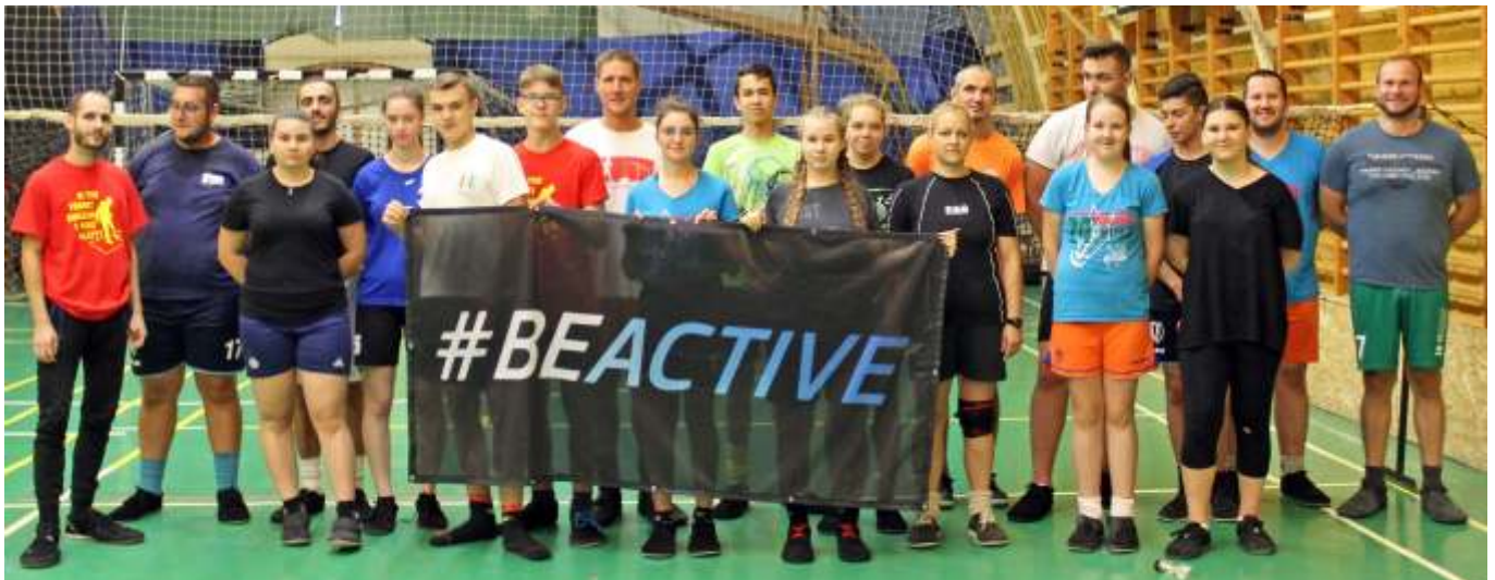
Lábtoll-labdázók az Európai Sporthéten

BEACTIVE Kupát rendeztek, a gyalogtúrázók a Zagyva-gáton gyalogoltak. Az újszászi Európai Sporthét a jógázók félhomályban, halk zenével kísért, a végén relaxációval záruló programjával zárult. Mind a hét rendezvényen a Magyar Szabadidősport Szövetség ajándékként #BEACTIVE feliratú pólókat, törölközőket és nyakálakat nyertek a szerencsés résztvevők.