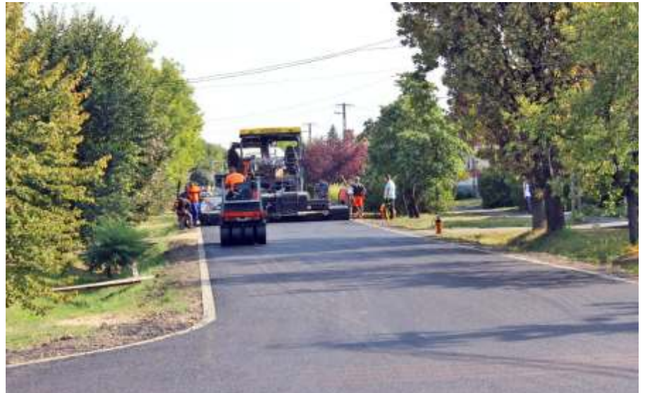
Aszfaltozás a József Attila úton

Ha valóban meg szeretnénk ítélni a közösségi programok megvalósításán dolgozó munkatársaink teljesítményét, akkor hasonlítsuk össze Újszász programkínálatát más települések kínálatával azonos időszakon belül. Augusztus hónapban (amikor az ország szinte minden pontján lemondásra kerültek a rendezvények), Újszászon régóta nem látott tömeget mozdítottak meg az önkormányzat által szervezett programok. Szeptemberben ráadásul a világjárvány miatt naponta változó előírások, szigorítások és egészségügyi fenyegetés mellett gyakorlatilag kétnaponta újra kellett gondolnunk városunk legnagyobb ünnepének forgatókönyvét. Munkatársaim véleményem, és szakavatott megyei szakemberek megítélése szerint is kiválóan teljesítettek ebben a példa nélküli helyzetben.