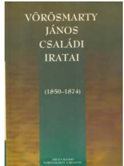
A családi iratok 2001-es kiadása