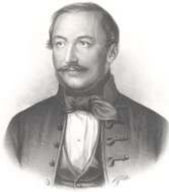
Vörösmarty Mihály 1849 novemberében Újszászon bujdosott

Aligha hihető, hogy az Orczy család akkori tagjai ne tudtak volna róla, mi történik saját birtokukon. Valószínűleg támogatták és segítették a magas közéleti