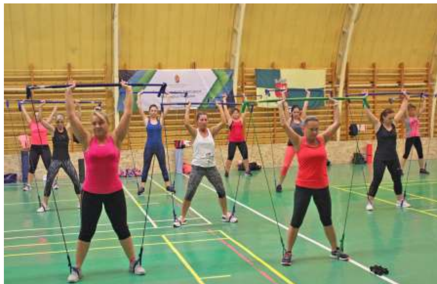
Ez a gymstick