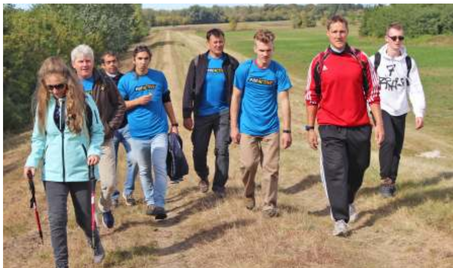
Gyalogtúrázók a Zagyva-gáton