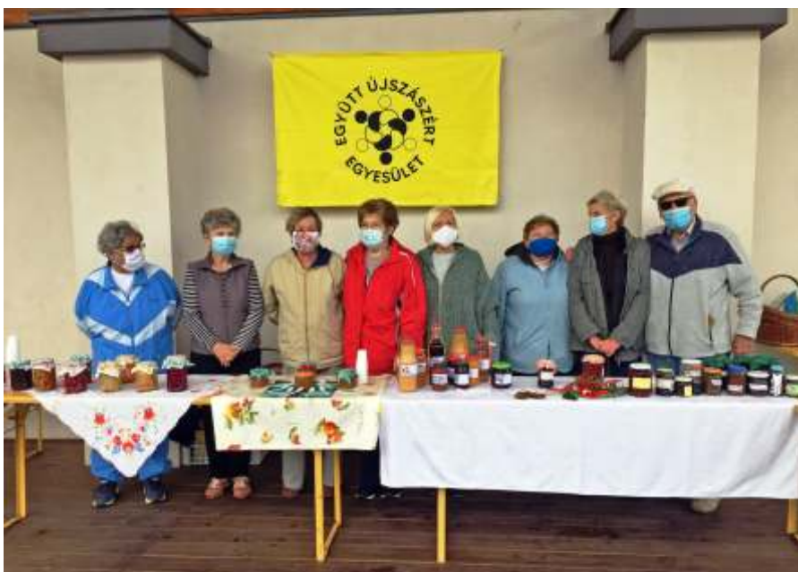
A kóstoltatók különleges ízekkel várták az érdeklődőket

F. Szekeres Zsuzsa Együtt Újszászért Egyesület