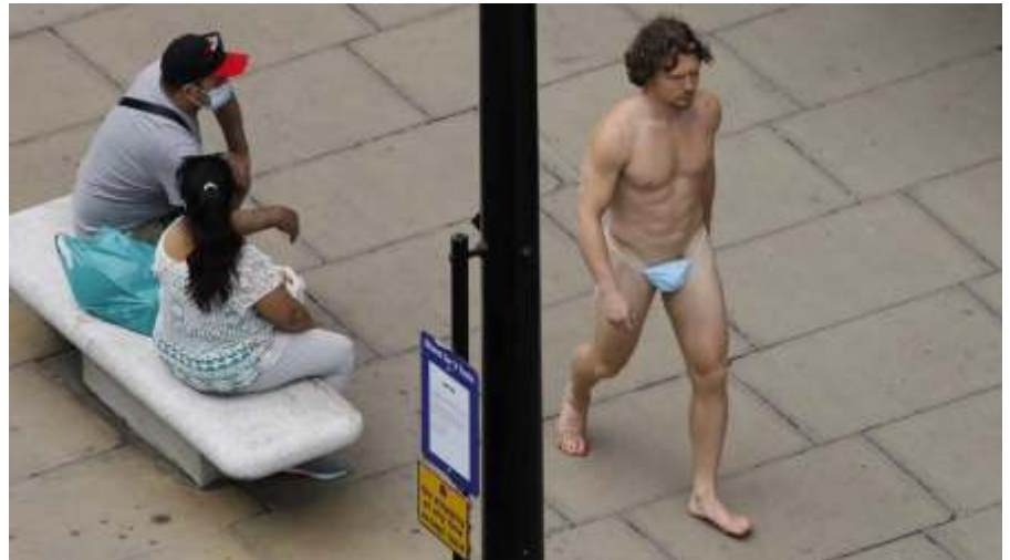
A helytelenül viselt maszk nem véd meg senkit semmitől...

De fontos lenne, hogy megértsd: ez azért van, mert mindannyian itt állunk egy történelmi léptékű esemény köze-