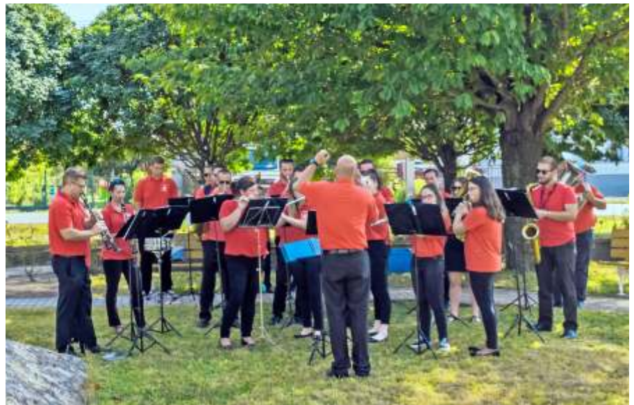
Az Abonyi Fúvós Zenekari Egyesület