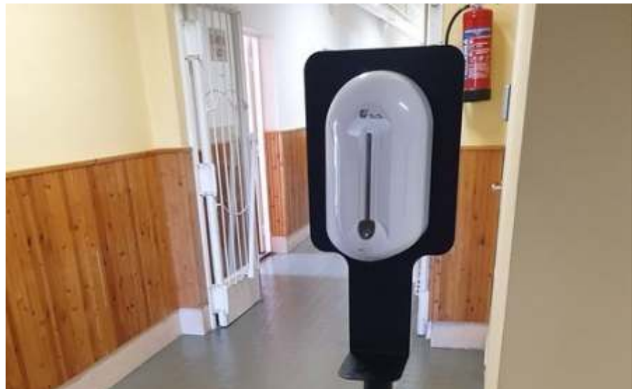
Digitális kézfertőtlenítő

Kérek mindenkit, hogy figyeljünk és vigyázzunk egymásra, különösen a hideg téli napokon!