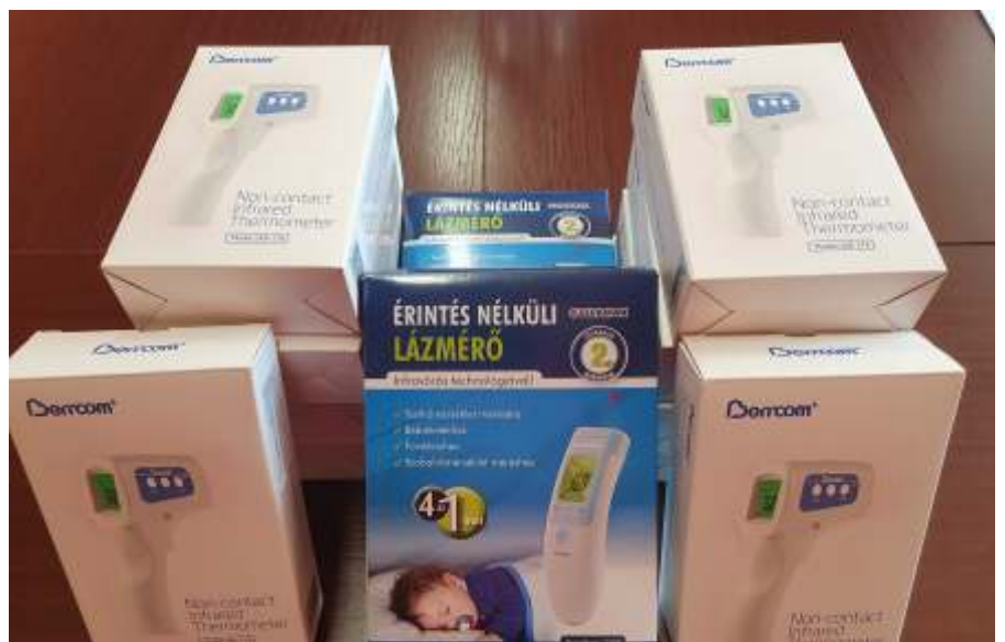
Érintésmentes lázmérők