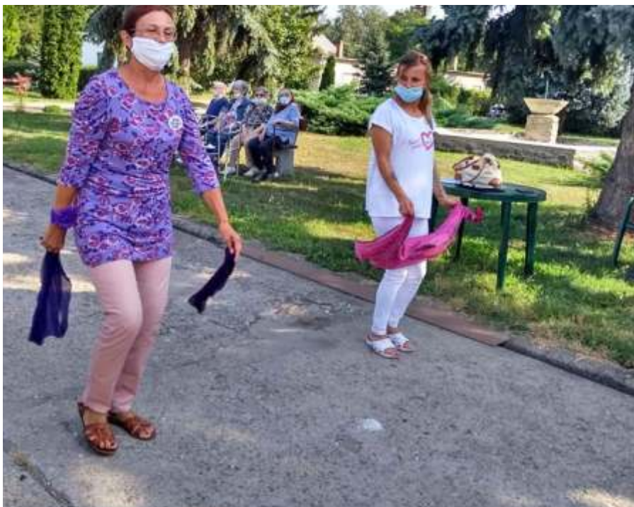
Madlen örömtánc oktatóval táncoltunk