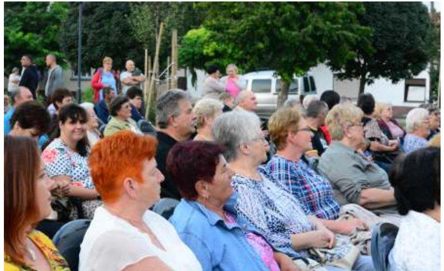
Nagy sikert arattak az örökzöld slágerek

A meghámozott, felkockázott cukkinit lábosba tesszük. Felöntjük az alaplével, és felforraljuk. Lefedve, kis lángon főzzük 20 percig, illetve amíg a cukkini megpuhul. Ha kész, levesszük a tűzről, és bot mixerrel pépesítjük. Ízlés szerint sózzuk, borsozzuk, majd a tejszínt hozzáadva még egyszer felforraljuk. Kaporral megszórva tálaljuk. (Én nem szoktam kaprot tenni rá.)