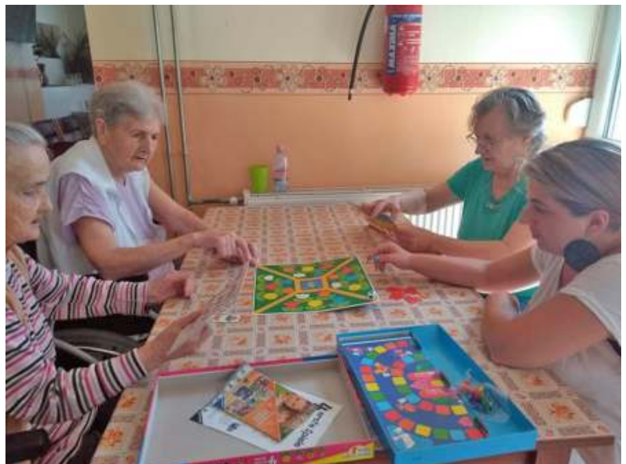
Kipróbáltuk a társasjátékokat