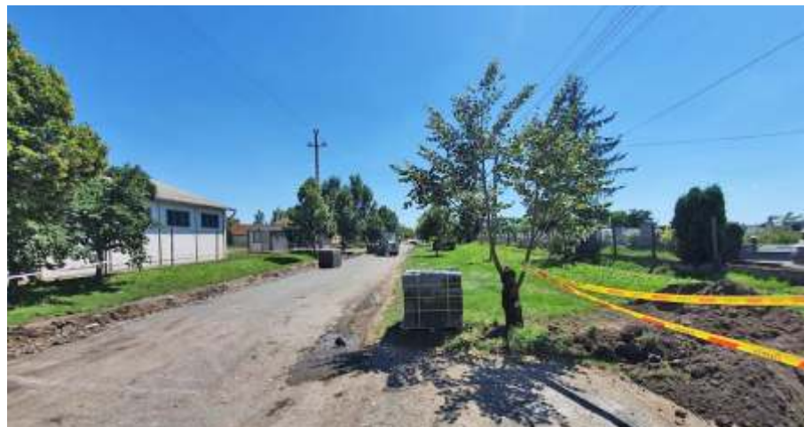
Megkezdődött a József Attila út felújítása