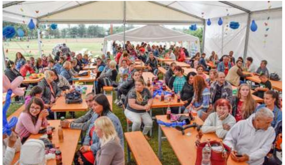
A Megbecsülés napján