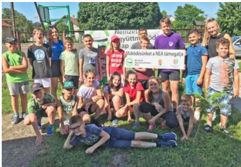
Az önvédelmi tábor résztvevői

Kedden a délelőtti foci után, a program a fiúk részére okozhatott volna kihívást, de nem így történt. A táncoktatásban talán még dereka-