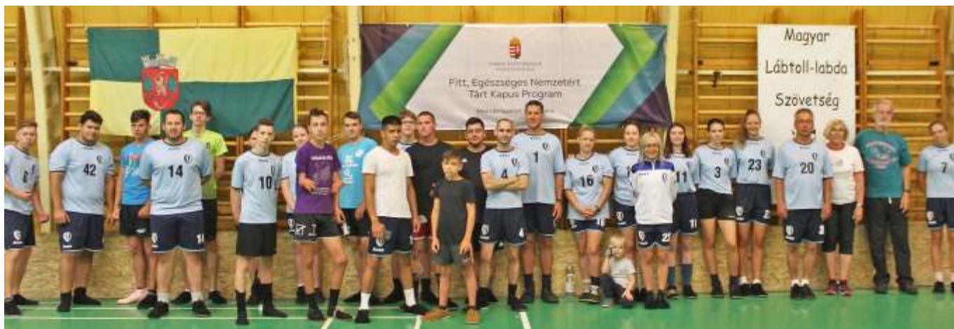
A Nosztalgia Kupa résztvevői