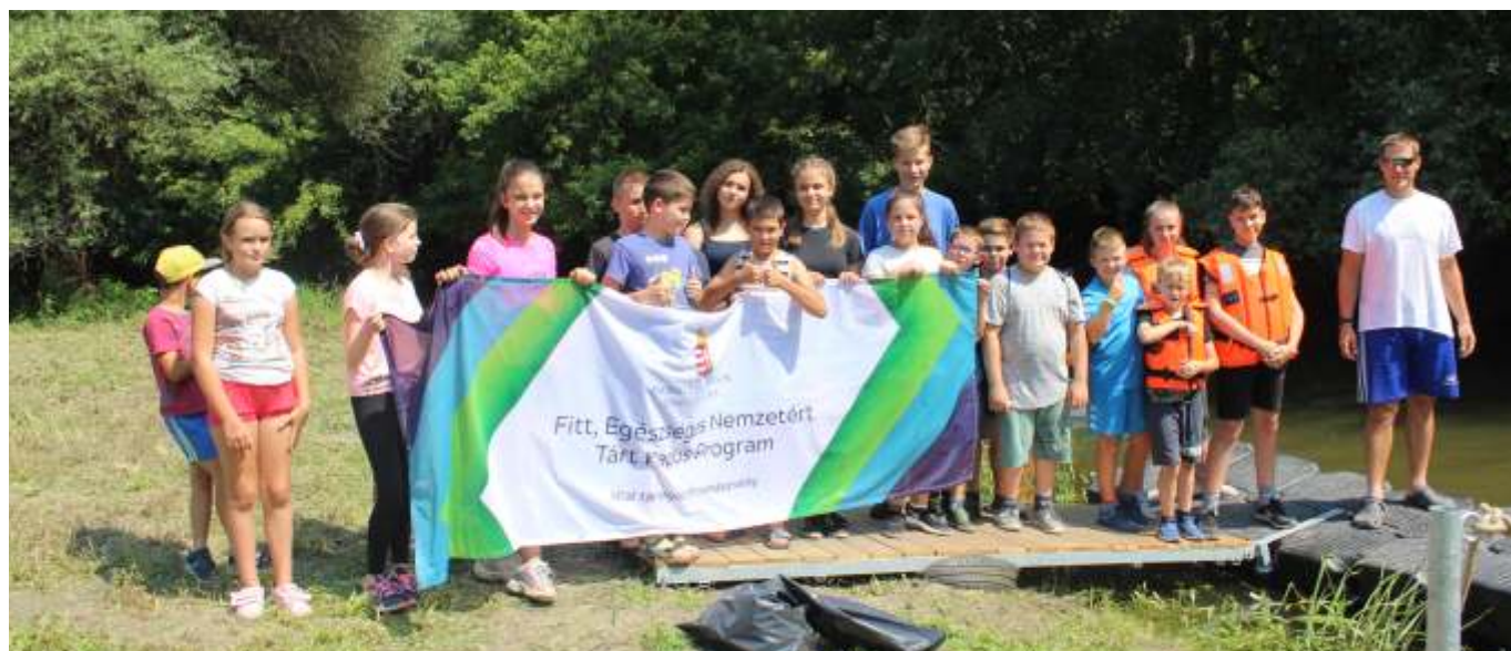
Kenuzás előtt