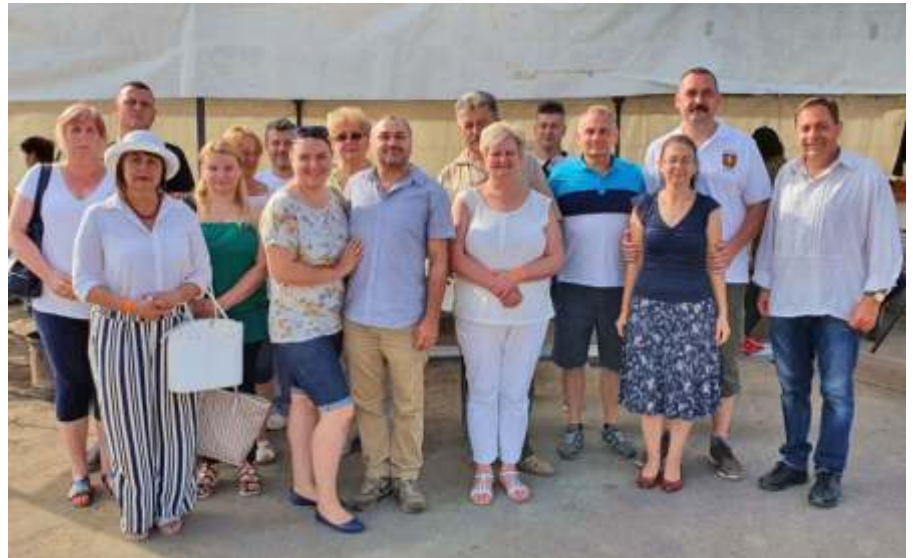
Újszásziak a Jászsági Aratónapon

Július 14-én képviseltem Újszászt a Jászsági Önkormányzatok Szövetségének ülésén, valamint 15-én a Szolnoki Kistérségi Társulás tanácsának ülésén. Ez utóbbi ülésen fogalmazódott meg a kistérség településvezetőiben az a gondolat, hogy közös levélben forduljunk a Kormányhoz annak érdekében, hogy a súlyos mértékben elszaporodott csípőszűnyog-helyzet kezelése érdekében eseti jelleggel tegyék lehetővé az Unió tilalma ellenére is a légi kémiai védekezés engedélyezését. Szerencsére a térség országgyűlési képviselői teljes vállszélességgel az ügy mellé álltak, így az elmúlt napokban már újra felszállhattak a repülőgépek. Bízom benne, hogy a hétvége már meghozhatja számunkra a régóta várt enyhülést.