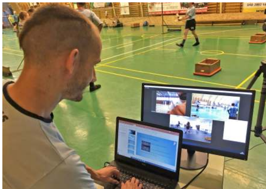
A képernyőn négy helyszín eseményei