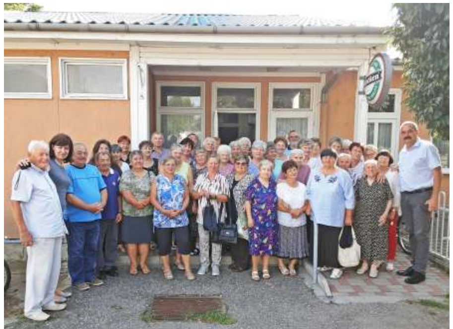
A klub foglalkozás résztvevői