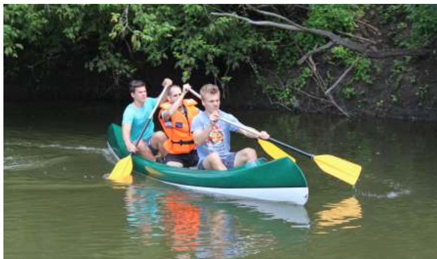
Kenuzás a Zagyván (Fotó: Fehér János)

Júliusban 94 eseményen sportolhattak az újszásziak és a környékeliek. A meleg, a szabadságok és a nyaralások miatt a