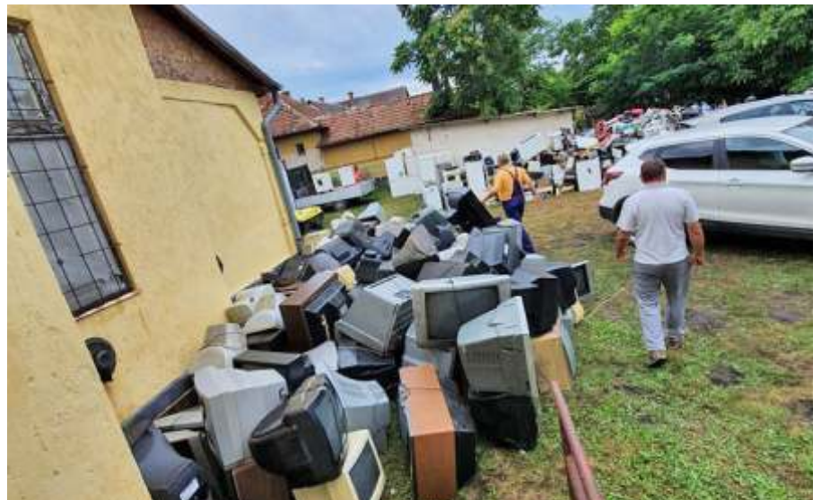
Sok elektronikus hulladéktól szabadult meg Újszász