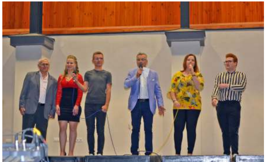
Az est szereplői