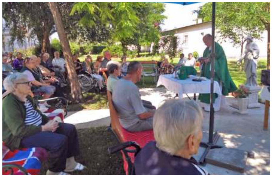
Mise a szobornál