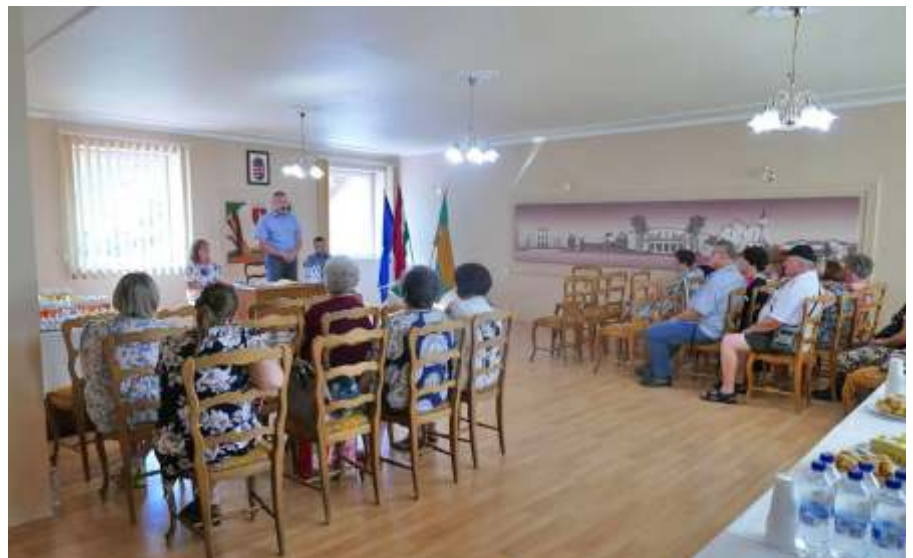
Köszönet az önkénteseknek