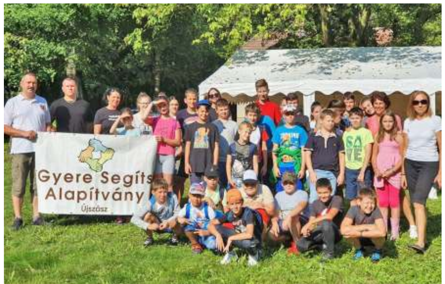
A Gyere Segíts Alapítvány táborában