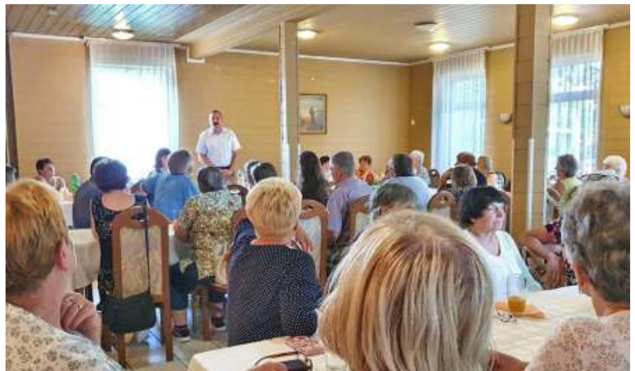
Az Aranyifjak összejövetelén

Testületi ülést is tartott július 14-én a képviselő-testület. Ismét fontos, városunk életét jelentős mértékben befolyásoló napirendekről tárgyaltunk. Ilyen volt többek között a József Attila úti beruházás kivitelezőjének közbeszerzési eljárás utáni kiválasztása is.