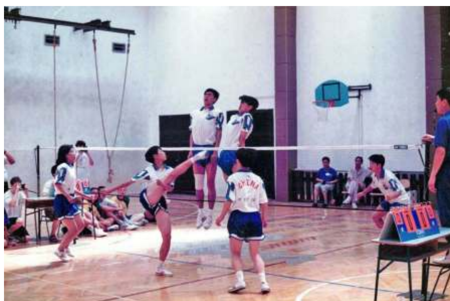
Így játszottak a kínaiak 1996-ban

1996-ban a gyermek, a serdülő és a felnőtt országos bajnokságok megrendezésével megkezdődött a bajnoki rendszer létrehozása.