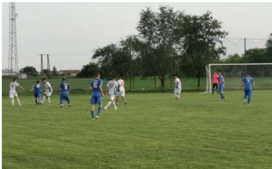
Újszász – RákócziFalva 7-1

Díjátadóként egy Varga László ifjúsági emléktornán 1995-ben.