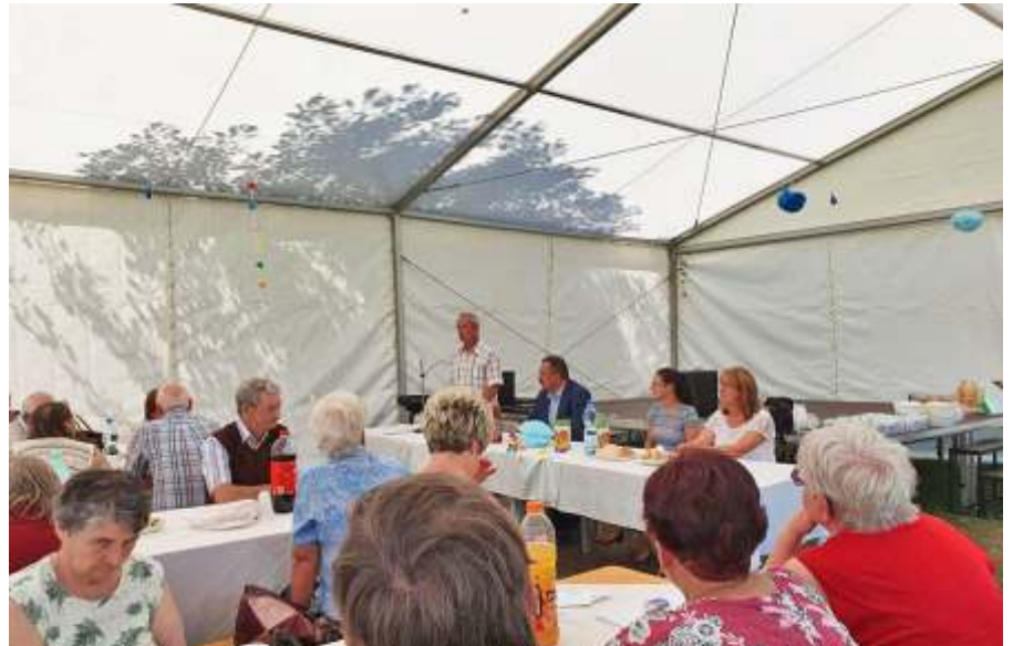
A vasutas nyugdíjasok közgyűlésén

A város nevében köszönöm áldozatos munkájukat és elkötelezettségüket, amiért a legnagyobb szükség esetén a közönség szolgálatába álltak!