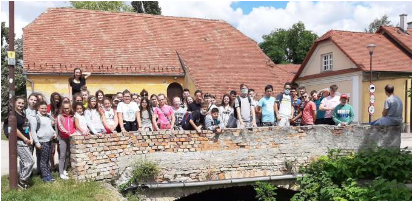
Az újszászi táborozók Tata egyik régi kőhídján

tettük, hogy az újszásziak ebben is jók. Délután kisvonatra pattantunk, ami városnéző körút után a geológiai parkba vitt, ahol idegenvezetőnk tartalmas előadással várt minket. Estére sem maradtunk program nélkül, javarészt a szülői felajánlásoknak köszönhetően, amit ezúton is köszönünk, nyársaltunk. Igazi tábortüzes szalonnasütés kerekedett, ami után édes volt a pihenés.