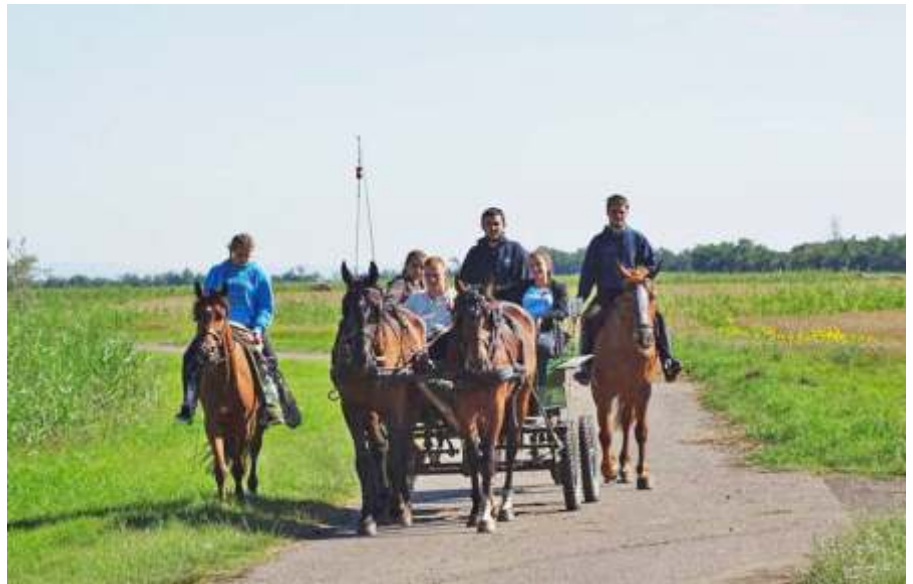
Lóháton és lovas kocsival Újszásztól Egerig és vissza

– Azért szeretem ezeket a lovas túrákat, mert mindig jó kiszakadni egy kicsit a városi életből, és a nomád életmódnak van egy