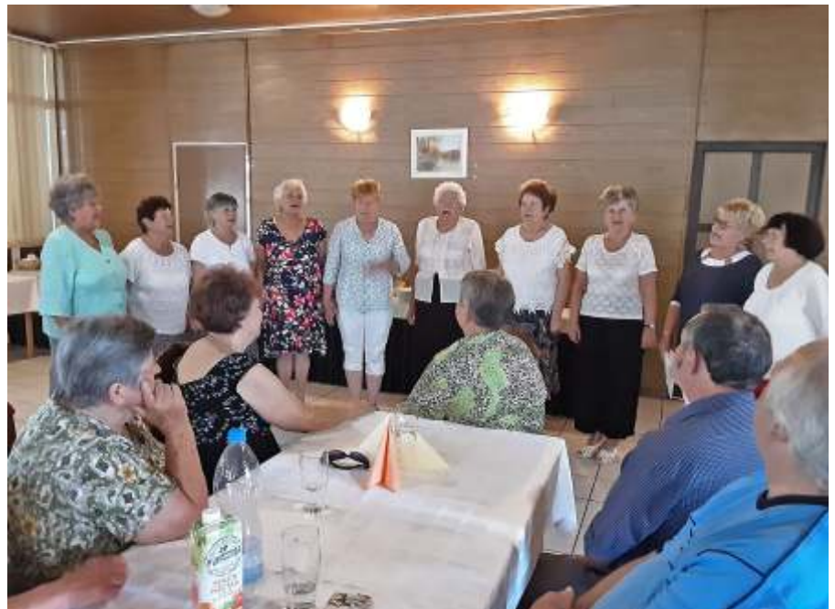
Vidám éneklés