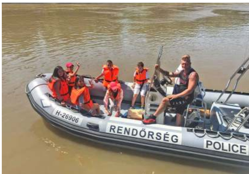
Rendőrségi motorcsonakban a Tiszán