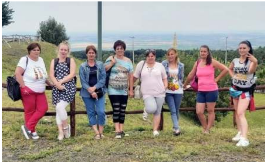
A jó hangulatú munkahelyi kiránduláson