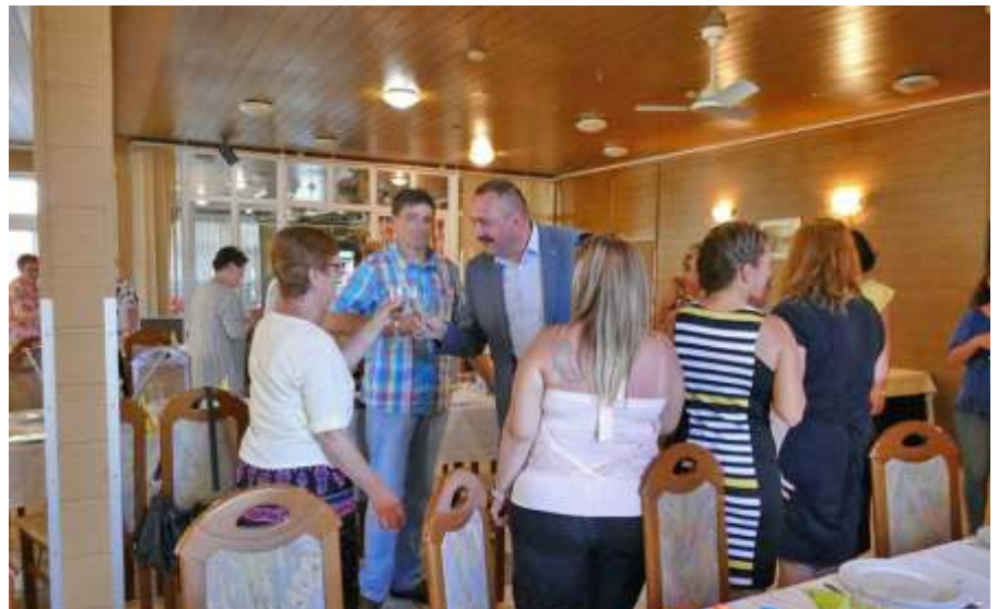
Ünnepi koccintás az egészségügyi dolgozókkal