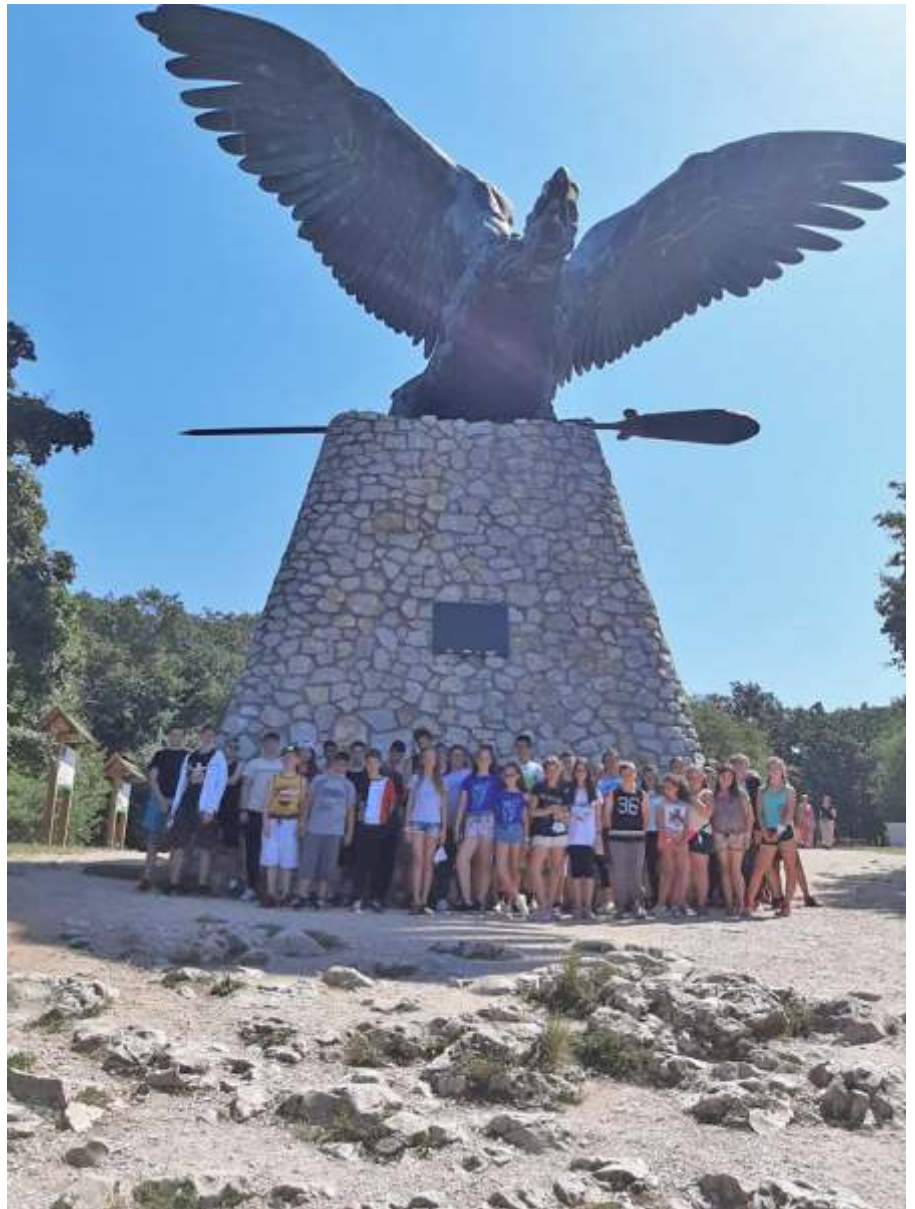
Az újszászi táborozók a tatabányai Turul szobornál

Már rutinos táborozónak számítottunk. A csodálatos környezet, a hangulatos kisházak és sportpályák nem értek váratlanul, de így is akadt olyan, amire rá tudtunk csodálkozni. A legnagyobb meglepetést a tábor összlétszáma okozta, hiszen négyszázharminc táborozó gyűlt össze, így az utolsó napokra is akadt olyan „sorstárs”, akivel meg lehetett barátkozni. Az első nap a beköltözésről