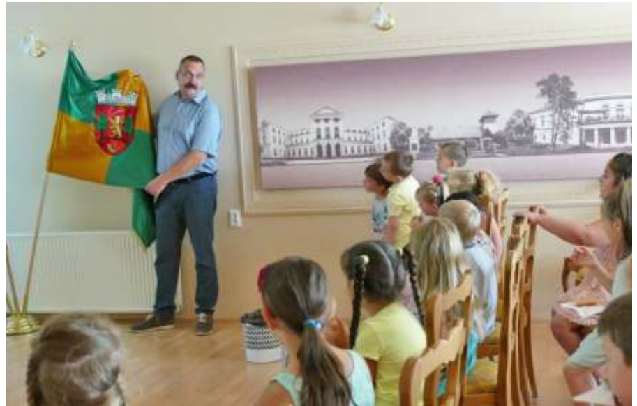
Óvodások a Polgármesteri Hivatalban

Július 1-jén a Köztisztviselők Napját is ünnepeltük. A polgármesteri hivatal munkatársaira is nem várt terheket rótt a koronavírus okozta megnövekedett feladattömeg. Ráadásul Újszászon egyetlen napig sem szünetelt ebben az időszakban