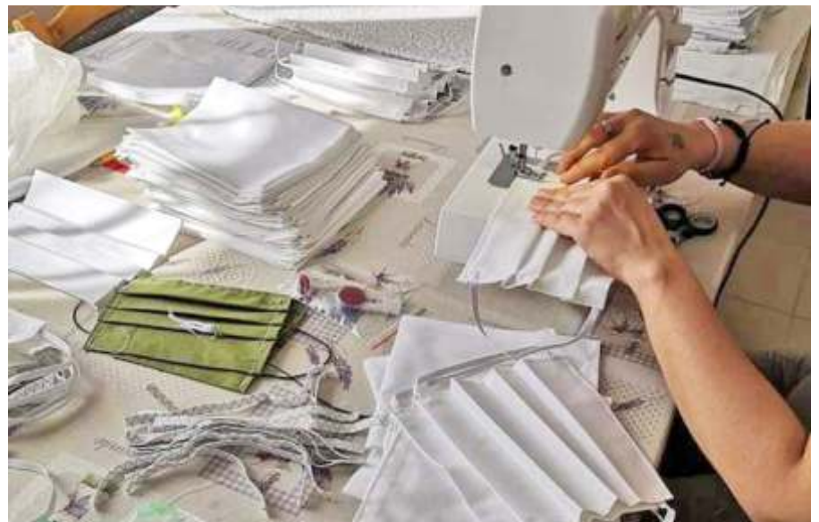
Folyamatosan készülnek a szájmaszkok

https://www.youtube.com/watch?v=_x7ZBQh7_Pg