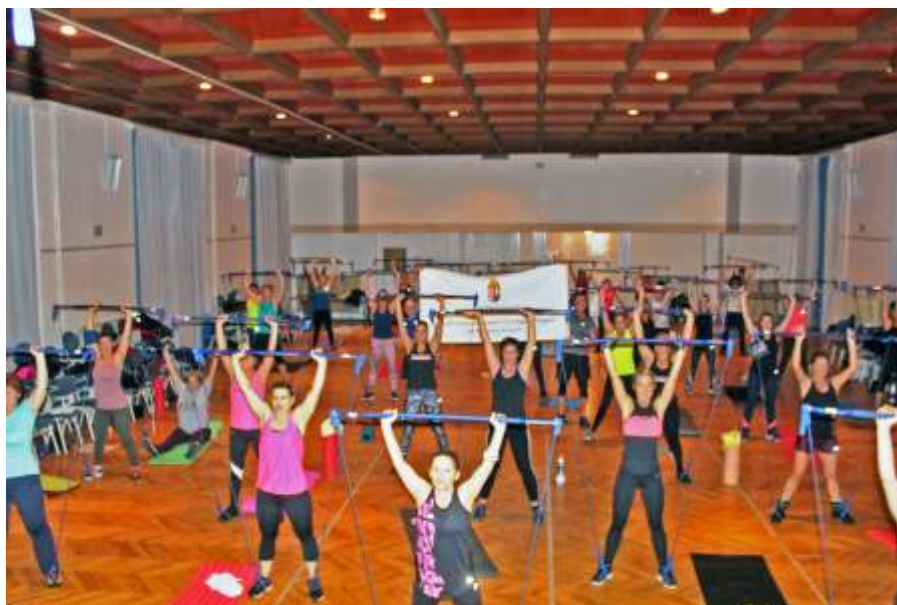
2018-ban a Tárt Kapus Program az egyik legnépszerűbb sportága a gymstick aerobik volt