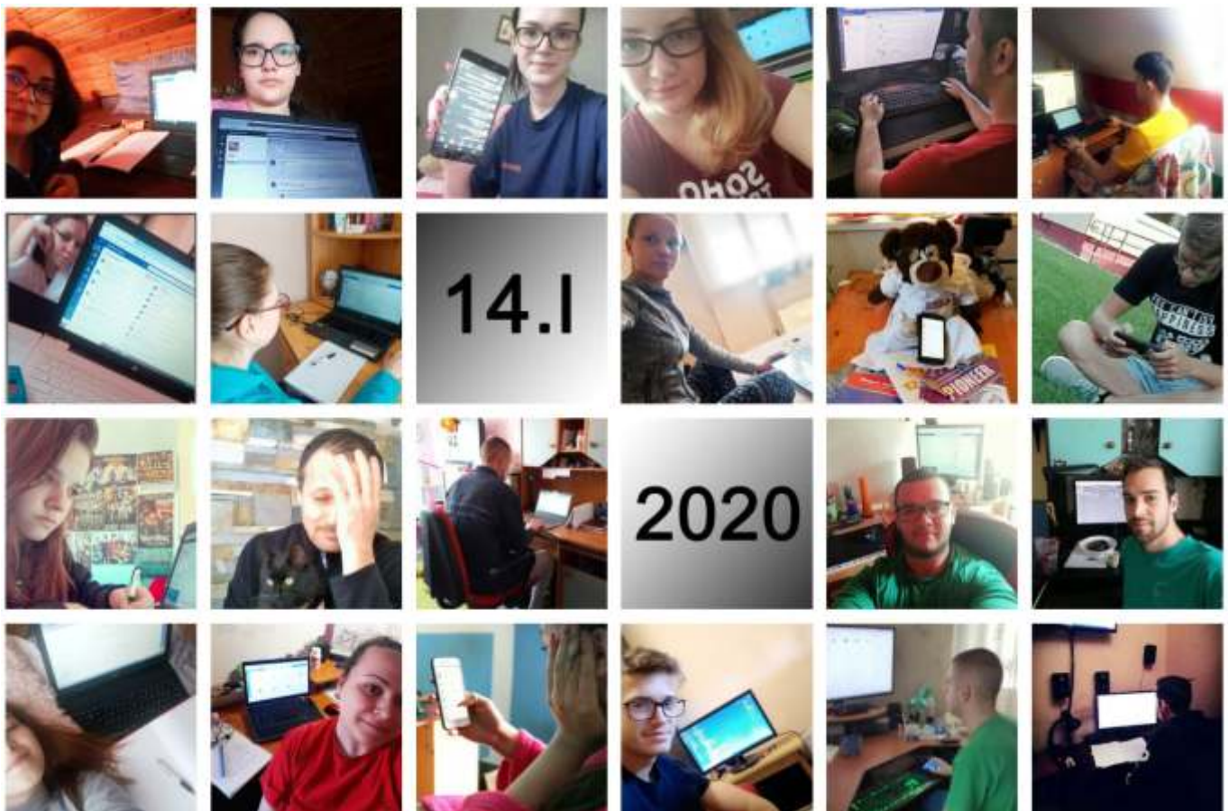
Tanulás az online térben. A 14. I osztály diáknapi összeállítása