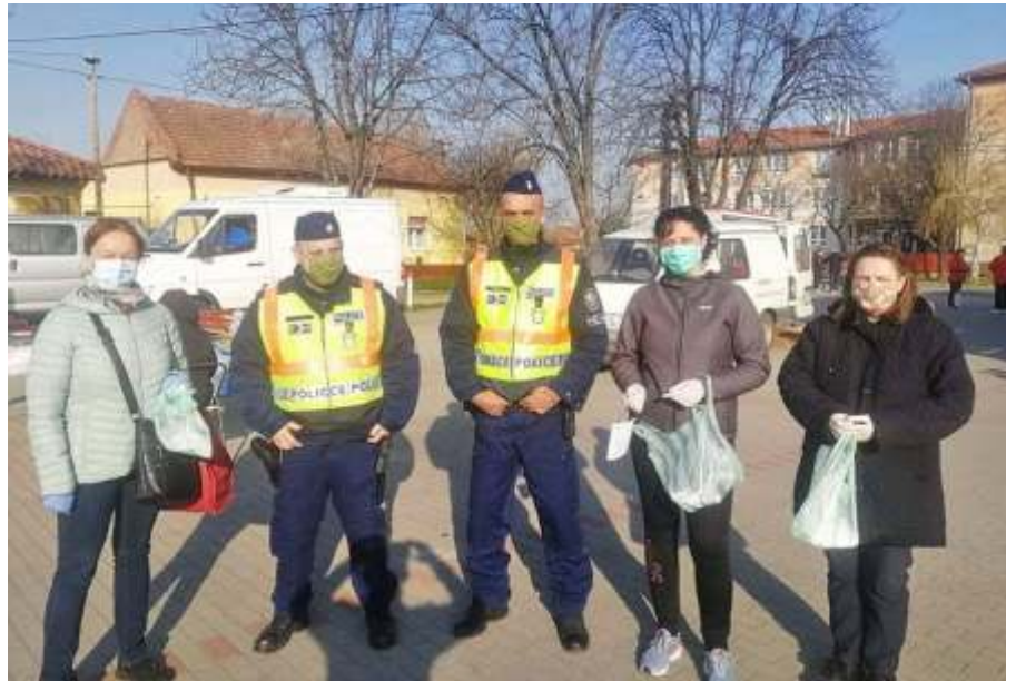
Rendőrségi ellenőrzés és szájmascok osztás a piacon