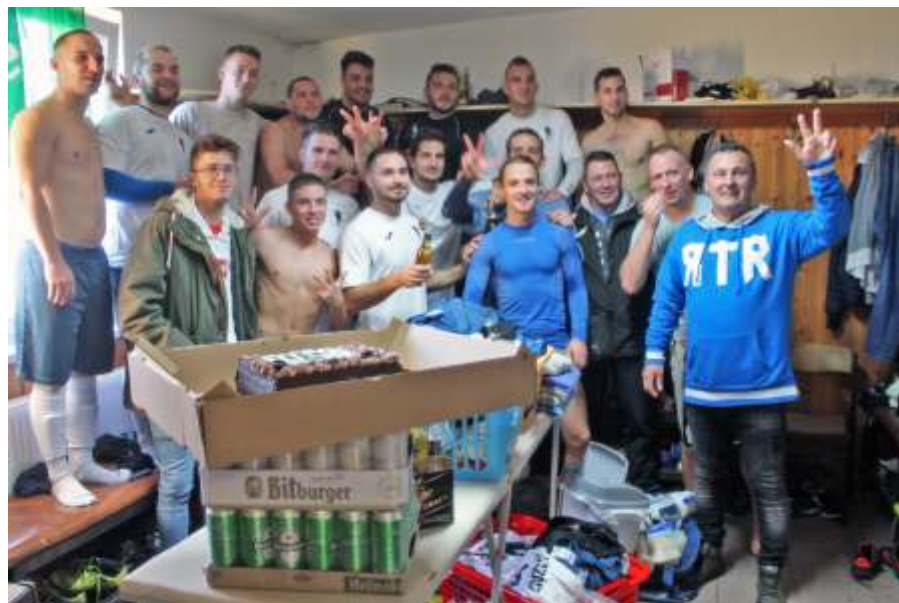
Így ünnepelte őszi harmadik helyét az Újszászi VVSE labdarúgócsapata