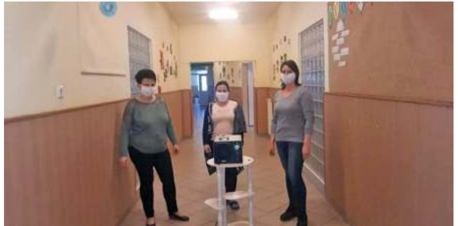
Ózonos fertőtlenítés után az óvodában

Köszönöm minden újszászinak az eddigi kifejezetten fegyelmezett viselkedését! A szomszédos településekkel összehasonlítva meg kell állapítanunk, hogy talán városunk lakossága értette meg legjobban a központi rendelkezések fontos-