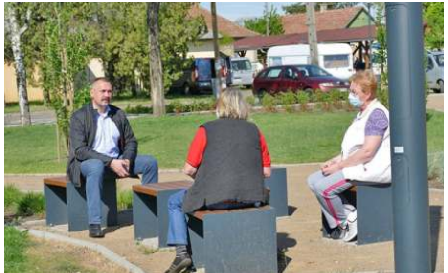
Polgármesteri fogadó óra a parkban