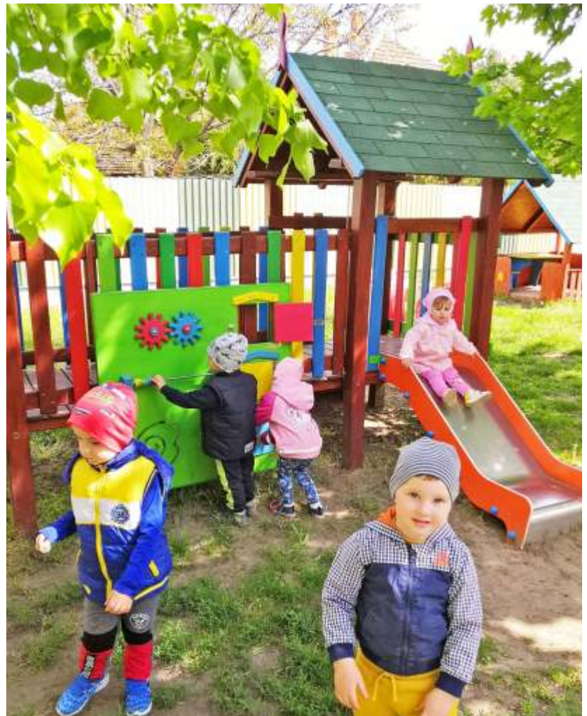
Tavaszi a bölcsődében