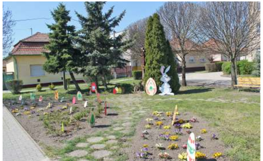
Az Egyszemélyes Civil Csoport akciója vidám húsvétot varázsolt