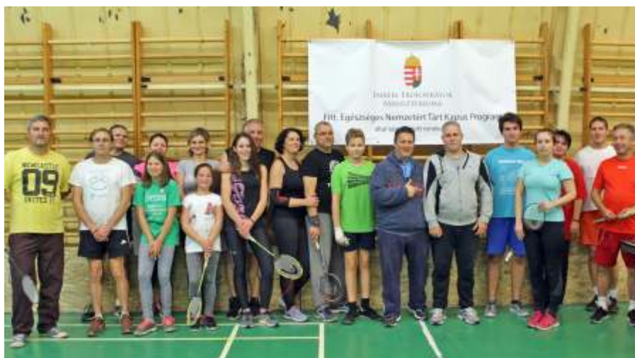
A tollaslabdázók is sokan voltak