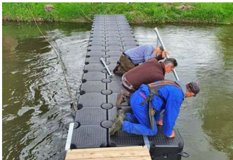
A Zagyva Ökopark pályázat keretében pontonhíd épül a Zagyván