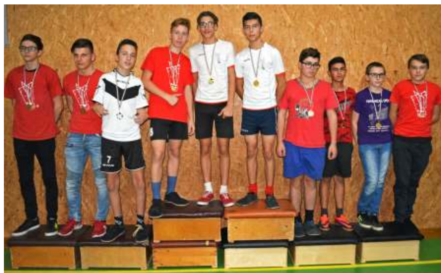
A serdülő fiú csapatok versenyében három újszászi csapat állt a dobogón