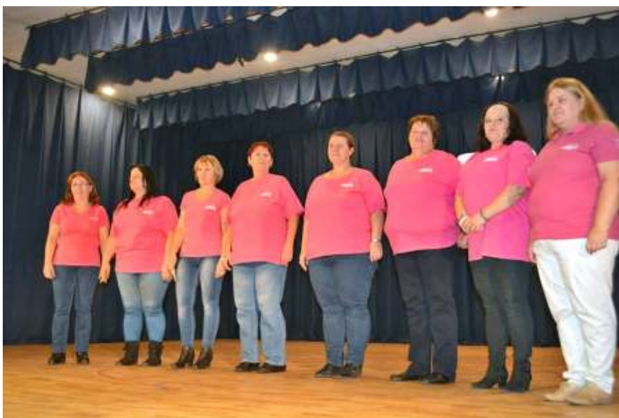
Dolgozóink a városi Ki-Mit-Tud?-on