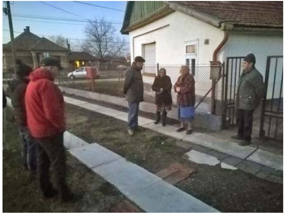
Beszélgetés a Deák Ferenc úti lakókkal a vízvezető csatornarendszerről

Arra kérem a tisztelt lakosságot, hogy amennyiben környezetükben olyan családot, személyt észlelnek, akiknél felmerül a rászorultság gyanúja, bátran jelezék azt felém, az önkormányzat munkatársai, az egészségügyi szolgáltatók, vagy a történelmi egyházak képviselői felé. Ne hagyjunk senkit fűtetlen lakásban élni! A tartósan 12 °C alatti hőmérsékletű helyiségben tartózkodó embe-