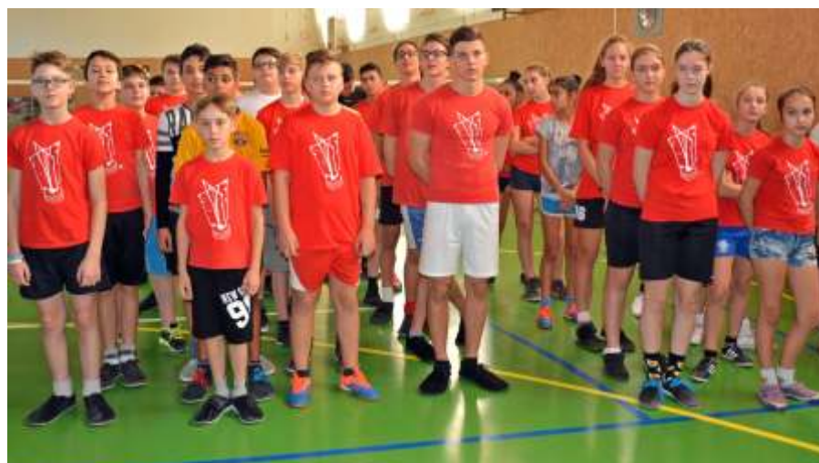
Az újszászi utánpótlás a bolyi versenyen