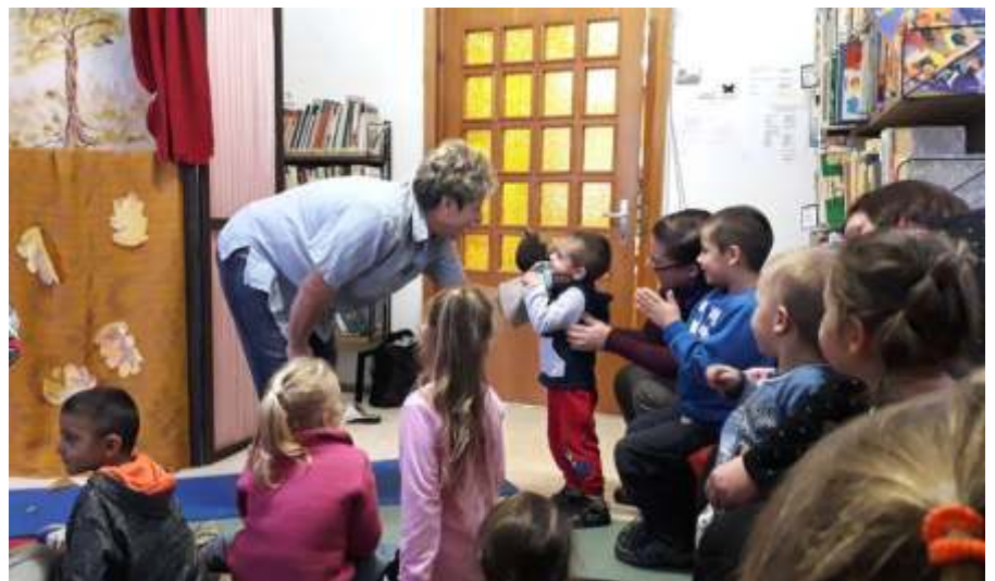
Találkozás a közönséggel