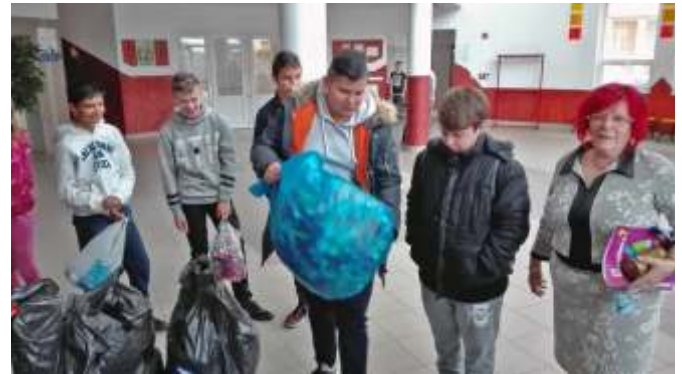
A tanulók 93 kg műanyag kupakot gyűjtöttek