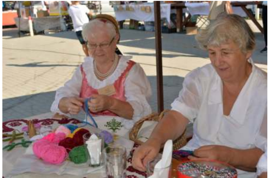
Országosan ismert az újszászi Népi Dísztöművészeti Szakkör