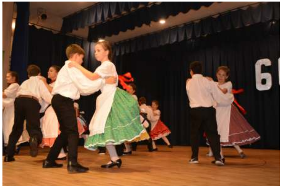
A 4. osztályosok néptáncsoportja