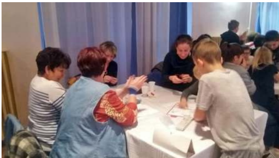
Ügyeskedés az Családi vetélkedőn