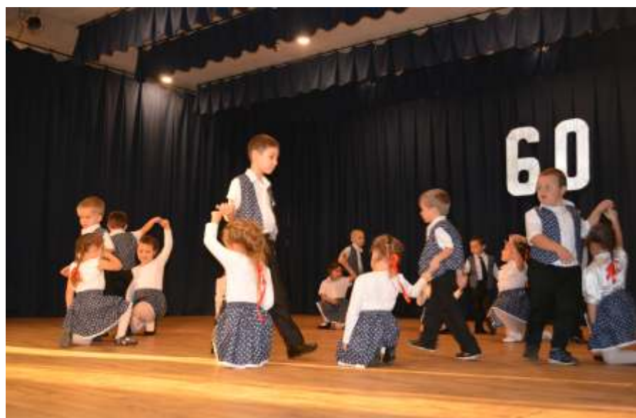
A Kertvárosi óvoda táncsoportja