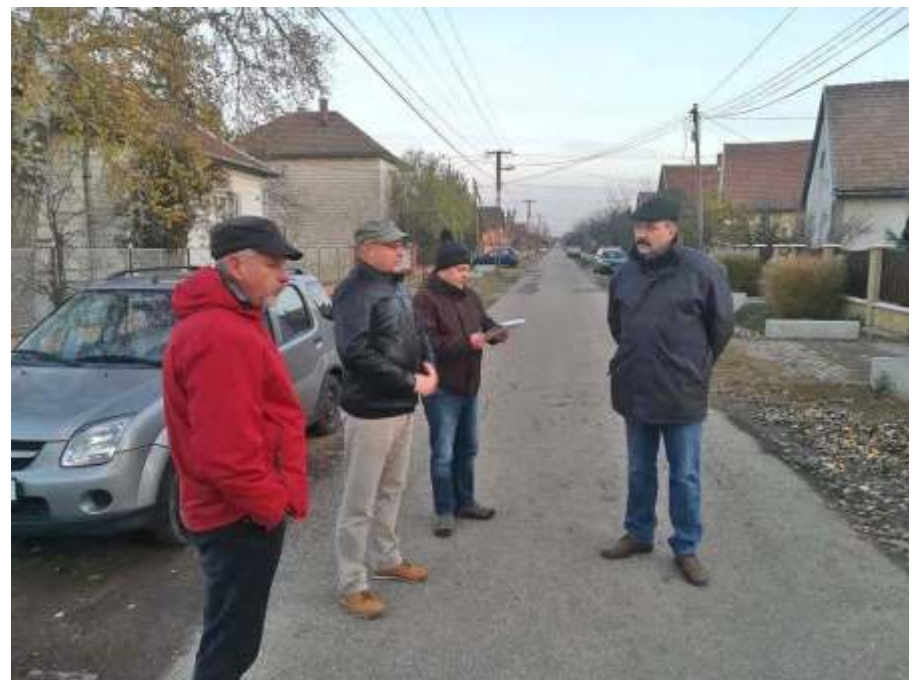
A Deák Ferenc úti vízvezető csatornarendszer bejárásán

reknél a kihülés veszélye fennáll, azaz fűtött, de alulfűtött lakásban is veszélyben lehet bárki egészsége vagy élete.