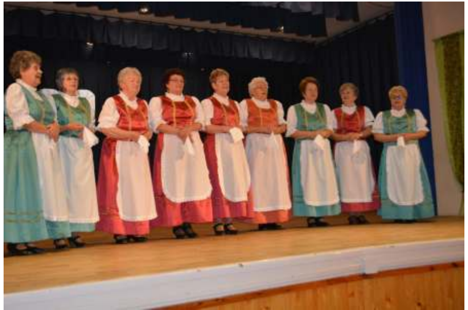
A Százszorszép népdalkör

A sok színvonalas produkció után a zsűri nagyon nehéz helyzetben volt, nem volt könnyű eldöntenie, hogy kiknek ítélje oda a Dobozi Róbert pol-