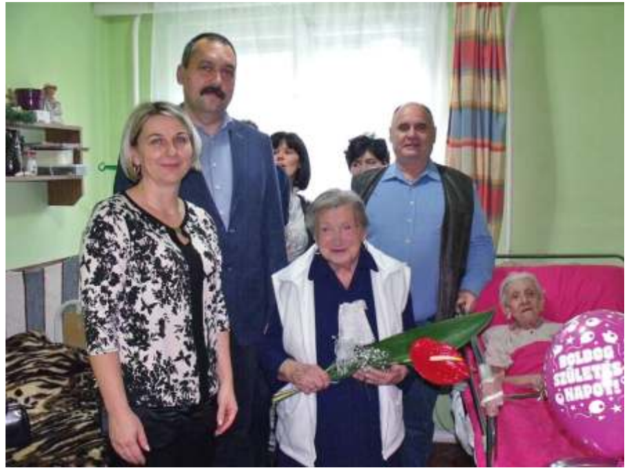
Születésnapi köszöntő az idősök otthonában

(bővebb információ a kéményseprők tevékenységéről: http://kemenysepres.katasztrofavedelem.hu/hirek )