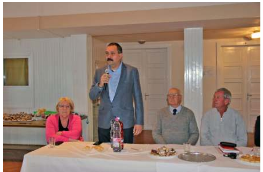
A Vasutas Szakszervezet Újszászi Nyugdíjas Alapszervezetének taggyűlésén

– Fellépés az illegális teherautó-forgalom ellen