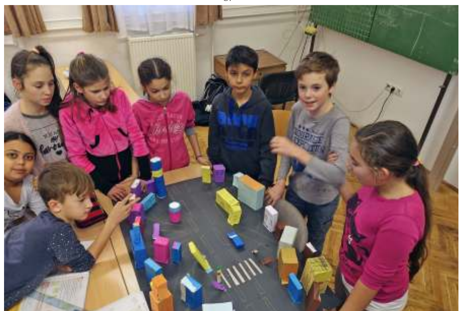
Babaváros gyógyszeres dobozokból