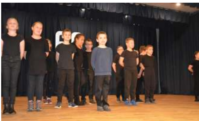
A harmadik osztályosok