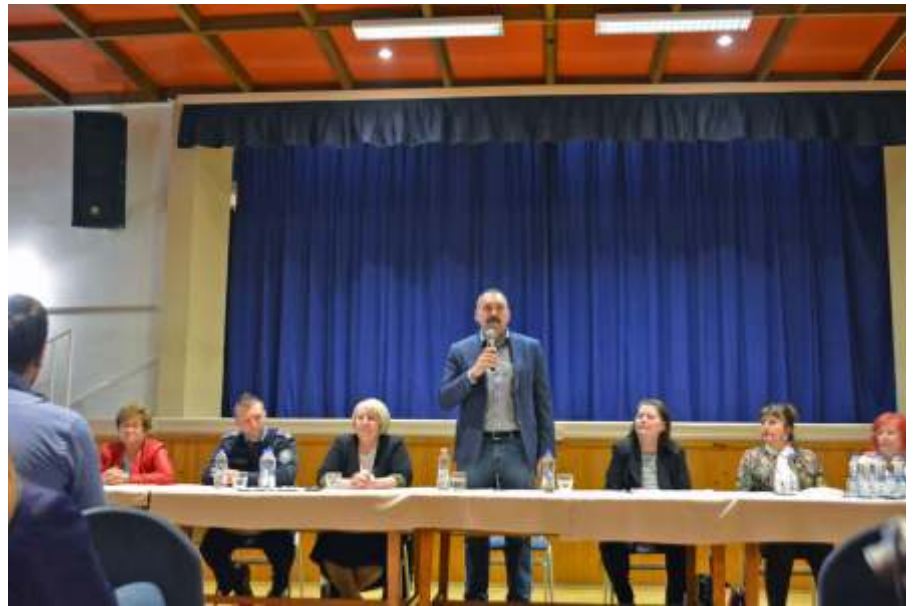
A városgyűlésen

November 13-án közmeghallgatással egybekötött városgyűlést tartottunk. Érdeklődésben szerencsére nem volt hiány: zsúfolásig megtelt érdeklődőkkel a Művelődési Ház színházterme. A városgyűlésen a közszolgáltatók és a rendőrség is magas szinten képviseltette magát, így a lakossági panaszok, felvetések jelentős részét a helyszínen sikerült orvosolnunk.