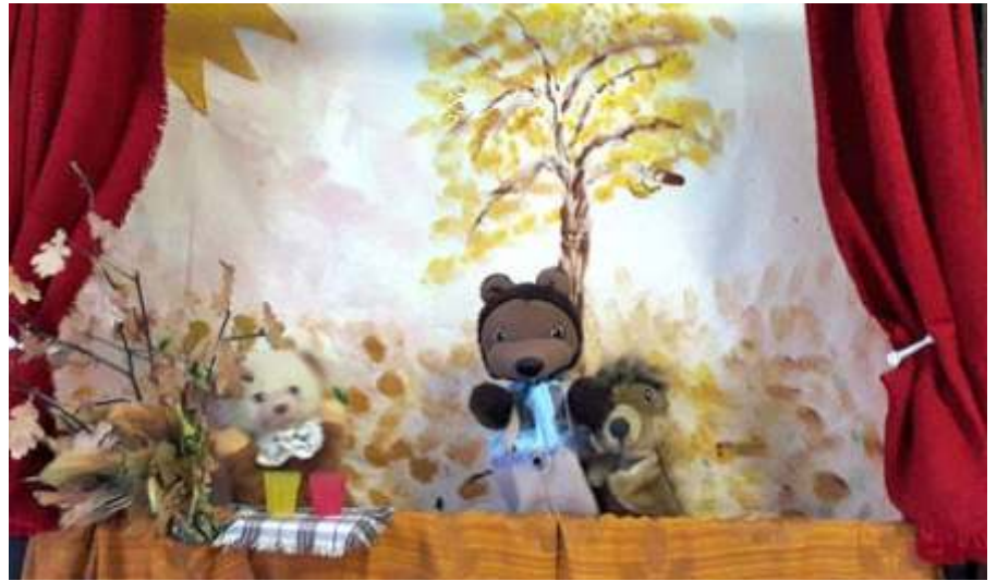
A nagyeszű sündisznócska