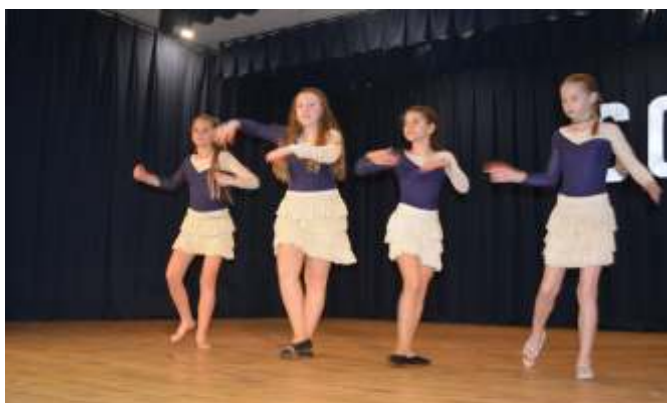
A Fordulat táncsoport haladó csoportja