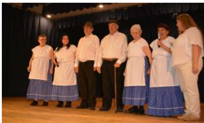
A Zagyvartói Idősek Otthona