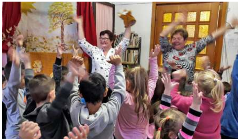
Bábok, bábozók és a lelkes gyerekek