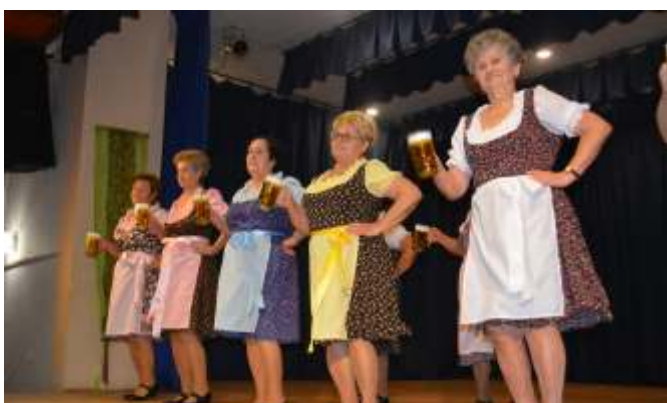
A Nosza Mami táncsoport