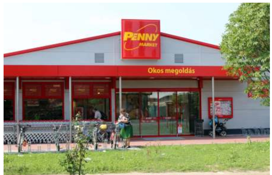
Az új bolt