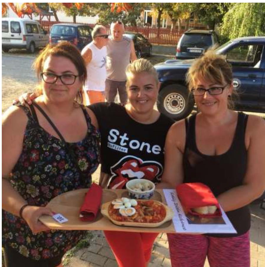
A MALIBE csapata

A gombóchoz a kockára vágott burgonyát enyhén sós vízben megfőzzük, ha kész, leöntjük róla a vizet. Egy nagyobb tálba helyezve összetörjük, még kézmélegesen hozzátesszük a szalonnazsírt és a szalonnapörccöt, a sóval elkevert lisztet. Kicsi-közepes gombócokat formálunk, majd megfőzzük. Fontos, hogy ne dolgozzuk túl, mert akkor nyúlós, ragacsos lesz a gombóc!