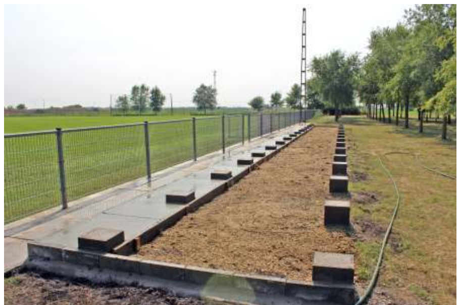
Elkészült a lelátó alapja