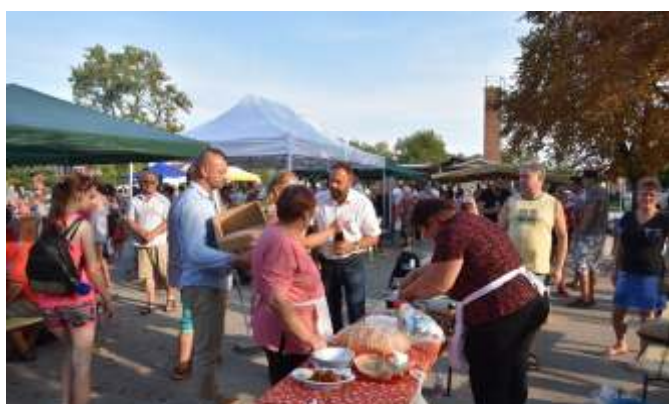
Minden csapat egy üveg fesztiválbort kapott Pócs János országgyűlési képviselőtől