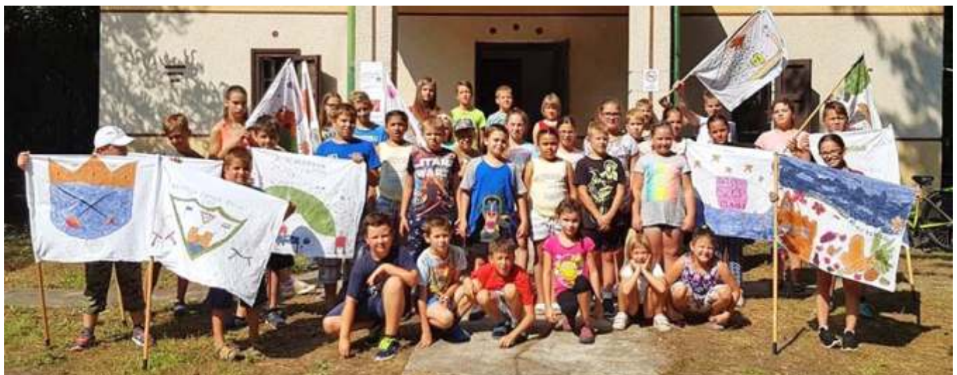
A Gyere tábor résztvevői