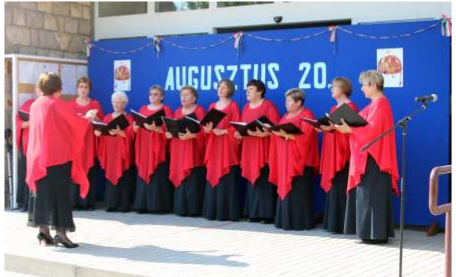
A Kvint-Kör