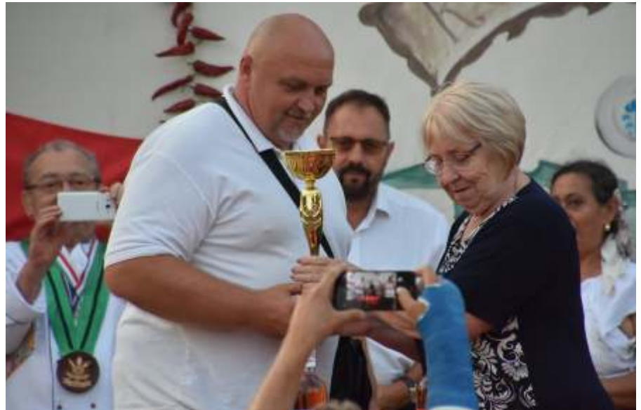
Díjátadás a legjobb lecsőfőzőnek