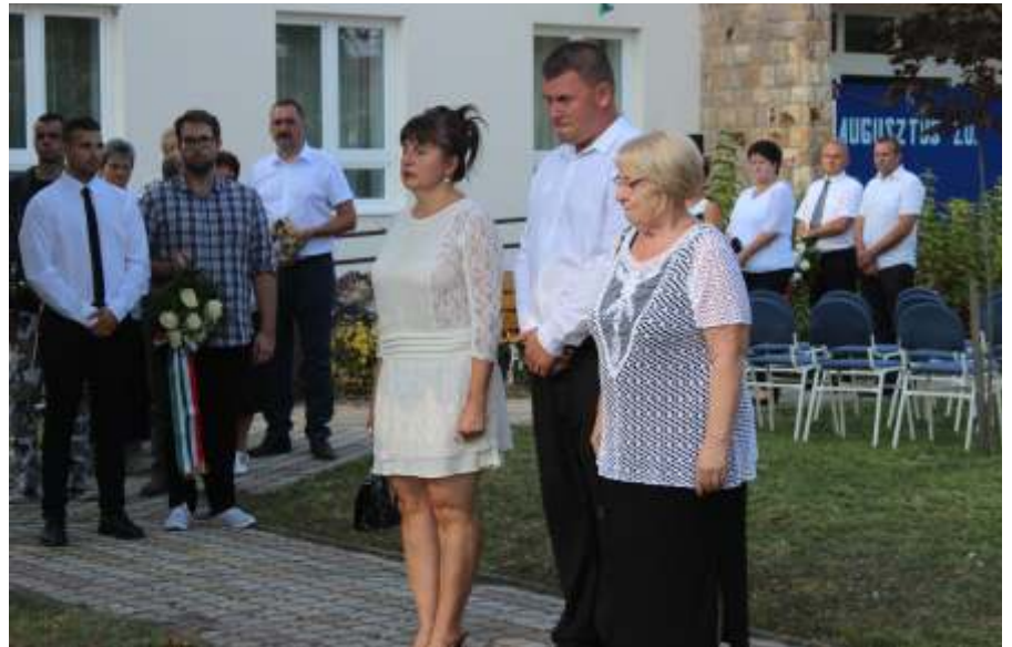
Koszorúzás augusztus 19-én

EU-s források terhére ún. TOP-os beruházásként az egészségház épületének építése folyamatban van. A kivitelezővel kötött szerződés szerint az új épületet várhatóan januárban adják át. Ekkor költözhetnek át a házi- és gyermekorvosok,