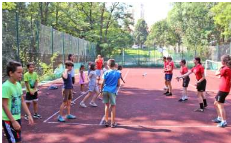
Lábtoll-labdázás a Hárs-hegyen