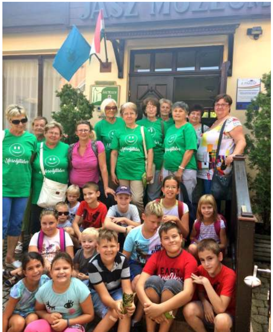
A Mosolytábor résztvevőinek egy csoportja a Jász Múzeum előtt