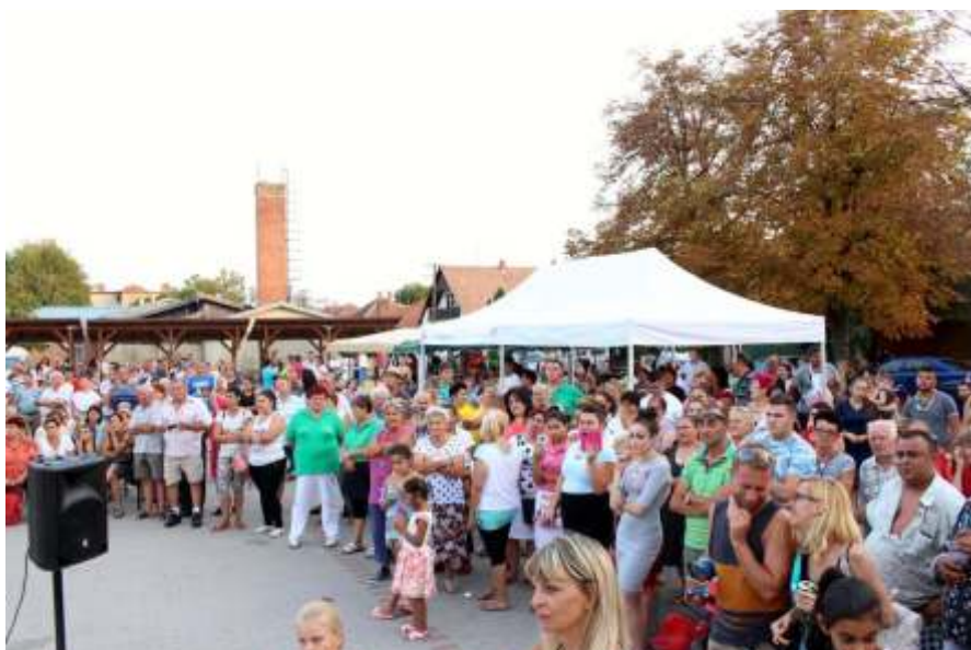
Sokan szeretik a lecsót

»OBSERVER« OBSERVER BUDAPEST MÉDIATIGYHŐ KFT.