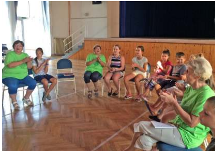
A táborlakók ismerkedése

A következő nap labdajátékokkal, számháborúval, „gyümölcskereséssel” kezdődött az általános iskola udvarán, majd az akadályverseny után mozgásos, tán-