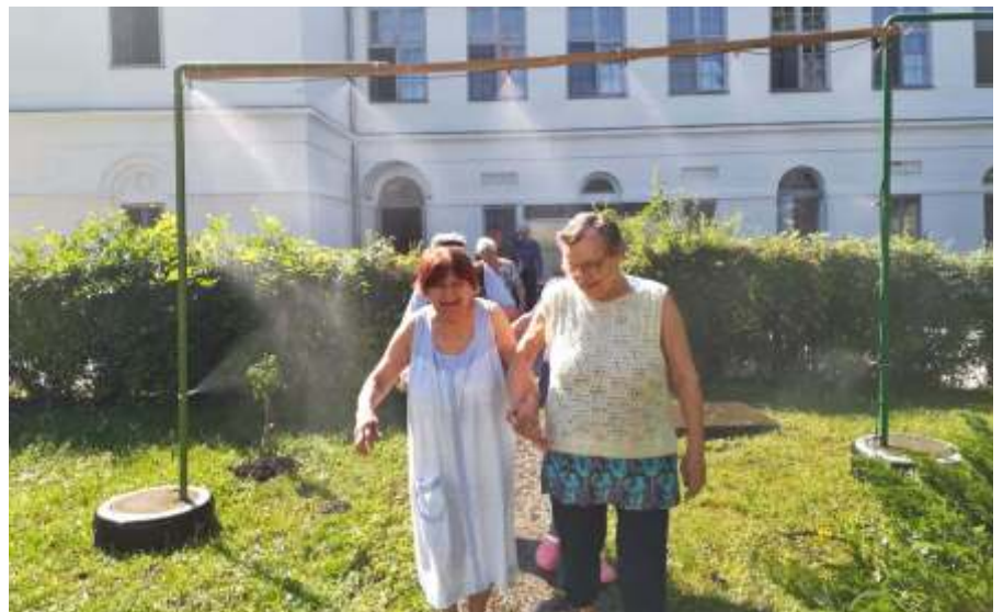
A párapapú alatt