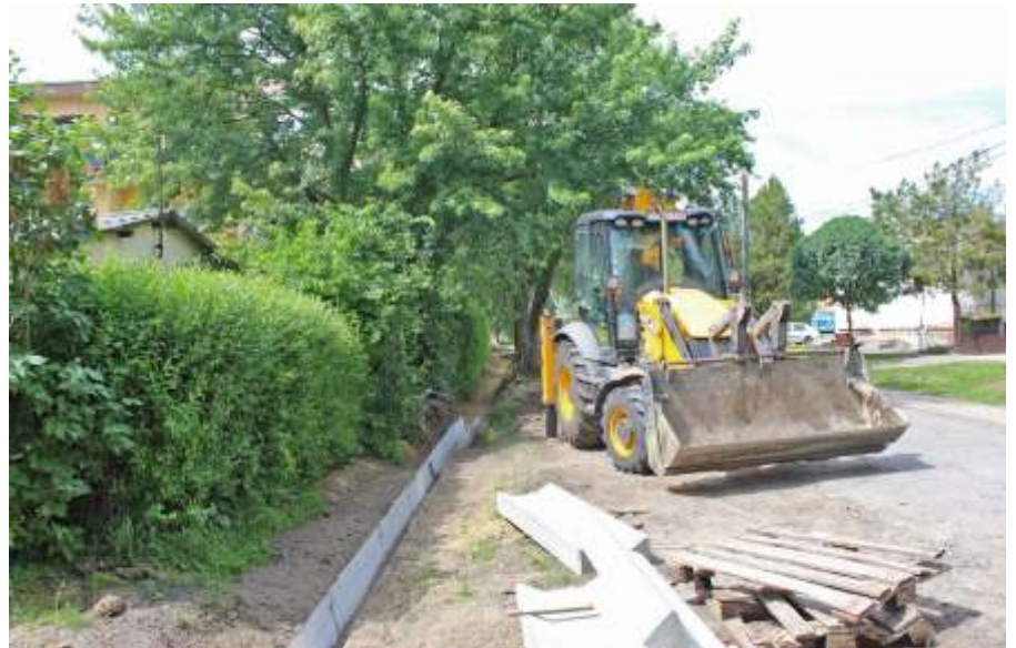
Nehéz, bonyolult munka