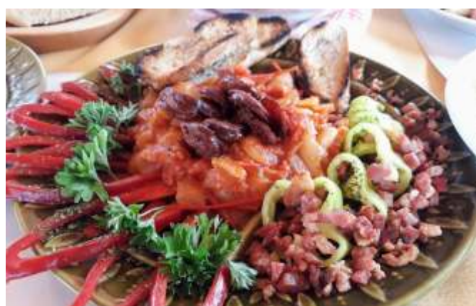
A Pedagógus lecsó