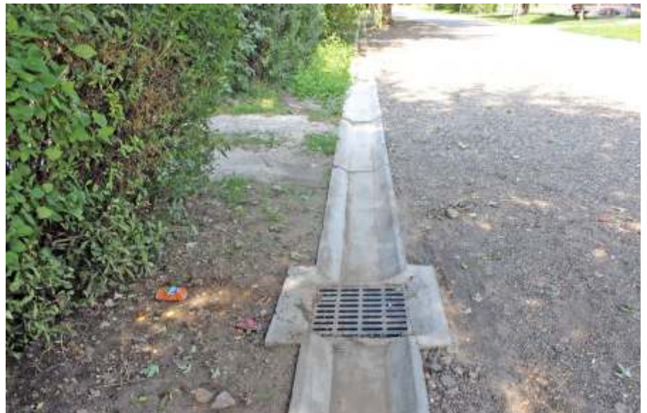
Fedett-burkolt árok a Kossuth úton