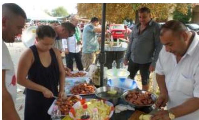
A Vajdák a Romákért Alapítvány csapata