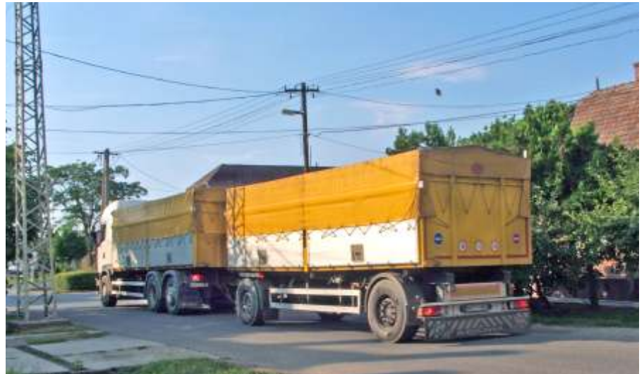
A kamionok miatt panaszkodnak