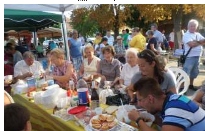
A bőség asztalánál