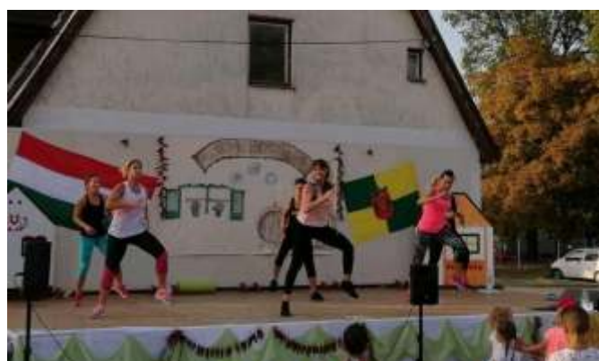
Fanatic Kombi Cserba Beával