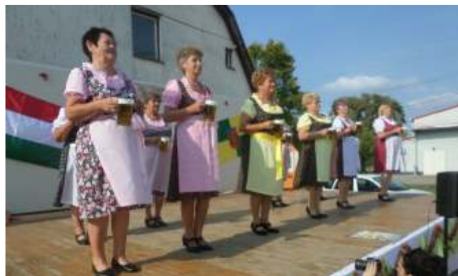
Lecsó mellé bajor sörtánc