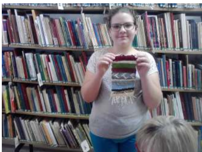
Elkészült a szóttés