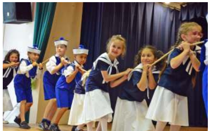
Az óvodások műsora

elkötelezett az iskola tanulókat megtartó erejének javításában. Rendszeresen szervez tanórán kívüli tevékenységeket, elfoglaltságokat a gyermekeknek, számtalan tábor, gyermeknap, sportfoglalkozás fűződik nevéhez. Mindig jókedvű, türelmes és segítőkész. Életpályáját a színesség, sokrétűség, dinamizmus, pontosságra és tökéletességre való törekvés jellemezte és jellemzi.