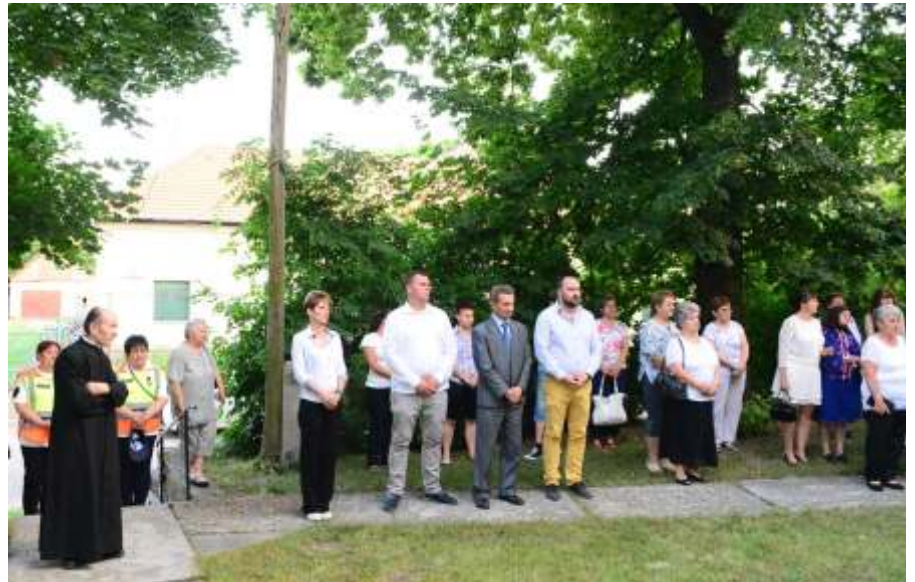
A Nemzeti Összetartozás Napján

Mint azt már korábban is jeleztem, az egészségügyi központunk beruházása