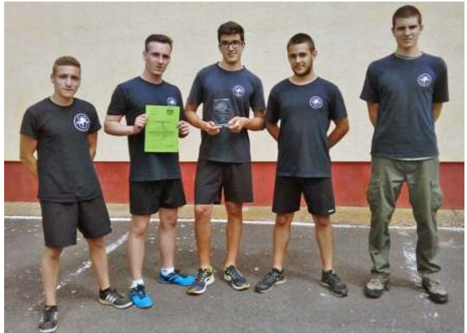
A honvédelmi verseny győztes újszászi fiú csapata