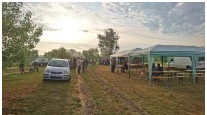
Gyülekező a horgászversenyre