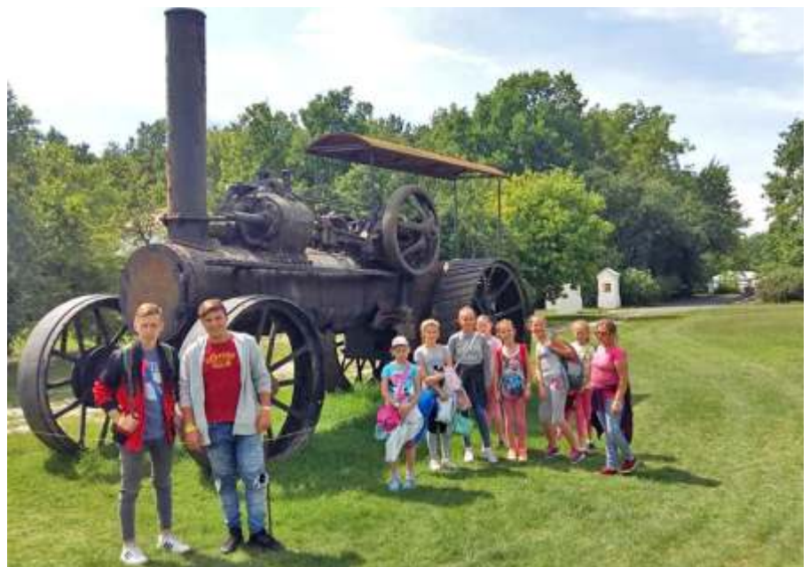
A gőzgép előtt