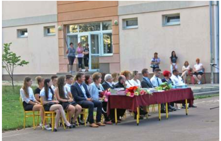
Kitüntettek, szülei és díszvendégek a tanévzárón

és talán a legnagyobb megmozdulás: Kirándulás Budapestre a Csodák Palotájába, a dunai hajózás, ópusztaszeri látogatás, a mátrai túra, a Dunakanyar megcsodálása. Iskolánk csaknem valamennyi