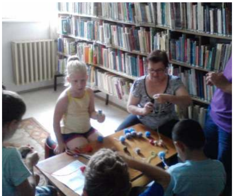
Szöves közben