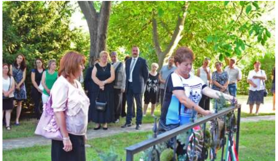
A bölcsőde koszorúzása

az események villannak fel. Mi a közös mindezekben? Mindegyiket – ha nem is azonnal – de a talpra állás követte.