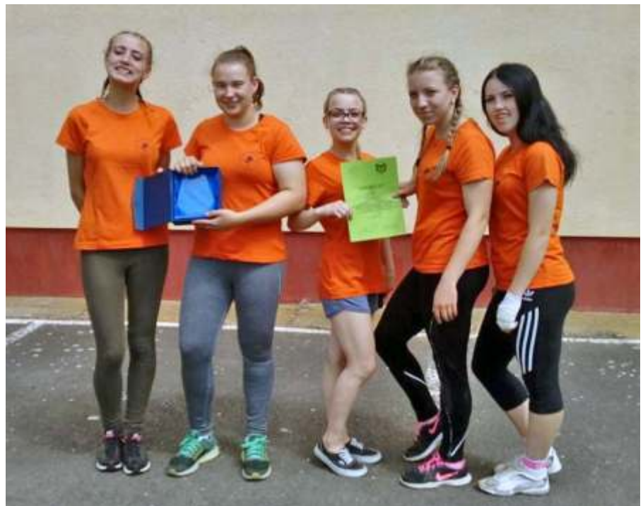
A honvédelmi verseny második helyezett újszászi lány csapata

Végre itt a nyár, eljött ez is, gondolta ezt június közepén 361 diák és 35 pedagógus. Vagyunk azonban néhányan, akiknek nem ért véget június 15-én az iskola. Június utolsó két hetében ugyanis mintegy 130 gyermek és a pedagógusok összesen 7 tematikus táborban vettek részt, kinek a szórakozás, kinek a munka jutott ezekre a hetekre. Ezekből a táborokból hat az iskolában zajlott, egy tábornak, egy hetes