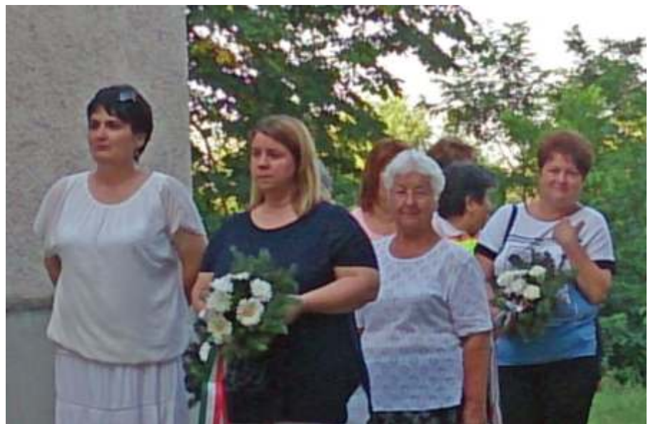
A június 4-i koszorúzáson