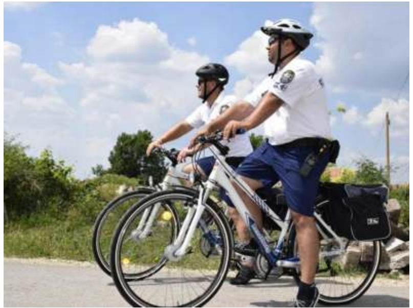
Bringás kopók