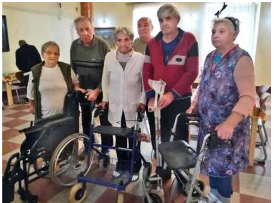
Az otthon lakói az adományokkal

szekrényeket, matracokat, ruhaneműket, kerékpárokat, kerekesszéket, szobavécét, etetőasztalt és egyéb gyógyászati segédeszközöket, továbbá élelmiszert is.