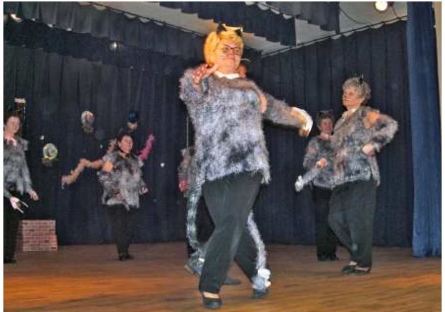
Látványos a Macskák nevű táncuk. A jelmezeket is ők maguk készítik.

– A kiemelt aranyat nyerők 15 ezer forintot kapnak fejenként, a sima arany 10 ezret, az ezüst pedig 8 ezret ér, amit kizárólag az általuk szervezett utazásokra