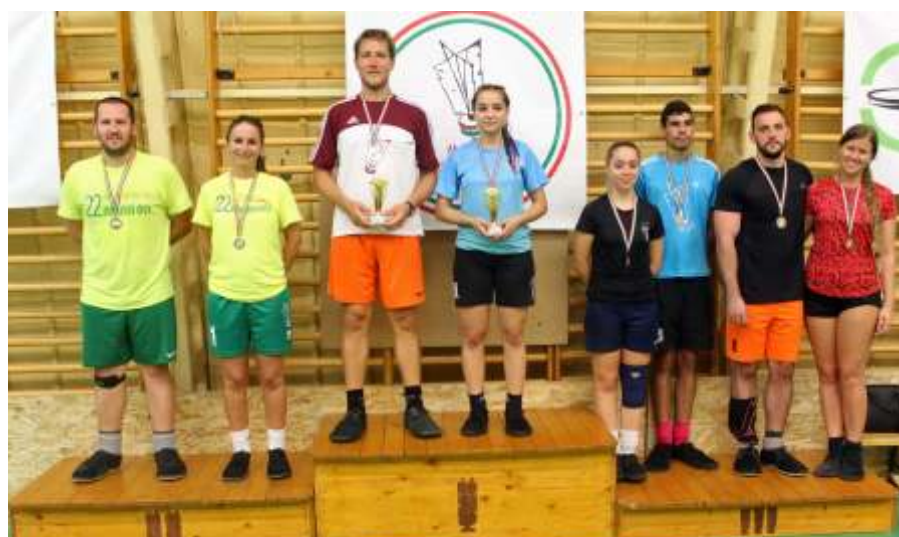
Vegyes párosban az újszásziak elfoglalták a dobogót