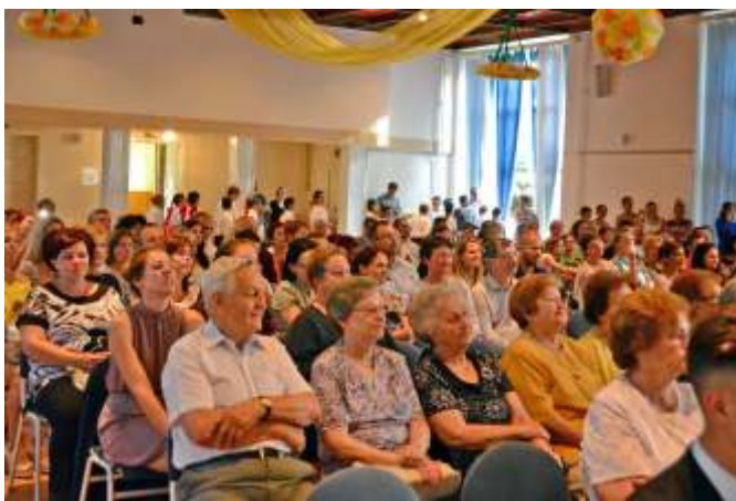
Nyugdíjas pedagógusok is részt vettek a pedagógusnapon

Pályája során törekedett a minél sokrétűbb ismeretszerzésre, módszertani megújulásra. Mivel a sporttal, testi neveléssel mindig is szívesen és sokat foglalkozott, és fontosnak tartotta a tanulók testi fejlődését is a szellemi gyarapodás mellett, szívesen végzett testi neveléssel kapcsolatos tanfolyamokat, tréningeket is. 2013-ban másoddiplomát is szerzett a Szarvasi Tessedik Sámuel Főiskolán, gyógy testnevelői szakon. Ettől kezdve az iskolában egyrészt tanítóként, másrészt gyógy testnevelőként végzi oktató-nevelő munkáját.