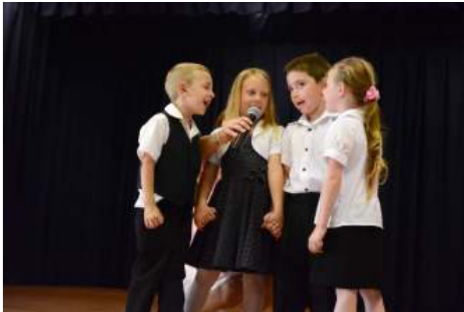
Az óvodások köszöntője