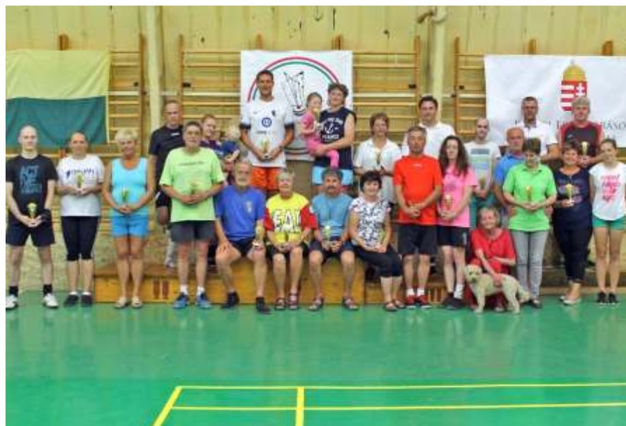
A 18. Szenior OB résztvevői