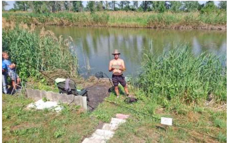
Jó fogás

Előtte a Partir Offrir szervezet képviselőjében az intézménybe ellátogató svájci, francia barátaink adományoztak ágyakat, szekrényeket, éjjeli-