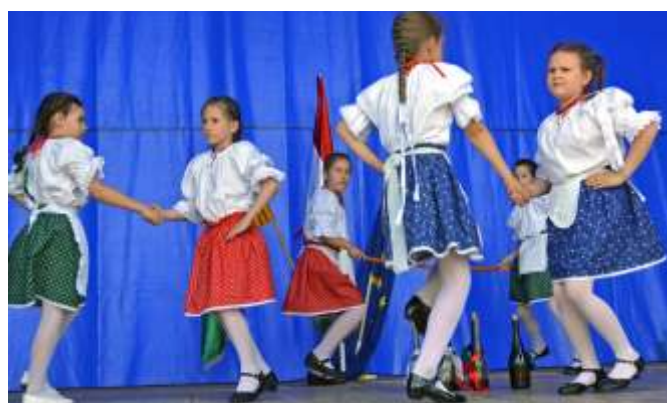
A Kisliliom néptáncscsoport tagjai