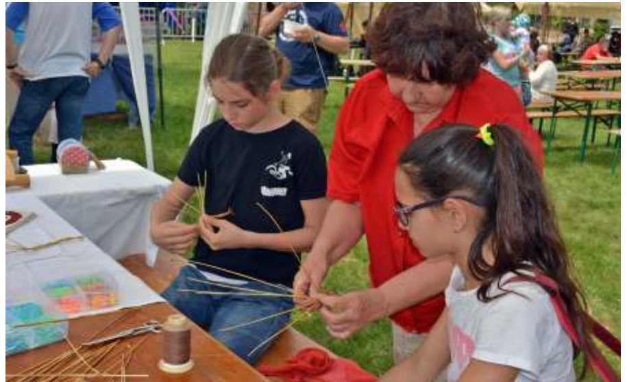
Ismerkedés a szalmafonással

A Fordulat táncscsoportnak igen sűrűre sikeredett a hosszú hétvége. Szombaton Debrecenben minősítő versenyen vettek részt nagy sikerrel, hiszen arany minősítést kaptak, ráadásul elnyerték az év táncosai különdíjat is. Nagyon büszkék vagyunk rájuk! Vasárnap a Tánc gálán vettek részt, és majálisunkon bennünket örvendeztettek meg táncaikkal. A kezdő csoport vidéki fantázia címmel countryt táncolt. A középhaladók egy modern dzsessz-balettet, macskatáncot adtak elő Mihályi Ricsi egyéni szólótáncot mutatott