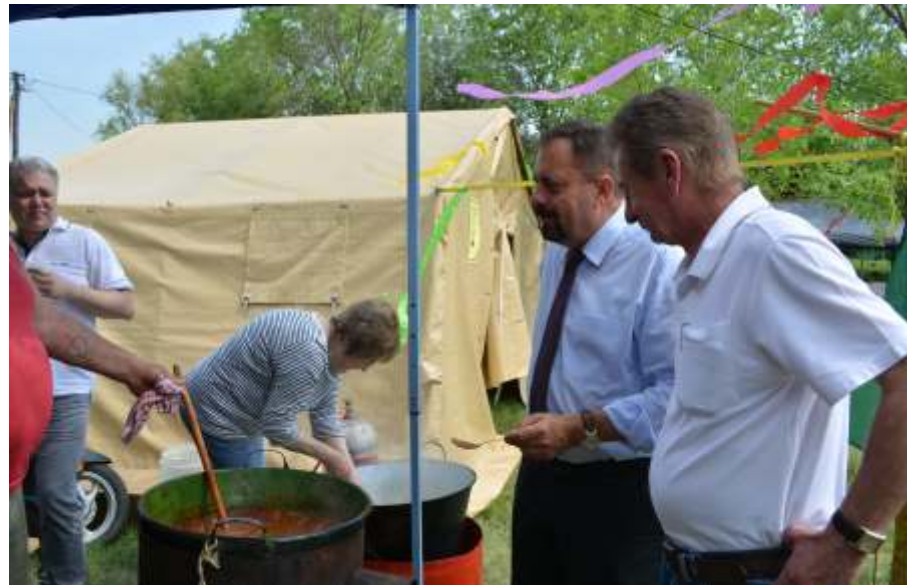
Birkapörkölt kóstolás Pócs János országgyűlési képviselővel

– Az egészségügyi központ új műszaki tartalmát az Irányító Hatóság elfogadta. Ennek megfelelően elindítottuk a közbeszerzési eljárást, melynek eredményét várhatóan május közepéig kihirdetjük, és