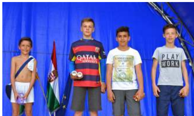
A kispályás labdarúgó verseny helyezettei