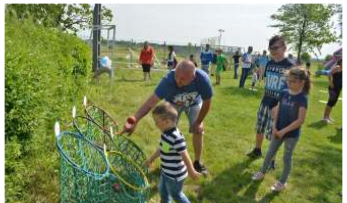
Ügyességi játékok várták a gyerekeket