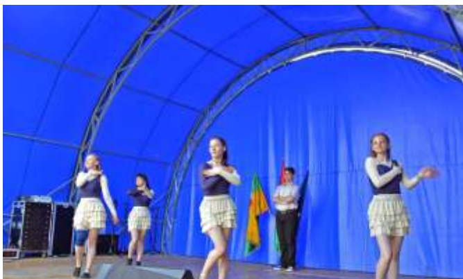
A Fordulat táncsoport arany minősített juniorjai