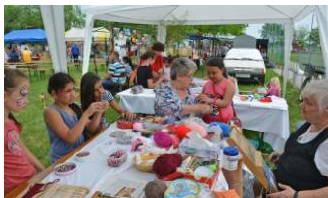
A Népi Díszítőművészeti Szakkör többféle tevékenységgel készült