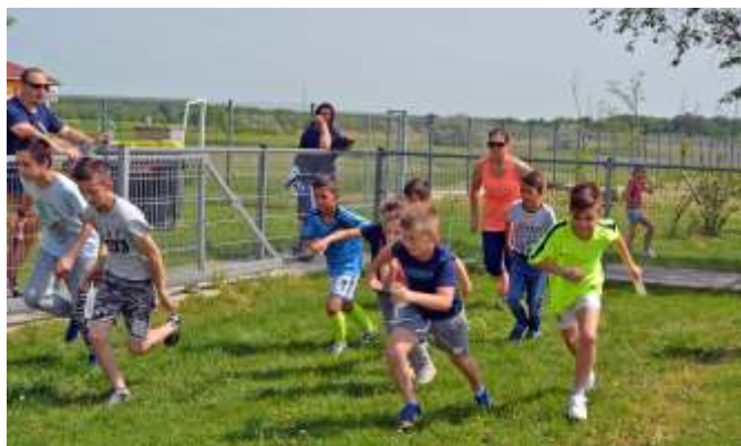
A futóverseny rajtja