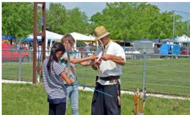
Népszerű volt az íjászat