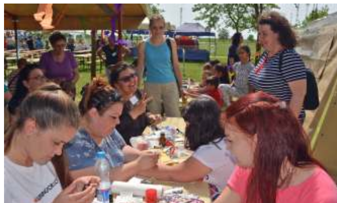
Arcfestés és csillámtetoválás