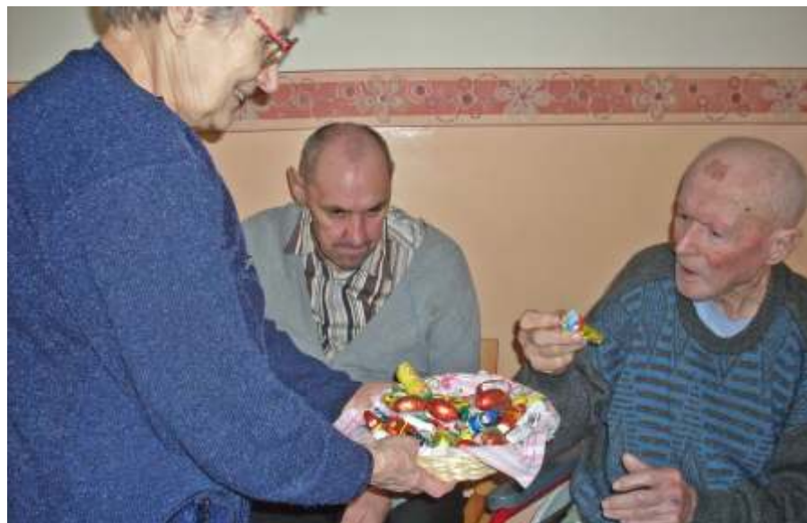
A locsolásért tojás járt