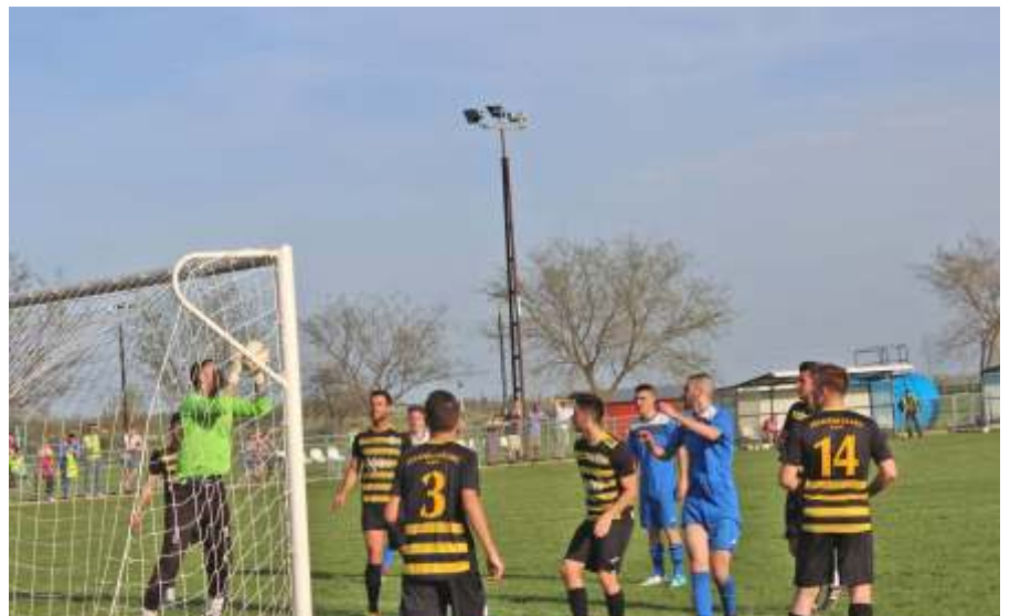
Sajnos, ebből az újszászi támadásból nem lett gól