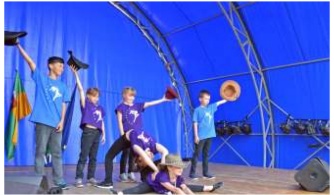
Country a Fordulat táncsoport kezdői előadásában