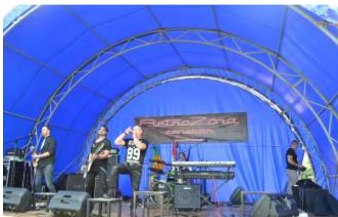
A nap sztárzenekara