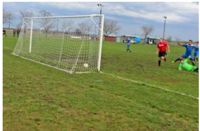
Az első gól a karcagi hálóban

A szajoli bravúr után hazai pályán fogadtuk Karcagot, természetesen a győzelem reményében. Az időjárás és a felázott talajú pálya sem kedvezett a csapatoknak, így várható volt, hogy nem a szép játék, hanem a küzdelem fog dominálni a kilencven perc során. Szerencsére a múlt heti lendületünk nem tört meg, rögtön támadólag léptünk fel, és szinte a kapujuk elé szegeztük el-