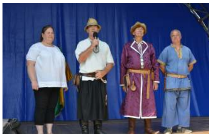
A Besenyszögi Íjász Egyesület tagjai