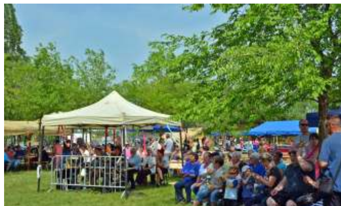
A lelkes közönség