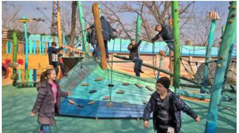
Az állatkerti játszótéren