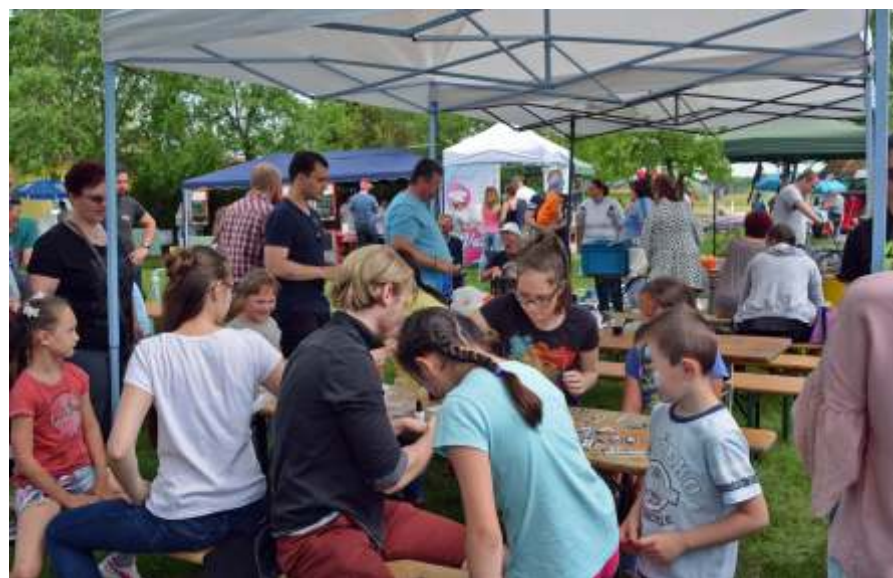
Sokan voltak a majáliston

Felelős szerkesztő: Fehér Judit ♦ Olvasószerkesztő: Fehérmé Szekeres Zsuzsanna ♦ Tördelőszerkesztő: Kovács Nándor ♦ Szöveg bevitel: Ulvizki Józsefné ♦ Állandó tudósítók, munkatársak: Fehér János (sport), Szurmai Tibor (sport), Ulvizki Józsefné (első kézből, civil szervezetek), Varga László (sakk) ♦ Nyomja: 750 példánybana ReproStúdió –Szolnok. ♦ Nytsz: B/PHF/505/SZO/90 ♦ Levélcím: 5052 Újszász, Könyvtár Damjanich út 2.