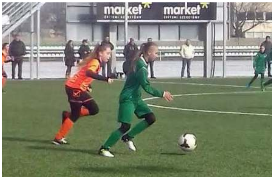
Turza Melitta támadásban

„Anya a mérkőzésekre is eljön. Sokat és messzire utazik. A kiemelt osztályban