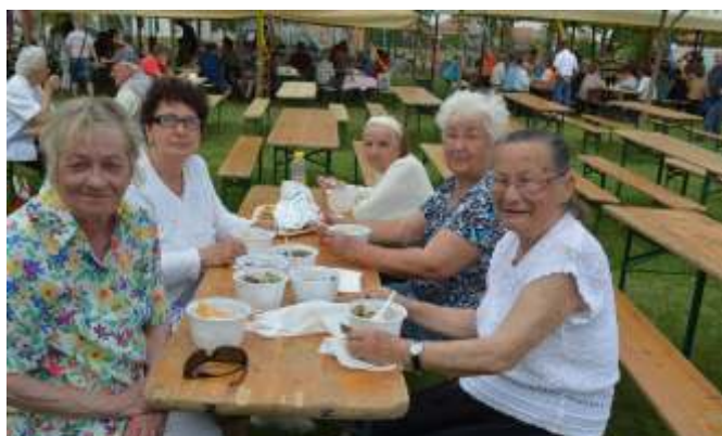
Nagyon finom volt az ebéd