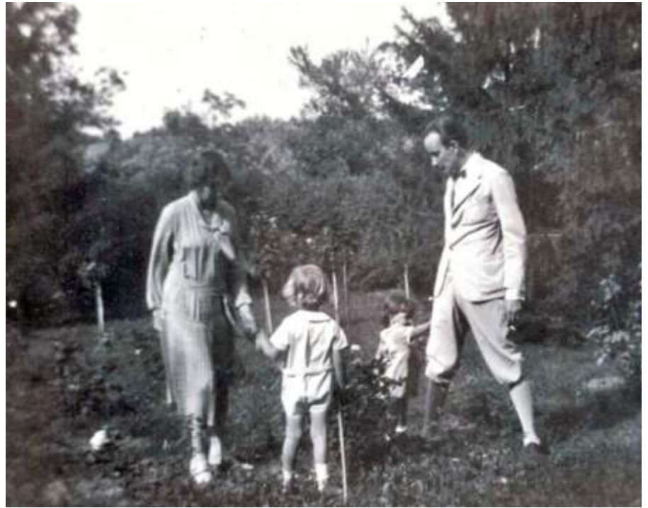
A bárónő szüleivel, az újszászi kastélyparkban