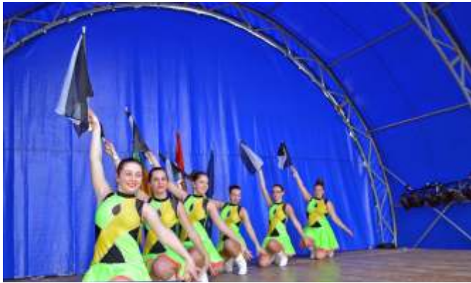
A Zagyvarékasi Dream Dance Mazsorett és Táncsoport