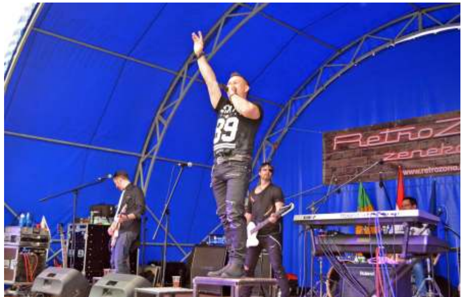
A RetroZona zenekar