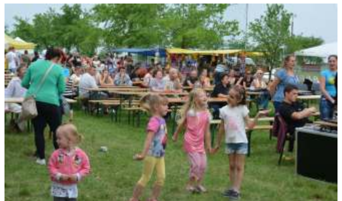
A kicsik jól érezték magukat a koncerten