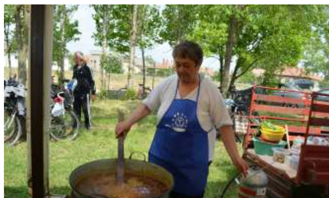
Rotyog a finom babgulyás