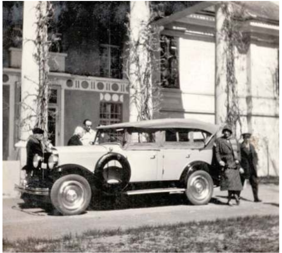
Emlék a szeghalmi évekből

Néhány éve elhunyt férje sokáig fizikai munkásként dolgozott, míg lezárhatja jogi tanulmányait. A rendszerváltás