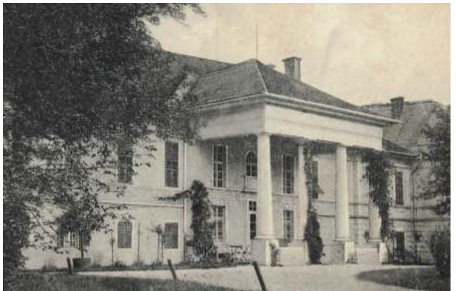
A szeghalmi kastély korabeli felvételen

után a család kárpótlásként visszakapott némi földet újszászi birtokukból, ma ez jelent valamiféle anyagi könnyebbséget számukra.