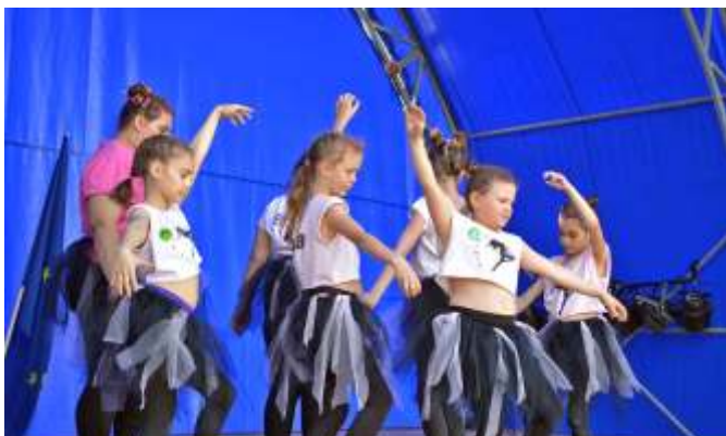
A középhaladók dzsesszbalettje