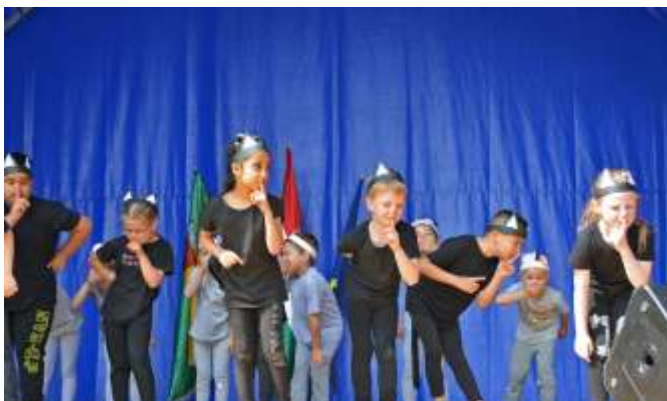
Az óvodások macska tánca