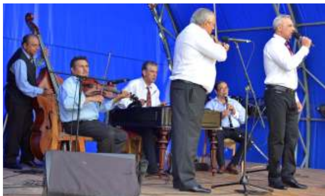
Ebéd utáni nótaszó