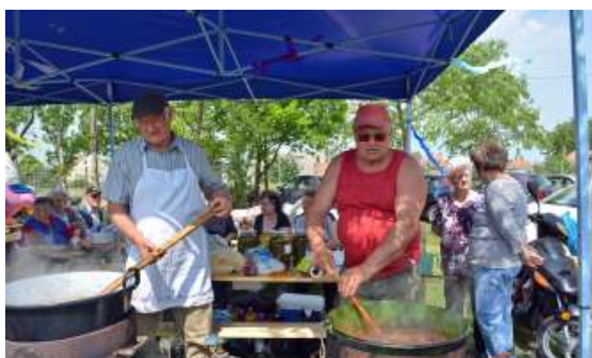
Egy üst marhapörkölt és egy üst birkapörkölt