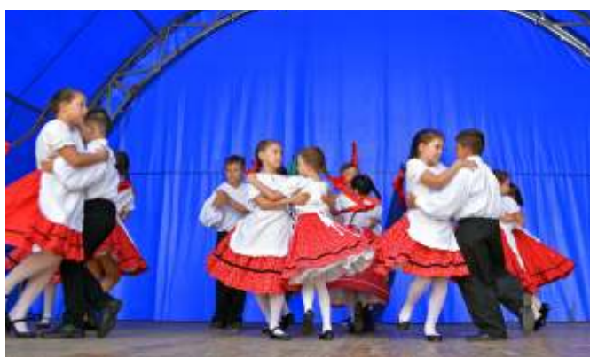
Az Újszászi Vörösmarty Mihály Általános Iskola néptáncosai