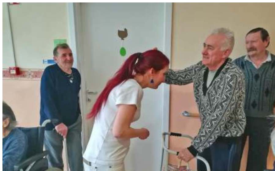
A dolgozók sem maradtak ki a locsolkodásból