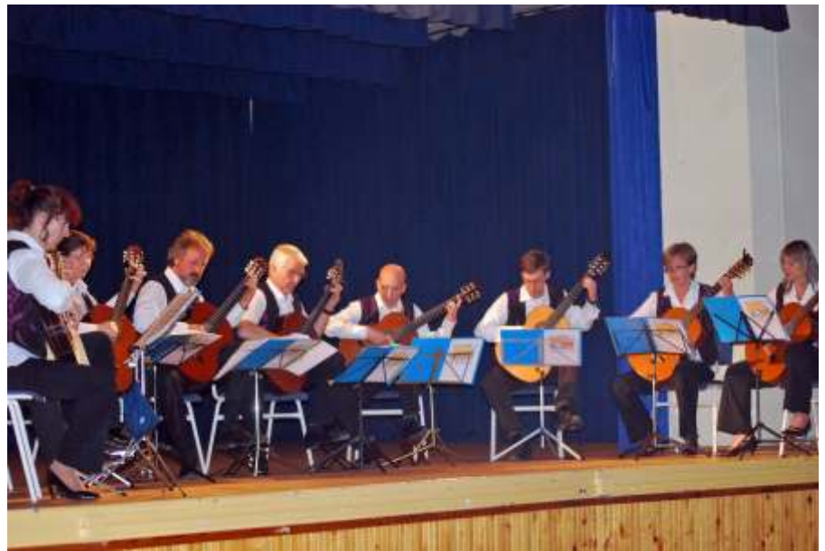
Április 21-én Újszászon vendégszerepelt a megyében turnézó Guitar 'Essone francia-portugál akusztikus gitár együttes

Február elején két óvodás csoportot fogadtunk a könyvtárban: A Hamupipőke csoport a vízi élővilágról, a Méhecske