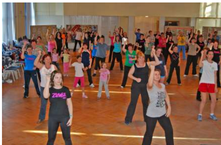
Újszászon is hódít a Zumba