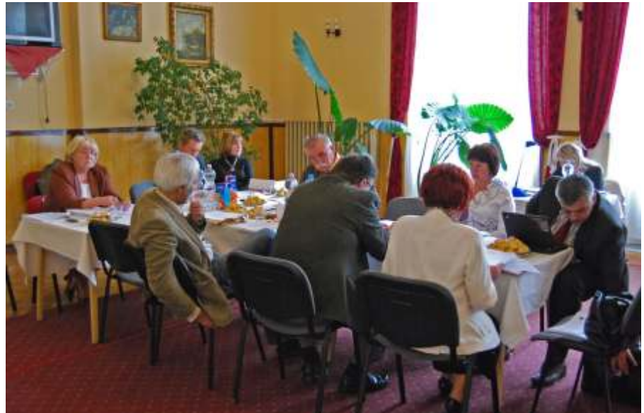
Kihelyezett ülés a szociális otthonban