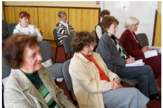
Az egyesület tagjai a felkészítő beszélgetésen

Az Együtt Újszászért Egyesület vezetősége