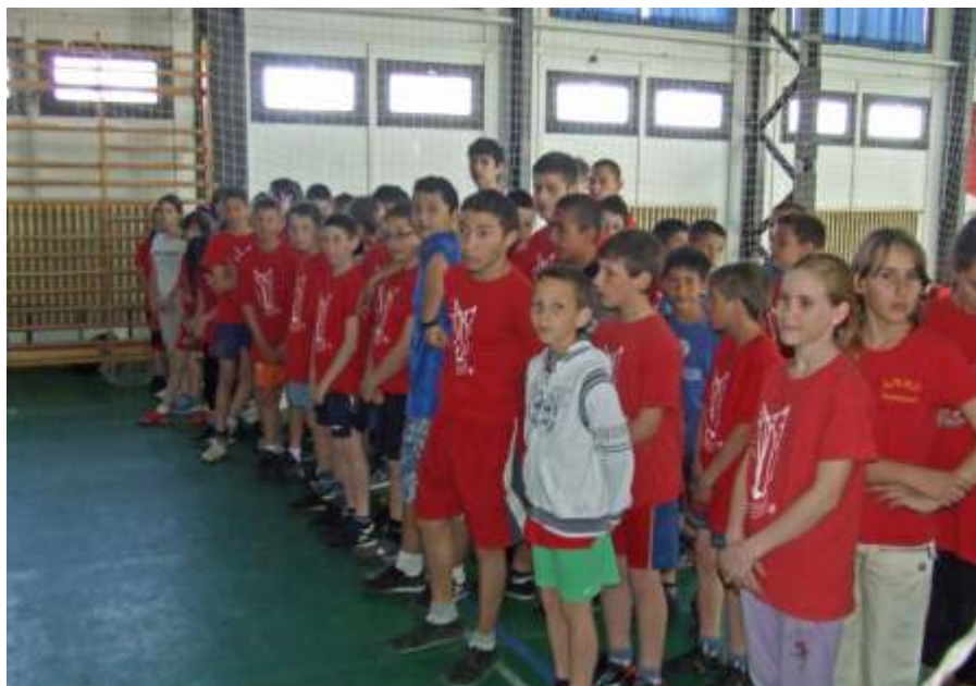
A Vörösmarty csapat a megyei diákolimpia megnyitóján