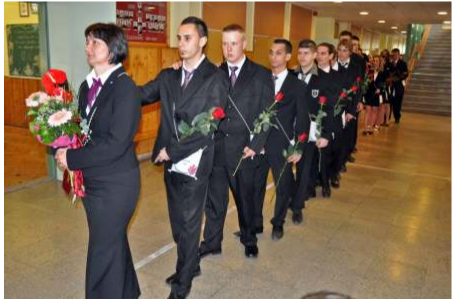
Ballagó diákok

Végző búcsú pedig diáktársaimhoz szól, és ahhoz a kis osztályközösséghez,