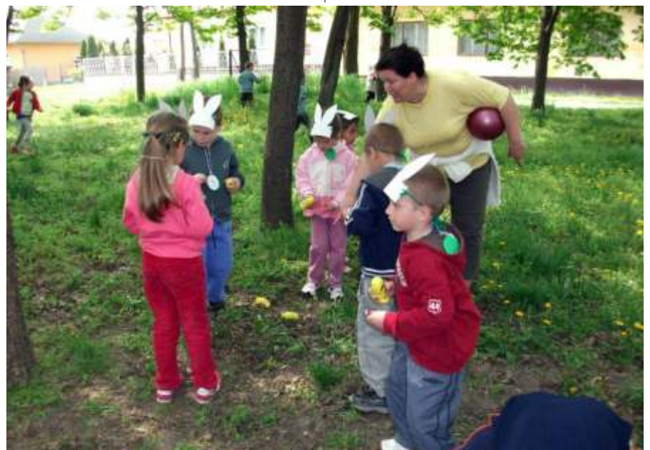
Hol rejtőznek a tojások?