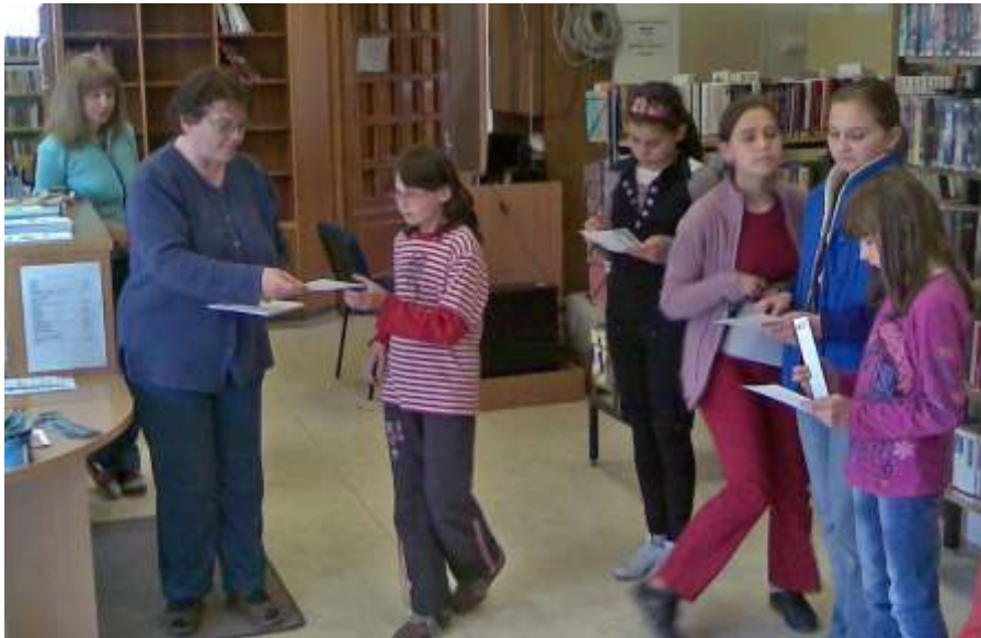
A vetélkedő díjazottjai