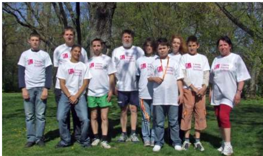
A Vivicittá újszászi résztvevői

Elsőként a Midicittá futói rajtoltak el. Az egész napra jellemző remek hangulatot is megalapozták a 6.5 kilométeres táv résztvevői. És innentől kezdve, mintha valami lavina indult volna el, szinte maguktól alakultak az események. Jött a Minicittá bemelegítése, aztán a 3.5 km-es táv első rajtja, melyre az iskolai indulók teremtettek hihetetlen hangulatot. Rögön utánuk a gyaloglók indultak el a 3,5