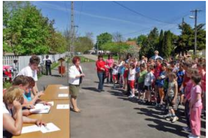
A verseny megnyitója

Iskolánk IPR-es programjában vállalta az ilyen és ehhez hasonló rendezvények támogatását, ahol a Városi Polgárórság az útvonal biztosításában segített, a tanulók szülei közül pedig néhányan aktív közreműködői voltak a futóverseny lebonyolításának. A több mint kétszáz benevezett diák jutalmazását és a díjait az iskola támogatta. Ezúton is köszönjük az értékes nyerevényeket!