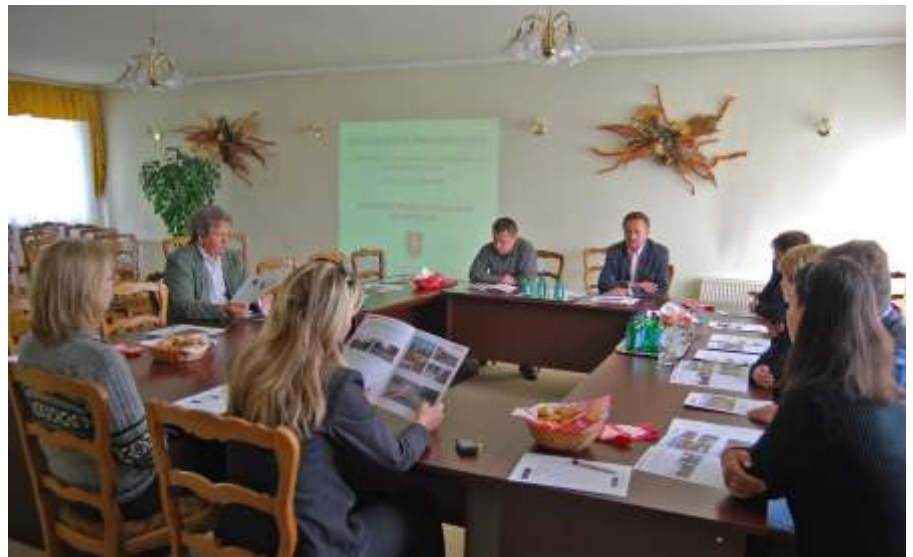
A Dózsa György úti fejlesztés projektzáró rendezvénye

Április 12-én tartotta a város önkormányzati testülete soros ülést. Néhány gondolatot szeretnék megosztani önökkel erről a munkautalásról. Több fontos kérdés és tájékoztató meghallgatása mellett számomra talán legfontosabb a 2010. évi költségvetési zárszámadás elfogadása volt. Ami a bevétel és kiadás nagyságát illeti, látható, hogy a város elmúlt évi gazdálkodásában nagy szerepet játszottak a megnyert pályázatok kivitelezési munkálatai.