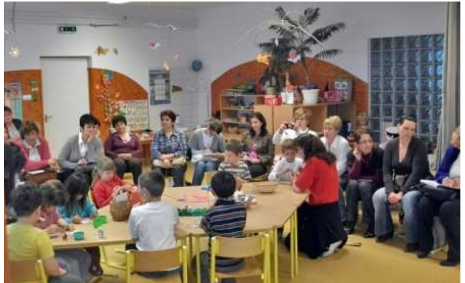
Szó, fon, nem takács

A szakmai program kerekasztal beszélgetéssel zárult. A megye nyolc településé-