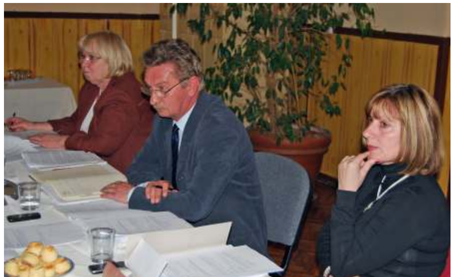
Képviselő-testületi ülésen

Ez a szám impozáns, hiszen több mint 2 milliárd forint bevétellel és kiadással számoltunk az elmúlt évben. Nagyszerű dolog, és az elmúlt évek pályázatait munkálatait dicséri, hogy a város vagyona közel 3.800 millió forint. Azt lehet mondani tehát, hogy az elmúlt években, így tavaly is nagymértékben gyarapítottuk közös értékünket, a város vagyont. Szembetűnő az is, hogy az elmúlt évek gazdálkodása a bennünket körülvevő gazdasági környezet hatására a mindenkori adóforintok felhasználása a foglalkoztatott létszámban is megjelenik. A néhány éve még 375 főt foglalkoztató önkormányzat létszáma 334 főre csökkent. Számomra ez felelős gazdálkodást jelent, megértve azt is, hogy akinek a munkája megszűnt, az esetleg nagyon rosszul élte azt meg, de elsősorban az jellemezte létszámgazdálkodásunkat, hogy nem elküldtünk, hanem a nyugdíjazás miatt megszűnt helyeket nem pótoltuk. Egy igen érdekes számot szeretnék Önökkel közölni, ami megjelent a zárszámadásban. A város hitelképessége jó, hiszen a jelenle-