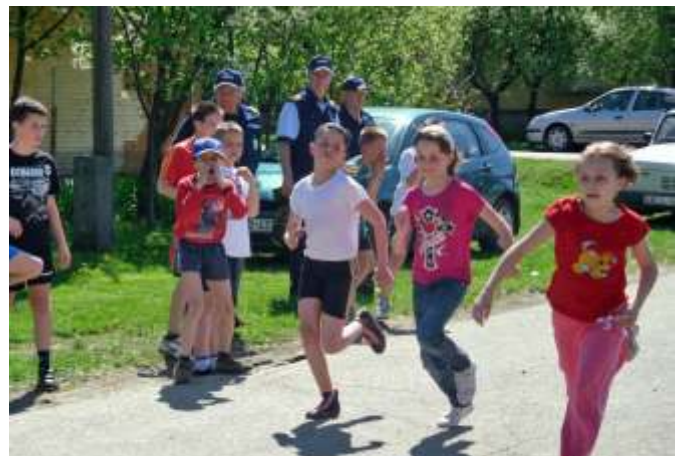
60 méteres futás (Fotó: Bartáné Mucza Tünde)