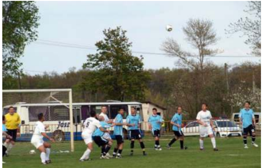
A kunszenti kapu előtt