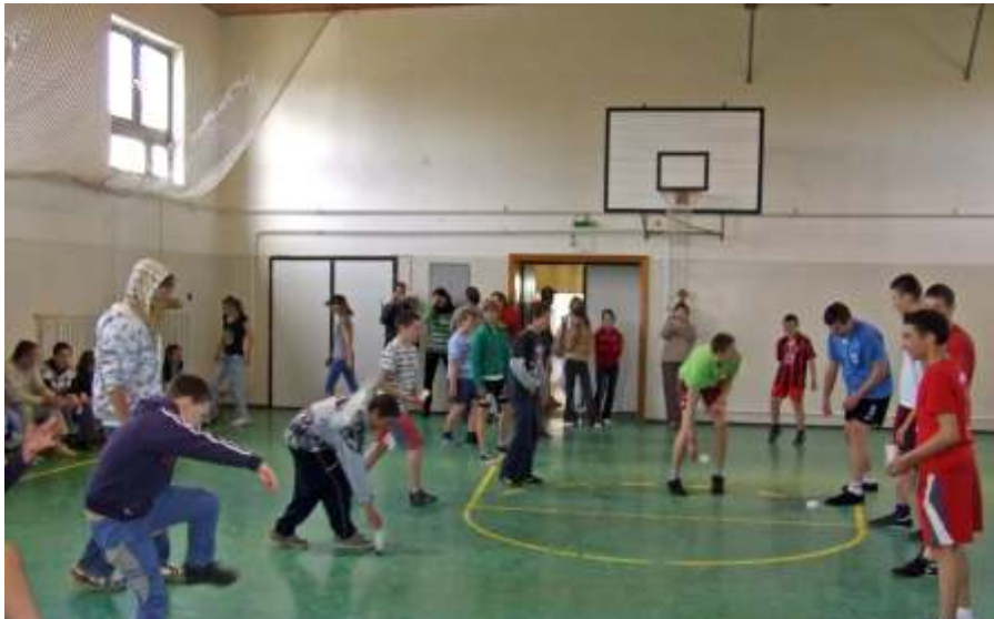
Játék a kengyeliekkel