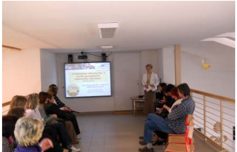
Szakmai napon a kertvárosi iskolában

– A képesség-felhasználásra való törekvés kielégítésének lehetőségei a fej-