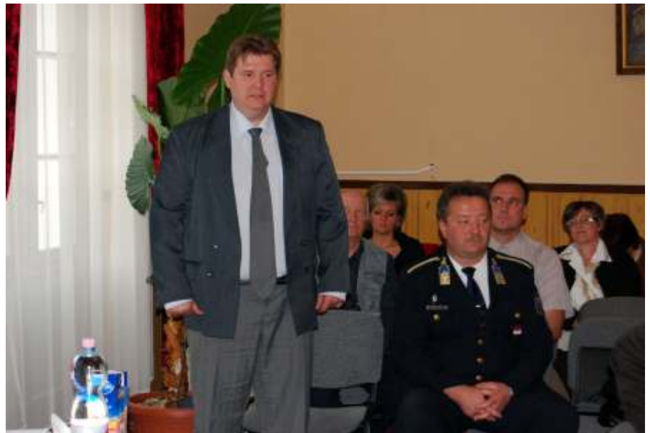
A rendőrség, a polgárőrség és a közbiztonsági alapítvány vezetői közösen számoltak be a közbiztonság helyzetéről

A hulladékkezelési díjtámogatásnál a változás, hogy a hulladékkezelési díjtámogatást a normatív lakásfenntartási támogatásban részesülő személy részére a lakásfenntartási támogatásra való jogosultság fennállásának idejére állapítja meg a polgármester. A támogatásra jogosult időskorúak esetében pedig 2012. március 31. napjáig kerül megállapításra a támogatás. A támogatás kifizetésére ebben az esetben a kérelem benyújtását