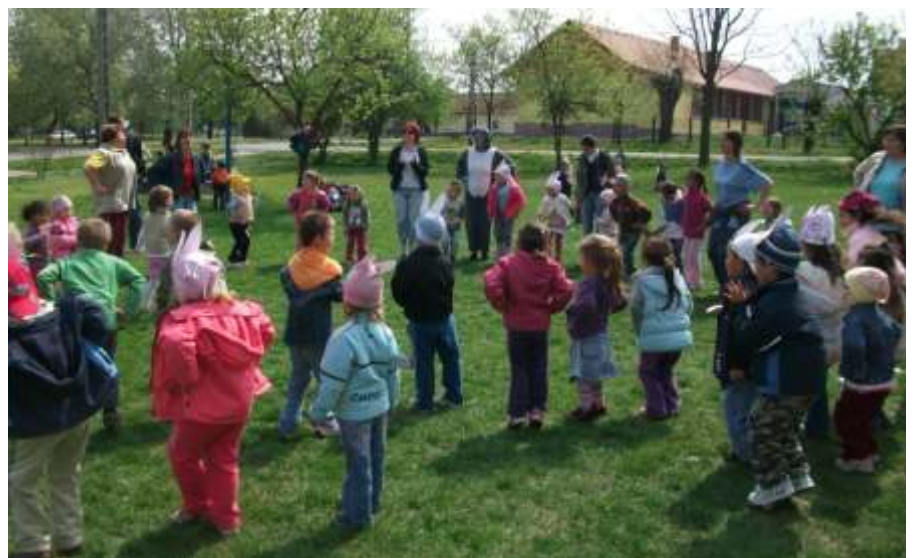
Nyuszik a fűben