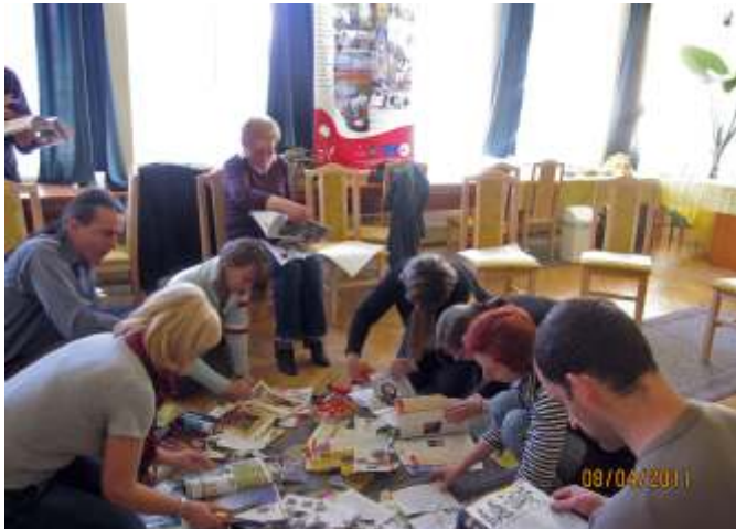
A tréning résztvevői