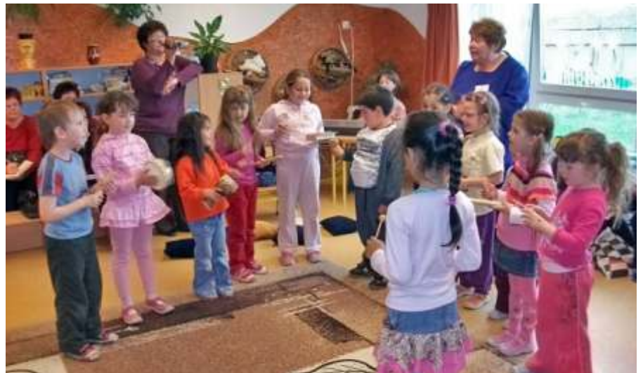
Hangszeres bemutató