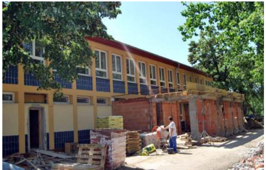
Folyik a középiskola felújítása

jai és osztályfőnökei kapnak számítógépet, mintegy 18 millió forintos ráfordítással, melyet a pályázat kiírója 100 %-ban támogat.