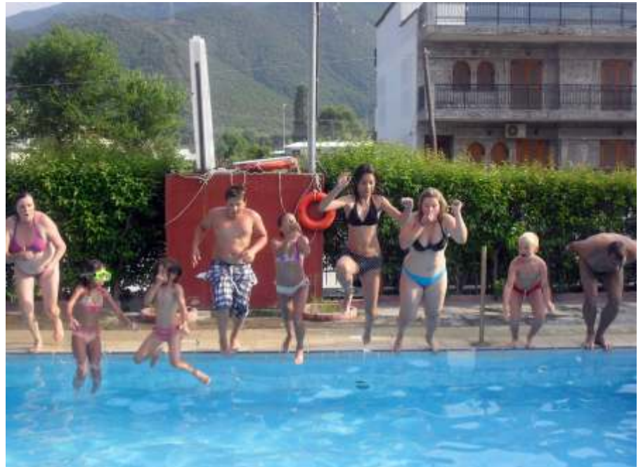
Ugrás a medencébe

Akik első alkalommal utaztak a csoporttal, a pihenés mellett fakultatív kiránduláson vehettek részt Görögország szépségeinek megismerésére. Ízelítőt kaptak az ország kultúrájáról, népi hagyományokról, a Tesszália gyönyörű vidékén levő Meteora (jelentése: levegőben) impozáns szikláiról és az azon épült kolostorairól, miután az az ég és föld között lebegni látszik. Jelenleg hat kolostorban laknak a