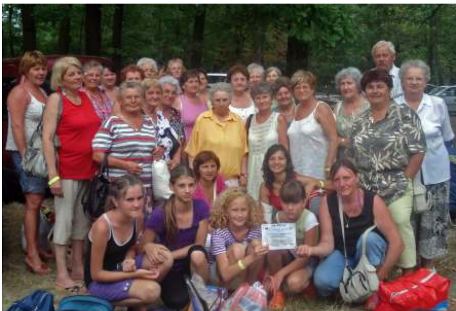
Mezőtúron is sikert arattak