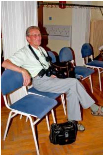
Nagy László fotóművész