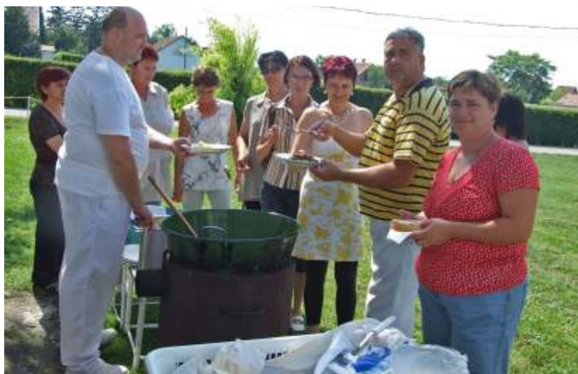
Készül az uzsonna