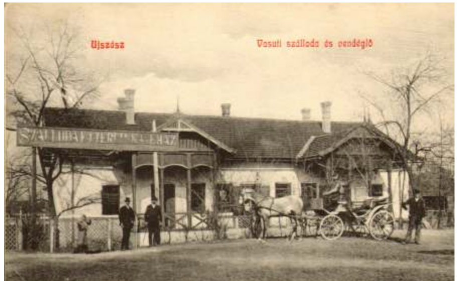
Vasúti szálloda és kávéház, 1909

3) Mozaik levelezőlap 1940. körül. „Hangya fogy. szöv. kiadása; Kariger, Budapest” Régi piactér a Községházával – Hangya főépület a Horthy Miklós úton („nagyhangya”) – Hangya fióküzlet az Orczy úton („kishangya”) – Szent István templom.