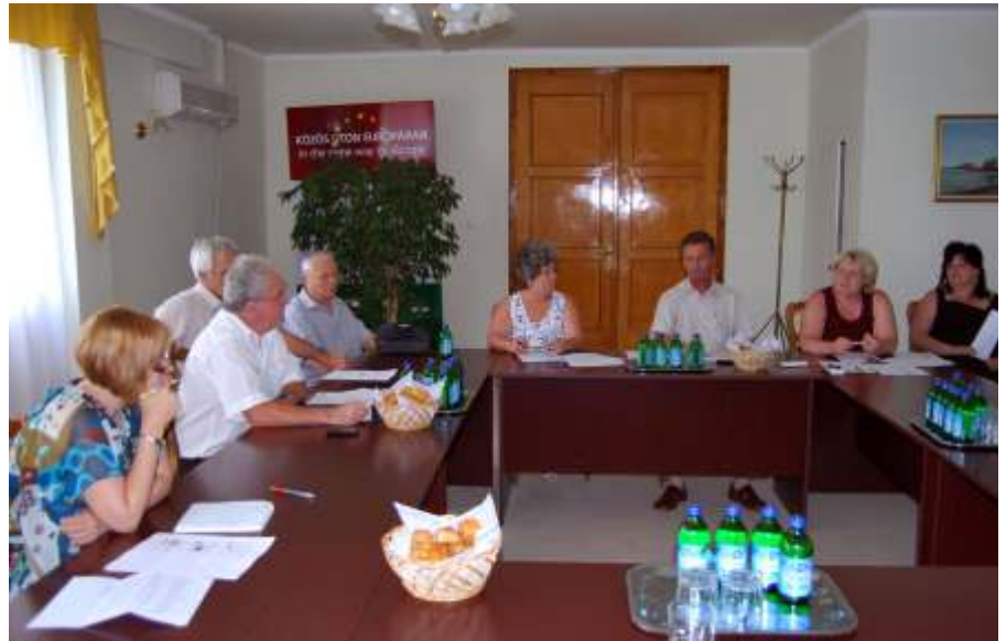
Projektnyitó rendezvény

Augusztus 2-án döntött az önkormányzat közbeszerzési bizottsága a tanulói laptopok közbeszerzési eljárásának megindításáról. Az eljárás lefolytatása várhatóan október közepéig lezárul. Ennek eredményeképpen hat osztály diák-