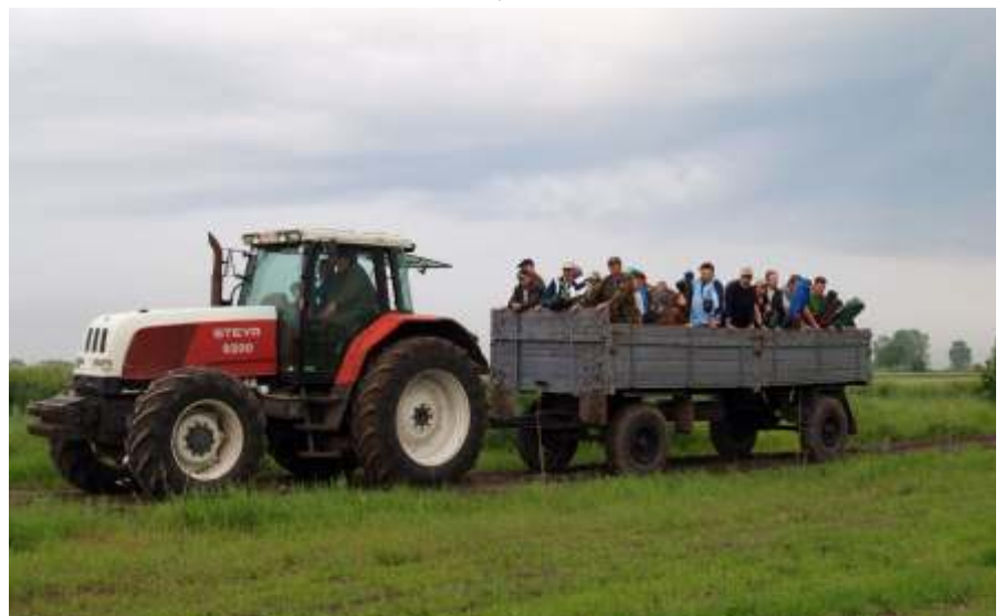
Indulás a versenyre