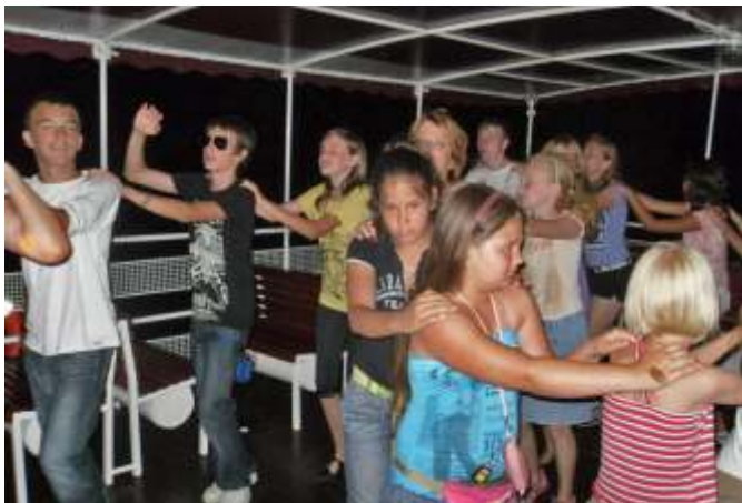
A Diszkó hajón

ba sokszor belefért egy kis társasjáték, kártyaparti és twister is. Fehér pólót lehetett batikolni, decoupage technikával díszíteni. Színvonalas, jókedvű foglalkozások voltak, de hát a Balatonra mégsem ezért jöttünk!