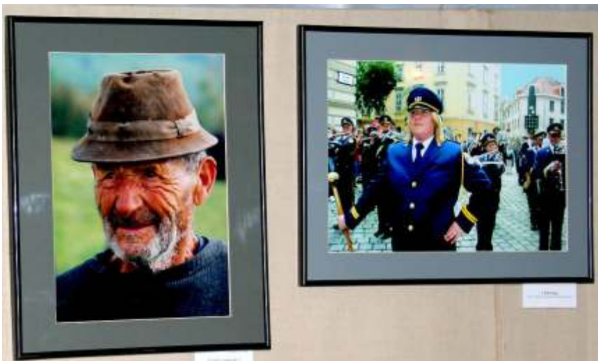
A művész alkotásaiból