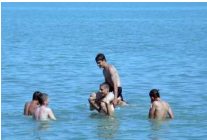
Fürdés a Balatonban

A programok közül nagy sikere volt a tréfás sorversenyeknek, az ügyességi feladatoknak, készíthettek a gyerekek bőrből, gyöngyből ékszereket maguknak, valamint ajándékba. Egy másik alkalommal hűtőmágneseket is festhettek. Az esti program-