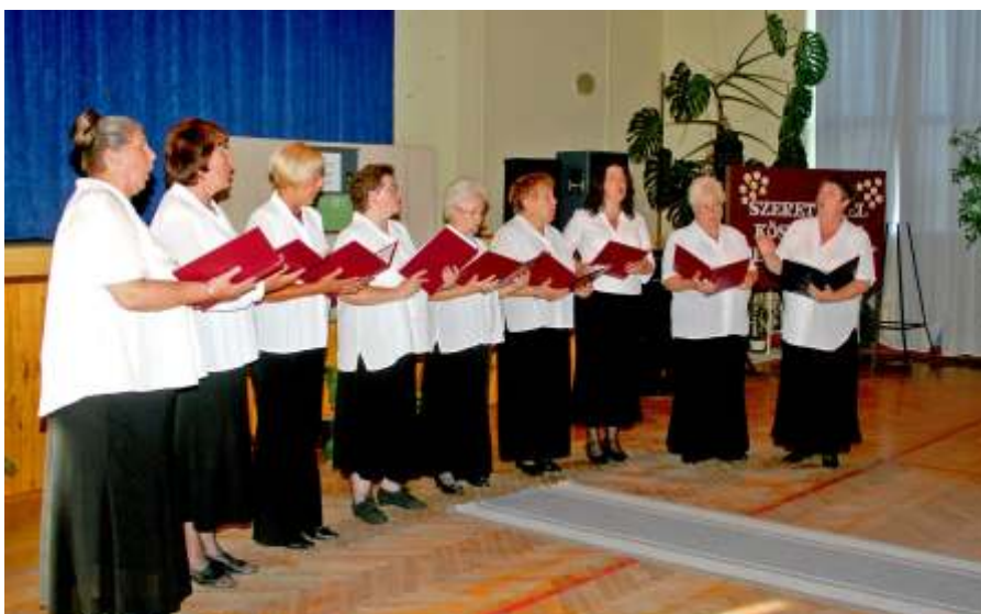
Az Operabarátok Kamarakórusa a kiállítás megnyitóján