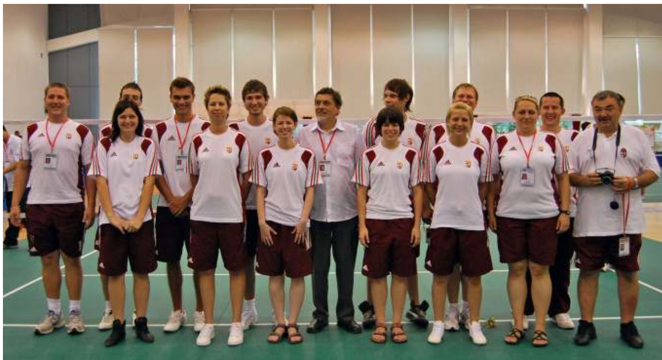
A magyar válogatott

India (21-5, 21-9) legyőzése után vereség Kínától (21-13, 21-16), majd a bronzéremért 17-21, 21-16, 21-19-es győzelem a makaói páros ellen, amelyben a többi pá-