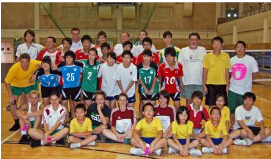
Barátkozás a makaóiakkal