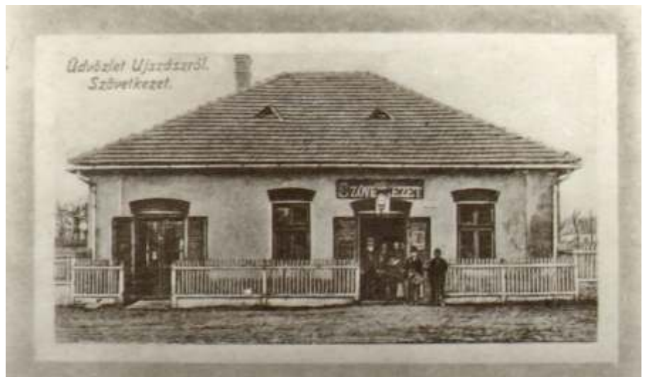
Szövetkezet, 1918 körül