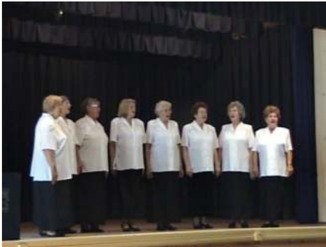
A műsorban fellépett a Százsorszép népdalkőr