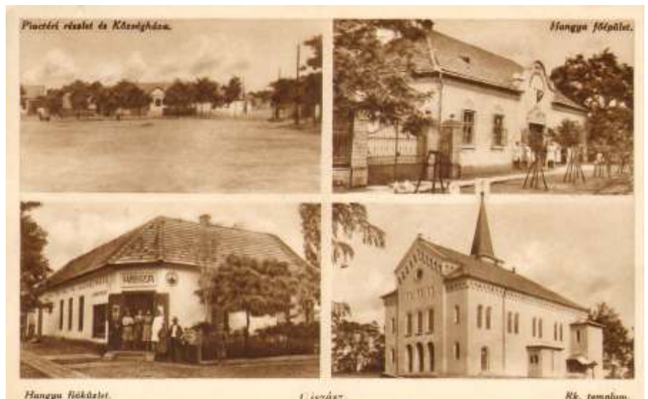
Mozaik levelezőlap 1940 körül