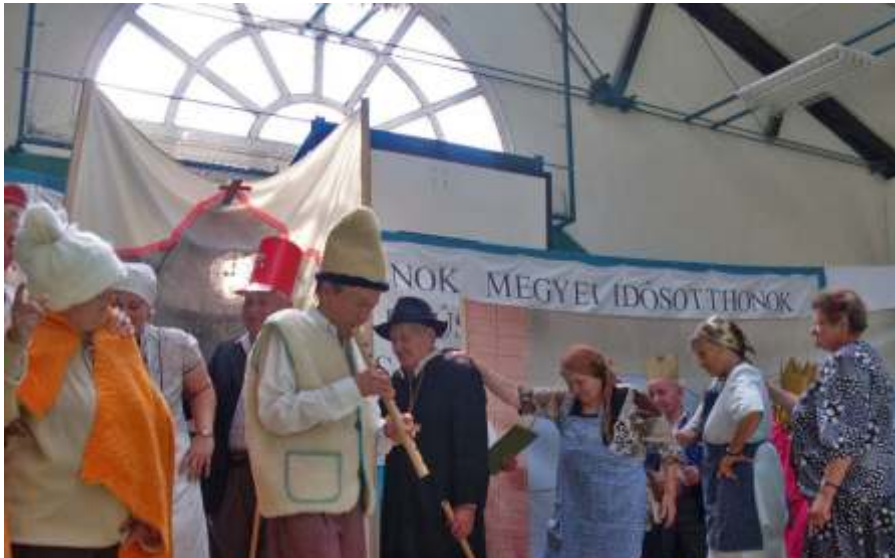
Részlet az Aranyzórú bárányból

nek minden ellátottunkhoz volt pár dicsé- rő, bátorító szava, ami megtette a hatását. Elmondhatjuk, hogy elégedetten, büszkén töltötték ezt a napot az intézmény képvise- letében induló ellátottaink.