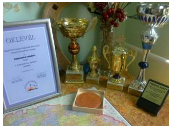
Az elnyert díjak

– Május 1-jén Gyomaendrődön volt csapatom a Nemzetközi „Sajt és Túró Fesztiválon”. Ragyogó időben elment a kenyérlángos a finomabbnál finomabb sajtok és túrók mellé.