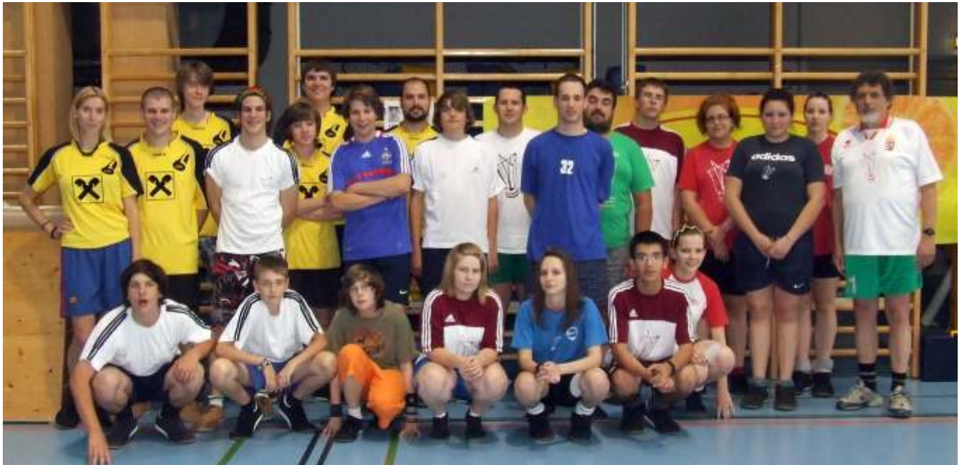
Együtt a mönchhofi és az újszászi lábtoll-labdázók