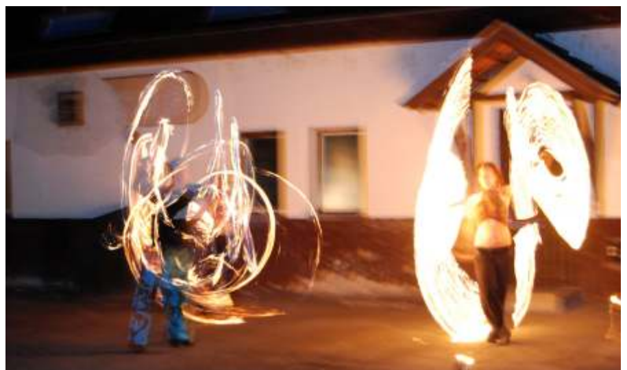
A miskolciak látványos tűztánca