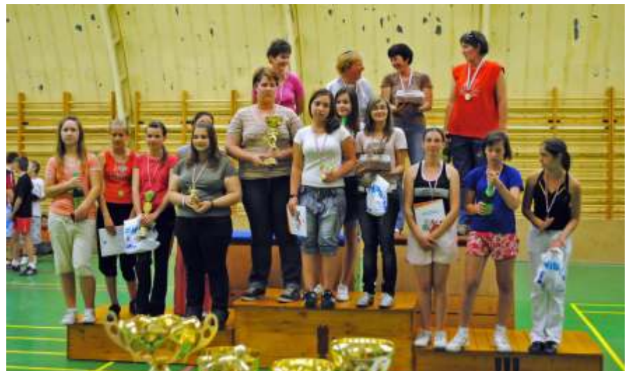
A Vörösmarty Kézilabda Bajnokság legjobb csapatai