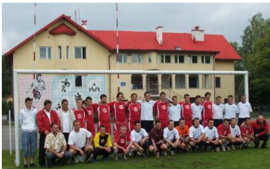
Lengyel-magyar mérkőzés