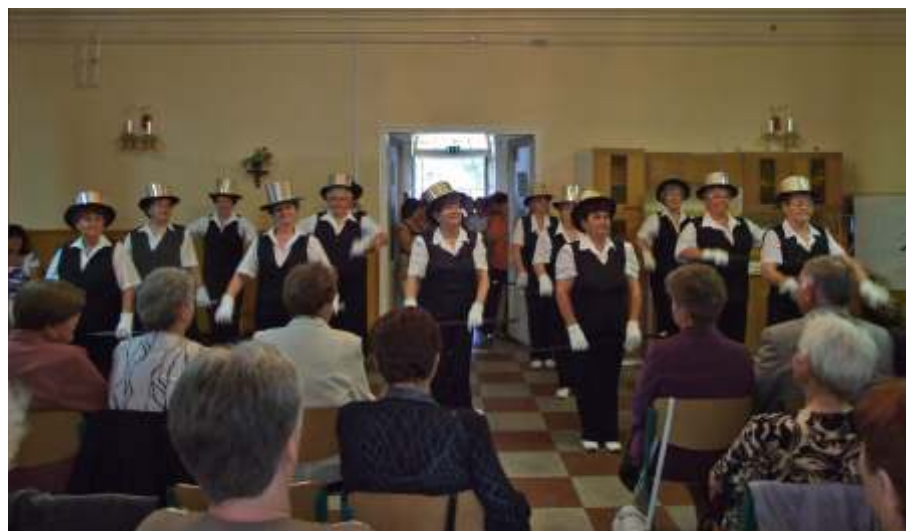
A Nosza Mamik látványos műsora