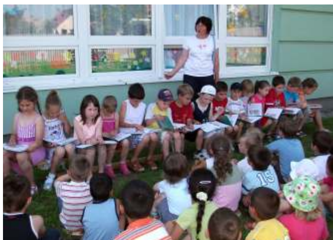
Elsősök az oviban