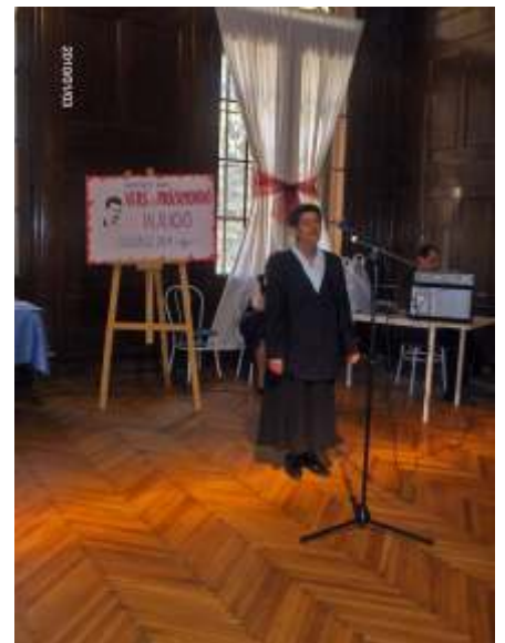
Versmondó verseny a Költészet napja alkalmából

Igyekezünk méltón felkészülni a pünkösdre is. Az énekkar új dalokat tanult, s az irodalomkör tagjaival együtt tartott foglalkozásokon felelevenítettük a pünkösdös hagyományát. Mivel a pünkösd a vallási életben is jelentős szerepet tölt