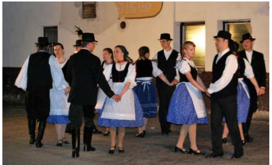
A Liliom táncsoport később táncba vitte a közönséget is