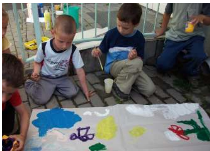
Készül a festmény