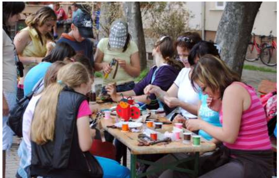
Kézműves foglalkozás