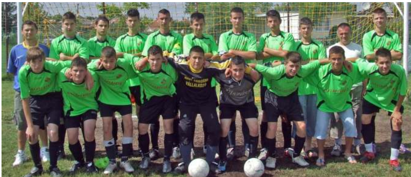
Az Újszászi VVSE 7. helyezett ifjúsági csapata