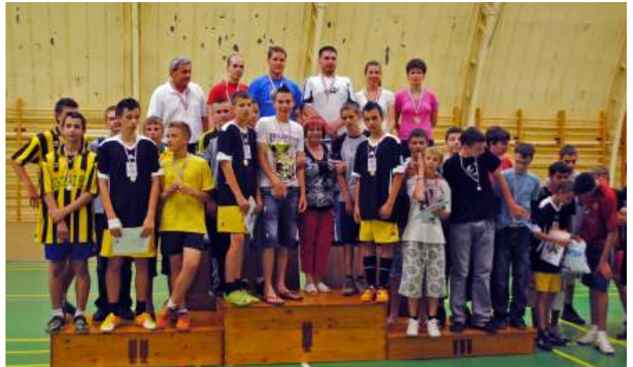
A Vörösmarty Teremlabdarúgó Bajnokság eredményhirdetése