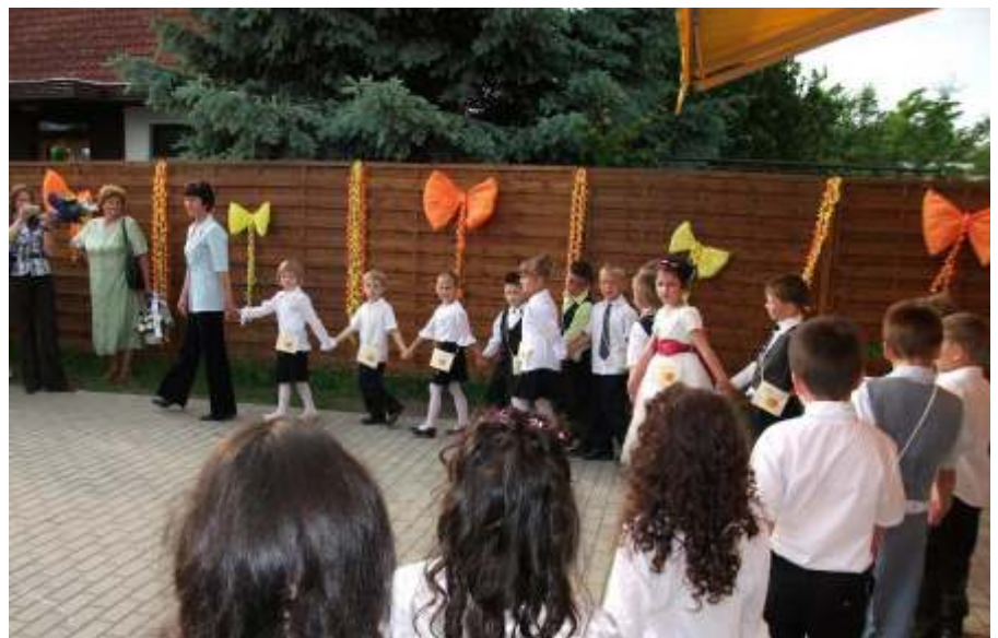
Ballagó nagycsoportosok

Szülőknek és gyerekeknek egyaránt lehetősége volt arra, hogy különféle kézműves tevékenységekben próbálják ki kez ügyességüket: ragaszthattak, rajzolhattak, fűzhettek, ki-ki kedve szerint, a játéokra az udvaron is lehetőség volt.