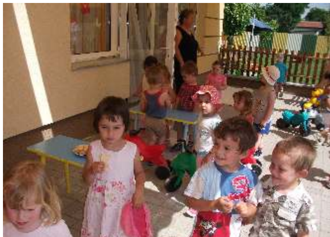
Látogatás a bölcsődében