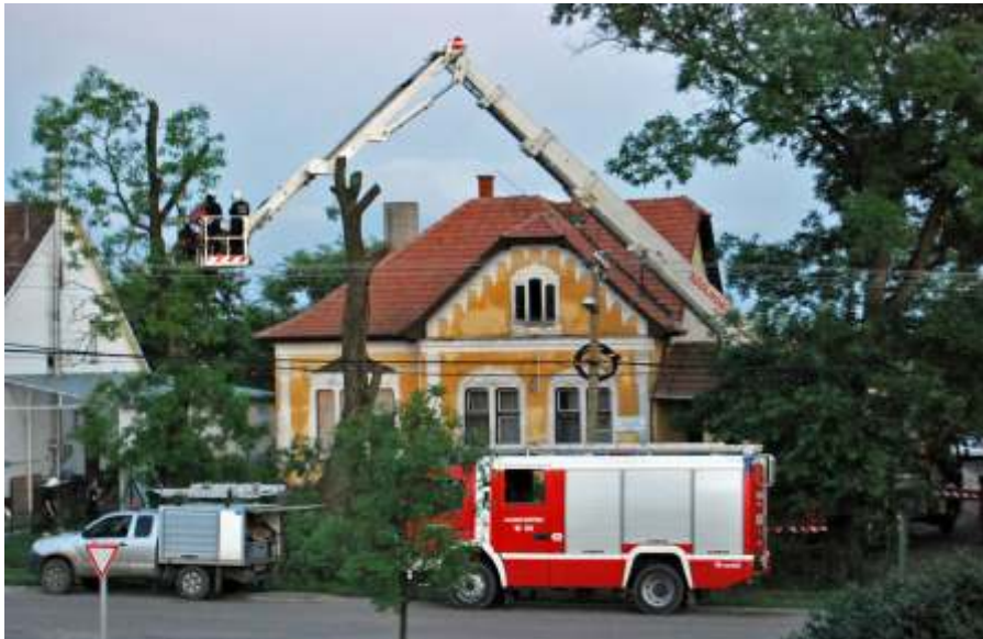
A városban több helyen is a tűzoltók segítségét kellett kérni