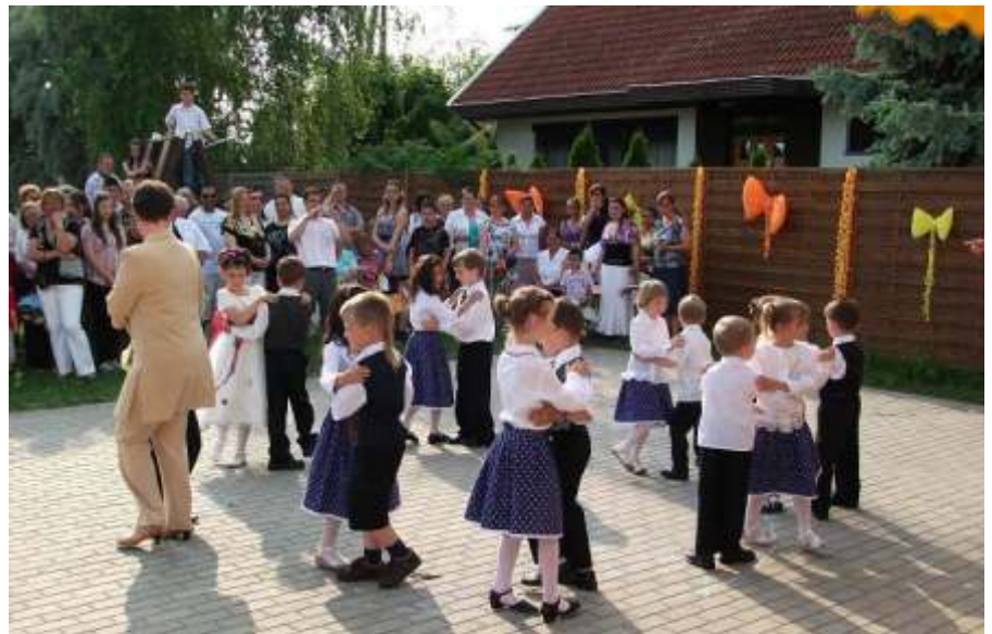
Jászsági tánc

Ezek után a teraszon családiasan, jó hangulatban uzsonnáztak meg a gyerekek hozzátartozóikkal közösen.