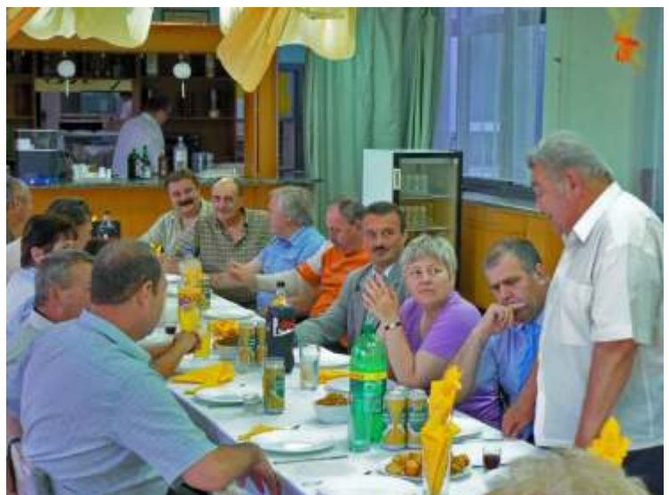
Azok a régi emlékek...