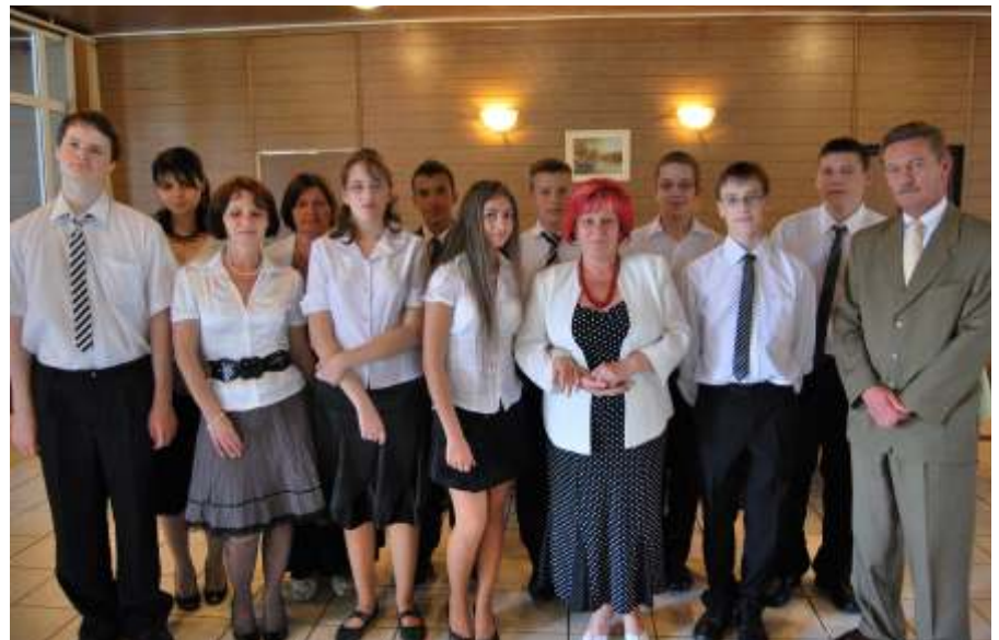
A legkiválóbb végzősöket és osztályfőnökeiket a polgármester díszében köszöntötte

pességei lehetővé tennének egy jobb teljesítményt, az a következő tanévben bizonyíthat – bizonyítson!