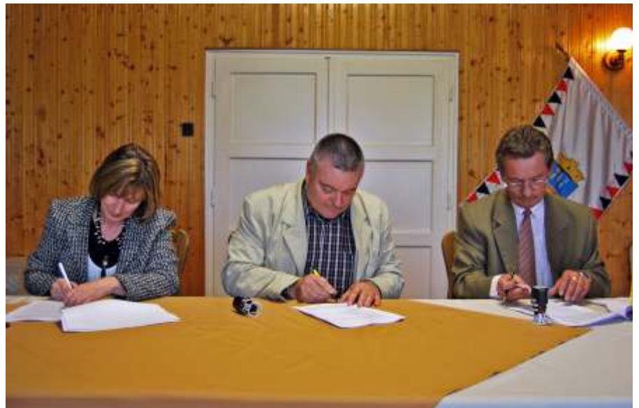
A középiskola felújítás kivitelezési szerződésének aláírása

gedjék meg, hogy néhány szóban a fejlesztéseinkről szóljak.