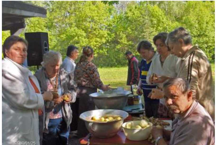
A paprikás krumpli előkészületei

A hó végén, április 30-án került sor intézményi majálisunkra. Szerencsére az időjárás kegyes volt hozzánk, így kiélvezve a napsugarak simogatását, a szabadban, friss levegőn tölthettük a napot. Először közösen májusfát állítottunk, aztán a foglalkoztatottak több állomáson várták a résztvevőket. Lehetett tekézni, sakkozni, a lakók kipróbálhatták magukat kapura rúgásban, kézműves dolgok készítésében, dartsban, pingpongbán, volt közös rajzolás, és első alkalommal karaokézni is lehetett – ami hatalmas sikert aratott, s nagyban hozzájárult a jó hangulathoz. A feladatok teljesítéséért lakóink zsetonokat kaptak, amelyeket beválhattak a majális ideiglenes büféjében mindenféle finomságra. Közben zajlott a közös paprikás krumpli főzés is, szorgos ujjak fűgén csipkedték a csipetkét. A hatalmas