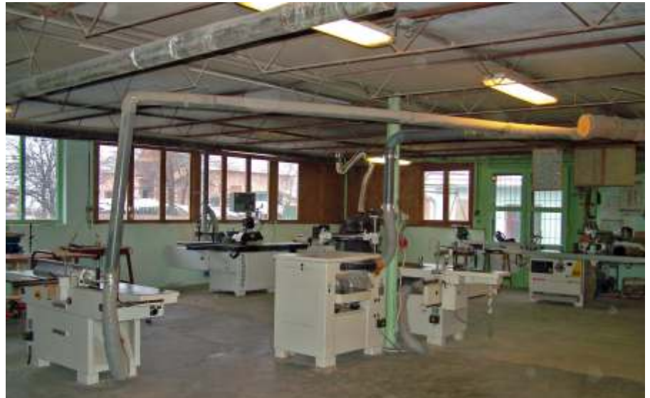
A műhelycsarnok

A géppark a gyártási folyamat teljes vertikumát kiszolgálja. Minden rendelkezésre áll a daraboló fűrészgéptől a gyalugépen keresztül a csiszológépen át a számítógép vezérelt ablakgyártó NC gépig, ami rendkívüli pontosságán túl sorozatgyártásra is alkalmas. Jelenlegi gyártás-