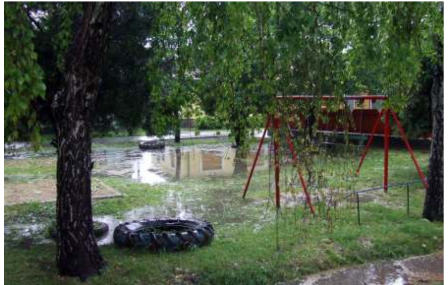
Az árkok nem bírtak a sok csapadékkal

Az elmúlt időszak rengeteg munkája mellett azért jó dolgok is történtek. En-