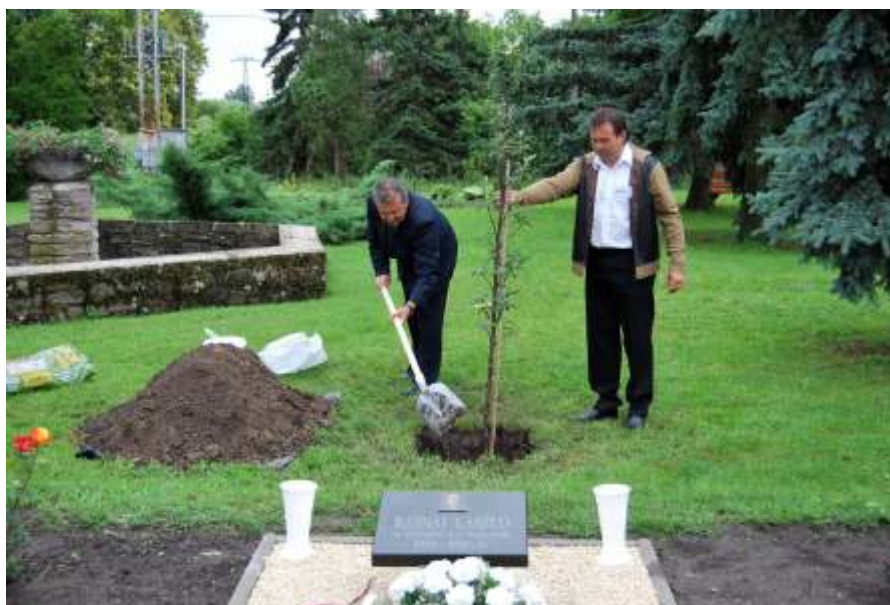
Faültetés Bajnai László emlékére