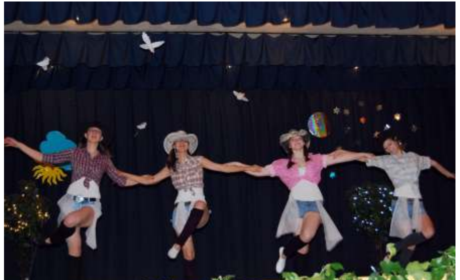
Az UGSZI Dance lendületes country tánca

Zene nélkül nincs tánc sem, vagy ha van is, nem az igazi. Ezért szívünkhöz