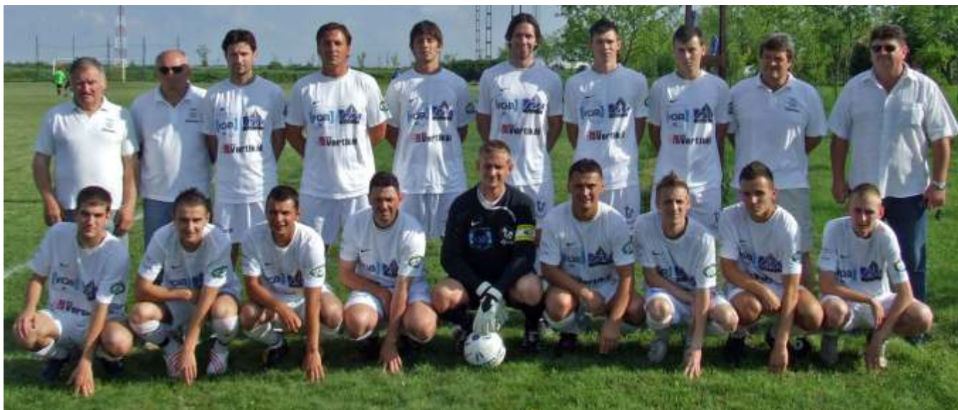
Az Újszászi VVSE 7. helyezett felnőtt csapata