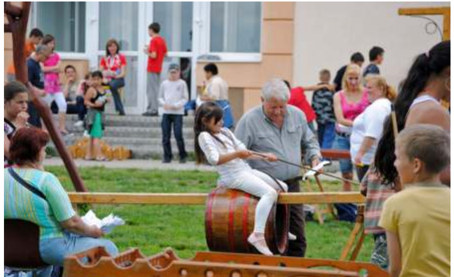
Hordólovaglás