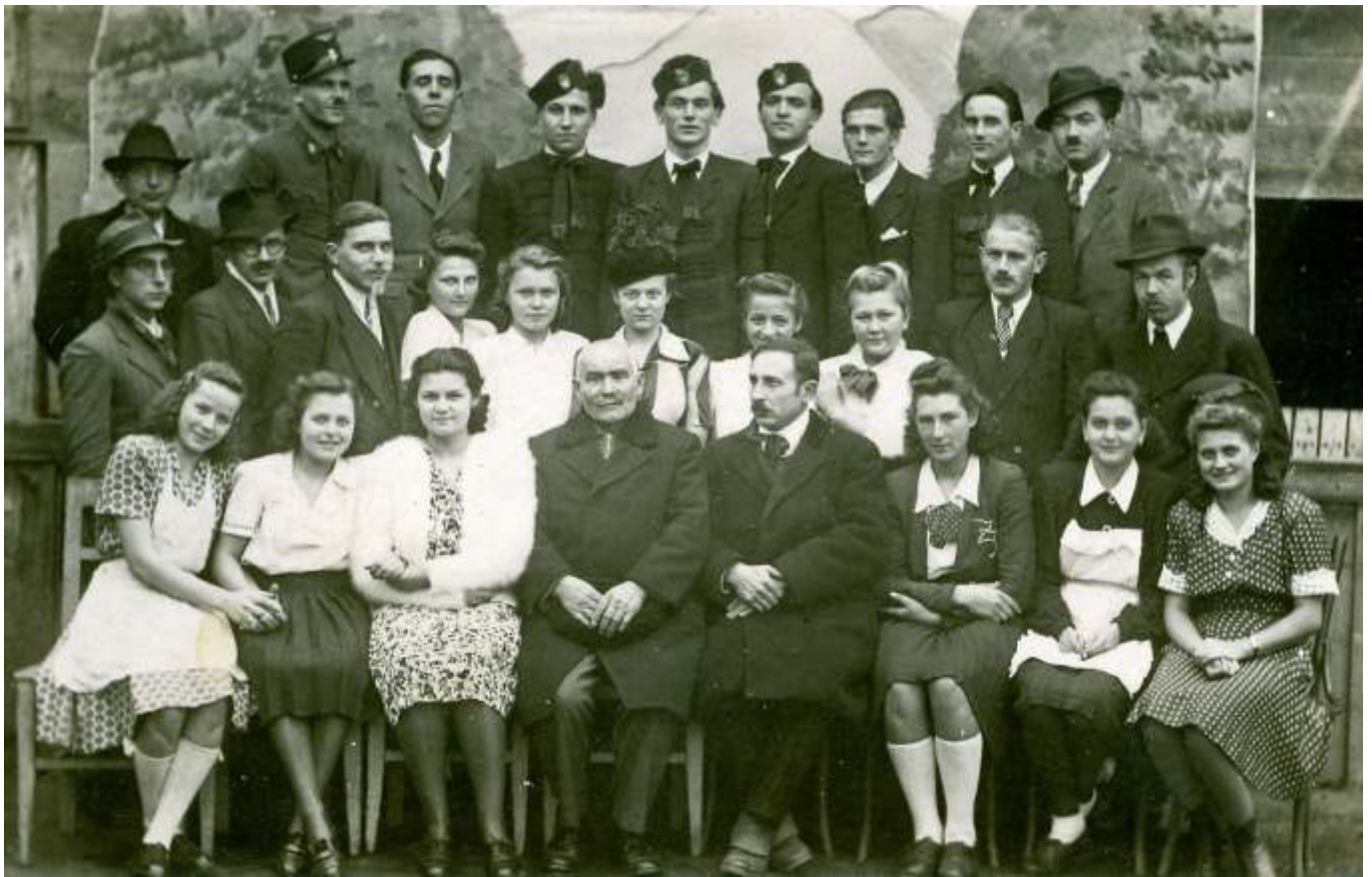
Diákszerelem, 1946.

majd Jászladányon és Zagyvarékason is. Az előadás bevételét a Szent István templom felújítására fordították. A daljáték páratlan népszerűségét jelzi, hogy szinte követhetetlenül nagy számban játszották a magyarországi színházak és amatőr színjátszó csoportok. Slágereit több nemezedéken át dalolták fiatalok és öregek. A népszerűség napjainkra olyan mértékben megkopott, hogy két évtizede nem került hazai színpadra a János vitéz.