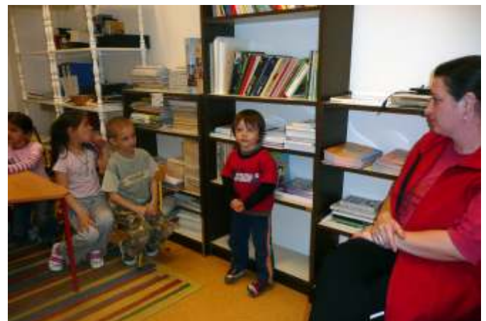
Verselő óvodások (Fotó: Juhász Betti)

Dél előtt 11 órától kicsik, de inkább a nagyok, kedvük szerint vettek részt az óvodások és óvónők versmondási versenyének „döntőjén”. A sok-sok kedves, hangulatos vers élményt, tartalmas szórakozást jelentett, hiszen színházba képzelve magukat, minden fellépőnek vastaps volt a jutalma, és sok-sok oklevél is gazdára talált. A költészet napját, a versek szeretetét családi versmondással teljesítettük ki. Az a gyermek és szülő, akik együtt tudtak verset mondani, kedves kis emléklapot vehettek át.