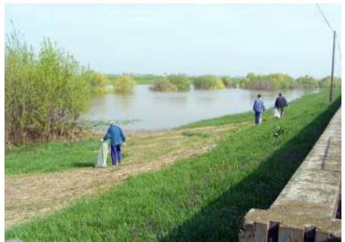
Szemétszedés a Zagyva-parton