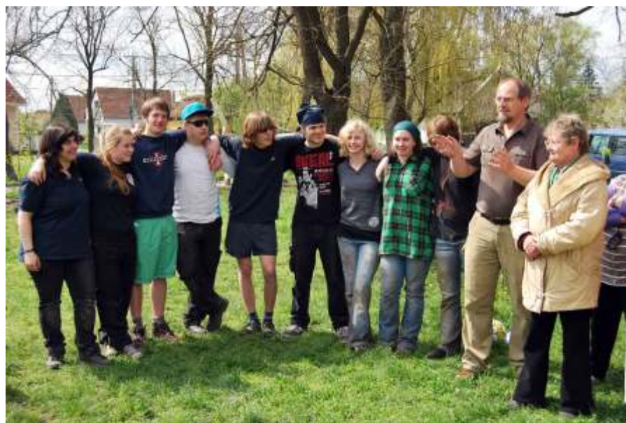
Német fiatalok építettek játszótérrel Újszászon