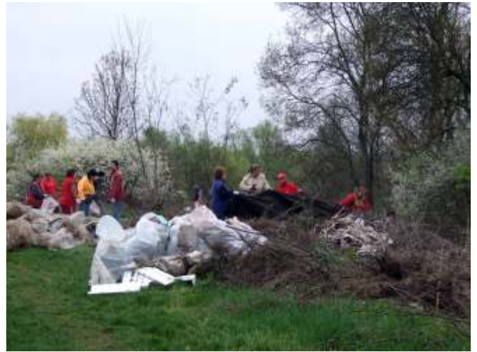
Közös munka a kastély környezetének szépítéséért