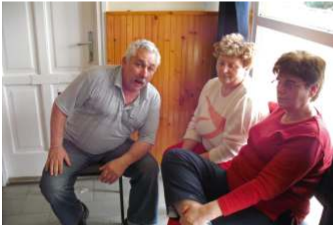
Pihenés a sportnap végén

Bármelyik fiatal, aki részt vesz a rendezvényeinken, figyelmesen és türelmesen végighallgatja a megnyitó beszédünket. Minden esetben kiemeljük és tudatosítjuk, hogy milyen ártalmas a szervezetre, ha függővé válnak bizonyos szerektől (drog, alkohol, nikotin).