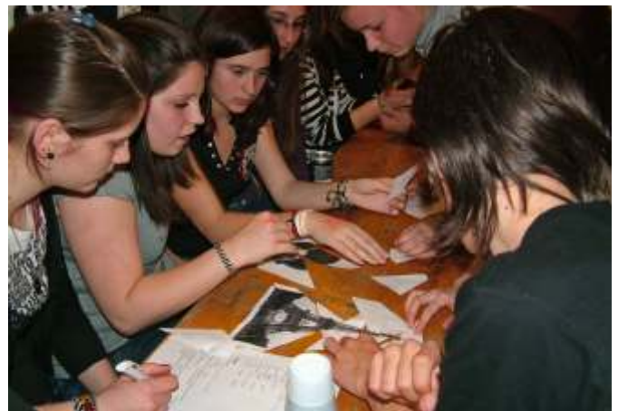
Feladatmegoldás közben a gimnazista csapat

A versenyre a diákok önkéntesen jelentkeznek, amit csapatkapitányaik irányítanak. Ennek szervezése csak annyira tudatos, hogy beállítunk valami körülbelüli limitet, hogy túl sokan, de túl kevesen se legyünk. A csapatok mintegy természetes kiválasztódással jönnek létre szakonként szerveződve, ami annyit jelent, hogy a bátrabb, vállalkozó szelleműbb gyerekek csapódhatnak egymáshoz. Öt csapat szokott kialakulni, csapatonként kb. 30 fővel. Ez a diákok kb. negyedét mozgatja meg. Egy vetélkedő akkor sikeres, ha a szervezők megfelelően ráhangolódnak a közönségre, és a visszajelzések alapján úgy látjuk, ez az idén is sikerült.