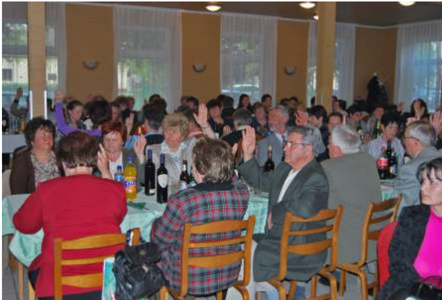
A takarékszövetkezet küldöttgyűlésén

dött pályázatról egyeztetünk, amelynek a műszaki tartalma a vasútállomás környékén kerékpártároló, gépjárműparkoló és autóbuszváró kiépítése. Az egyeztetés eredményeképpen – ahol figyelembe vették a város módosító indítványait –, elindulhatott az építési engedély megszerzésére irányuló munka. A kivitelezés várhatóan 2011. évben valósul meg. Ennek során 40 gépjármű számára parkoló, 50 db-os kerékpártároló és 2 db buszváró épül meg a hozzá csatlakozó gyalogos utakkal együtt.