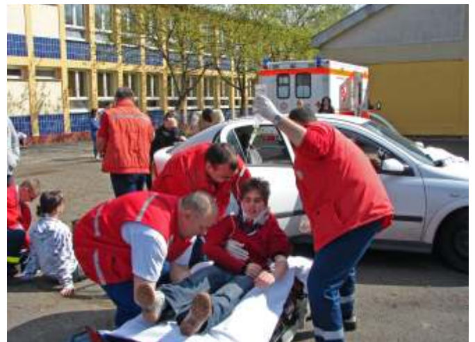
A sérült ellátása

Számomra döbbenetes volt az életszerű megközelítés, éreztem a hatását és az erejét. Különösen tetszett az, hogy a statiszták milyen lelkesen és hűen játszották a szerepeiket. A probléma ilyen testi közelségbe hozása szerintem szeniális ötlet, és visszatartó erő lehet, mert szinte közvetlen tapasztalat. Köszönjük, és gratulálunk a csapat tagjainak.