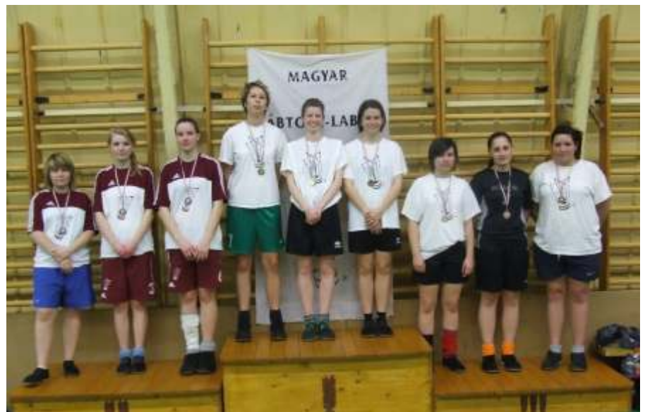
Az újszásziak elfoglalták a dobogót