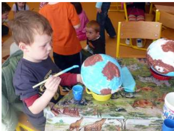
Készül a földgömb

A csoportok meg is jelenítették bolygónkat. Bolygókat festettek és más égitesteket kasíroztak, mozaikképet alkottak. Az elkészült munkákat a folyosón helyeztük el. A szülők bevonásával sikerült szebbé varázsolni az óvoda udvarát is. A gyermekek virágpalántákat hoztak, melyeket a csoportok által gondozott fák, illetve a „Mesefa” körül ültettünk el. Örömmel ástak, gereblyéztek és öntöztek „kis kertészeink” az óvónők, s az udvarunkat rendben tartó Mércse János segítségével. A szemetet is összegyűjtöttük, ezzel is a környezet óvására hívtuk fel a gyerekek figyelmét. A programokban részt vevők, gyerekek, alkalmazottak, a 4H Egyesület képviselői nagyon aktívan tevékenykedtek, a szülők pedig büszkén nézegették a gyermekek által elültetett palántákat. Közreműködésüket és projektünk támogatását ezúton is köszönjük.