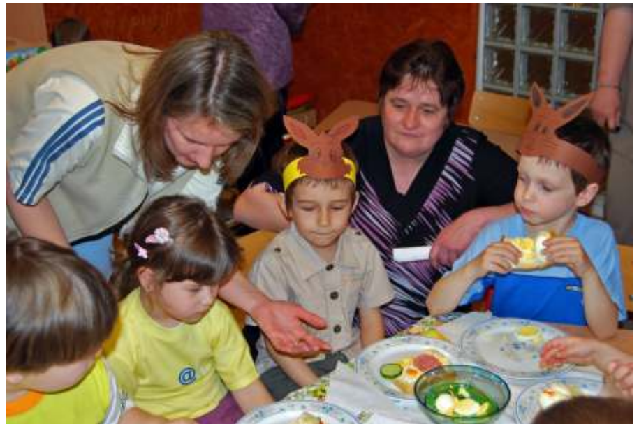
Nyuszis szendvicsek készítése az óvoda szakmai napján