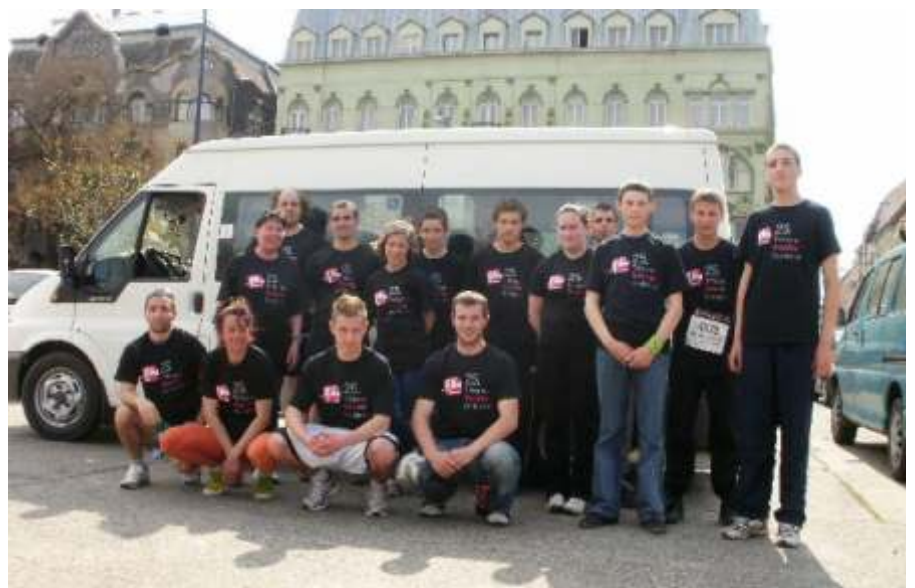
A 25. Viviccitá újszászi résztvevői

Igazi ünnep volt április 18-án a 25. T-Home Viviccitá Városvédő Futás. Remek tavasi időben 12400-an vettek részt a Futás Jubileumi Évében rendezett eseményen, hogy különböző távokon futva köszöntsék a tavaszt és a fővárost. Csálá-