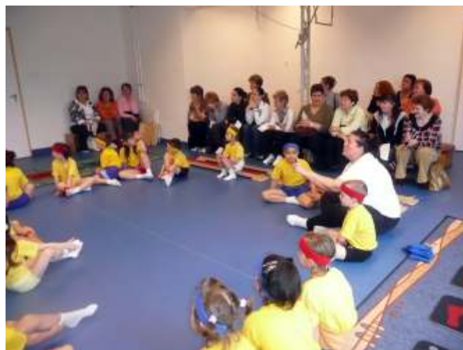
Népszerű a Mozgáskotta bemutató