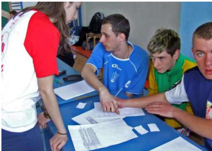
Munkában a versenybírósg