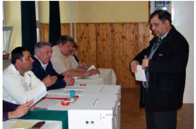
A MCEUSZ vezetője leadja szavazatát