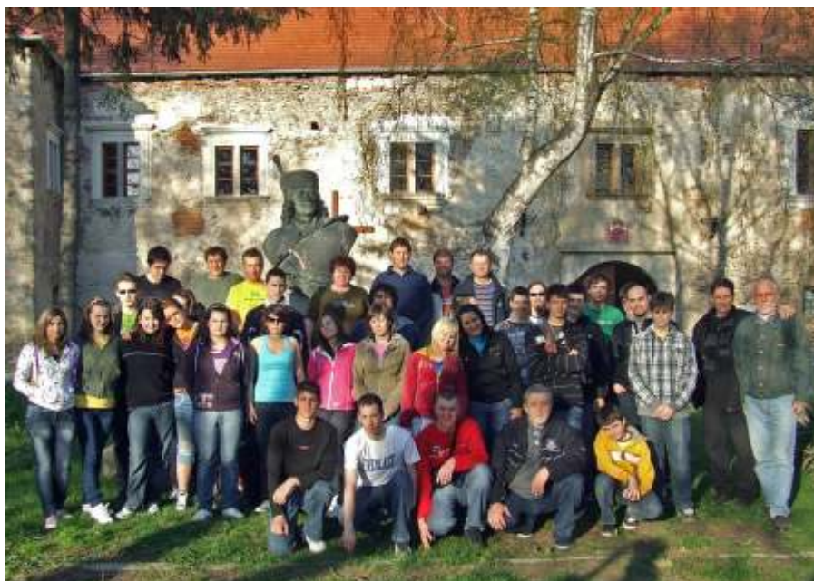
A borsi Rákóczi szobornál