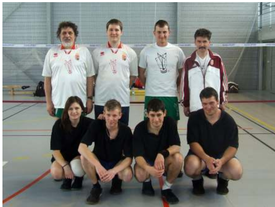
Magyarok a French Openen

Négy egyesület – Borjád SE, Cserszegtomaj SK, Nagykanizsa ZSE, Újszászi VVSE – 69 versenyzője vett részt április 10-én Újszászon a 2010. évi válogató és ranglista versenysorozat harmadik fordulóján, a Tavaszköszöntő Kupán. A résztvevők férfi és női hármasban, vala-