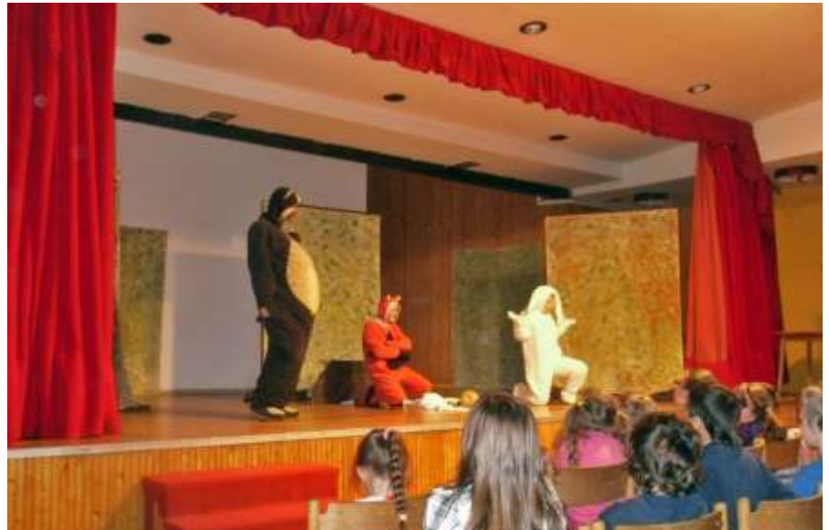
Jelenet az előadásból