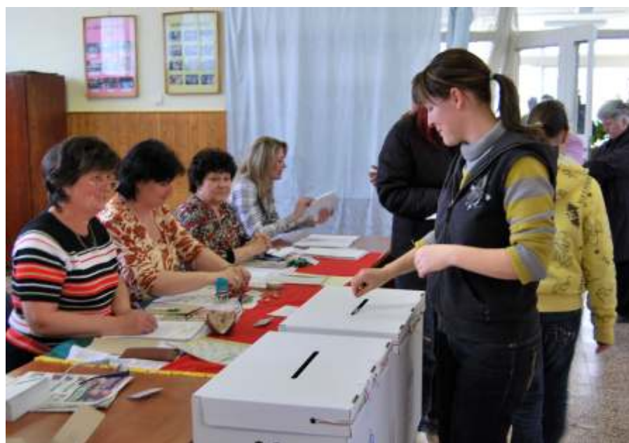
Városunkban az első fordulóban a választópolgárok 60 %-a járult az urnákhoz