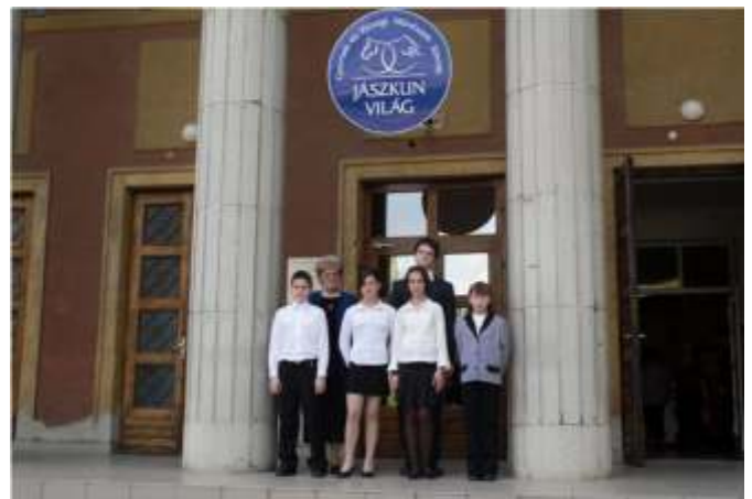
A döntő újszászi résztvevői