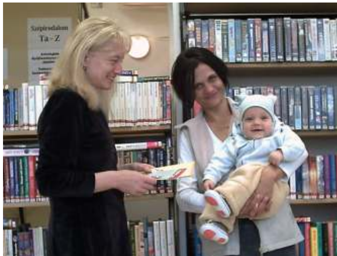
Egyik legifjabb olvasónk