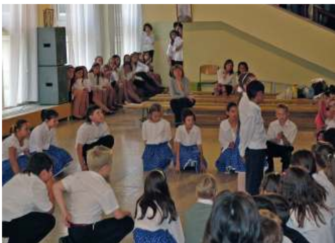
Néptáncosok az általános iskolából

cátlanul összekeverednek, és nagyon jól érzik magukat.