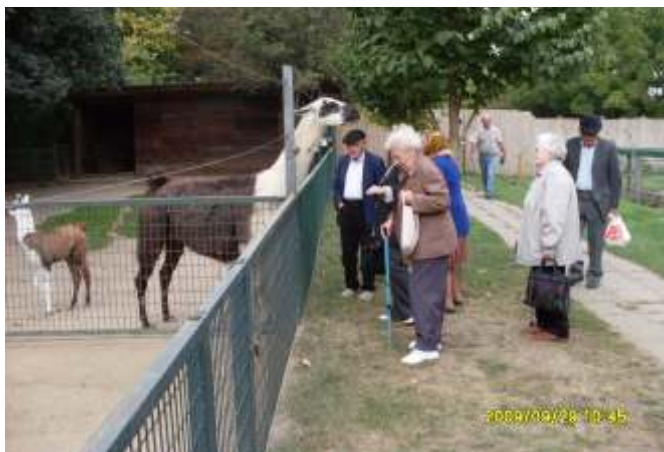
A jászberényi állatkertben