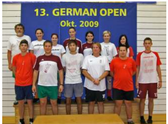
A Németországban sikeres újszászi csapat