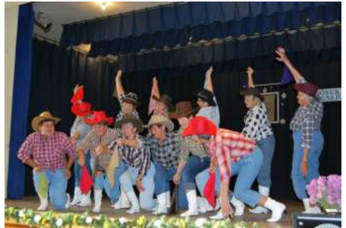
Nosza Mami táncsoport