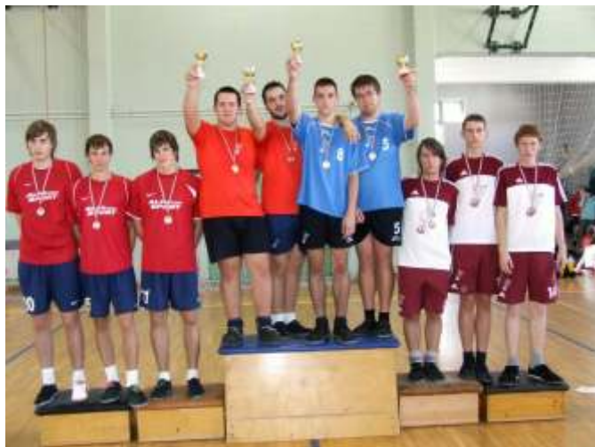
Újszász az ifi bajnok

Október 17-én öt egyesület – Borjád SE, Cserszegtomaj SK, Nagykanizsa ZSE, Szepetnek SE, Újszászi VVSE – 71 versenyzője lépett pályára Nagykanizsán a Zsigmond Sportcsarnokban az A&E Kupa 13. Ifjúsági Országos Bajnokságon, amelyen az Újszászi VVSE versenyzői szerepeltek a legeredményesebben.