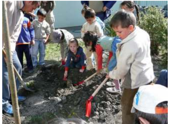
Mesefa ültetés

Természetesen napokkal az esemény előtt sokat beszélgettek az óvónők és a gyerekek a mesefáról, arról, hogy kinek mi a kedvenc meséje, s hogy milyen lesz majd az udvaron a mesefa köré varázsolt mesevilág. A mesefa ültetését a Mese, mese kezdetű mondóka elmondása, majd egy Benedek Elek mese meghallgatása előzte meg. Ezután a felnőttek, s a gyerekek együtt ültették el a mesefát, melynek árnyékában rönkökön ülve, a kis kerítést mesefigurákkal díszítve kialakítjuk a mesesarkot.