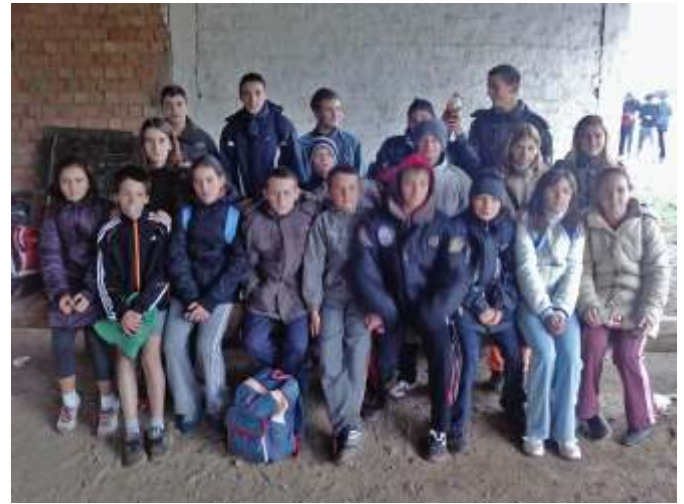
Mezei futók