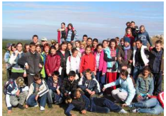
Túra közben

Programtervünk „Felfedezések Baranyában” címmel készült, s mivel a bíráló bizottság magas színvonalon elkészített pályaműnek értékelte, örömmel értesültünk róla, hogy a 73