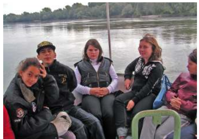
Hajózás a Dráván

Este: Kézműves foglalkozás, filmvetítés a Drávai Nemzeti Parkról