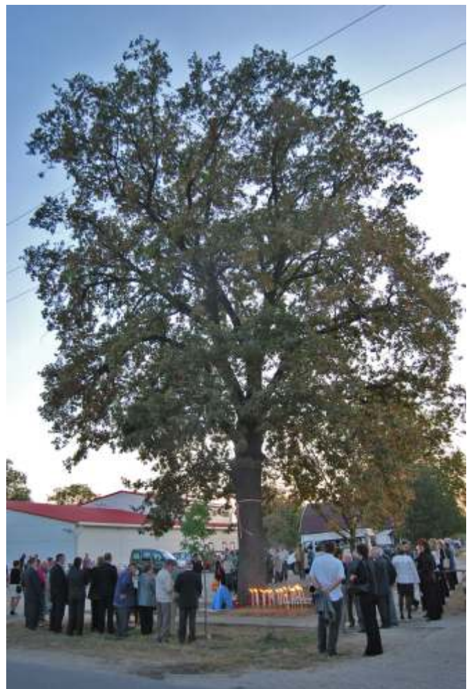
Az emlékfá