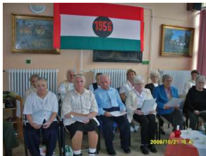
Az ellátottak műsora az 56-os forradalom tiszteletére