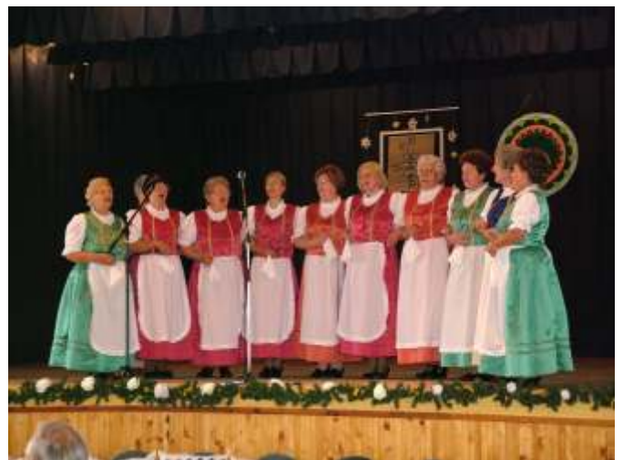
35 éves a Százsorszép Népdalkör