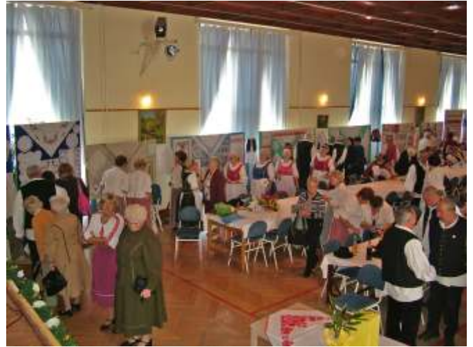
A nagyszerű kiállítás

A kettős évfordulót kiállítással és dalostalálkozóval ünnepelték, melyre meghívták a megyebeli társ szakkörök képviselőit, illetve közelről - távolról népdalköröket, citeracsoportokat.