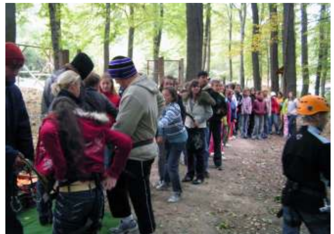
A Mecsextrémén