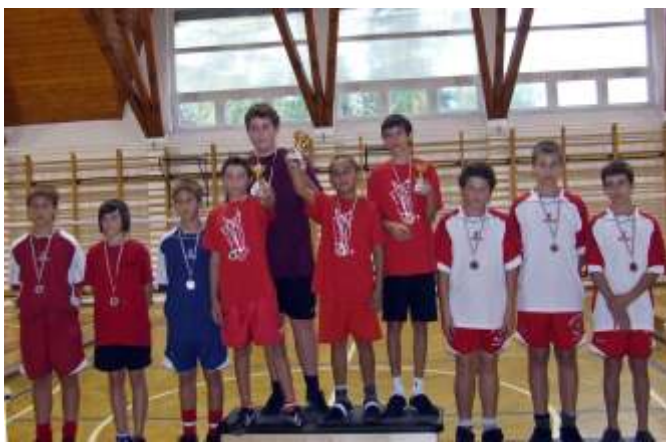
A fiúknál is Újszász nyerte a bajnokságot