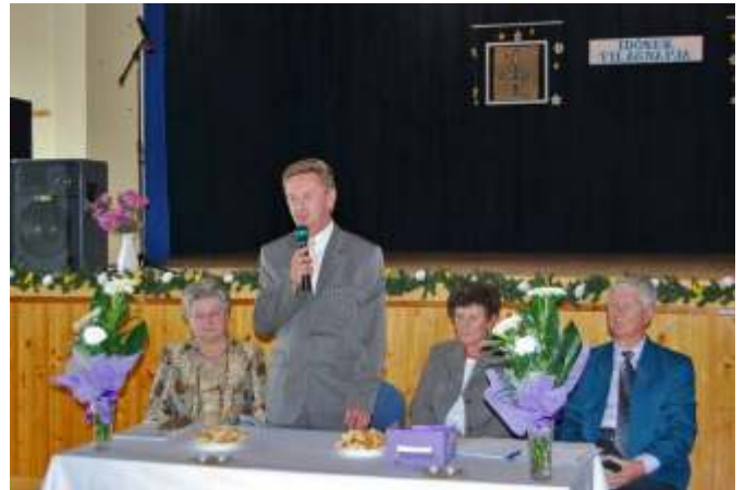
Az Idősek Világnapján

Az Időskorúak Szociális Otthona két pályázatát is kezeljük. Az egyik a II. sz. épület (III.-IV. osztály) akadálymentesítésére, a másik a kastély épület homlokzatának felújítására és nyílászárói