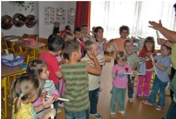
Óvodások a zenélő csövekkel

Ezen a napon sokféle zenei eseményt rendeznek szerte a világon. Városunkban már hagyomány, hogy a Zene Világnapját a gimnázium aulájában, kicsik és nagyok együtt ünneplik egy közös koncerten. Tizenöt óvodással és három óvónénivel vettünk részt a rendezvényen. Első műsorszámként népi mondókákat és énekes játékokat mutattunk be. A gyerekek lelkesen énekeltek és mondókáztak, a közönség pedig nagy tapsal jutalmazta műsorunkat. A második műsorszámmal a gimnazisták kedveskedtek az óvodásoknak. Különböző méretű papírcsövekkel adtak elő két jól ismert gyermekdalt, majd a „hangszerekből” nekünk is adtak ajándékba, hogy kipróbálhassuk a nem mindennapi hangadókat.