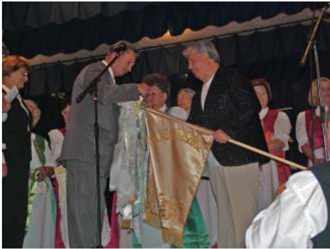
Szalagkötés a 35 éves Szászország Népdalkör zászlójára