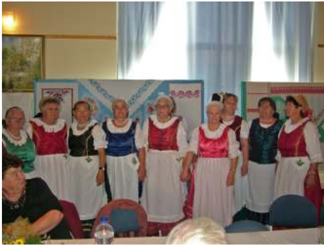
25 éves a Díszítőművészeti Szakkör

lődési ház vezetője, a Népi Díszítőművészeti Szakkör és a középiskolások citeracsoportja is.