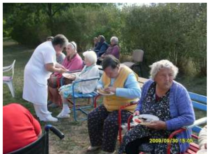
Ízlett a sült szalonna

Kedden a jászberényi állatkertbe látogattunk 14 fővel. A kellemes séta alatt kíváncsian szemléltük az érdekes állatokat. Lehetőség nyílt a szelíd kecskék megsimogatására, a láma megérintésére. A medve és az oroszlán kifutója előtt sokáig időztünk, mert nem tudtunk betelni a hatalmas állatok látványával.