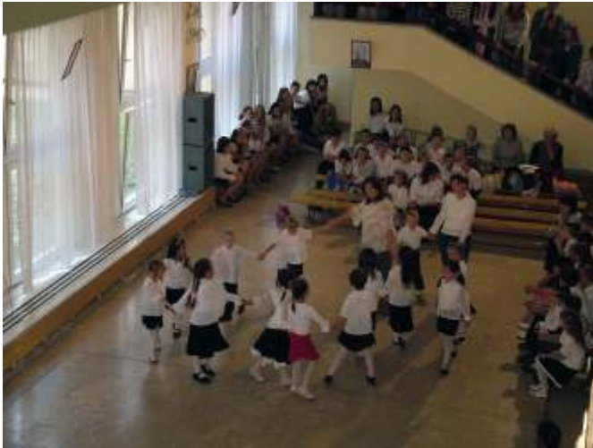
Óvodások műsora