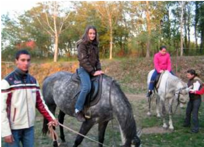
Mindenki kipróbálta a lovaglást (Fotó: Makainé Zérczi Zsuzsanna)

nyertes intézmény között szerepelünk mi is. A tervezett programok megvalósítására 2.769.200 Ft-ot biztosított számunkra a pályázató, amely összeget 50 fős csoportra fordíthattunk. 46 felső tagozatos tanuló és 4 kísérő nevelő volt a megvalósítója a tervezetnek. A kiírásnak megfelelően a gyermekek 70%-a hátrányos-ill. halmozottan hátrányos helyzetű tanulóink köréből került ki, a 30% pedig a 7. 8. osztályos diákönkormányzatban dolgozó gyermekek voltak.