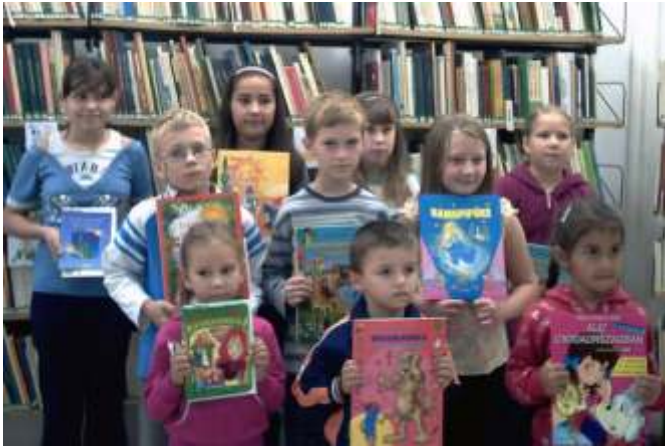
Legsikeresebb mesemondóink egy része