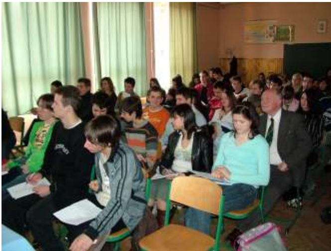
Az előadás hallgatói

foglalt állást: „Hajótöröttek voltunk, felvett egy mentőcsónak. Ezt a mentőcsónakot elhivatottak vagyunk megvédeni.”