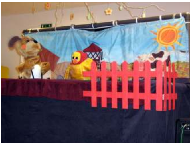
Húsvéti bábjáték