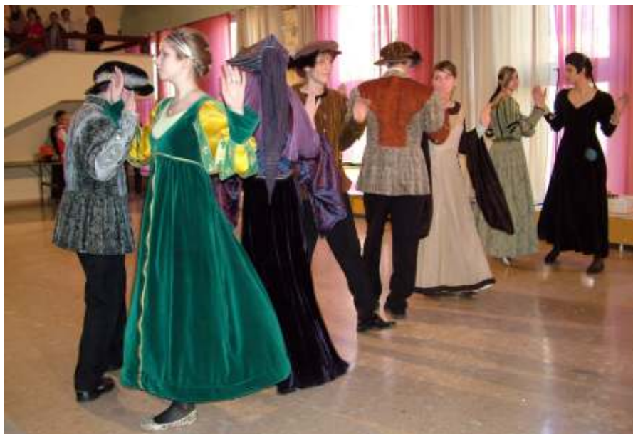
Reneszánsz tánc a megnyitón (Fotó: Kovács Nándor)

»OBSERVER« OBSERVEREK BUDAPEST MÉDIATIGYHŐ KFT.