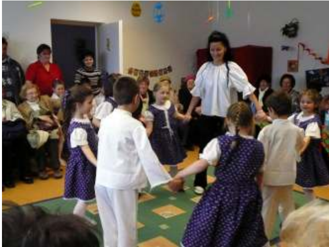
Néptánc bemutató

Március 26-án a fővárosi Napsugár klub tagjai látogattak el a Hétszínvirág Óvodába. A közel ötvenfős delegációt szeretettel vezettük körbe óvodánkban. Láthatták a kreatívan játszó, alkotó, „mozgáskottázó” apróságainkat, esztétikus termeinket, foglalkoztatóinkat, óvodánk minden „zegzugát”.