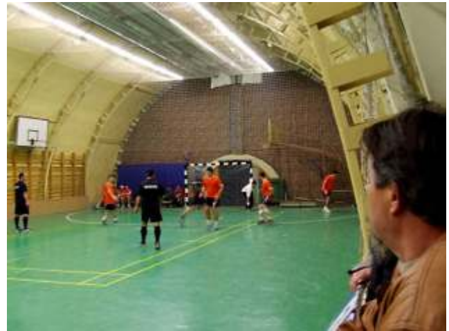
Orange-Kelyesűk kupadöntő