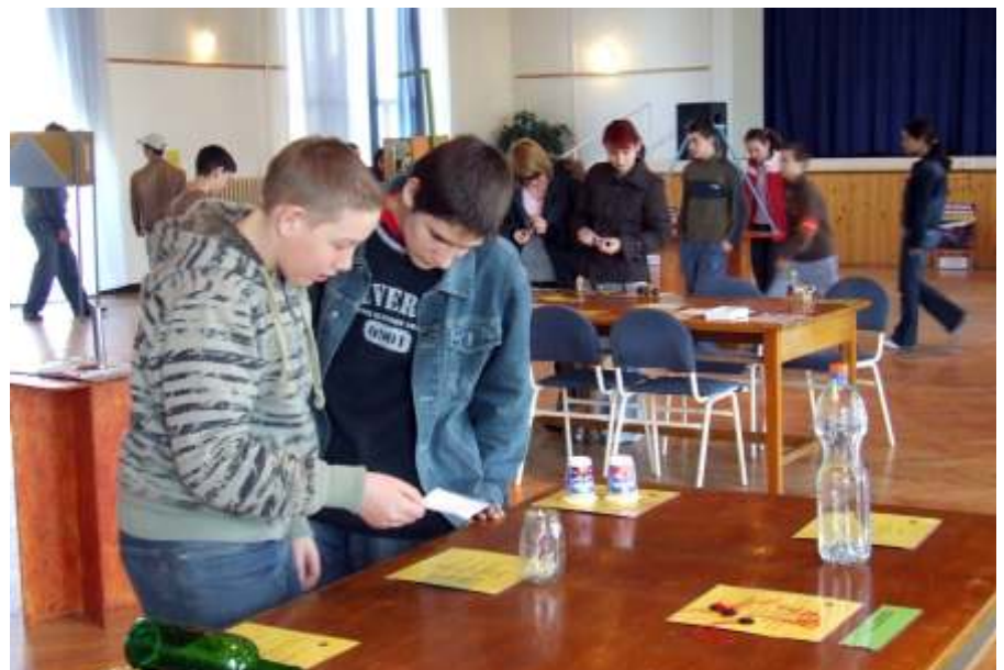
"Csodák Palotája" fizikai kiállítás a művelődési házban