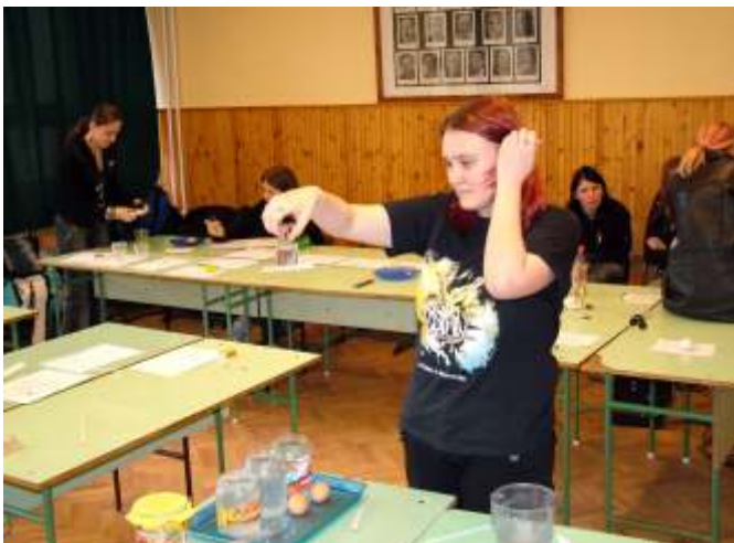
A felfordított pohárból nem folyik ki a víz