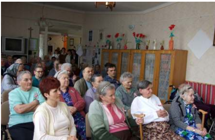
A Szociális Otthoni ünnepség résztvevői