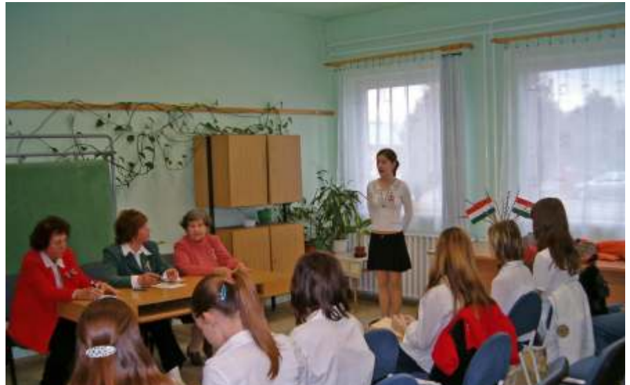
A szavalóversenyen