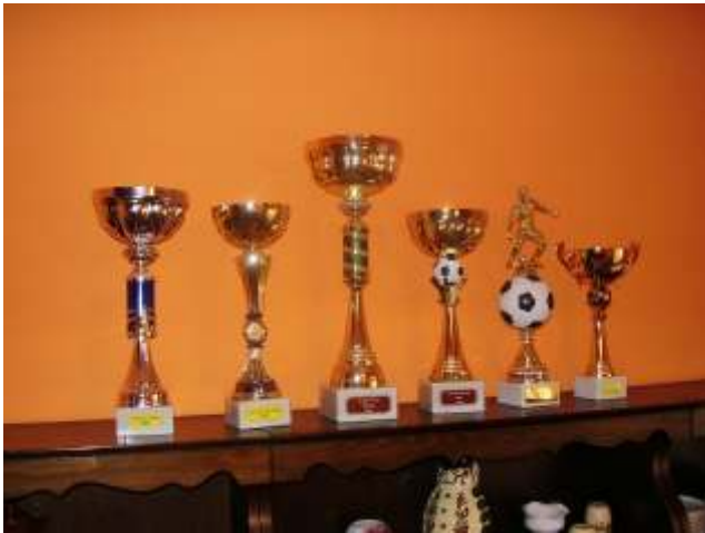
Gyarapodott a Keselyűk serleggyűjteménye