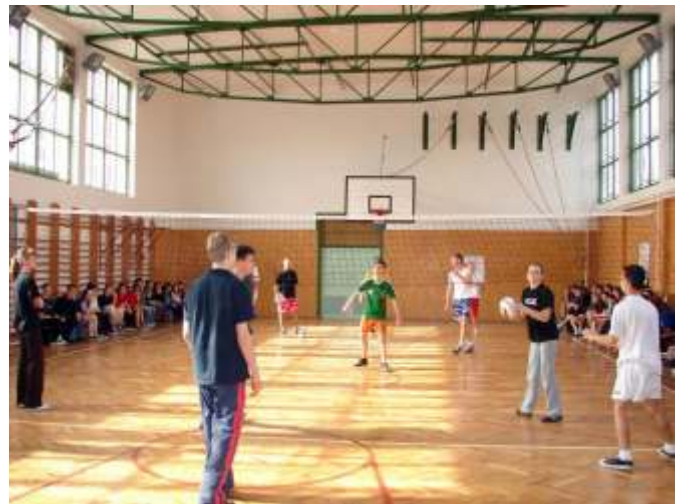
Röplabda a tornateremben

A sportrendezvényekre a jó hangulat és a küzdőszellem volt a jellemző. Reméljük, hogy jövőre még többen vesznek majd részt ezen a rendezvényen.