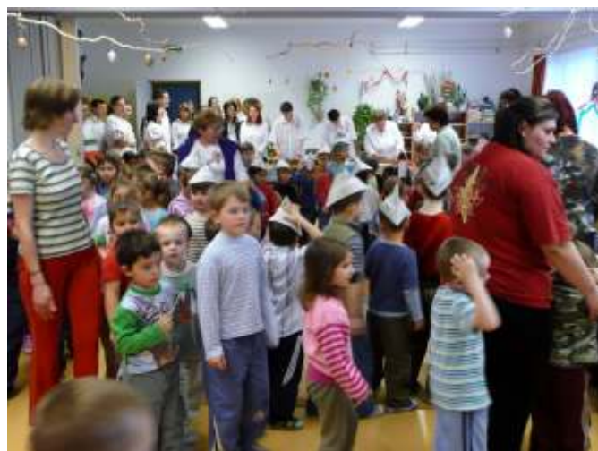
Menetelés csáköban