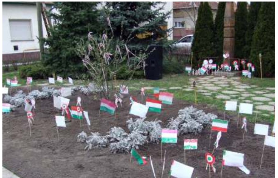
Az óvodások zászlókkal köszöntötték március 15-ét