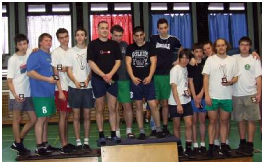
Újszásziak a dobogó második és harmadik fokán