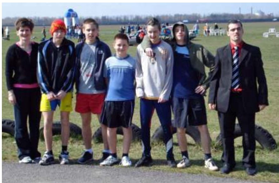
A bronzérmes újszászi csapat