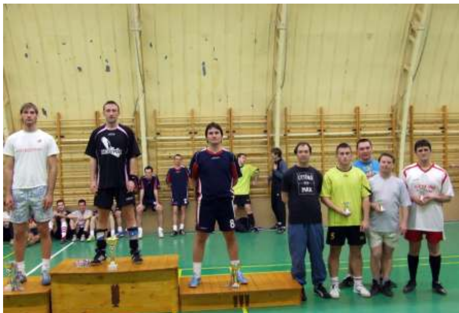
A VTB eredményhirdetése