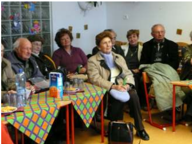
A budapesti látogatók