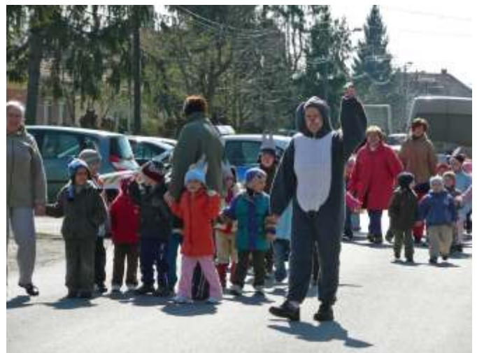
Nyuszi járt az óvodában

úton, amit Kocza Gergő nyert meg. A program az udvaron kincskereséssel, körjátékkal, ügyességi, majd locsolóvers mondó versennyel folytatódott. Ezután a Nyuszi minden csoportot megajándékozott egy-egy kosár nyuszi-tojással.