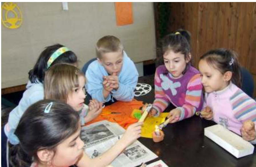
Tojásfestés a húsvéti játszóházban

berben folytatódik a klub, sőt bibliotörténeti kiállítást is tervezünk. Mindkettőt jó szívvel ajánlom felekezettől, vallásosságtól függetlenül mindenkinek.