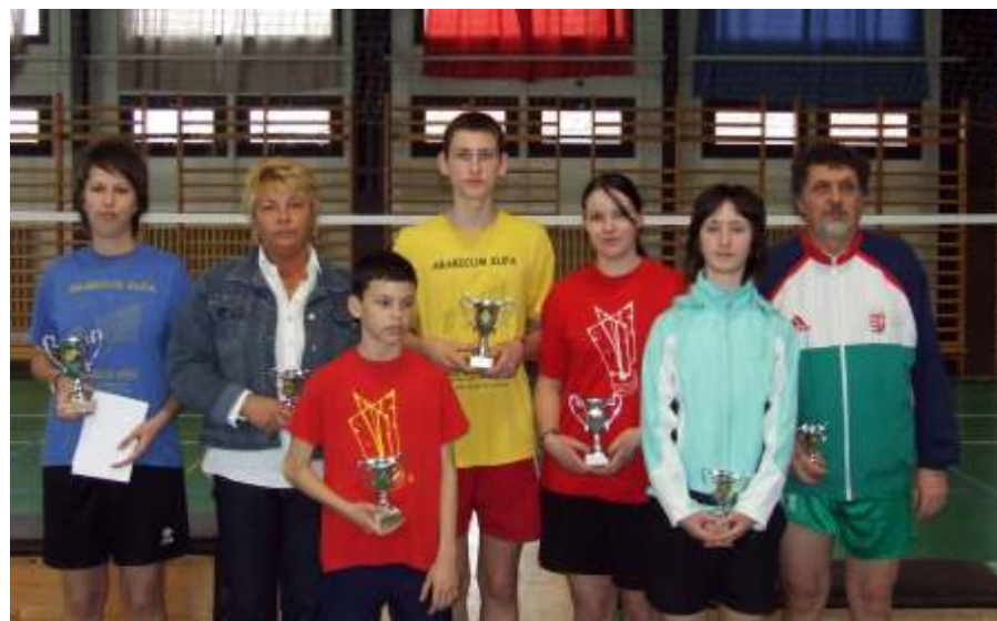
2007-ben korosztályuk legjobbjai voltak