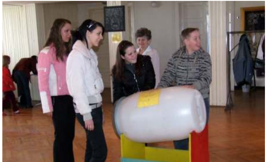
A legnépszerűbb eszköz a hanggúy volt