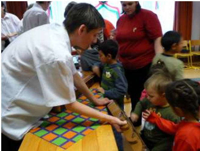
Ismerkedés a hangszerekkel

ahogyan a kicsik felé fordultak. Úgy gondoljuk, a március 15-i ünnepek sorában ez a műsor óvodásainknak örök emlék marad.