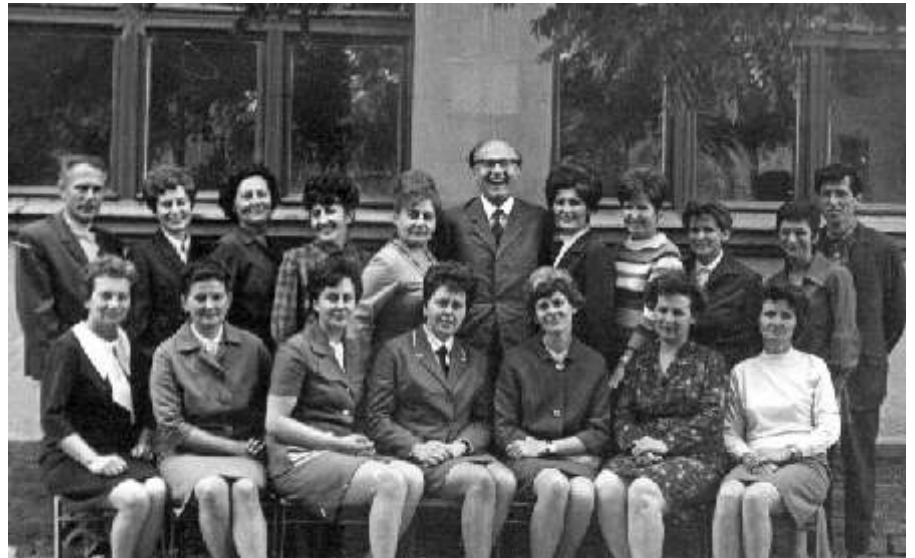
A tanári kar