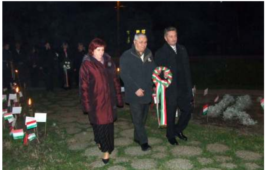
Koszorúzás a kopjafánál

hogy havonta változhatnak a gyógyszerek árai, akkor elképzelhető, hogy hónapról hónapra más és más lesz az etalonnak tekintett legolcsóbb készítmény, így gyakorlatilag a betegeket havonta más és más gyógyszerekkel kellene kezelni, hogy eleget tegyünk a TB elvárásainak.