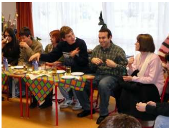
Német vendégek az óvodában

Óvodásainkat Rózsa György igazgató is meglepte egy-egy nagy szöveget csokival. A gyerekek vidáman újságolták el szüleiknek az eseményeket, s az egyik apróság így fogalmazott: Képzeld anya, robot nyelven beszéltek a nagylányok és a nagyfiúk.