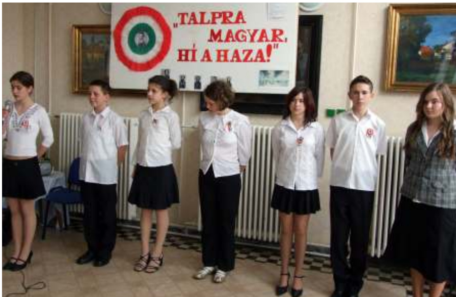
Március 15-i ünnepség a Szociális Otthonban