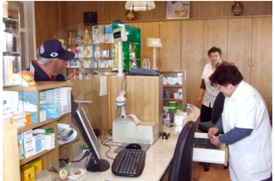
A gyógyszerárban

Látható tehát, hogy teljesen kiszámíthatatlan a készletezés a gyárak, a nagykereskedők és a gyógyszerárak részéről is. Ha ebben a három láncszemben bárhol is hiba lép be, az a patikákban fog lecsapód-