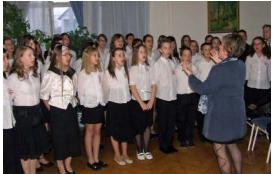
Az általános iskola énekkara

A fentiek következménye, hogy az orvosok a legolcsóbb „zöld sávos” gyógyszereket igyekeznek felírni, különben a TB szankcionálhatja őket. És itt jelenik meg az első probléma, hogy ezek a legolcsóbb gyógyszerek nincsenek forgalomban, esetleg csak valamikor törzskönyvezték őket, vagy olyan kisebb gyártók gyógyszerei, melyek a piacra jutás reményében álltak elő kedvező árral, de nincs meg a megfelelő technikai háttérük a megnőtt igények kielégítésére, így az ellátás is akadozik. Ha ehhez hozzávesszük,