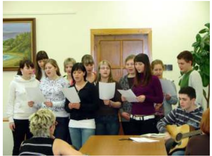
A német diákok kórusa