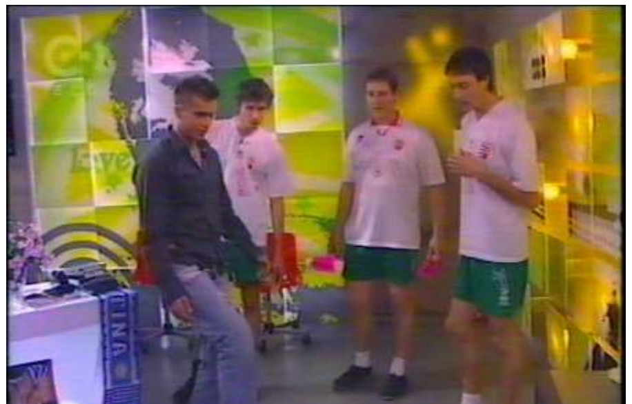
A Cool TV-ben