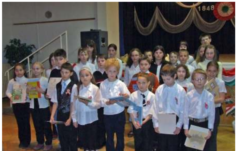
A szavalóverseny díjazottjai