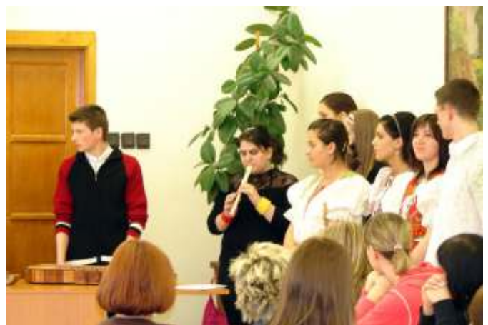
A középiskola népi együttese