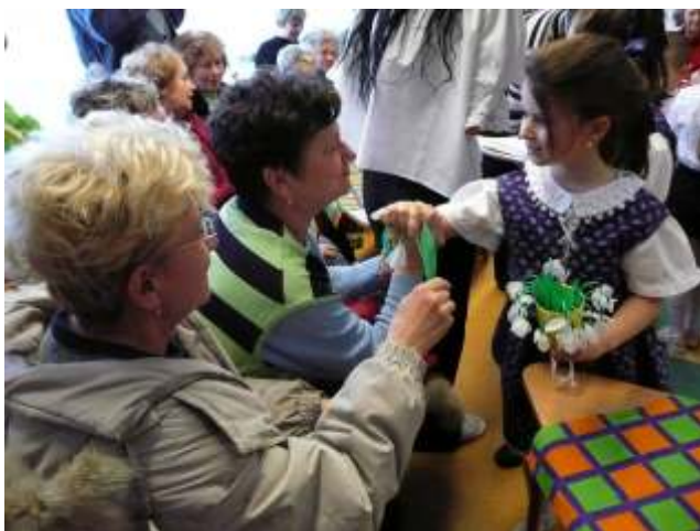
A gyerekek virággal köszöntötték a vendégeket

Végül a gyerekek versekkel, néptáncal kedveskedtek vendégeinknek, s átadták apró ajándékaikat. A delegáció tagjai őszinte elismeréssel szóltak óvodánkról, a gyermekekről és a műsorról, és csokival, ropival lepték meg az óvodásokat. Nagy örömmel és büszkeséggel töltött el bennünket, hogy sokan úgy nyilatkoztak, hogy ha Budapesten lenne ez az óvoda, máris hoznák unokáikat, mert az épület csodálatos, a gyerekek aranyosak, a pedagógusokból pedig sugárzik a gyermekszeretet. Köszönjük a látogatást, s az őszinte, baráti szavakat.