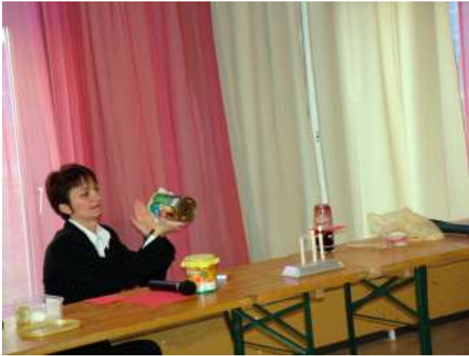
A légagyú