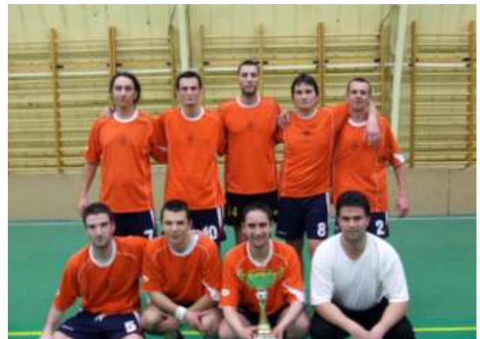
Az Orange kupagyőztes csapata