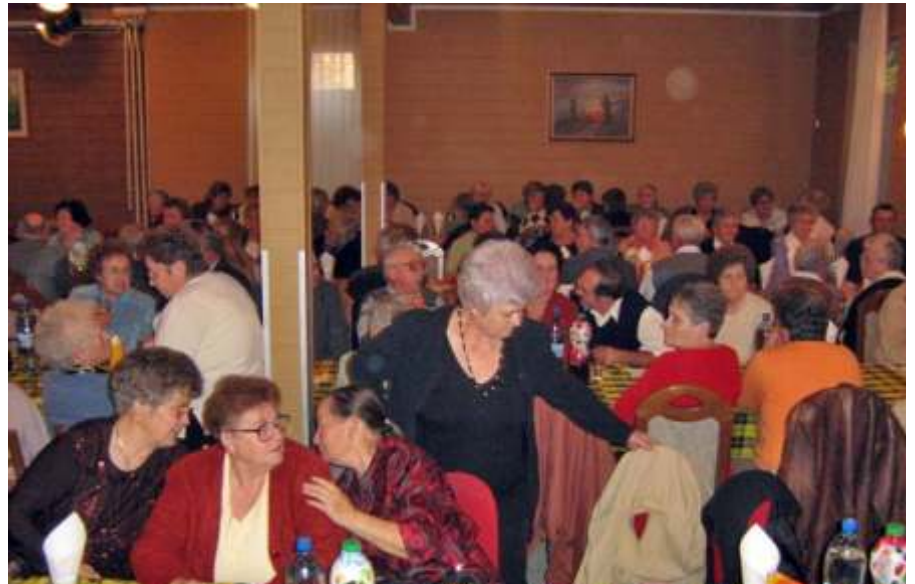
Megtelt az étterem