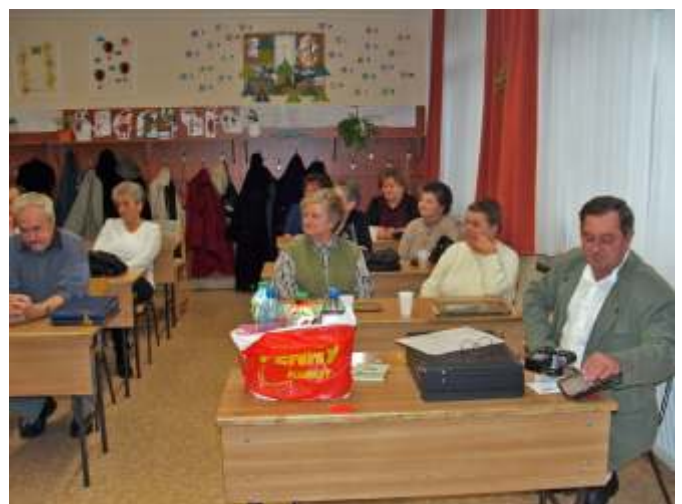
Újra az iskolapadban