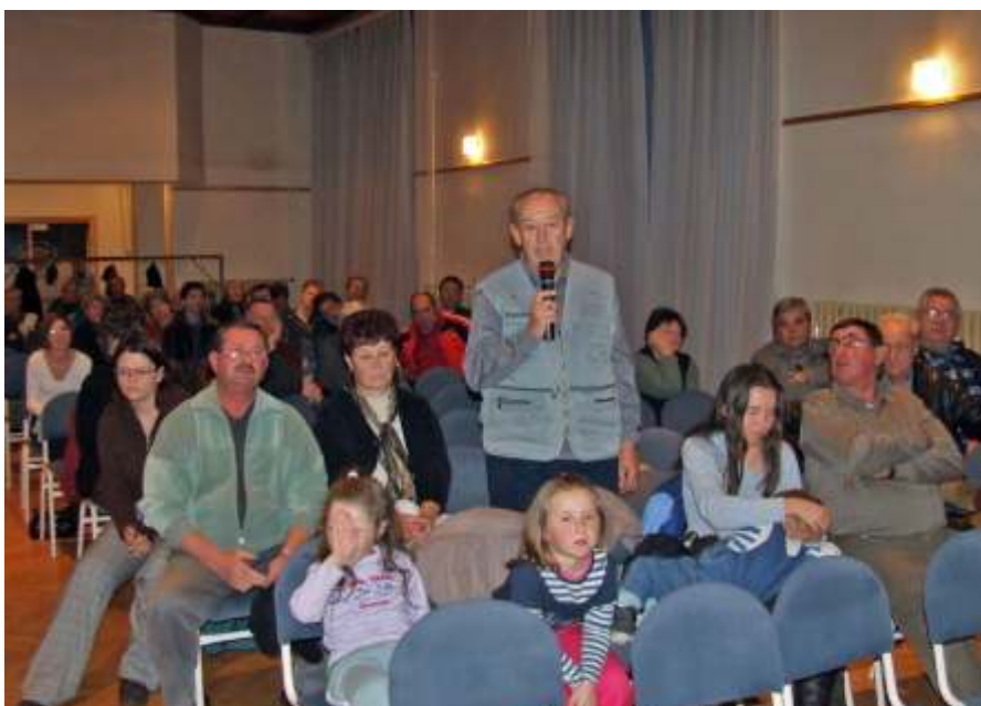
A lakossági fórum résztvevői