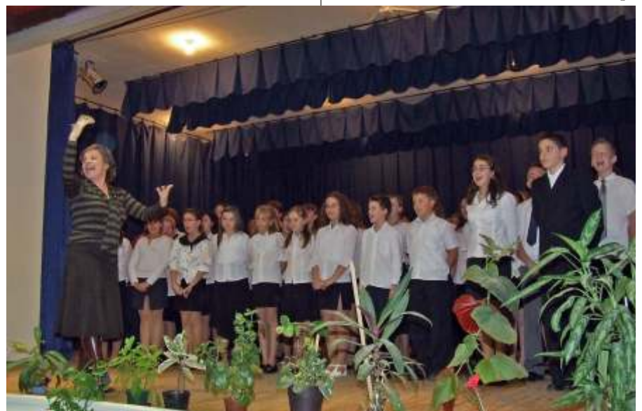
A közönség és a szereplők együtt énekeltek