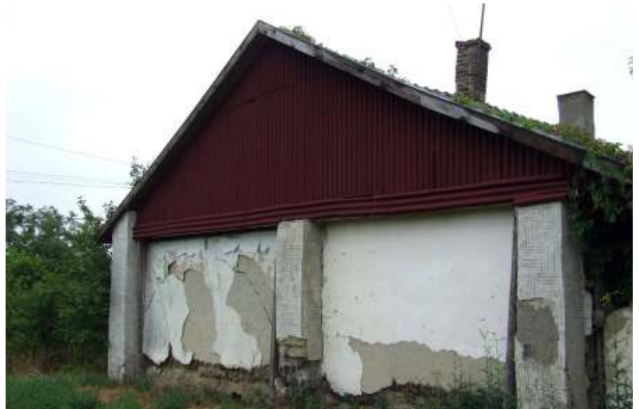
Vasút út 6. Hamarosan lebontják

November végén a mozgássérültek helyi csoportjának évváró rendezvényére voltam hivatalos. Bár nem tudtam az egész délutáni műsorban részt venni, mégis úgy gondolom, hogy nem vendégként voltam jelen ezen a nagyszerű ren-