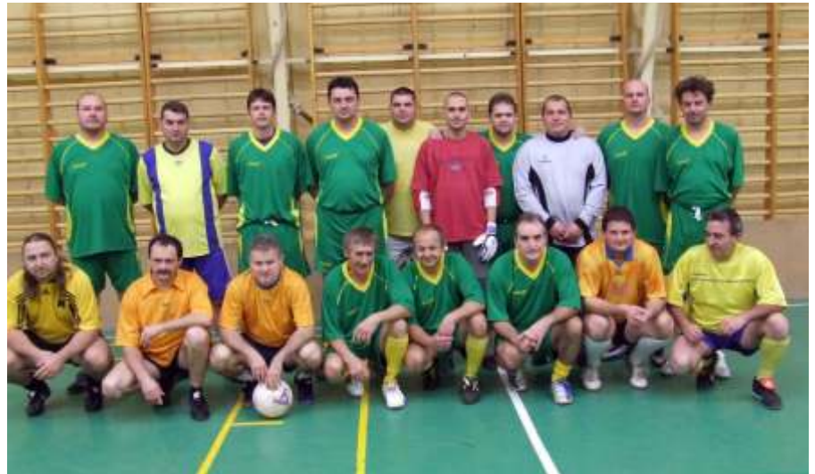
Bálint Bt. - Darazsak 10-6