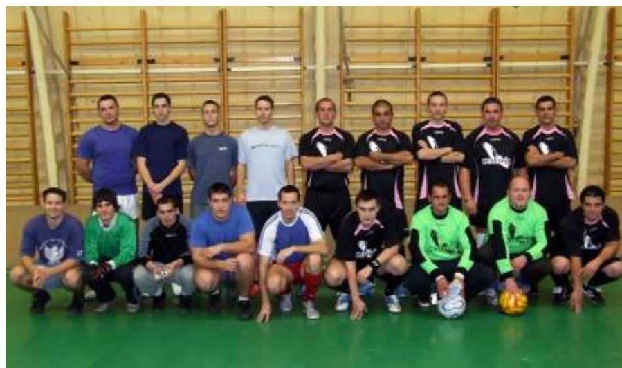
Újoncok - Keselyűk 2-9