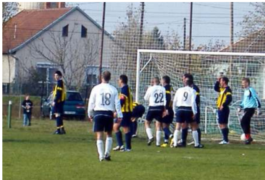
Az újszászi védelem feltörhetetlen volt