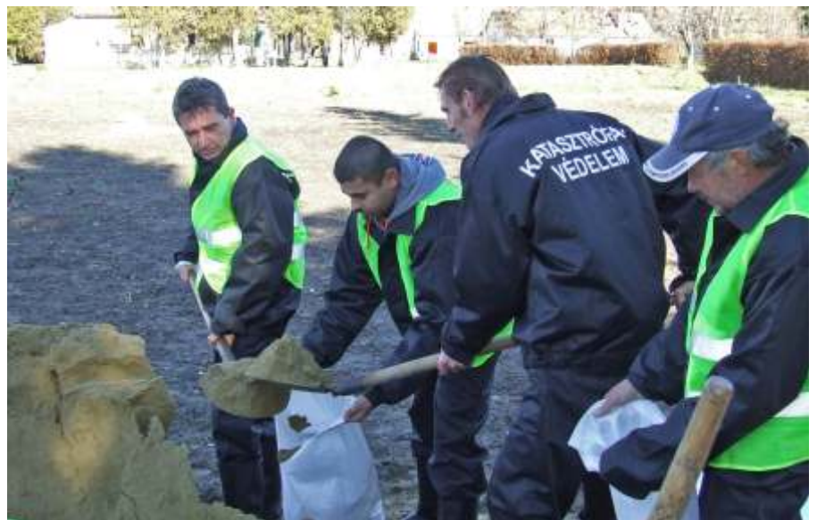
Készülnek a homokzsákok