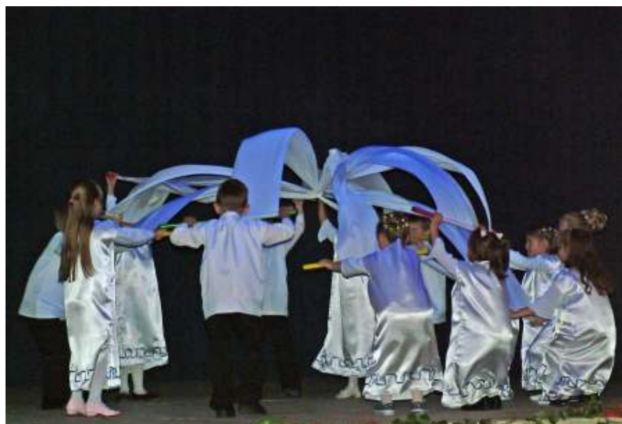
Formációs tánc UV fényben

A vendégek elégedetten, jókedvűen, a rendezvényről elismerően szólva távoztak, dicsérték a produkciókat, a szervezést, a lebonyolítást.