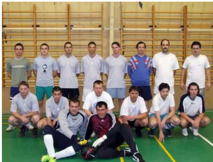
Nemmindegy - Úttörőpark 7-8

Az 5. percben Rézsó Tamás góljával megkezdődött a gólgyártás. Biztosan nyert a címvédő az újszászi teremmel ismerkedő lelkes jászaladányiak ellen.