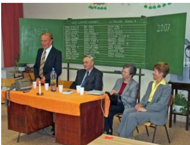
Az osztályfőnöki óra