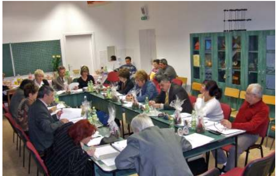
Kihelyezett testületi ülés az általános iskola kémia előadójában

Minden lehetséges eszközzel azon fáradozunk, hogy segítsük az idősek mindennapjainak könnyebbé tételét. A jelző-