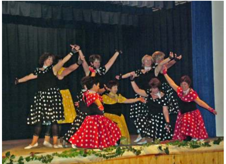
Az óvodapedagógusok fergeteges műsorszáma