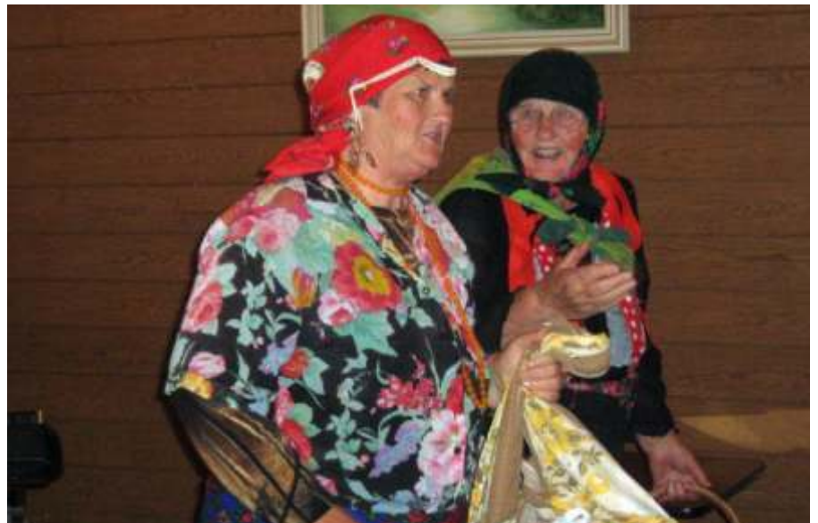
A műsor záróakkordjaként ismét kitett magáért „Juliska és Mariska”