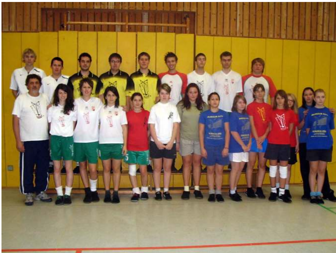
A German Open újszászi résztvevői

pet. A hazaiak közül a német válogatottnak megfelelő FFC Hagen csak a hetedik, a VfL Eintracht Hagen a nyolcadik helyen végzett.