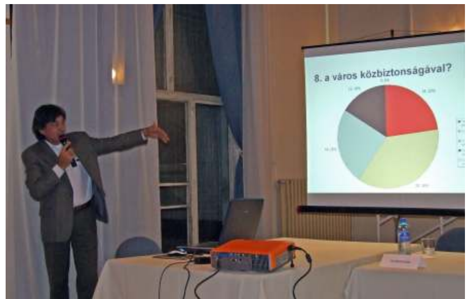
Beszámoló a kérdőíves felmérés eredményeiről