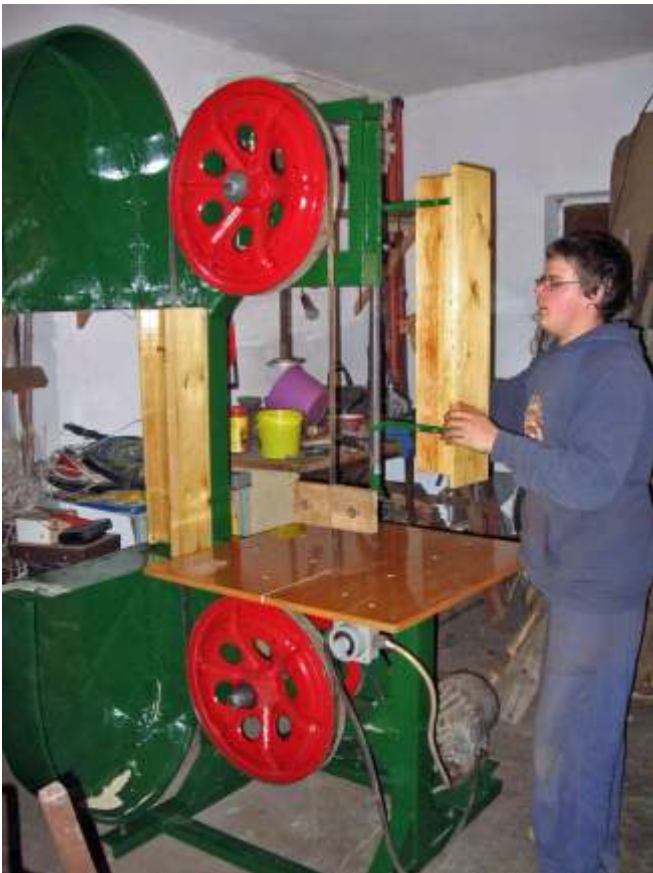
A saját készítésű szalagfűrész mellett