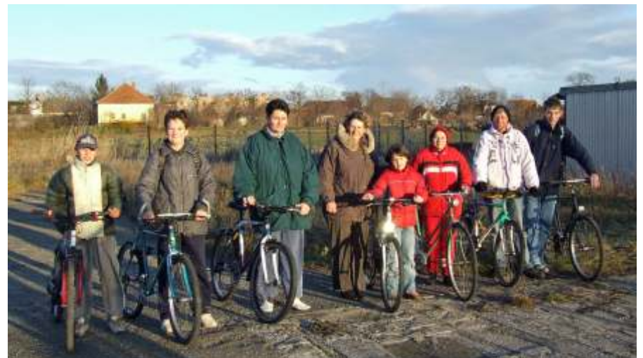
Újabb adomány érkezett Svájcból. A szállítmányban ezúttal kerékpárok is voltak, melyeket új tulajdonosaik nagy örömmel vettek birtokba.

dezvényen. Hozzájuk is mindig szívesen megyek, mert igazi meleg szeretetet tudnak sugározni, és remek humorral rendelkeznek. Köszönöm a vezetőségnek azt az áldozatos munkát, amelyet sorstársaikért hoznak önzetlenül, nagy felelősséggel és sok munkával.