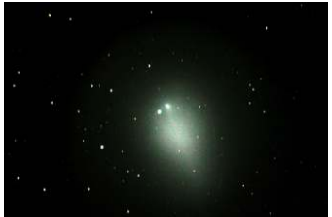
A Holmes-üstökös