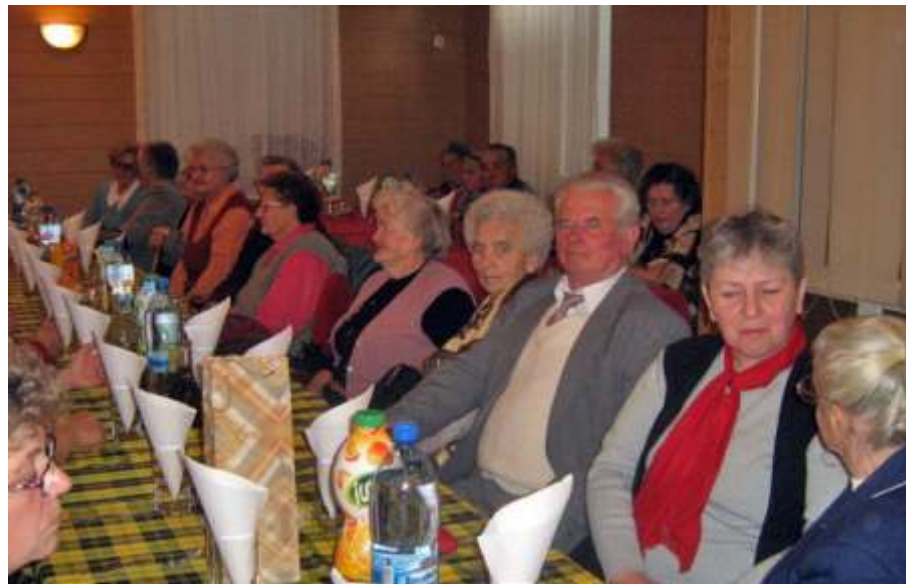
Újra együtt a sortársak