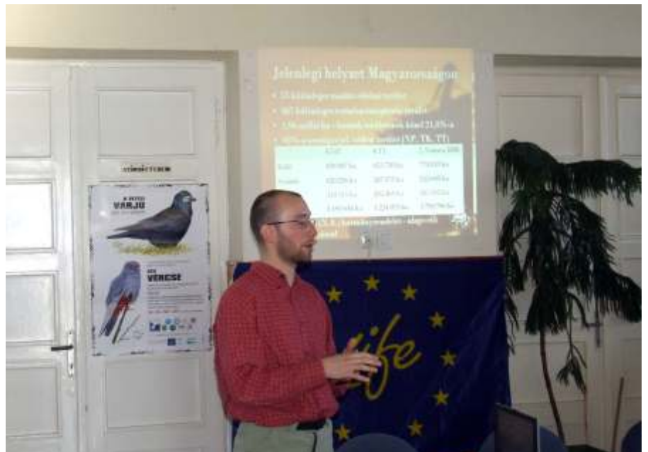
Tájékoztató a Natura 2000 és a madárvédelmi programról

2000 és a hozzá kapcsolódó agrártámogatások volt. E témakörrel az MME a következő lapszámában fog cikket közölni.