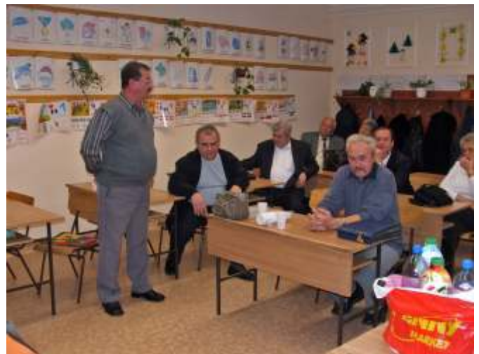
Az osztálytársak beszámolója