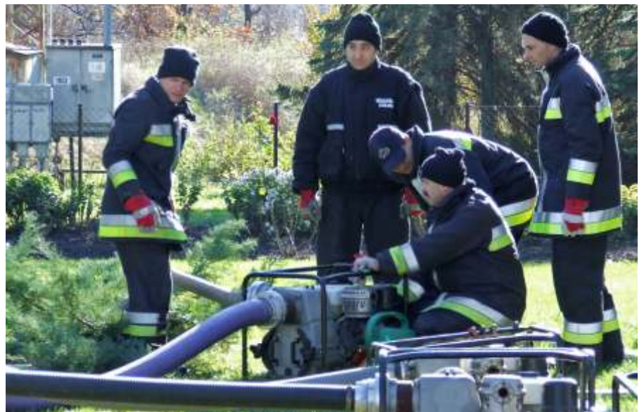
Munkában a szivattyúk