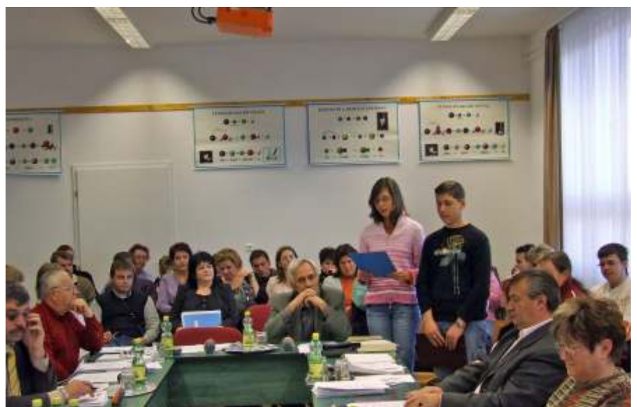
A diákönkormányzat köszöntötte a képviselő-testületet