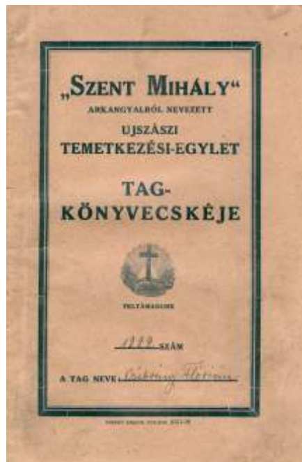
A tagkönyv címlapja