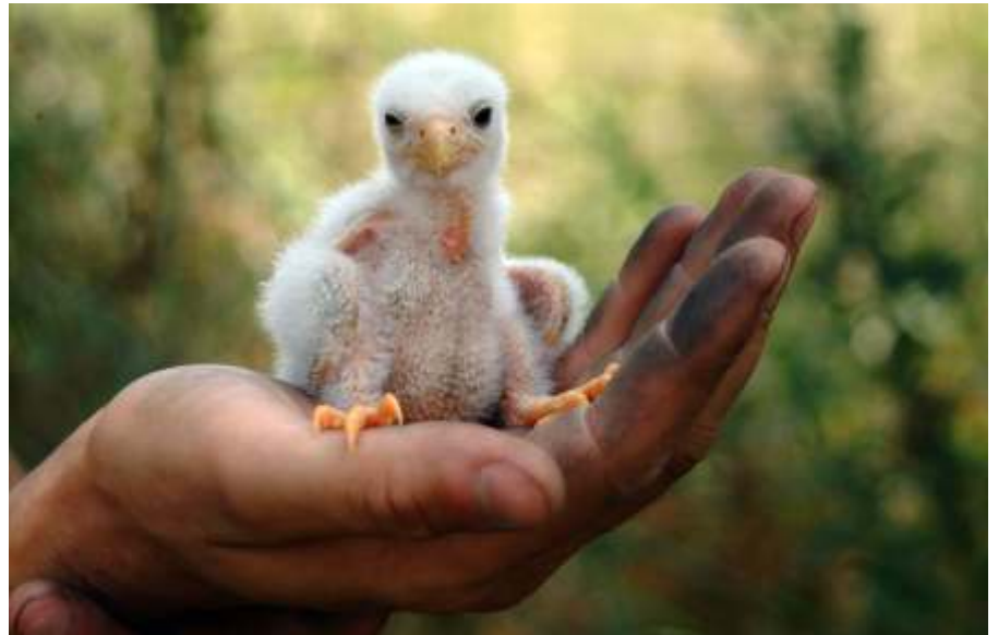
Kék vércse fióka

Az előadások egyik fő témája a kék vércse védelmi program, melyről az MME következő cikkében olvashatnak részletesen. A másik témakör az Európai Unió földhasználatával összhangot kereső természetvédelmi programja, a NATURA