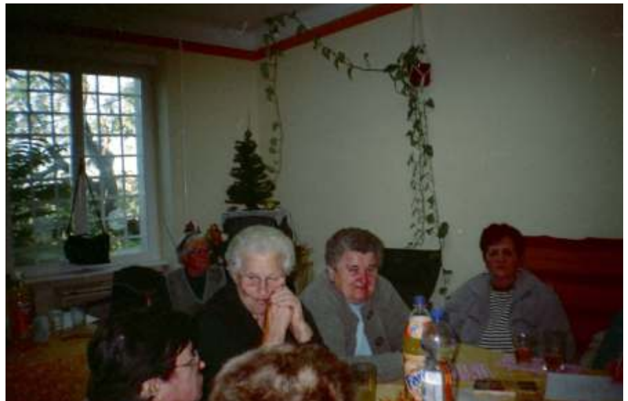
Együtt az asztalnál

vék etetésekor, de a háziállat-simogatót sem hagytuk ki, s volt, aki a játszótér csúszdáját is kipróbálta. Ebéd után felkerestük a Jász Múzeumot, melynek néprajzi, jász női ruhaviselet darabjai, a régi polgári élet használati tárgyai, a Bizáncból származó Lehel kurtje, stb. meghatározó szerepet játszanak a Jászság kulturális életében. A klubtagok – visszaemlékezve gyermekkorukra – azonnal felismerték a kiállított tárgyak között a vízi élethez tartozó szakot, tapogató hálót, a paraszti konyhában használatos lisztesládát, sütőteknőt, keresztfát, rokkát, az állattartáshoz nélkülözhetetlen zablát, járomot, kolompot. Látogatásunk végén a vendégekönnybe beírt néhány sorral jeleztük megelégedettségünket.