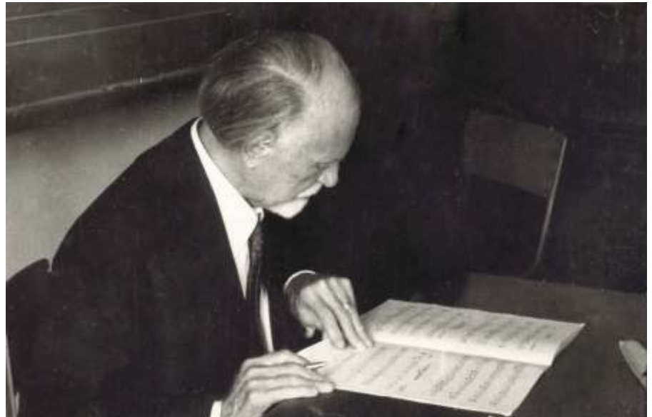
Kodály Zoltán a kecskeméti Ének Zene Általános Iskola és Gimnáziumban 1967 körül

A dalos találkozóba is bekapcsolódunk. Egyik alkalommal a „Pünkösdlőt” és az „Esti dalt”, Kodály két vegyes karra írt kórusművét tanultuk meg. Bárdos Lajos, a kor legnagyobb karmesterének vezényletével Mátyásföldön adtuk elő. A férfi szólamokat