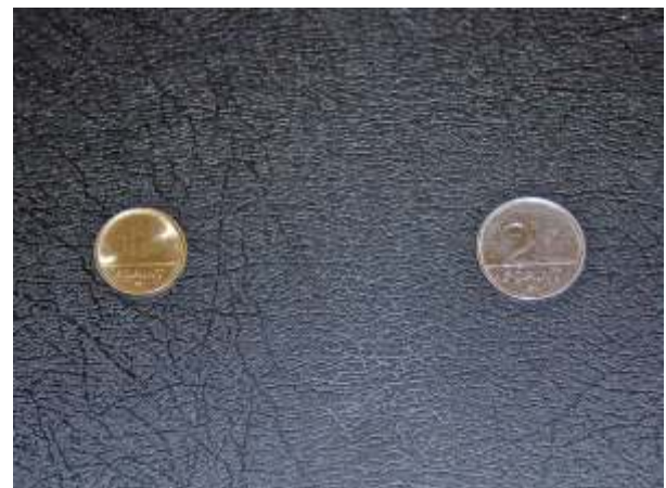
Sok kicsi sokra megy

Családsegítő és Gyermekjóléti Szolgálat munkatársai