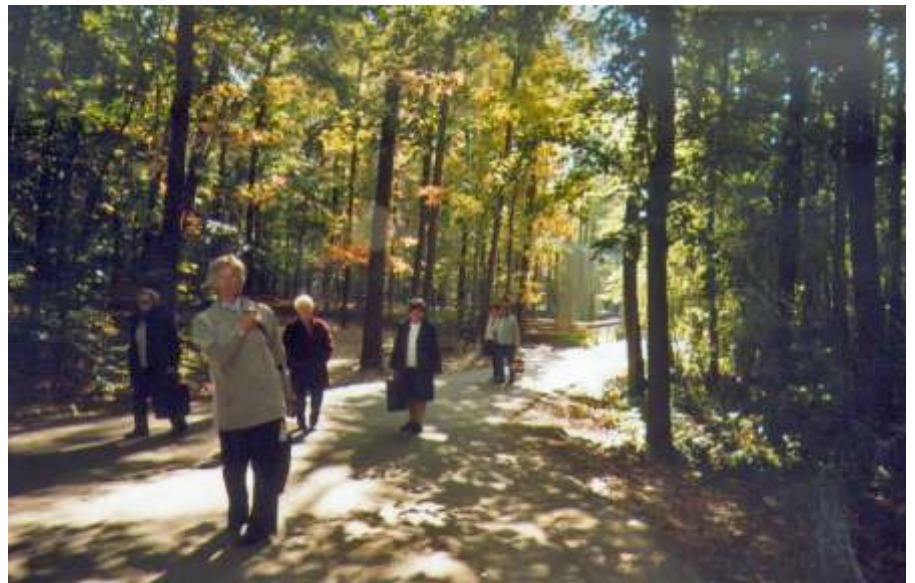
A nyíregyházi állatparkban