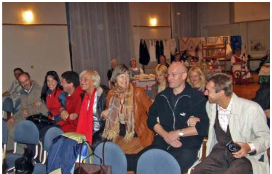
Nemzetközi közönség