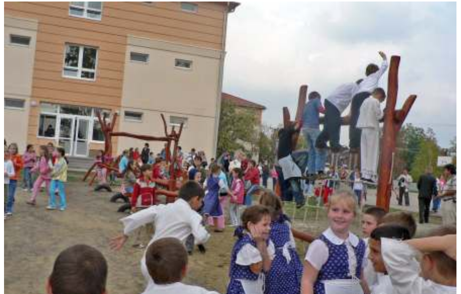
Szakértők vizsgálják az új játszótér