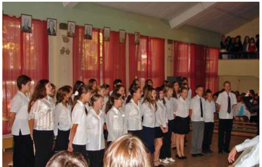
az általános iskolások ...