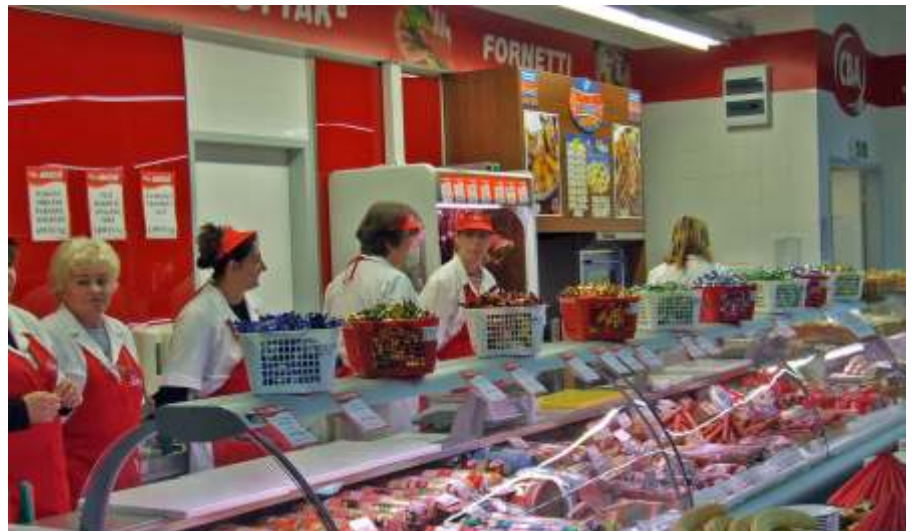
Felkészülve a vásárlói rohamra

vő vietnami vendégeket. Az oldott hangulatú megbeszélésen téma volt a láb-toll-labda mellett a közelgő pekingi olimpia, és bármilyen furcsának hangzik, még a gazdasági kapcsolatok is szóba kerültek. A világbajnokságról kevés információ jelent meg a hazai médiában, de egy nagyszerű verseny „másodlagos” rendezői is voltunk egyúttal. Köszönöm, és gratulálok a verseny rendezőinek, mert bár Szolnokon volt a verseny, úgy gondolom, városunk hírnevét is tovább öregbítették.