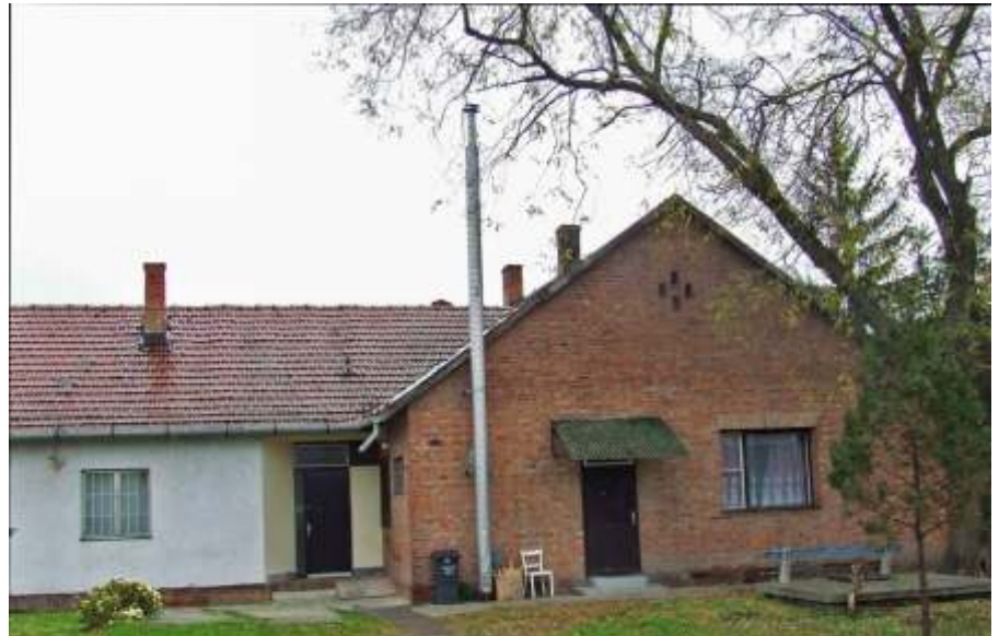
Új helyen a szolgálatok