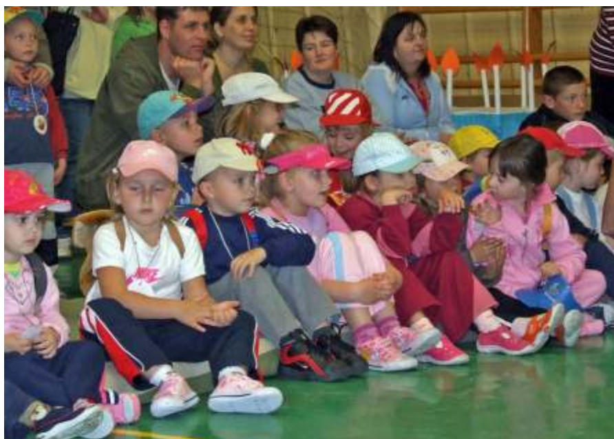
Micimackóra várva

Felelős szerkesztő: Fehér Judit ♦ Olvasószerkesztő: Fehérné Szekeres Zsuzsanna ♦ Tördelőszerkesztő: Kovács Nándor ♦ Szöveg bevitel: Ulvizki Józsefné ♦ Állandó tudósítók, munkatársak: Fehér János (önkormányzat, sport), Kovács Szilárd (kék hírek), Makula Károly (sakk, kultúra) Nagy Elemér (helyi dolgaink), Szilvási Ferenc (helyi dolgaink, sport), Tóth Péterné (iskola), Ulvizki Józsefné (első kézből, civil szervezetek), Varga László (sakk) ♦ Nyomja: 1200 példányban a ReproStúdió –Szolnok ♦ Nytsz: B/PHF/505/SZO/90 ♦ Levél cím: 5052 Újszász, Könyvtár Damjanich út 2. WEB: www.ujaszaz.hu Email: ujaszazihirado@gmail.com Lapzárta: minden hónap 24-én