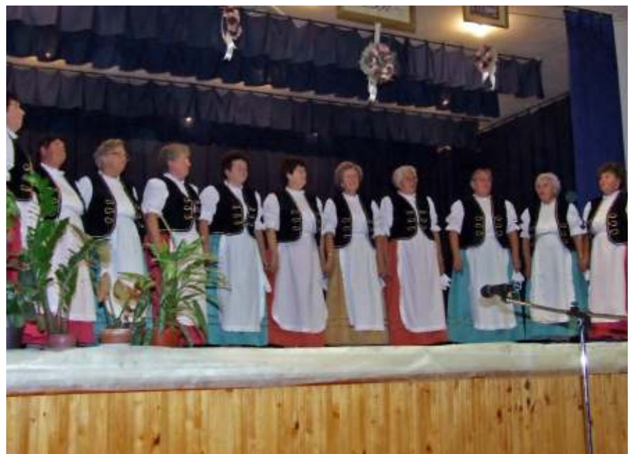
A házigazda Százsorszép Népdalkör