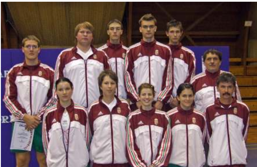
Újszászi VB résztvevők