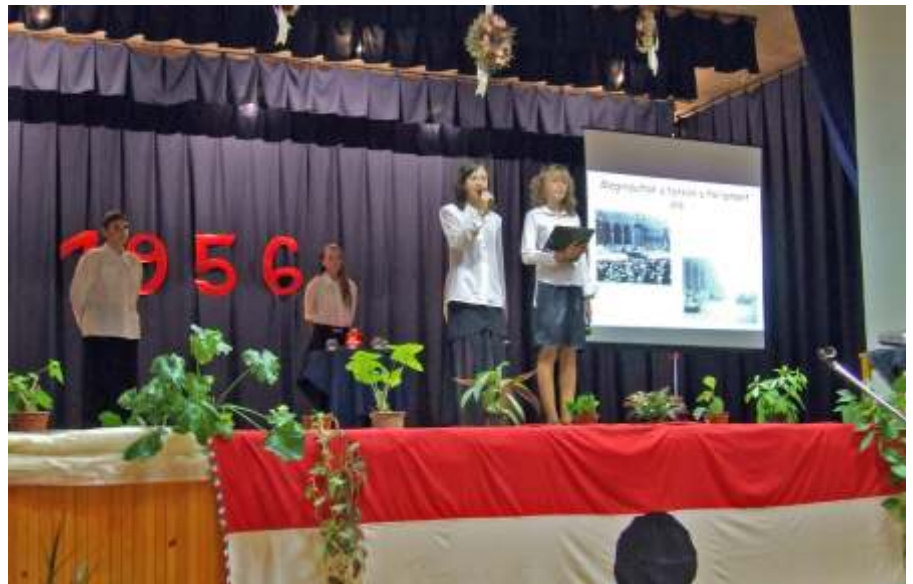
Az általános iskolások műsora

A rendszerváltozás után születettek pedig szinte közömbösek e nemzeti sorsforduló iránt, de nem csoda, hiszen ők nem mindig korrekt cselekedetekből vonhatnak le következtetéseket, mert sajnos ma már annak is szem- és fültanúi vagyunk, hogy 1956-ot ürügyként használ-