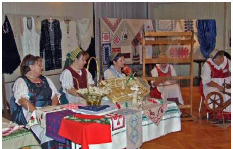
A díszítőművészek látványos kiállítást és bemutatót tartottak