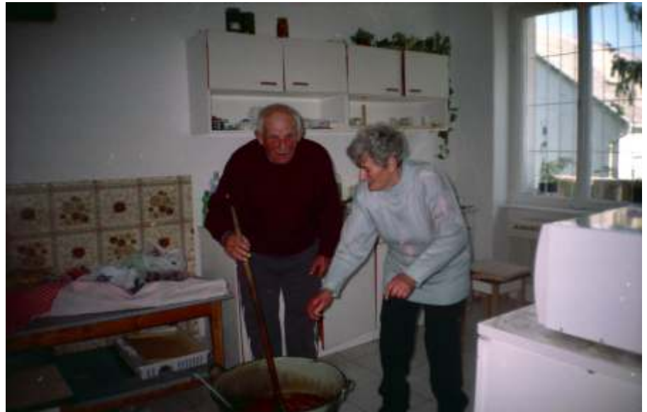
Főzés az Idősek Napján

Október 2-án a jászberényi Állat- és Növénykertbe látogattunk el. Szentanúii lehettünk az elmúlt időszak pozitív változásainak. Új kifutók épültek, ahol az állatok természet közeli környezetükben tekinthetők meg. Ott voltunk a barnamed-