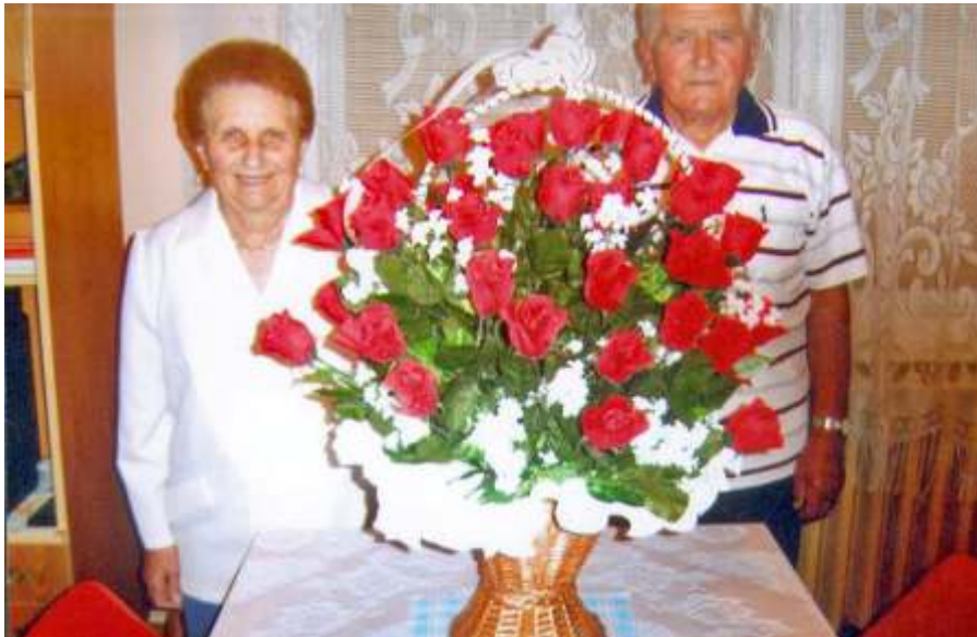
Az 50 éves házassági évfordulón