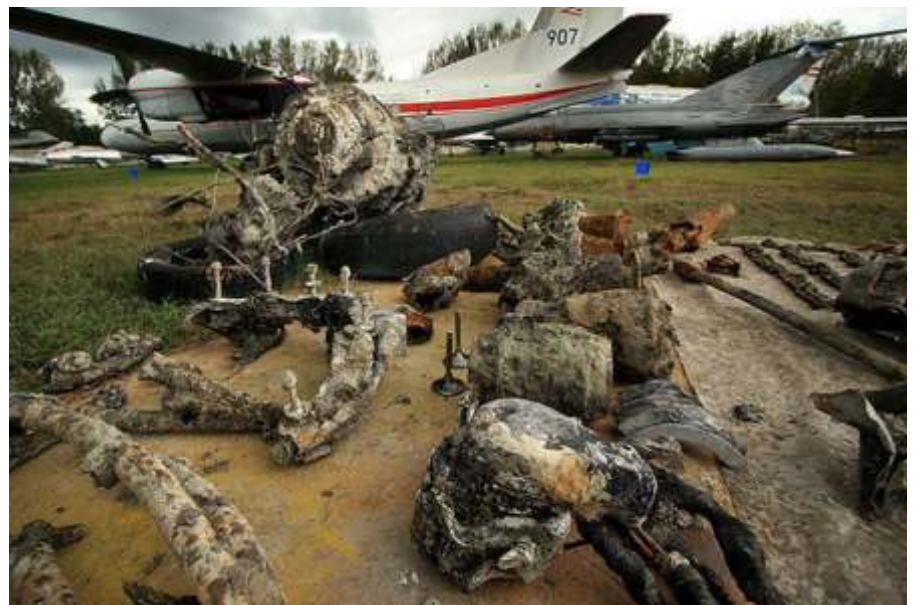
Egy szovjet La-5FN zuhant le 1944 novemberében Újszász közelében