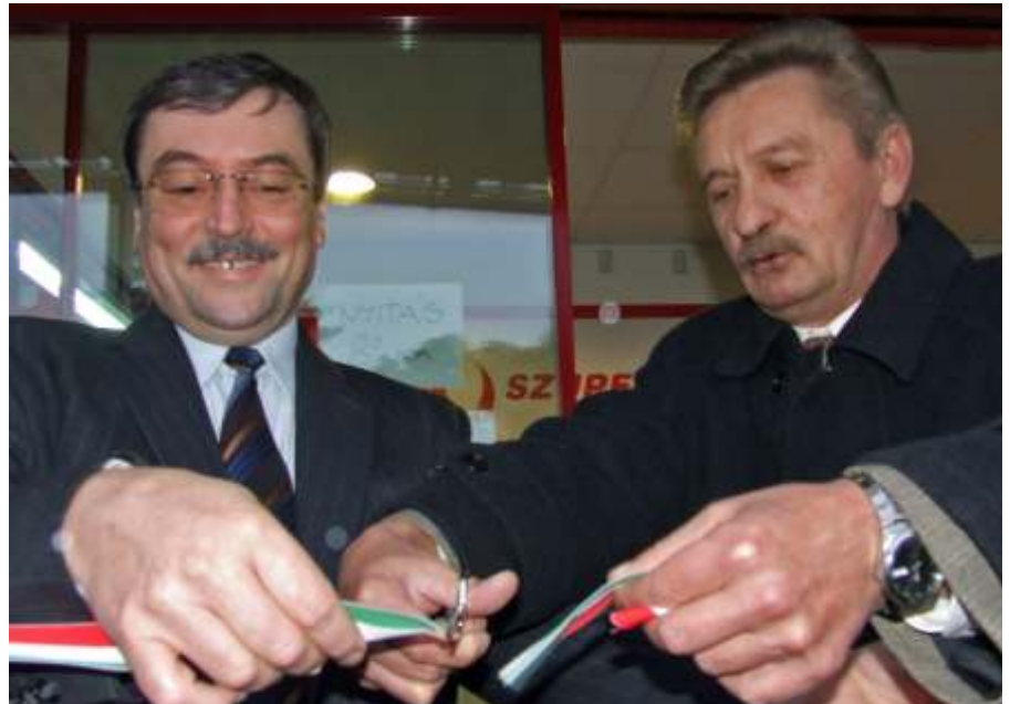
CBA átadás

Ugyanezen a napon járt nálunk az a nemzetközi küldöttség, amely az V. Láb-toll-labda Világbajnokságra érkezett Magyarországra. A rövid ismerkedésen és megbeszélésen fogadtam a kínai sport miniszterhelyettest, és a társaságában lé-