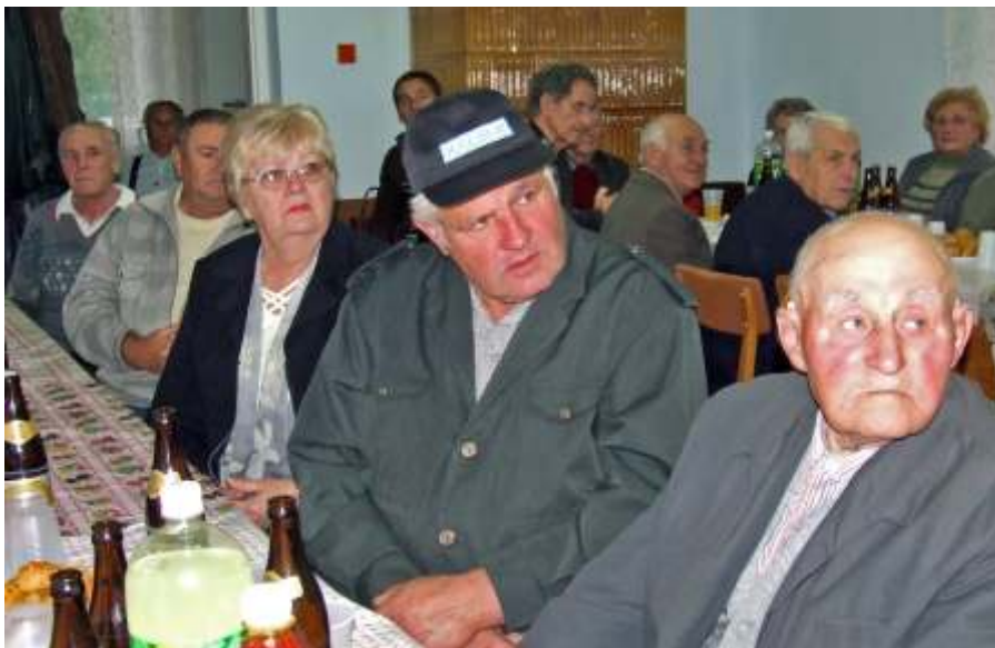
Sokan járnak a vasutas klubba

E megemlékezés szóljon valamennyi nyugdíjas vasutas és családtagja részére, azoknak is, akik betegségük, vagy egyéb elfoglaltságuk miatt nem tudtak eljönni, jó erőt és egészséget kívánva, valamennyiünk nevében.