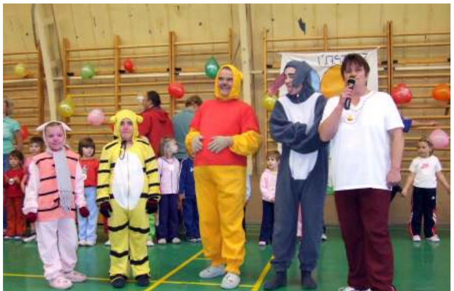
Micimackó barátait is elhozta