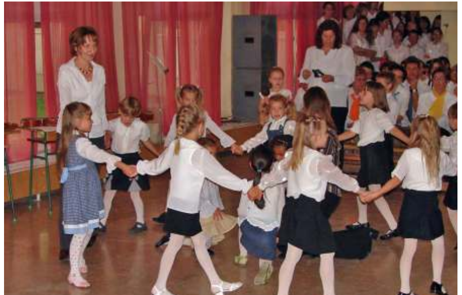
Énekeltek az óvodások, ...

Hámori József agykutató professzor Az emberi agy és a zene című előadásában azt bizonyítja, hogy a zenére való fogékonyság kihat az agyi struktúrára, az agyi beállítódásokra, ezáltal sikeresebbé tesz más irányú tevékenységekben is. Pszichofizikai vizsgálati eredményekre hivatkozva azt állítja, hogy míg a beszédtevékenység, így a nyelvi kommunikáció fő irányítója a bal agyfélteke, addig a zenei képességek legnagyobb részben a jobb agyféltekéhez kötődnek. A két agyféltekét mintegy kétszáz billió idegrost hálózta be. A bennük lévő idegsejtek készek különböző képességek elsajátítására, de ehhez aktivizálni kell őket. Annál hatékonyabban működik az agy, minél hatékonyabban hangozunk össze a két agyfélteke működését. Ahhoz, hogy hatékonyan összekapcsolódjon a két agyfélteke, és egyre kiegyensúlyozottabb fejlettségi szintet érjenek el, az általuk irányított képességeket arányosan kell fejleszteni. Minél sűrűbb idegrost-hálózat kapcsolja őket össze, annál több szalon érkezik információ az egyik féltekéből a másikba és viszont, és annál tökélete-