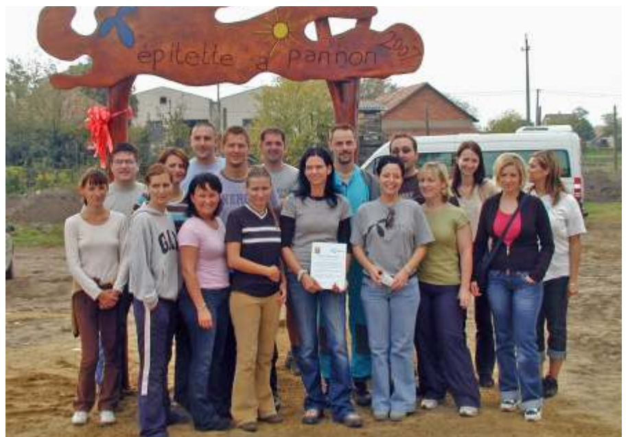
Nekik köszönhetjük az új játékokat