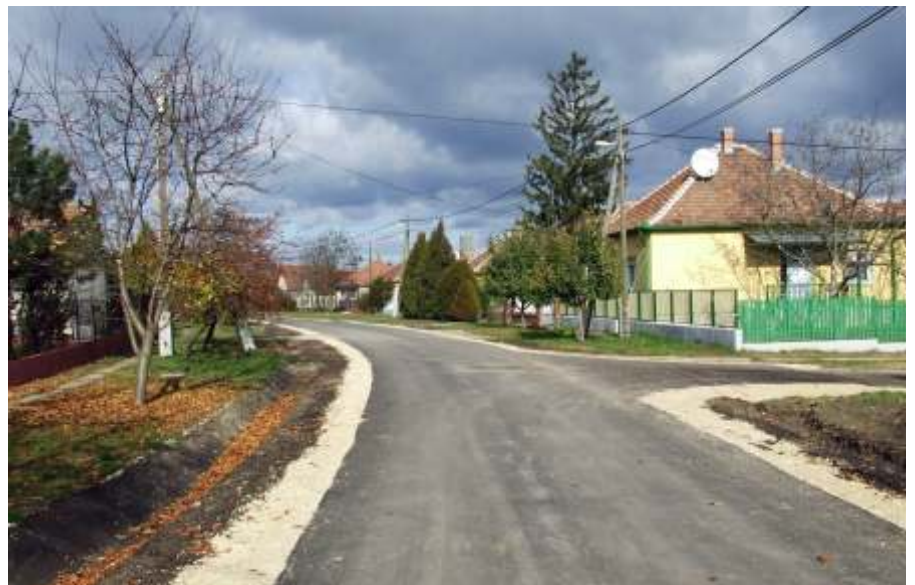
Aszfaltburkolatot kapott a Béke körút

3) Munkás út felújítása, belvízelvezetés rendezése.