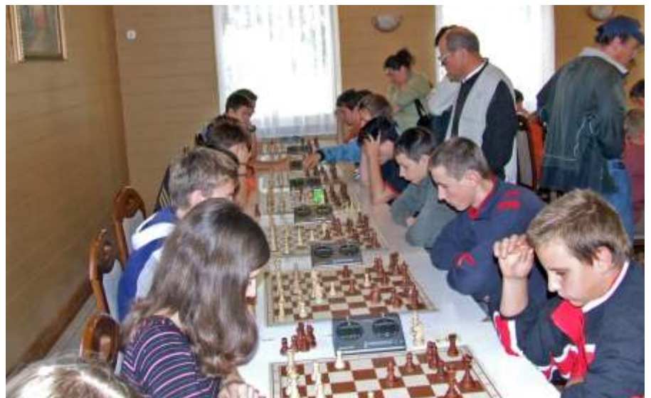
49 fiatal sakkozó vett részt a versenyen