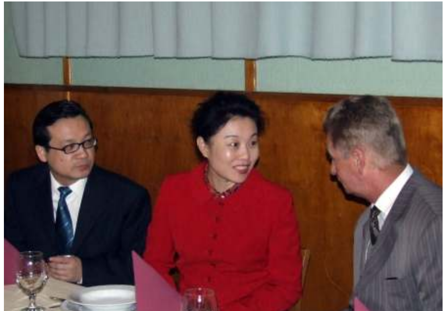
Újszászon járt Kína sport miniszter-helyettese

Befejezésül: Nem kívánhatok mást, mint azt, hogy 1956. a jövőben se váljék az össze-vissza események ürügyévé, hanem tekintsük azt valamennyien a magyar szabadság szimbólumának.”