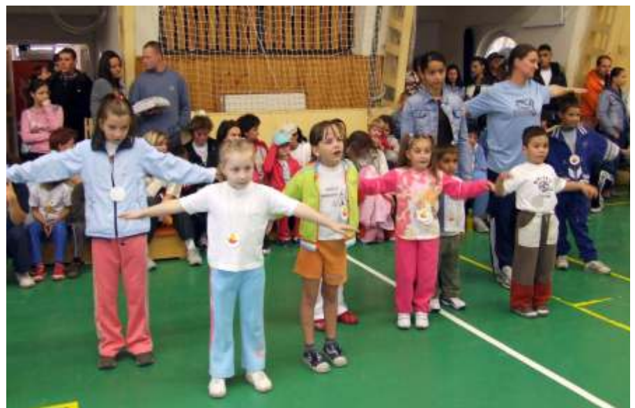
Közös torna