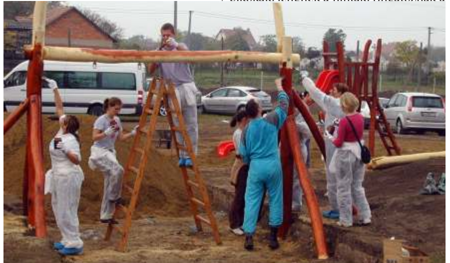
Készül a játszótér

Azóta is megállás nélkül billegnek a libikókák. lengnek a hinták. ringatóznak a