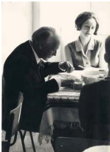
Kodály Zoltán feleségével a kecskeméti gimnázium ebédlőjében