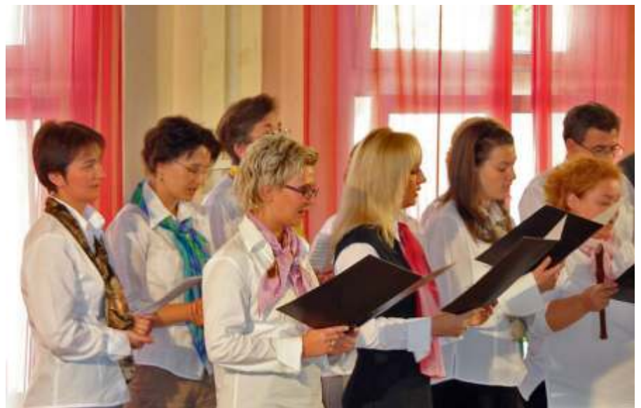
... és a tanárok is