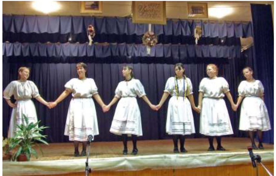
A táncművelés résztvevői is bemutatkoztak

Összességében nem panaszkodhatunk, ugyanis több bűncselekmény nem történt városunkban. Ez munkánk eredménye, melyhez nagymértékben hozzá-