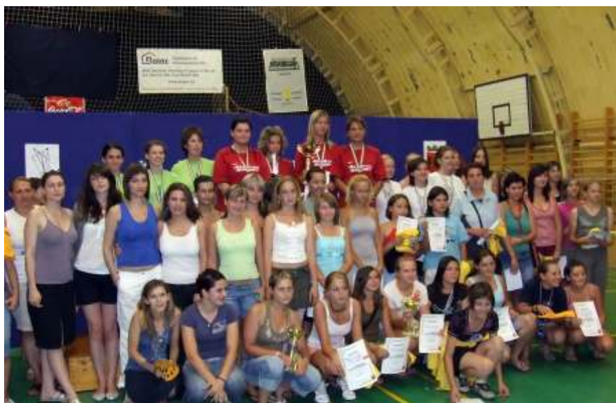
A női csapatverseny résztvevői

peltek, a lengyelek tréfás jelenetet adtak elő, a görögök egy népdalt énekeltek, a szerbiaiak az Eurovíziós dalfesztivál győztes dalát hozták el, a szlovákiaiak Kassáról érkezett előadójának elvont humorát nem értette a közönség. Kedden az egyéni döntők után hajnalig tartó kerti partival búcsúzott a versenytől és egymástól a nemzetközi mezőny. Mindenkinek nagyon ízlett az Ulviczki József által főzött gulyás.