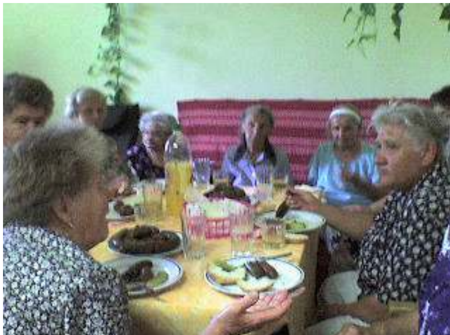
Minden finomság elfogyott

taltam, hogy mindenki jól érezte magát, s néhány órára talán a nap égető sugarai elől is menedéket találtunk a strand fedett, hűsítő medencéinek vizében. Hazafelé jövet abban állapotunk meg, hogy augusztusban ismét ellátogatunk Cserkeszőlőbe.