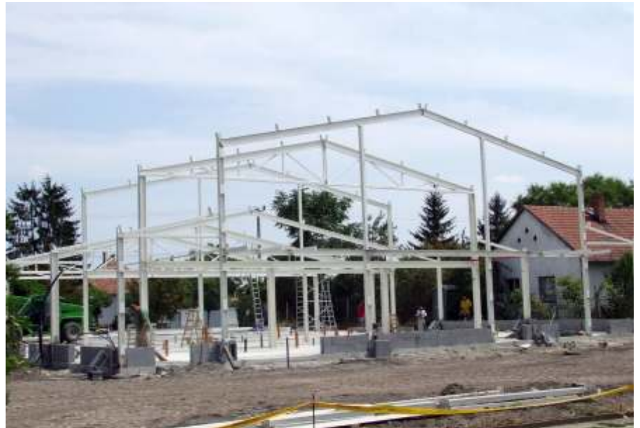
Gyorsan épül az új áruház

Július 24-én a szabadidőközpont és lakópark fejlesztési koncepciójának megbeszélését tartottuk azzal a bizottsággal, mely a fejlesztési bizottság tagjaiból és az önkormányzat bizottságainak elnökeiből áll. A döntés értelmében reális esély van arra, hogy szeptember végére, október elejére kész pályázati anyaggal rendelkezünk. Természetesen, mint minden