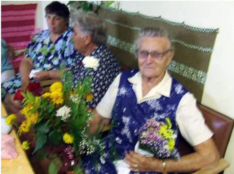
Szeretettel köszöntjük