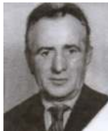
MENKÓ JÁNOS halálának 25. évfordulójára

„Szomorú az út, mely sírodhoz vezet, megpihent drága apai szíved. A szív egyet dobban, megáll, S távozásod sosem lesz emlék csupán. Bennünk örökké élsz, egy életen át, Odafentről vigyázol ránk.”