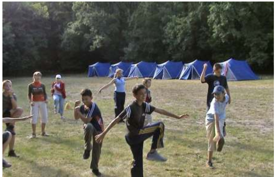
Tábori ki-mit-tud...

Sajnos a nagy hőség miatt táborüzet nem tudtunk gyűjtani, de a tábor legizgalmasabb programja mégis a bátorságpróba volt. A polgárok segítségével zaj-