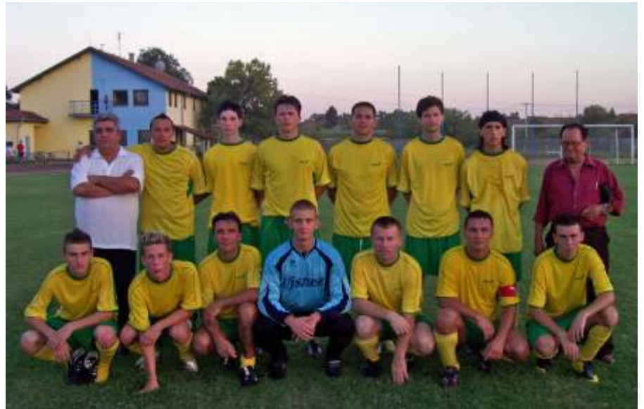
Az újszászi csapat

Augusztus 26. Karcag – Újszász Szeptember 01. Újszász – Kunszentmárton Szeptember 08. Újszász – Jászfényszaru Szeptember 15. Törökszentmiklós – Újszász Szeptember 22. Újszász – Nagyviván Szeptember 29. Fegyvernek – Újszász Október 06. Újszász – Jászárokszállás Október 13. Kunhegyes – Újszász Október 20. Újszász – Jászládány Október 27. Tiszaszentimre – Újszász November 03. Újszász – Abádszalók November 10. Túrkeve – Újszász November 17. Újszász – Jászakisér November 24. Besenyszög – Újszász December 01. Újszász – Mezőtúr December 08. Kunmadaras – Újszász