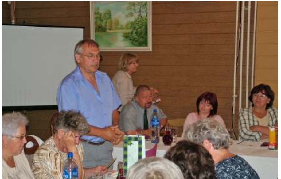
A társ kertbarát körök is köszöntötték a jubiláló újszásziakat

Tisztelt hölgyeim, uraim, tisztelt vendégek és kertbarátok! E kis megemlékezés csak rövid áttekintés volt, mert ha a 30