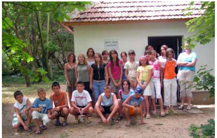
Az Arany János emlékháznál