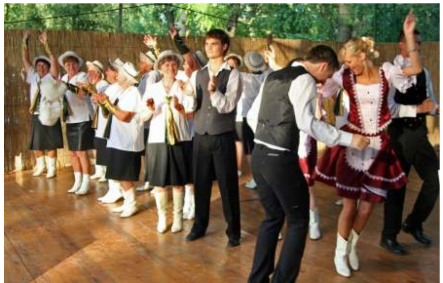
Együtt a két csoport az eredményhirdetésen