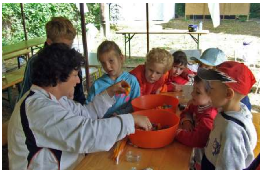
Készülnek a figurák

nélkül. Tény, hogy közel száz óvoda, iskolás vett részt a július 2–6-ig tartó ötnapos programon.