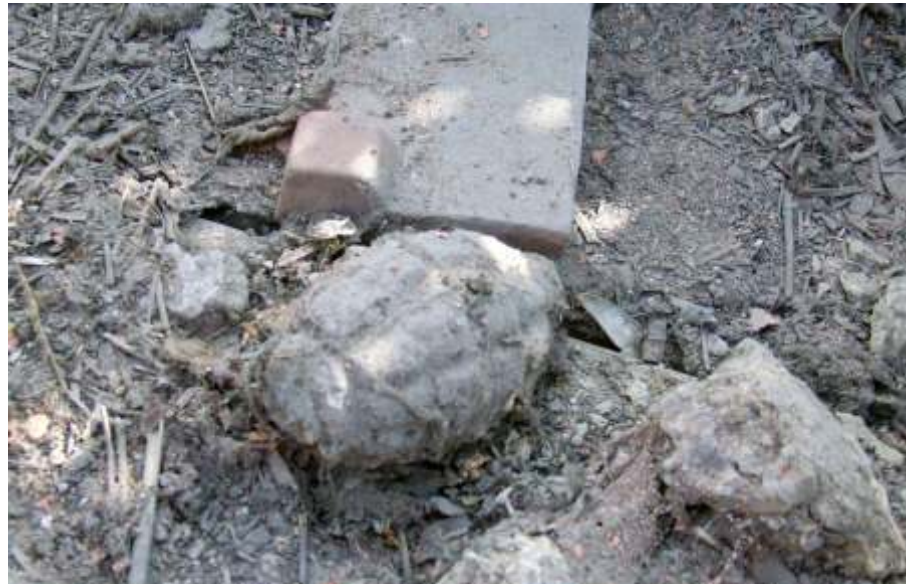
Hatástalanításra várva