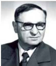
FEKETE JÓZSEF halálának 6. évfordulójára

„Sír az ég emlékezem. Arcomra hull könny, eső az emlék sokaságából te jössz elő.”