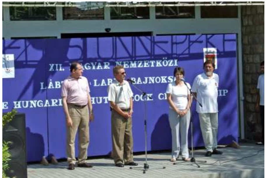
A nemzetközi lábtoll-labda bajnokság megnyitóján

hogy a szolnoki fürdők minden évben több mint 100 millió forint veszteséget termeltek. Természetesen ez a veszteség a felosztható nyereséget csökkentette. Újszász a konzorciumban 7,6 százalék vagyonszerzési rész fölött rendelkezik, ezért számunkra sem mindegy, hogy mennyi nyereséget tudunk évente felosztani konzorciumi díjként.