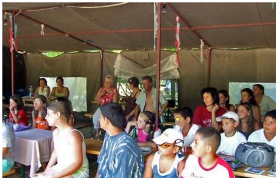
... és a lelkes közönség