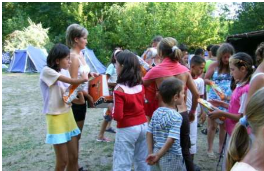
Jutalom a résztvevőknek