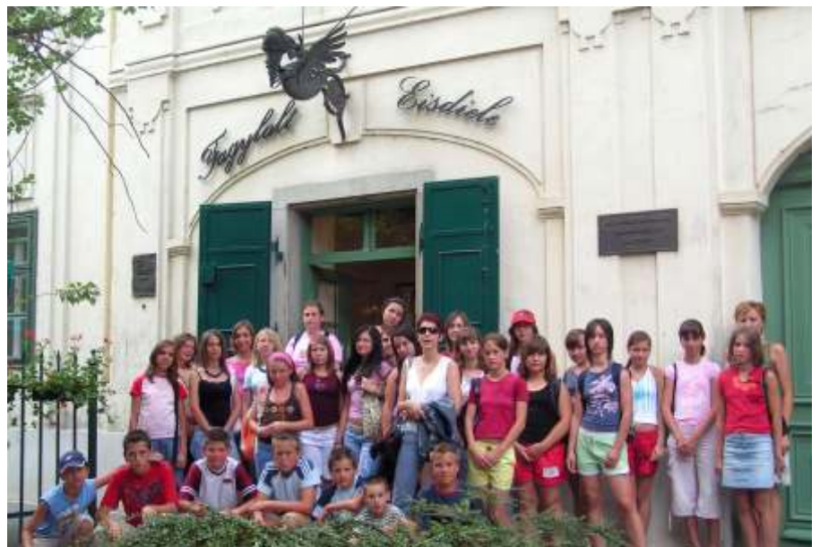
Fagylaltra várva