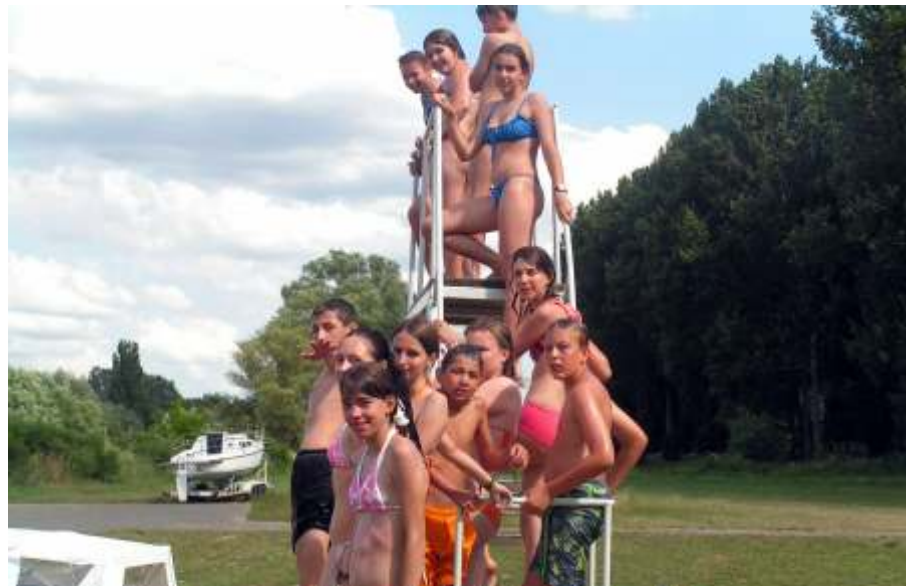
Táborozás a Körösnél

Csütörtökön ismét jó időnk volt, ezért egy kis kitérő után célba vettük a gyulai várfürdőt. Rövidke kitérőnk Gesztre vezetett, ahol meglátogattuk a Tisza család egykori kastélyát és a kertben Arany János emlékére berendezett emlékházat is. Ez a kastélylátogatás családias volt számunkra, mert sajnos nagyon kevés tárgyi emlék maradt fenn, illetve az épület is igen lepusztult állapotban van. A délutáni fürdőzés azonban mindenért kárpótolt bennünket. Este, vacsora után tanáraink éhes szánkat legalább 100 gofrival „tömtek be”, amit helyben sütöttek. (Köszönet érte!) Ezzel párhuzamosan az udvaron