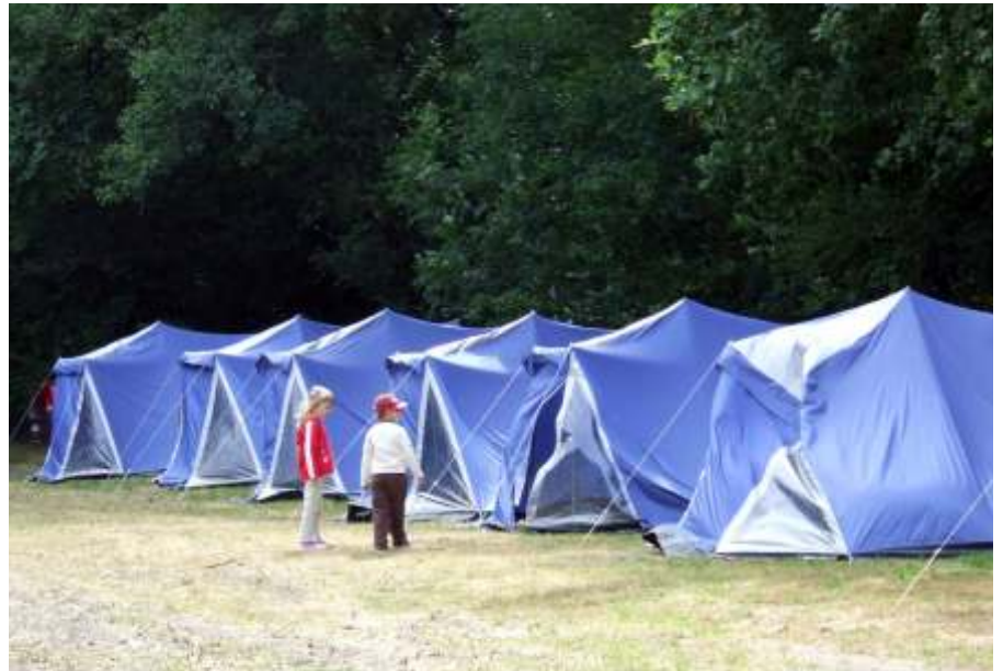
Két hónapig álltak a sátrak a Parkerdőben: (Fotó: Fehér Judit)

A szolnoki Damjanich uszoda bezárása elsősorban a szolnoki közvéleményt izgatta, de Szolnok Megyei Jogú Város döntését Újszász városa, mint a VCSM Zrt. tagja is támogatta. Tudni kell hozzá,