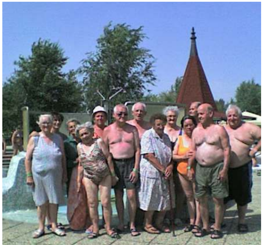
A kirándulás résztvevői

próbálta a különböző hőmérsékletű, mélységű, fedett és nyitott, brómos, jódos gyógyvizes medencéket. A gyógyulni, pihenni vágyókat itt nyáron 2 úszó-, 1 hullám-, 1 gyermek-, 1 élmény- és Európa első kétpályás ponyvacsúzdájával, valamint ülőpados gyógymedencékkel, gyönyörű környezetben várják. Úgy tapaszt-