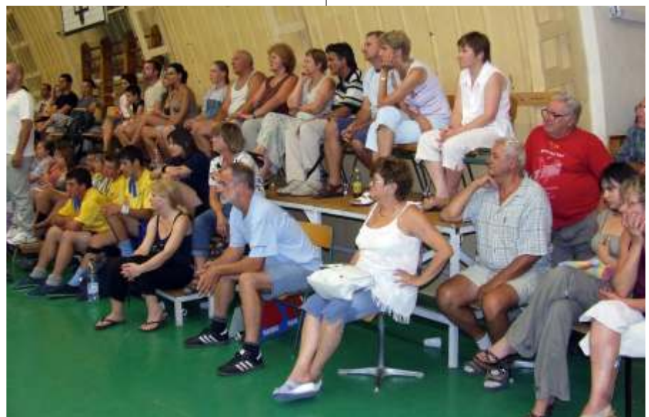
Az idén is sokan izgulták végig a meccseket