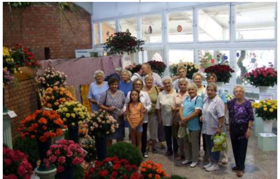
Rózsafesztiválon járt a nyugdíjas klub

A következő megállónk Csongrádon volt. A Fő utca platánsora a város szívébe vezetett bennünket, ahol rövid sétát tet-