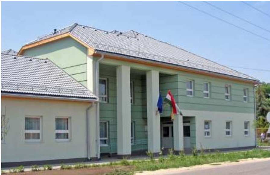
Az óvoda épülete