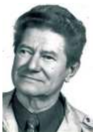
KIRÁLY FERENC halálának 6. évfordulójára