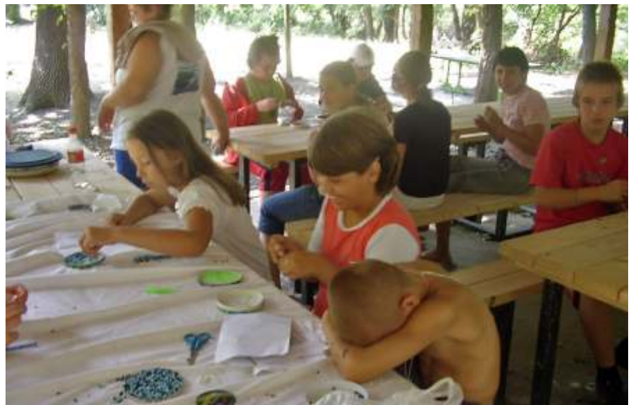
Kézműves foglalkozás a nagycsaládosok táborában