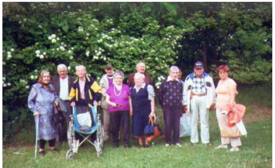
A kecskeméti arborétumban