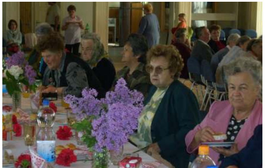
Terített asztalnál

nem felelősségteljesen gondozzák, még az unokákat is. Az édesanyák munkája olyan sokrétű, amit egy férfiember nem is tud felfogni. Azt kérte a jelenlévő édesanyáktól, hogy törődjenek a szűkebb és tágabb értelemben vett családdal is. Egy város megéri, ha olyan édesanyák vannak, akik nemcsak a szűkebb családdal törődnek, hanem segítenek a szomszédoknak, rokonoknak, mert csak így tudunk élni. Végül nagyon sok boldogságot kívánt a résztvevőknek.