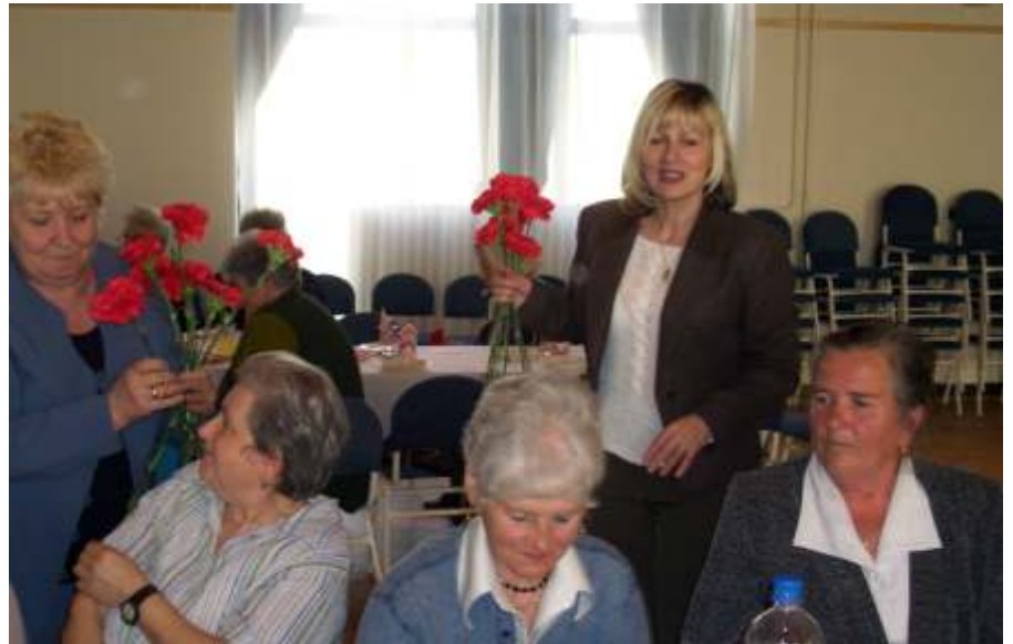
Virágot kaptak az édesanyák

Ezután Molnár Péter polgármester kért szót. Nagy-nagy szeretettel és tisztelettel köszöntötte a megjelent édesanyákat, nagymamákat, dédnagymamákat. Elmondta, minden családban, ahol az édesanya felelősségteljesen teljesíti feladatát, a család összetartó. Igen nagy tisztelet illeti azokat az édesanyákat, akik nemcsak megszülik gyermeküket, ha-