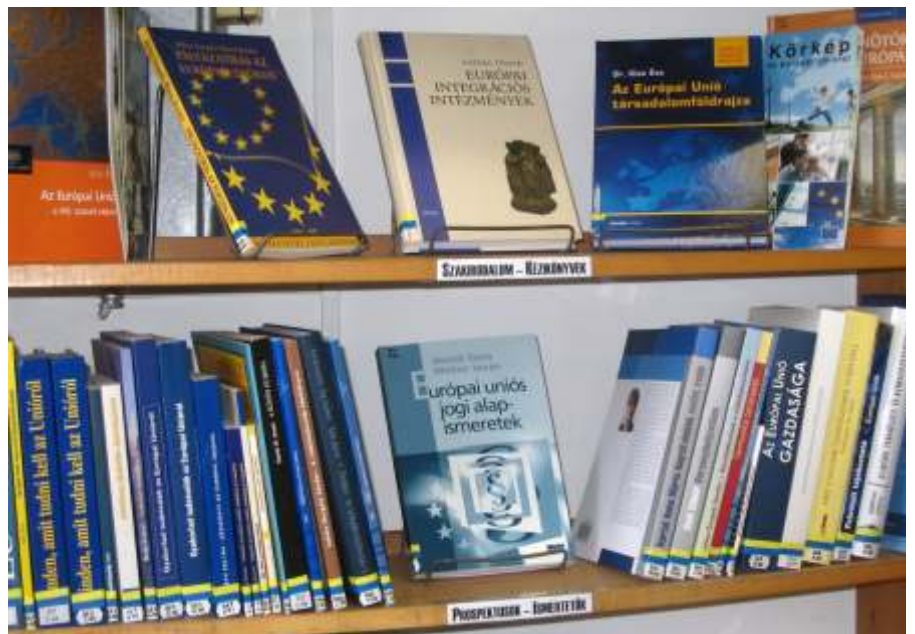
A könyvtárban gazdag a választék az EU-s könyvekből

rum 24 résztvevője egy kellemes hangulatú előadás és párbeszéd után új információkkal gazdagodva tért haza.