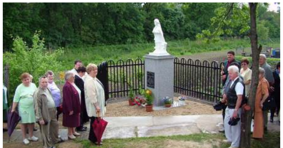
Szent Vendel napsütésben