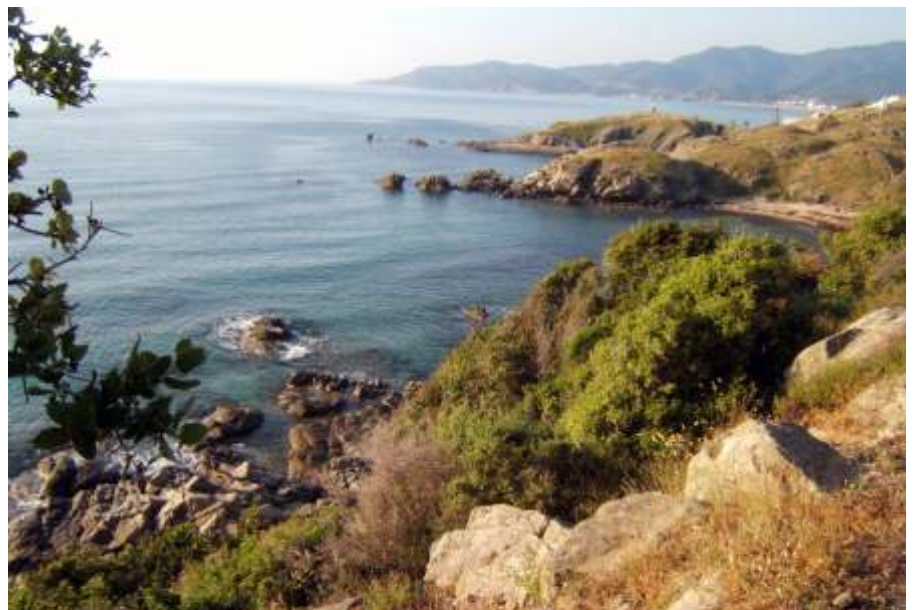
Parti sziklák