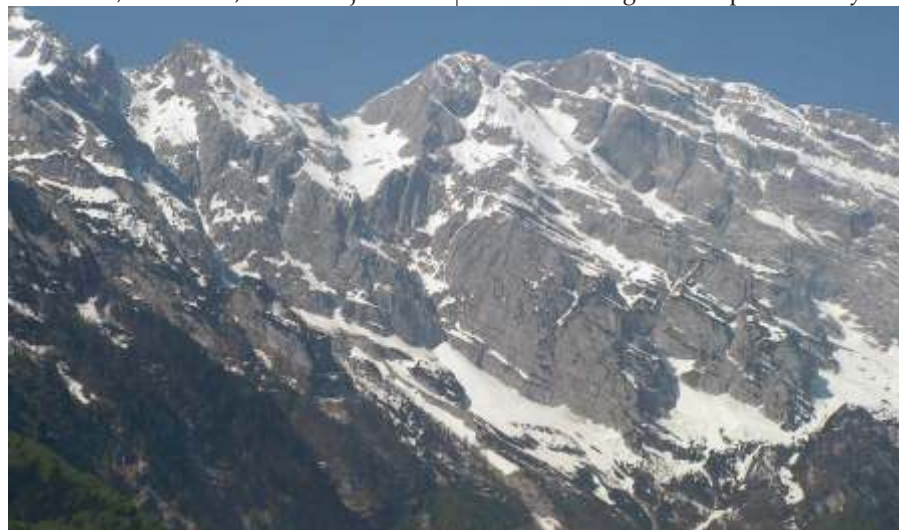
Az Alpok

A nap végén egy partyra hívtak meg minket, amelynek a helyi mozi és pizzeria adott helyet. Itt került megrendezésre a csapatvezetők ülése is, ahol szó esett elsősorban a játék szeretetéről, a sport kapcsolat kialakuló nemzetközi kapcsolatok ápolásáról, a sportbarátságról. Természetesen a sportág terjesztése, népszerűsítése is szerepelt a témák között, végül a közeljövőben megrendezésre kerülő rangos nemzetközi tornák időpontjait egyeztetjük. Az ülés végeztére bepakolt a helyi ze-