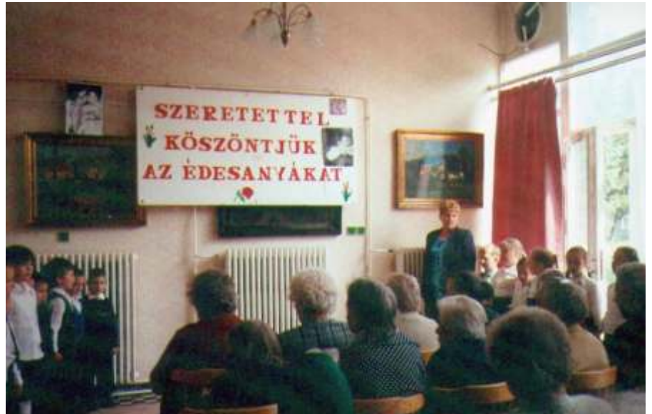
Anyák napja a Szociális Otthonban