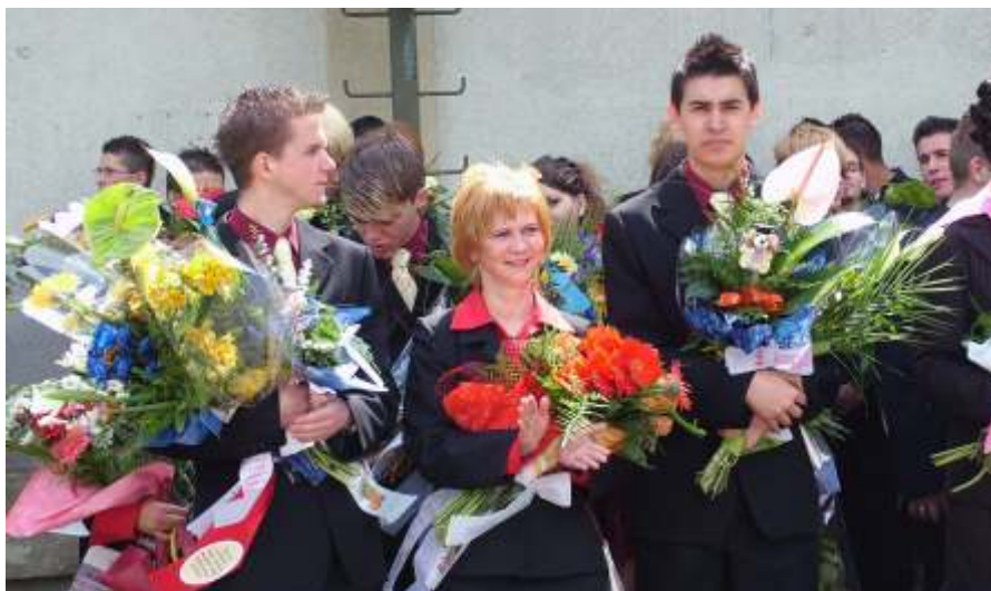
Ballag már a vén diák ...

»OBSERVER« OBSERVER BUDAPEST MÉDIATIGYHŐ KFT.