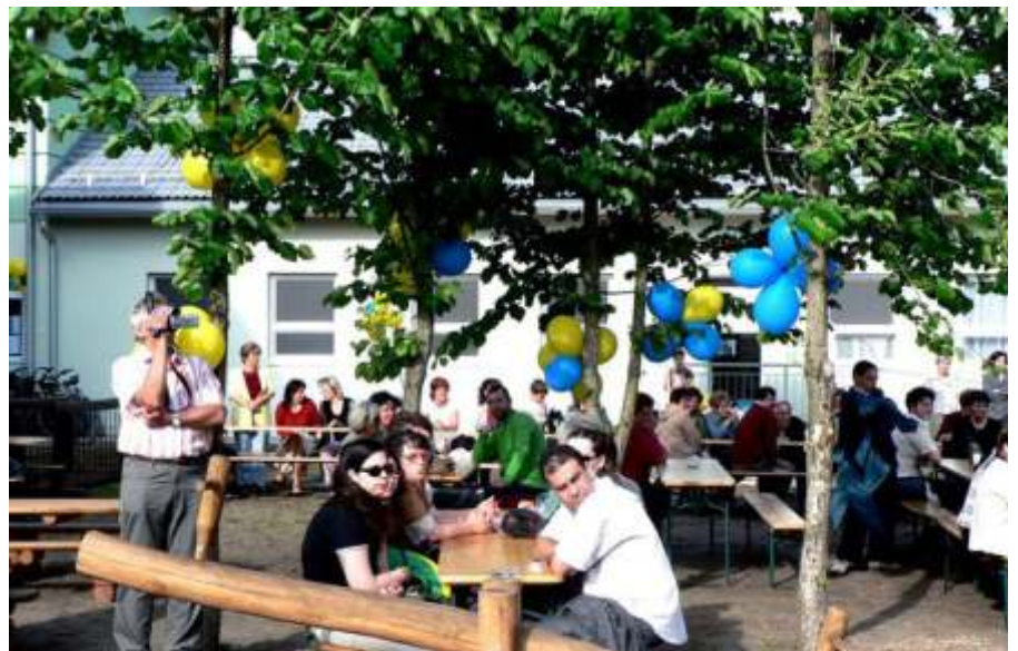
A kertben