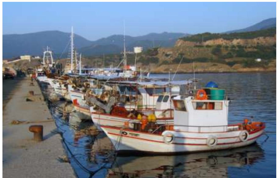
A kikötőben