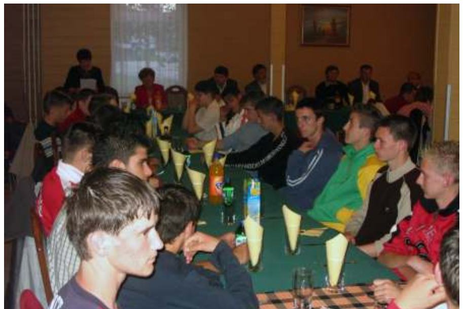
A résztvevők egy csoportja