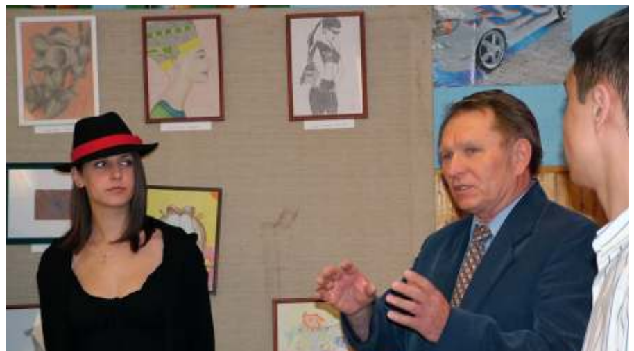
A megnyitó pillanatai