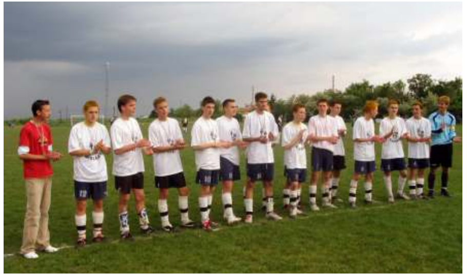
Az aranyérmes ifik

Edzés helyett a tavaszi első fordulóból, a pálya használhatatlansága miatt elmaradt mérkőzést pótolta a csapat. Tulajdonképpen ez tényleg csak edzés volt, hiszen könnyedén sikerült egy hatost rúgni a hazaiaknak. Szabó Gábor ott folytatta, ahol a hétvégén abbahagyta, illetve Varga István is „jelezte”, hogy meggyógyult.