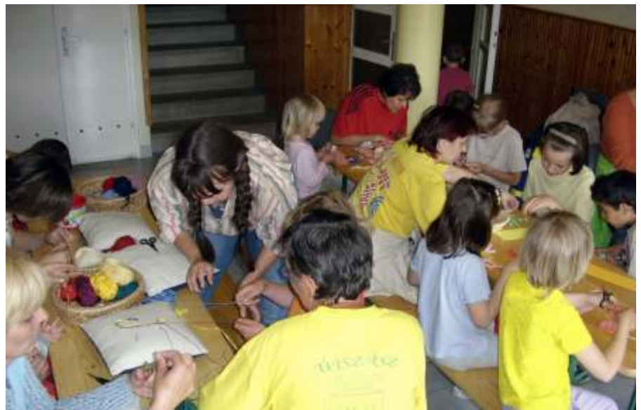
Kézimunka foglalkozás