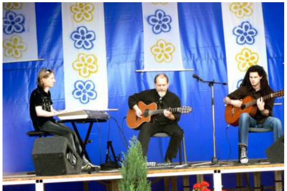
A Mediterran Combo együttes