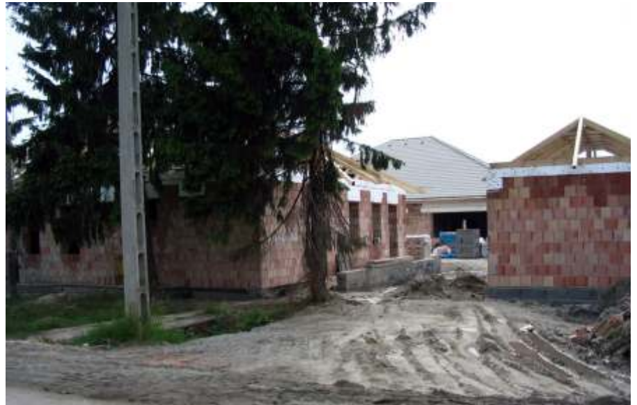
Jól halad a bölcsőde építése

A sok jó után egy kissé „kellemetlenebb” hír: A hónap elején kaptuk azt az információt az Országos Egészségbiztosítási Pénztártól, hogy „két hivatali dolgozó” aláírásával névtelen bejelentés érkezett a hivatallal, illetve az önkormányzati testülettel szemben a közgyógyellátás el-