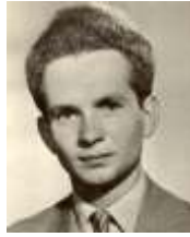
APRÓ JÁNOS és APRÓ KÁLMÁN halálának 50. évfordulóján