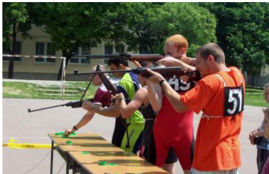
Úszás helyett lövészet

Május 14-én 14. alkalommal rendezte Újszászon a Magyar Technikai és Tömegsportklubok Országos Szövetsége és Jász-Nagykun-Szolnok Megyei Szövetsége a „Mozdulj Magyarország” versenysorozat keretében a Lövész Triatlon Orszá-