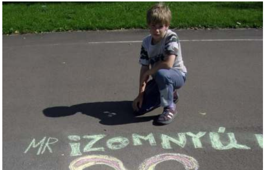
Aszfaltrajzverseny (Fotó: Dehenes Miklósné)

A nap színvonalát emelte a szolnoki TESZ-VESZ Alapítvány csapata. – Ez is egy sikeres pályázat eredménye, hogy ők itt lehettek. – Népi- illetve kézműves játékaikkal nagy örömet szereztek nemcsak a gyerekeknek, hanem szüleiknek is.