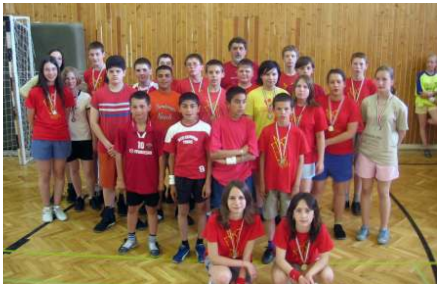
Az újszászi csapat Zánkán