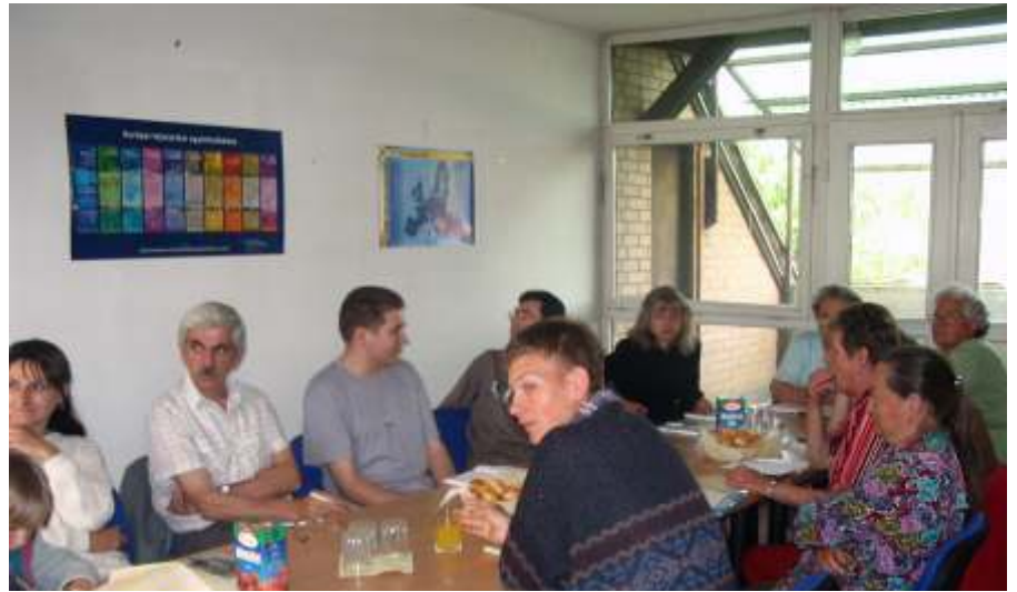
Beszélgetés az EU-ról