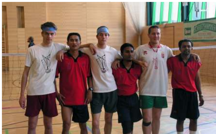
A malajziai csapattal