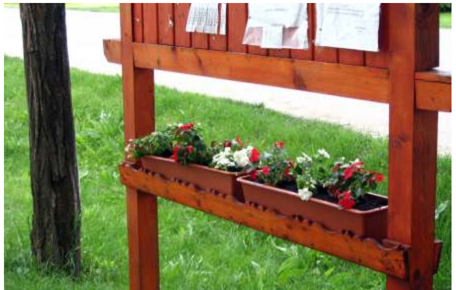
Ezt a virágot még nem lopták el

bírlásának ügyében. Ugye, ez egy jó újszászi szokás? Szeretném tájékoztatni az itt élőket, hogy a közgyógyellátás területén mind az alanyi, mind a normatív, mind a méltányossági alapú döntéseket a Szociális, Egészségügyi és Foglalkoztatási Bizottság hozza meg. Minden döntésük törvényszerű, betartva az országos, ágazati, vagy éppen a helyi rendeleteket. Jelenlétünk ebben a tárgykörben rövid időn belül elkészül, és benyújtjuk az OEP-nek.