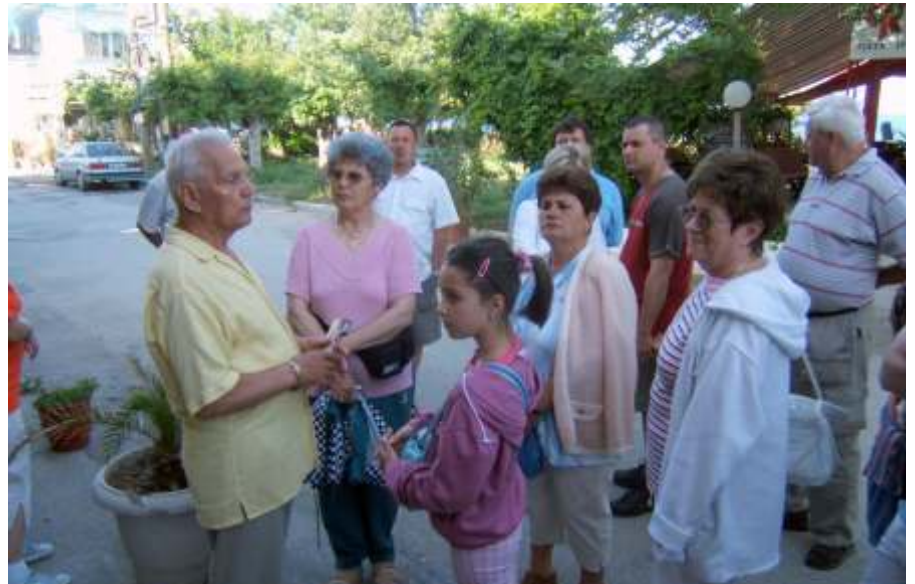
Ismerkedés Görögországgal

A jó időnek „köszönhetően” Baláti Zoltánt annyira felsütötte a nap, hogy nem