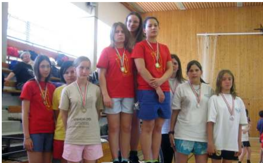
A IV. korcsoportos lányok voltak a legeredményesebbek