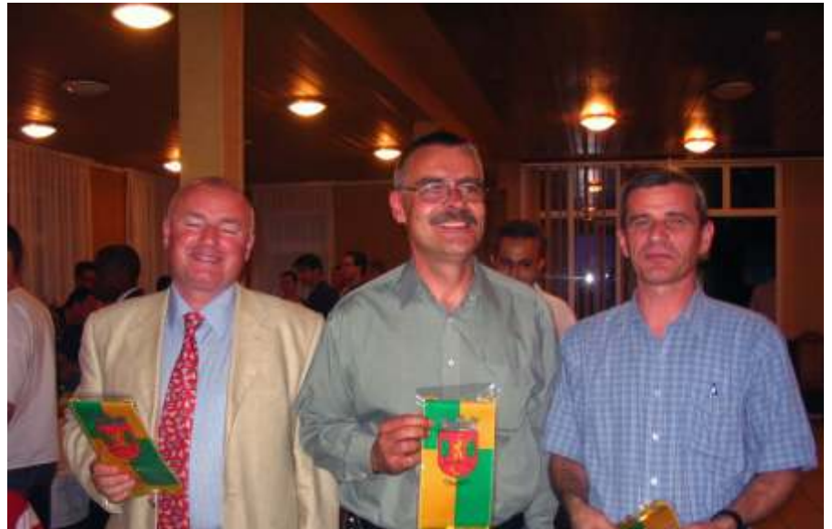
A tanfolyam író, német és magyar oktatója