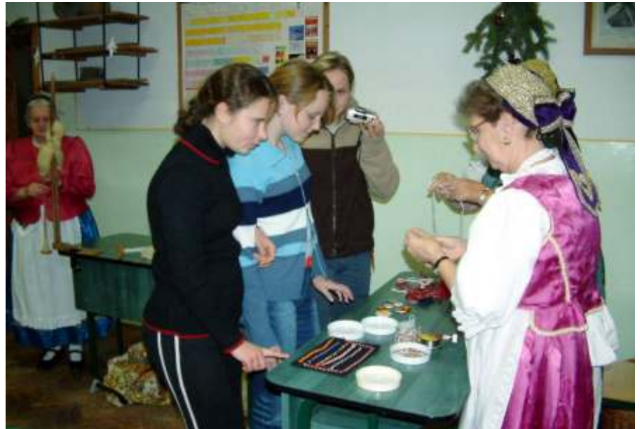
A magyar népművészettel ismerkedtek a lengyel lányok

Ebből az eufórikus hangulatból fel sem tudtunk ocsúdni, hiszen minden nap – advent idején – valami meglepetést tartogattott az újszászi kis óvodások részére. A tagóvodákban ezt a varázst az óvodape-