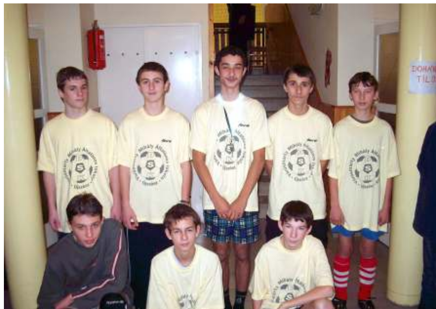
A kupagyőztes újszászi csapat

12. alkalommal rendezte meg hagyományos, karácsony második napi teremfoci tornáját, a Bejgli Kupát az újszászi Tornacsarnok. 12 csapat, közel száz játékos gondolta úgy, hogy az ünnepi sok evés-ivás után szüksége van a mozgásra.