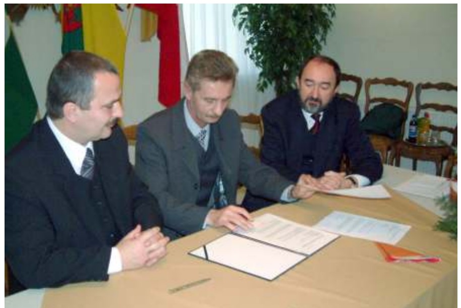
Újszász és Debica vezetői szándéknyilatkozatot írtak alá az együttműködésről

Debica település Önkormányzata Újszász város Önkormányzata