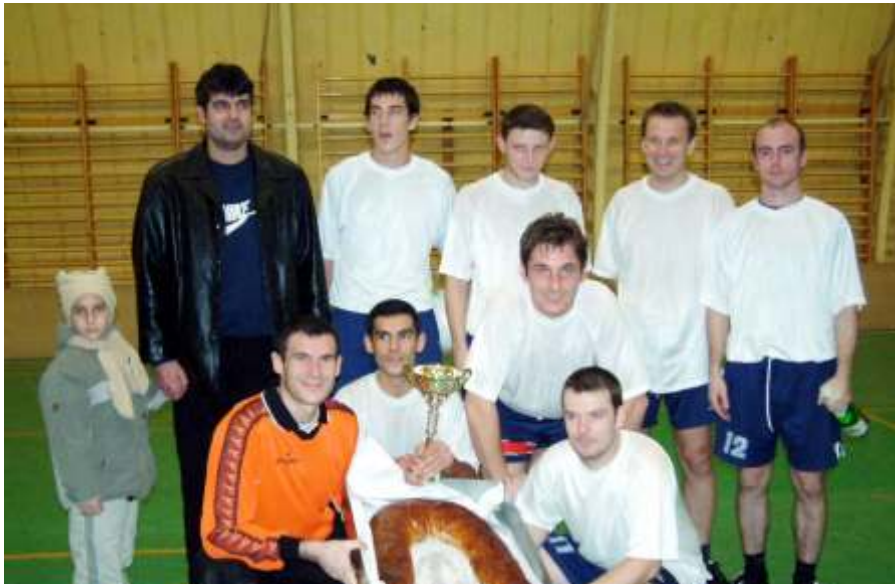
2003-ban ők nyerték a bejglit