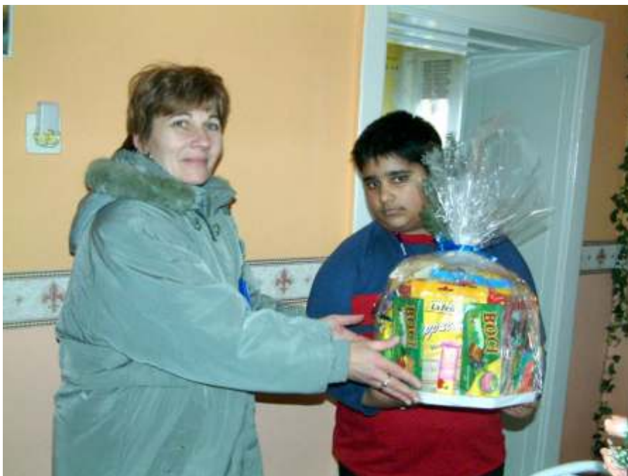
Karácsonyra sokan kaptak ajándékot az önkormányzattól

A környezetvédelem és a hulladékgazdálkodás témakörének további területeit is szabályozni kell a közeljövőben, részben EU-s követelmények értelmében (hulladékgazdálkodási terv). Ez alapján a következő rendeleteket kell megalkotni: