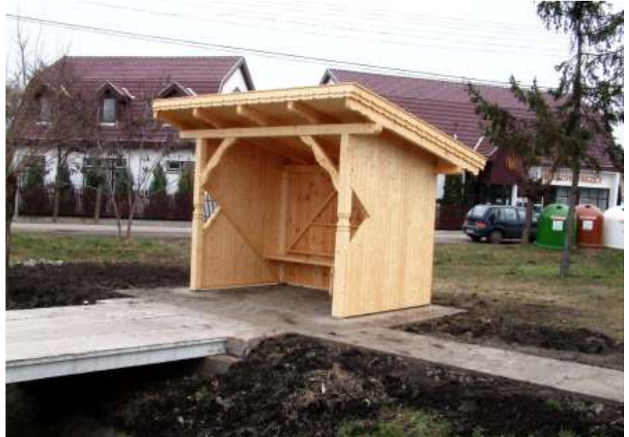
Decemberben buszmegállókkal gyarapodott a város

Újítás viszont, hogy ebben az évben felkerült az internetre azzal a céllal, hogy a friss híreket gyakrabban lehessen olvasni a városi honlapon. Sajnos ennek is van két hibája. Ahhoz, hogy a honlapra kerüljön, szintén rendszeresen foglalkozni kell vele. A másik, hogy még kevesen rendelkeznek otthoni internet hozzáféréssel. Igaz, a könyvtárban megtehetnék. Ehhez