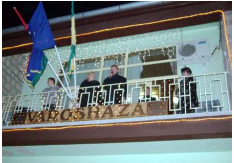
Bodog új évet Újszász minden lakójának!

megnyitóján vettem részt, december 10-én a Termál és Gyógyturizmus Egyesület ülésén, december 12-én a kétpói hulladéklerakó konzorciumi ülésén. Ugyenezen a napon délután országgyűlési képviselőnkkel, Botka Lajosnéval tartottunk közös fogadóórát városunkban.