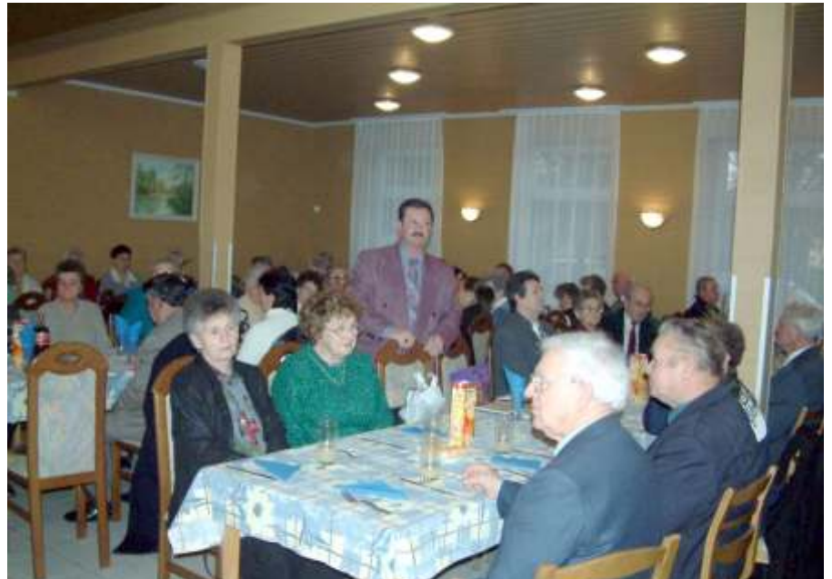
Ötödször karácsonyoztak együtt a sorstársak