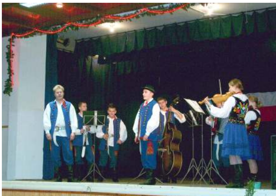
Lengyel vendégeink bemutatták népművészetüket