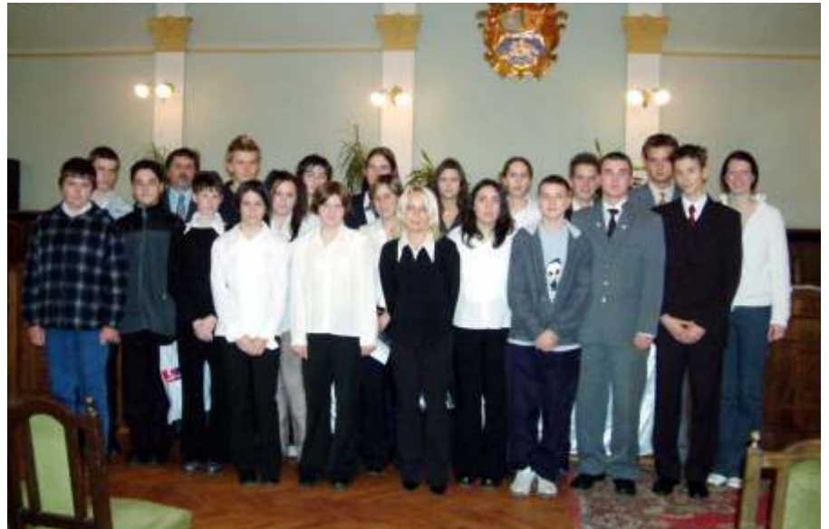
Diákolimpiai bajnokok a Megyeházán