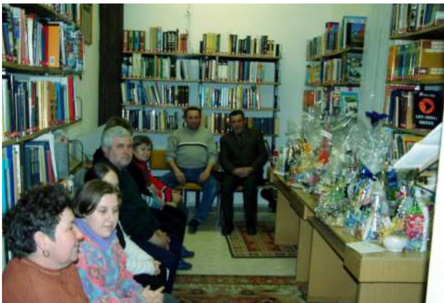
A sorsolás résztvevői

Az élesztőt a langyos tejbe morzsoljuk, 10 perc alatt felfuttatjuk. Ezután a többi hozzávalóval alaposan összedolgozzuk, dagasztjuk. (Legjobb, ha ezeket a műveleteket géppel végezzük. Ha nincs gépünk, egy fakanál is megteszi.) A kész tésztát egy nagy tálba töltjük, folpackkal letakarjuk, hűtőszekrénybe tesszük. Amikor sütni akarjuk, egy adagot kivesszünk belőle, tenyérnyi lángosokká formáljuk,