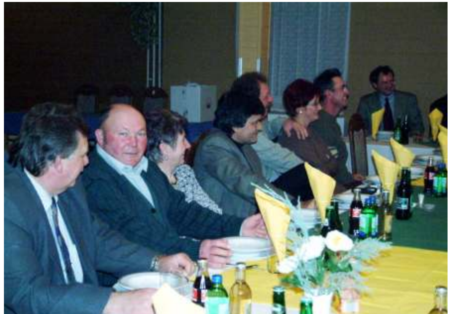
Az újszászi vállalkozók is vendégül látták a lengyel delegációt

Újra fontos téma volt a leendő piacarnak ügye, melynek felépítése a tervek szerint 2004. őszére várható. Minden bizonnyal már januárban megalakul a Piac-