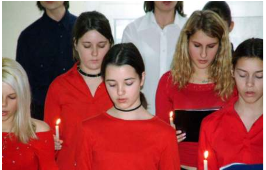
A műsort záró karácsonyi ének

Törekedtünk arra, hogy az iskola külsőségeiben is méltó helyszíne legyen az eseményeknek: karácsonyi hangulatot idéző dekoráció, az ügyes kezű, már-már művészi ihletettséget tükröző gyermekmunkák – rajzok, festmények, tűzzománc képek – mutatták be a gazdag iskolai élet értékes szeletét.