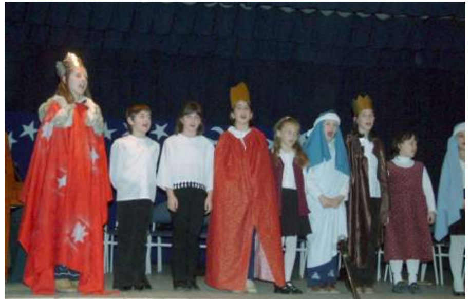
Az Ádám Jenő Művészeti Iskola növendékeinek karácsonyi műsora