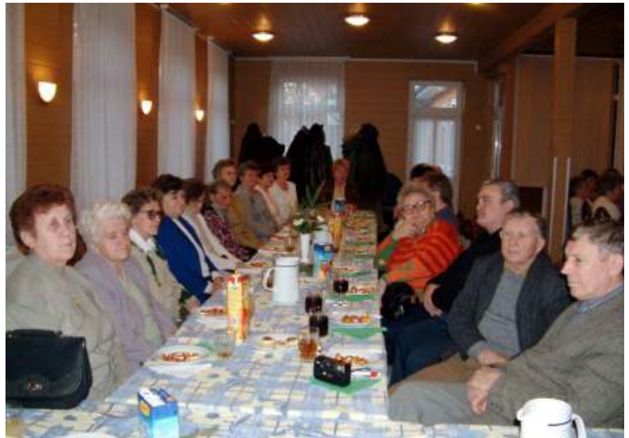
A nyugdíjas klub karácsonyi délutánján