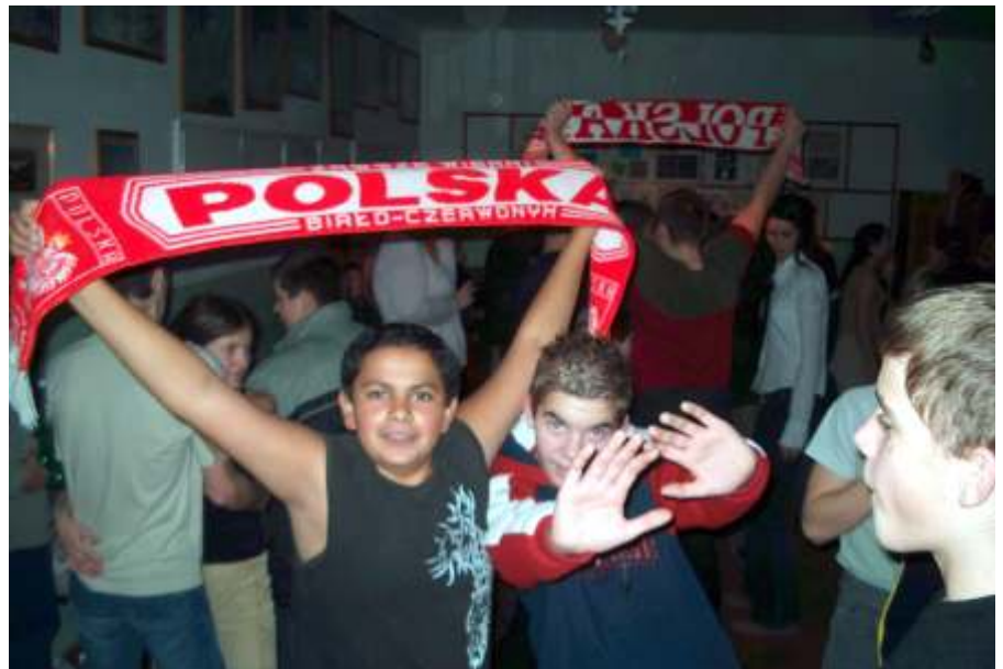
Barátkozás a diszkóban

dagógusok kreativitása, s a gyerekek iránti szeretete fűtötte.