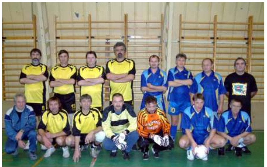
Loksi – Víg Bakter 5-11