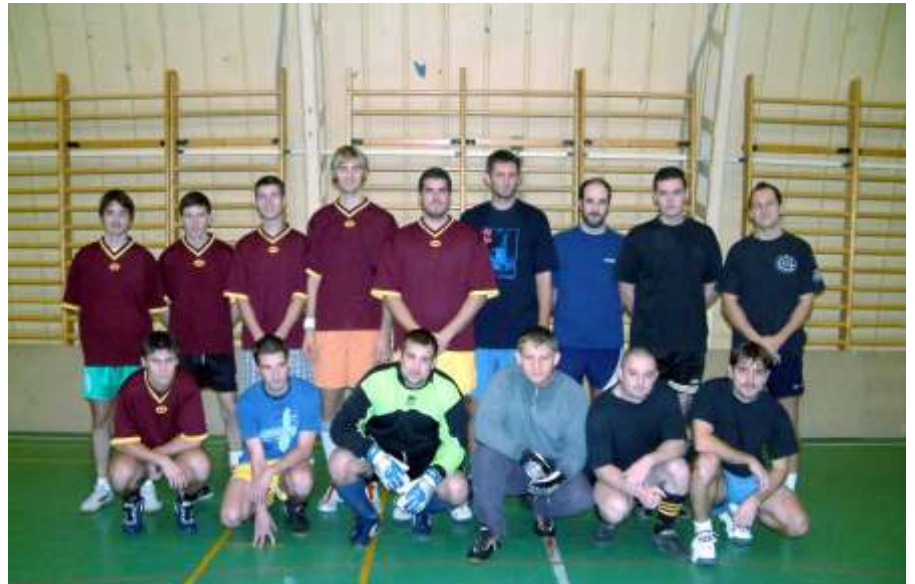
Porto – Jack Daniels