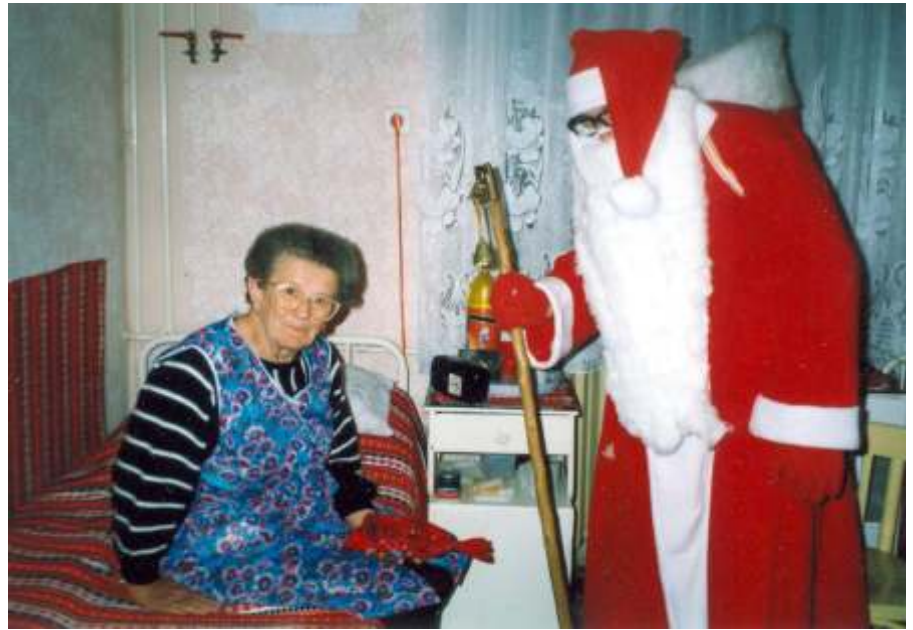
A Mikulás látogatóban a Szociális Otthonban