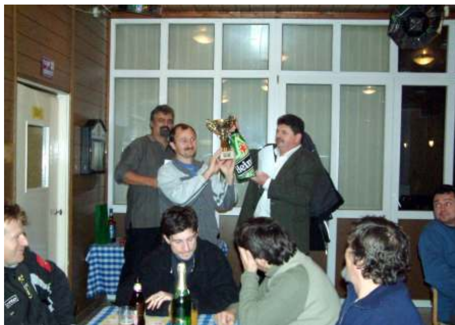
A Szász Kupa eredményhirdetése