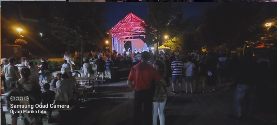
Samsung Quad Camera