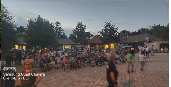
Samsung Quad Camera