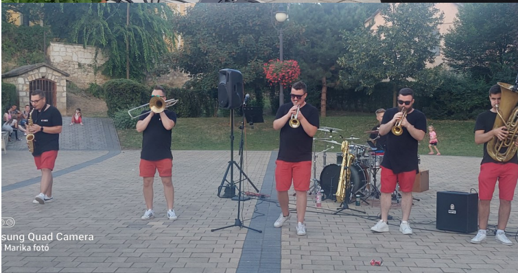
Samsung Quad Camera Marika foto