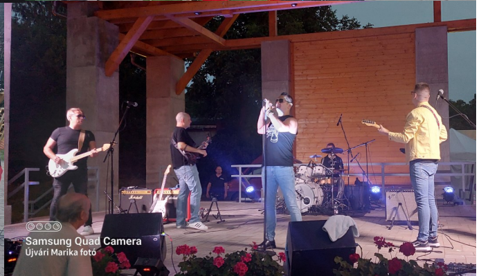
Samsung Quad Camera