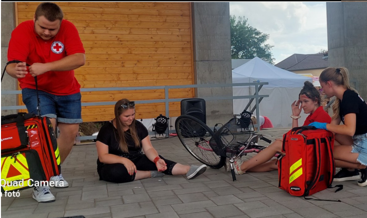
Quad Camera foto