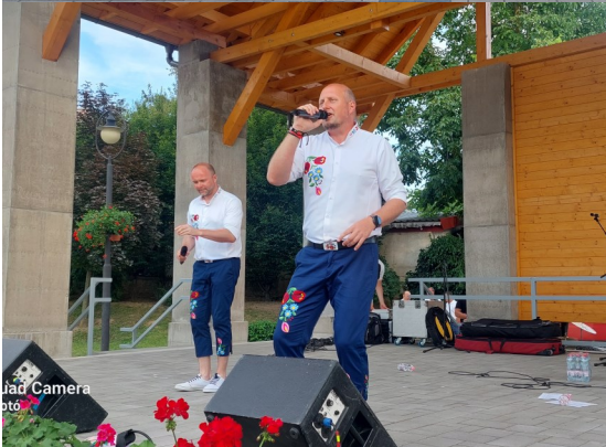
Quad Camera foto