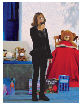
Mesemondó verseny (7. oldal)