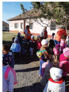
Óvodai hírek (5. oldal)