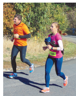
Október 6-i Csúcsfutás (8. oldal)