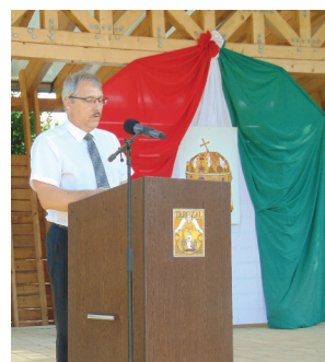
Augusztus 20-i ünnepség (4. oldal)