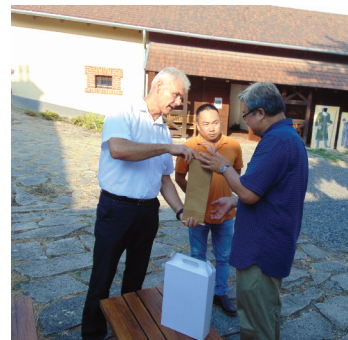
Nagyköveti szüret Tarcalon (2. oldal)