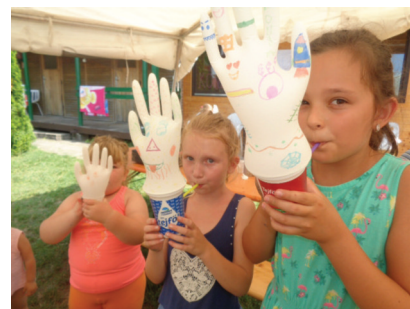
Vöröskeresztes tábor a Balatonon (3. oldal)