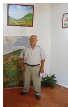
Kiállítás a Borfaluban (4. oldal)