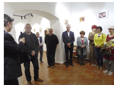
Fotókiállítás (3. oldal)