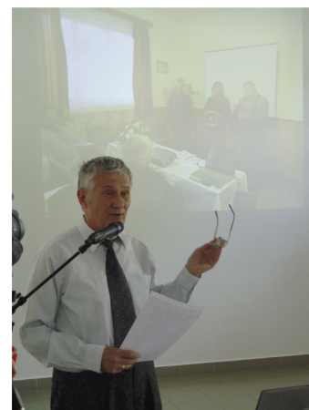
Házasság ünnepe (5. oldal)

Tarcal valamennyi édesanyjának boldog Anyák Napját és jó egészséget kívánunk!