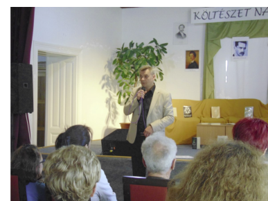
Költészet Napja (3. oldal)