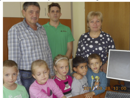
Az óvoda vezetősége