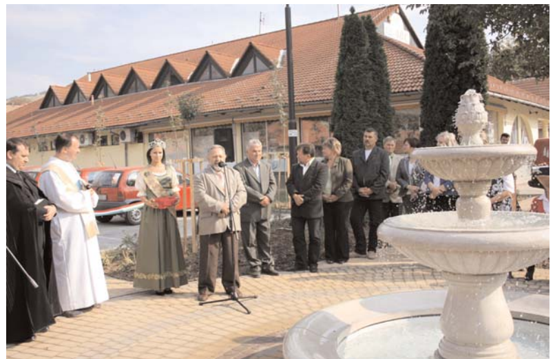
Felvételeink az avatási ünnepségen készültek