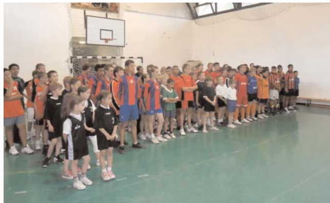
A verseny résztvevői

Labdarúgás 7-8.osztály 1.Tiszalúc, 2.Megyaszó, 3.Tarcal