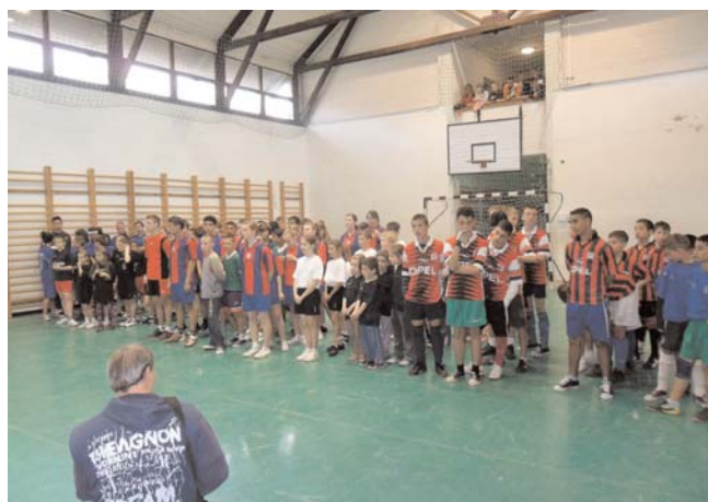
A fotó a sportversenyen készült

TÁMOP-3.2.11./10-1-2010-0042. számú projekt Szabadidős tevékenységek fejlesztése Tarcali