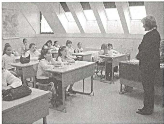
Verseny előtti pillanatok.