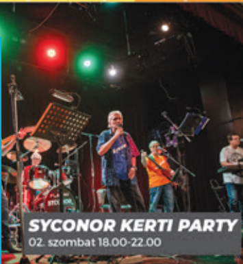
SYCONOR KERTI PARTY 02. szombat 18.00-22.00