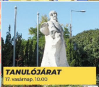
TANULÓJÁRAT 17. vasárnap, 10.00