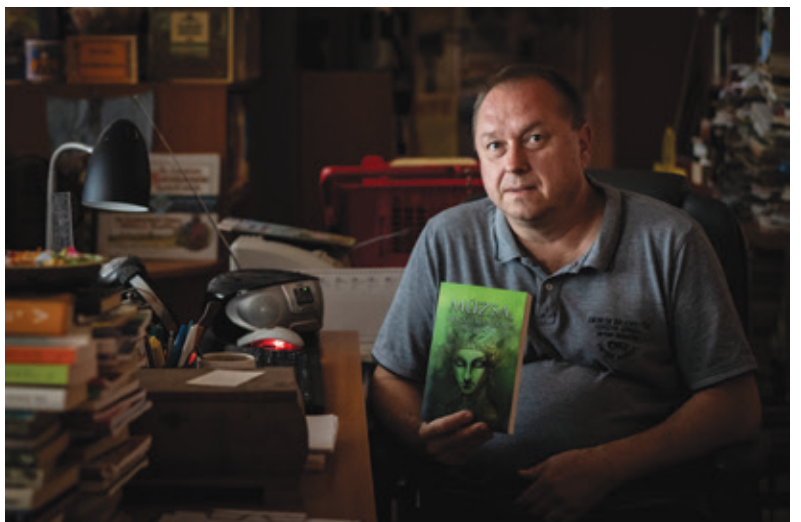
Fotó: Gordon Eszter

A zenész-író-pedagógus azonban már idén is jubilál. Pontosan harminc éve, 1993-ban kezdett el tanítani a kerületben. Először a Bogáncai Általános Iskolában, majd a Károly Róbert Szakközépiskolában, jelenleg pedig a Kontyfában. „Mindez úgy történt, hogy én egyszer sem váltottam munkahelyet, mindössze az intézmények fuzionáltak a fejem felett.”