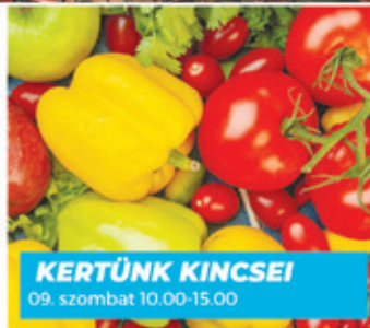
KERTÜNK KINCSEI 09. szombat 10.00-15.00