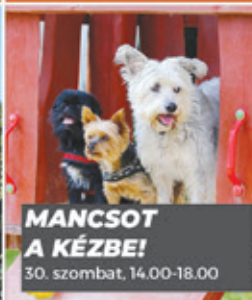
MANCSOT A KÉZBE! 30. szombat, 14.00-18.00