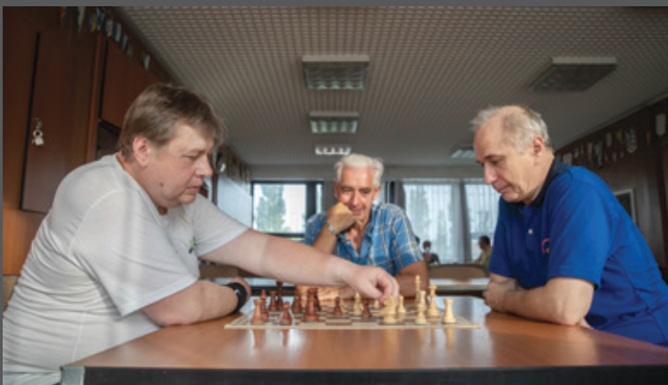
Fotó: Csokonai 15

A sakkozók bajnoksága október elején kezdődik, a végső sorrend pedig tavasz végére alakul ki.