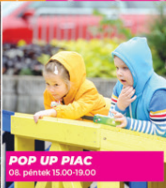
POP UP PIAC 08. péntek 15.00-19.00